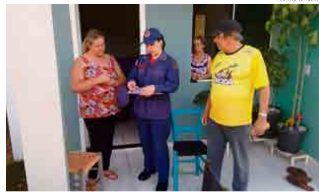
Bombeiros visitam residências e orientam moradores em Maravilha

Conforme o tenente, a incidência de incêndios na região de Maravilha é em média de