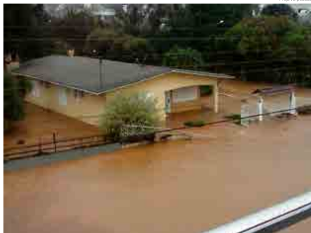
Casa antiga ficou tomada pela água

de suas casas, frisando que algo precisa ser feito a respeito, com urgência, pois isso pode voltar a acontecer a qualquer momento. “Pensamos em nossos vizinhos, em todos que passaram por essa tragédia, que perderam seus bens, documentos, entre outros, esse problema precisa ser solucionado”, finaliza o casal.