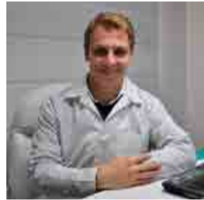
Profissional vai ficar na Arena Futuro, na região da Barra

Ele se candidatou há mais de dois anos após divulgação pelo Comitê Olímpico Internacional e o Conselho Regional. "Como a Olimpíada e a Paralimpíada são