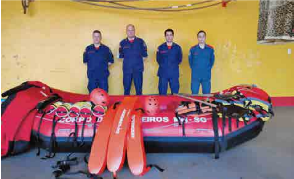
Equipamentos foram adquiridos para agilizar e melhorar resposta em catástrofes

Como resposta rápida em caso de suspeita de eventos adversos, como enchentes, agora