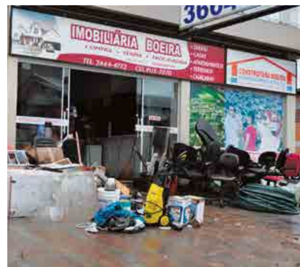
Móveis foram levados para fora da empresa para lavar

Além do estudo sobre o Rio Iracema, a prefeitura tem em mãos uma análise dos oito afluentes, rios ou cursos de água menores. Conforme Dummer, somente a mudança principal não vai ajudar. “Por já estar dentro da cidade, muitos trechos já passando por baixo de edificações”, afirma. O estudo dos afluentes gerou outro orçamento: R$ 5.340.754.