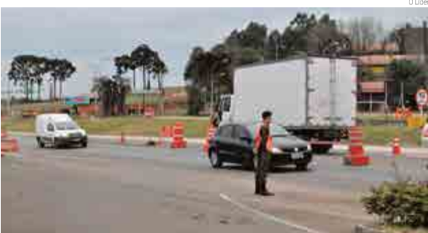
Soldados pararam motoristas e aplicaram questionário

A Operação Controle de Tráfego terminou ontem (8) e foi desenvolvida durante uma semana nas bases da Polícia Rodoviária Federal, nas BRs-282 e 163. A ação foi deflagrada pelo Ministério dos Transportes e DNIT, com auxílio de soldados do Exército. Mesmo não sendo o objetivo principal, foram flagrados motoristas embriagados e veículos com irregularidades. De acordo com o comandante do 14º Regimento de Cavalaria Mecanizada, tenente-co-