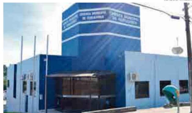
Pesquisa mostrou redução nos custos nos últimos cinco anos em 6,9%

Uma pesquisa do Observatório Social de São José (PSSJ), em 2014, apontou que a Câmara de Vereadores de Maravilha está na posição 30 das que menos gera despesas, dos 295 municípios do Estado. Além disso, a pesquisa mostrou que a Casa diminuiu os custos nos últimos cinco anos em 6,9%. "Trabalhamos com uma Casa enxuta e, além disso, os vereadores sempre vão em busca de