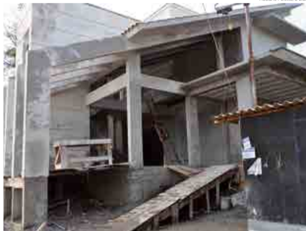
Altura da base foi alterada de 0,60 para 1,60 metro