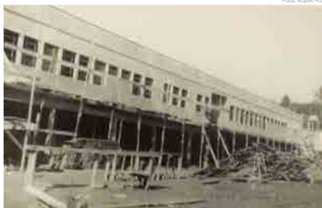
Construção em alvenaria