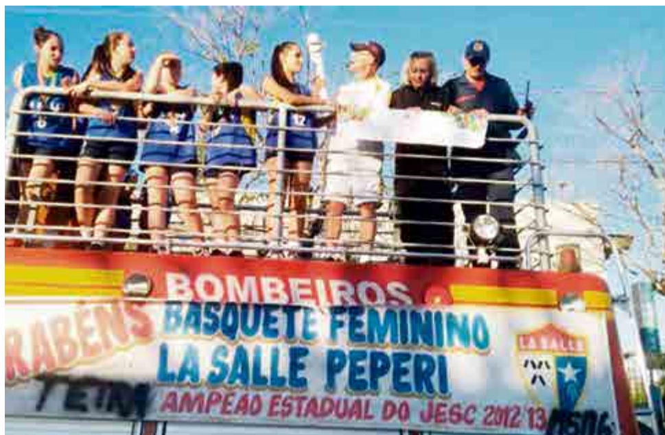
Equipe feminina do basquete de São Miguel do Oeste, do Colégio La Salle Peperi/Abasmo/Fumdesmo, sagrou-se campeã estadual dos Jesc – 12 a 14 anos