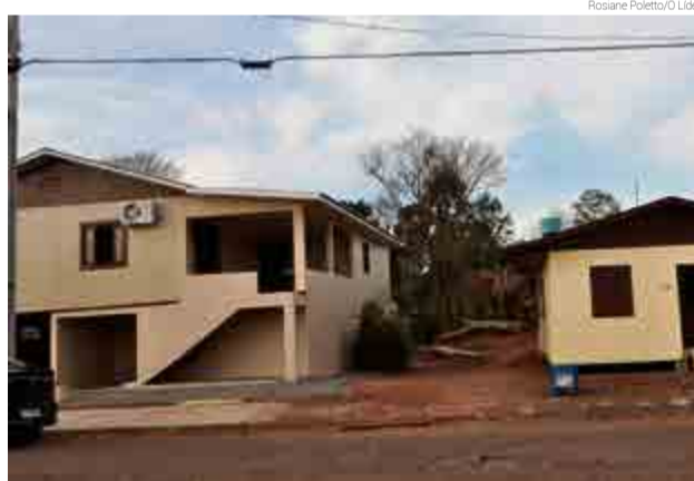
Porão foi construído para elevar a casa