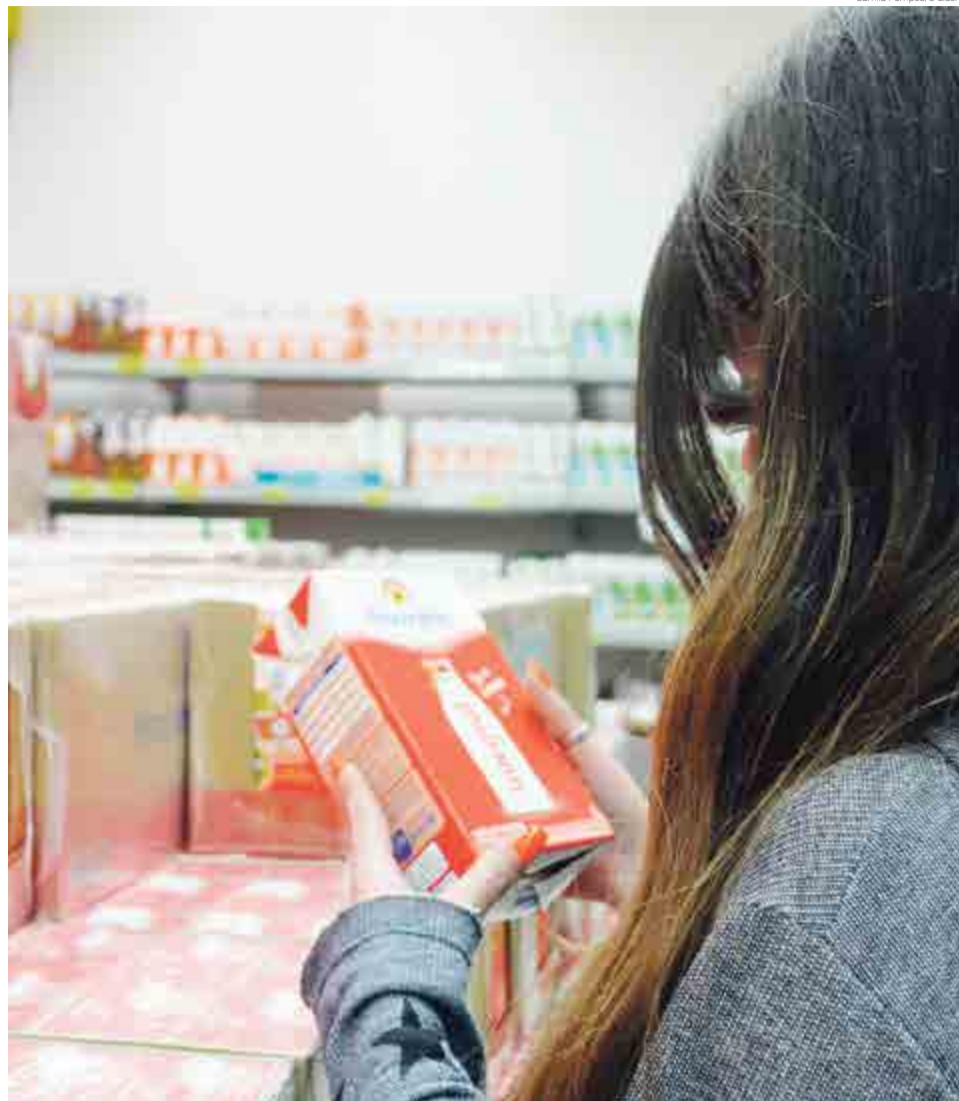
Consumidores estão cautelosos na hora de comprar o produto