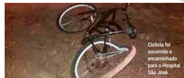
Ciclista foi socorrido e encaminhado para o Hospital São José

Maravilha. Segundo a direção do hospital, o homem está internado em um quarto da unidade.