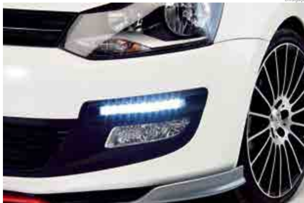
O DRL ou farol de rodagem diurna é um dispositivo de iluminação automotiva posicionado na frente do veículo

Na Alemanha, desde fevereiro de 2011, todos os carros novos tiveram que ser equipados com faróis de rodagem diurna. E desde agosto de 2012 essa norma se estende a todos os veículos comerciais novos.