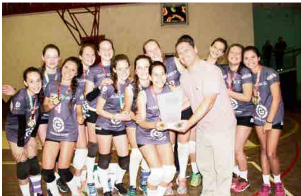
Integrantes da Escola Estadual Sara Castelhana Kleinkauf, de Guaraciaba, comemoram o título no voleibol