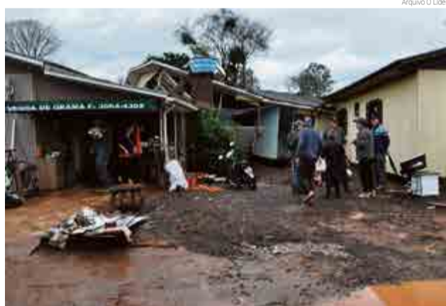
Outra residência que foi modificada fica próximo ao Iguatemi Alimentos