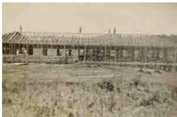
Primeira construção, em madeira

Além da celebração, está em circulação uma ação entre amigos, que objetiva arrecadar fundos para pagar parte de um aparelho de tomografia, que será sorteada ao vivo, por meio de bingo, no dia 3 de setembro, durante almoço que será realizado na data.