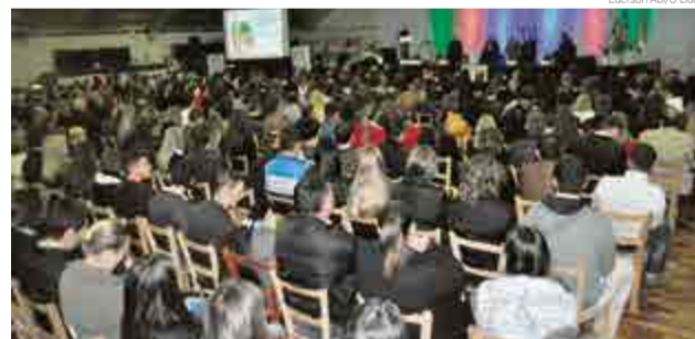
Debate foi realizado no Salão Paroquial, com mais de 500 pessoas

Com o objetivo de divulgar o cooperativismo e compartilhar experiências e ações, a Cooperativa Central Aurora Alimentos unidade de Maravilha, a Auriverde, a Ceraçá, o Sicoob e o Sicred promovem a “Segunda mesa dos presidentes de cooperativas”. O encontro foi na noite de quarta-feira (6), no Salão Paroquial de Ma-