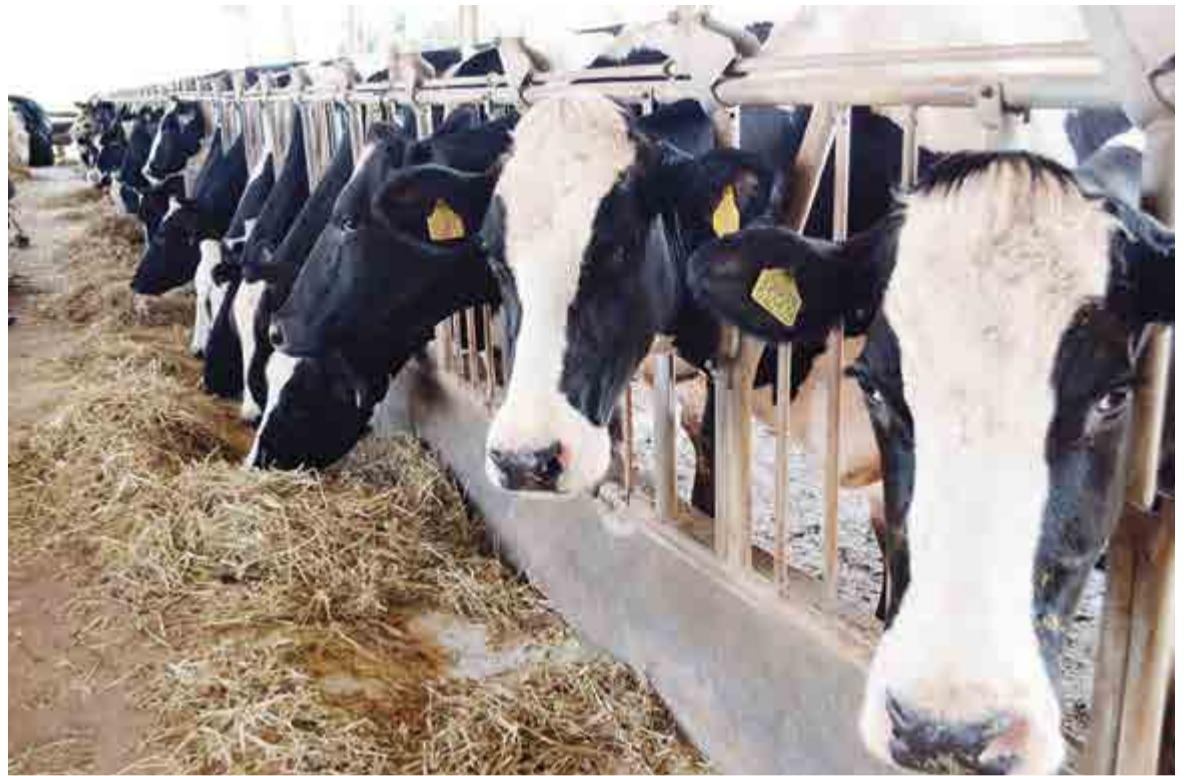
Custo de produção do leite nas propriedades rurais vem aumentando