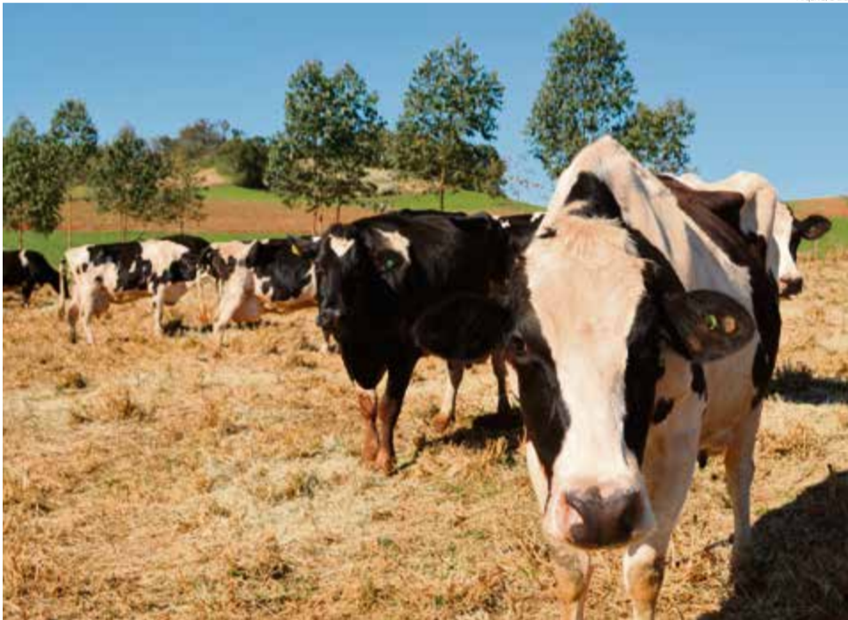
Santa Catarina é o único Estado do país com status de área livre de febre aftosa sem vacinação

possibilidade de transporte de animais susceptíveis à febre aftosa entre os esta-