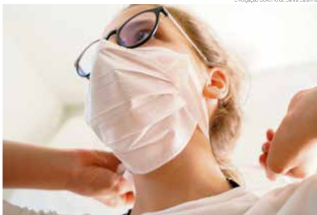
Autoridades de saúde pedem que a população dê continuidade aos cuidados para evitar contaminações

Os casos ativos de covid-19 em Maravilha continuam em queda, fechando em 17 contabilizados pelo município até a sexta-feira (24). A redução é de 45% num comparativo com a semana anterior. O município soma 259 casos confirmados da doença, com 242 recuperados e dois internados. Mais de 240 pacientes são