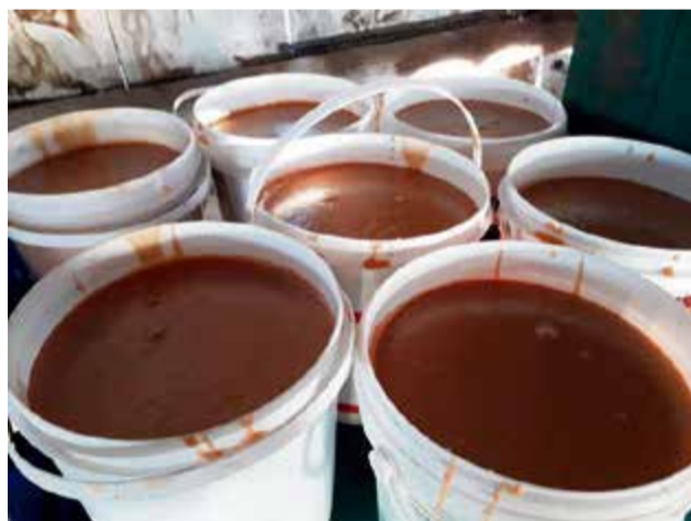
Após 5 horas de trabalho, melado está pronto para o consumo