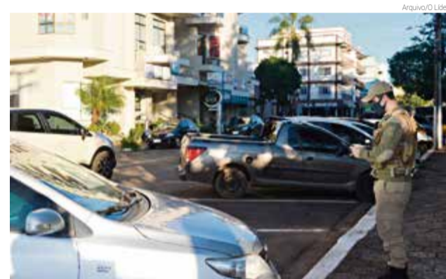
Suporte tecnológico contribui com a realização dos trabalhos