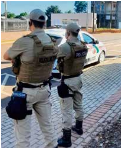
Municípios podem perceber a presença constante dos policiais nas ruas

res, éticos e morais para formação do cidadão.