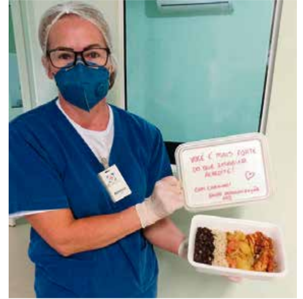
Pacientes também receberam mensagens especiais nas embalagens de alimentos