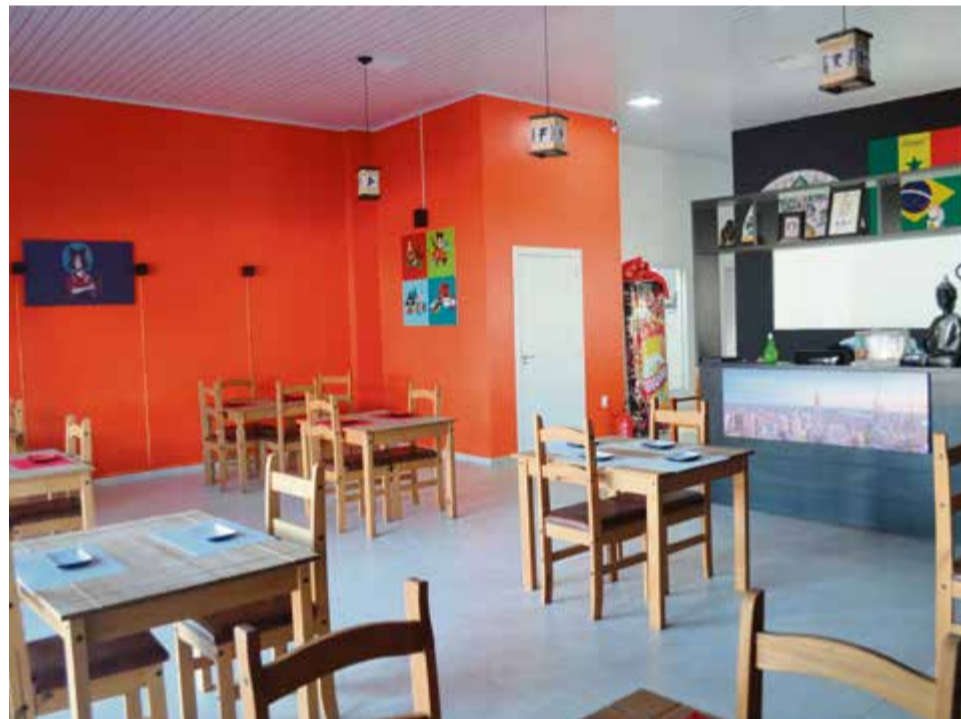
Local conta com espaço amplo e confortável para receber os clientes