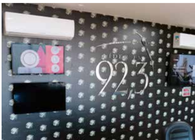
Painel no estúdio possibilita acompanhamento de fatos em todo o Brasil

A novidade vai além de um novo espaço. Mudanças significativas na comunicação da Rádio Líder, buscando sempre a aproximação com os moradores e a prestação de serviço para a comunidade,