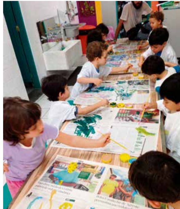
Medida objetiva evitar a circulação dos alunos

A decisão de manter a suspensão das aulas presenciais em todo o Estado evita a circulação de mais de 1 milhão de pessoas. Conforme a ferramenta de gestão elaborada pela Secretaria de Estado da Educação (SED) com base no Censo Escolar 2019 do Inep,