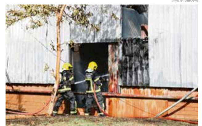
Corpo de Bombeiros fez o combate às chamas e localizou o corpo de homem carbonizado

Quando os bombeiros chegaram ao local o incêndio estava consumindo a fábrica e poderia se alastrar para os galpões ao lado. Rapidamente, a equipe iniciou o combate às chamas, que durou quase duas horas.