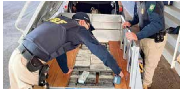
Droga estava escondida no fundo da carretinha levada pelo veículo

conduzido à Delegacia de Polícia de São Miguel do Oeste. De acordo com a PRF, a droga totaliza R$ 1,3 milhão e deixou de cair nas mãos do crime organizado.