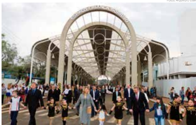
Legenda-Após abertura do desfile de 7 de Setembro, caminhada partiu da Área Coberta

O investimento da obra foi de R$ 1.751.793,49, sendo R$ 975 mil do Ministério do Turismo e R$ 776.793,49 de con-