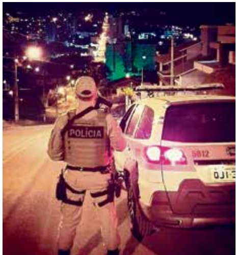
Policiais desenvolvem diversas ações de repressão ao crime

No âmbito da prevenção também são desenvolvidas muitas atividades e um dos destaques é o Programa Educacional de Resistência às Drogas e à Violência. O Proerd já completou 20 anos de atuação no âmbito da 3ª CIA, formando e capacitando aproximadamente 17.900 crianças, fortalecendo e mantendo sempre presentes os valores familia-