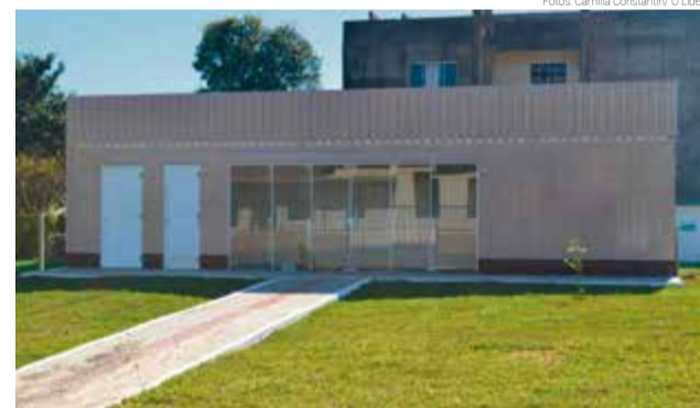
Nova Base está sendo instalada no Bairro Bela Vista