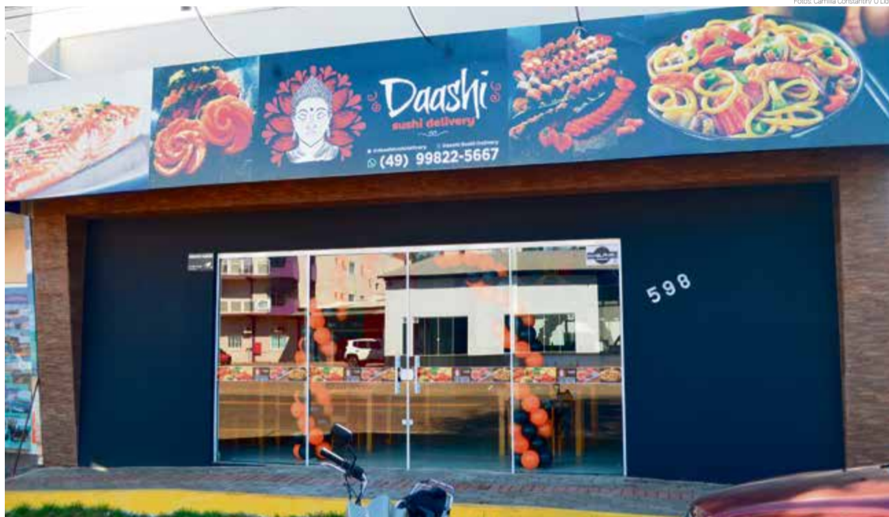
Daashi Sushi fica localizado na Avenida Anita Garibaldi

Niang agradece os clientes e convida a todos para conferir como ficou o novo espaço. "O local oferece cardápio com várias opções para quem é amante da culinária japonesa. Para quem nunca provou, é uma oportunidade de ter novas experiências gastronômicas", destaca.