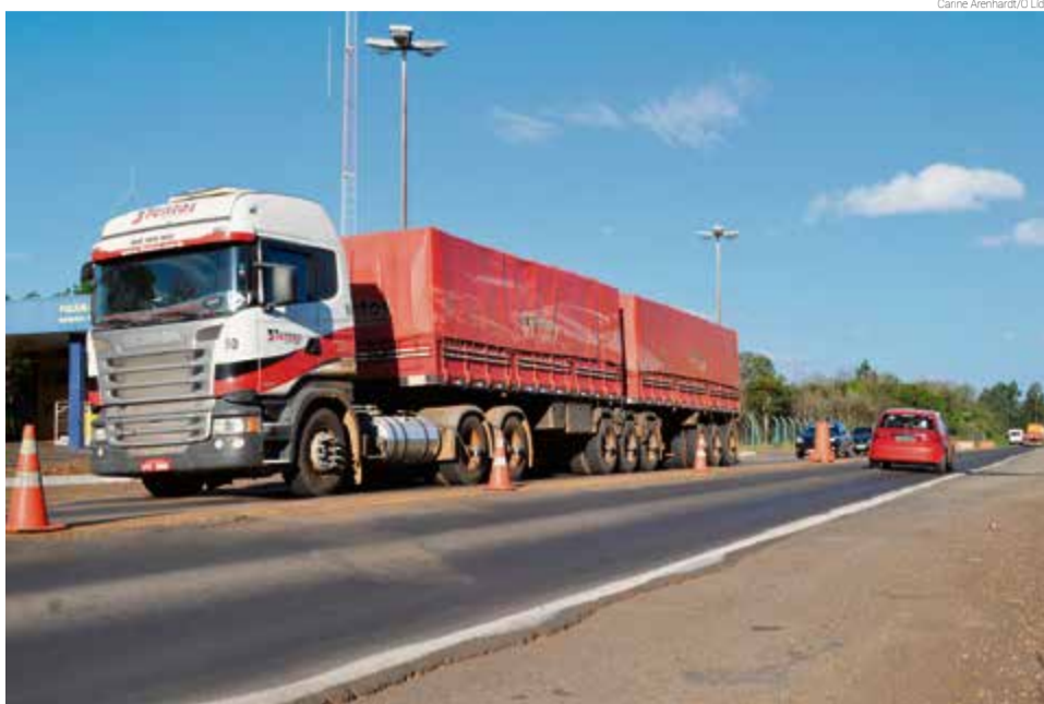
Setor de transporte de cargas sentiu a queda no volume de fretes

Um levantamento divulgado em junho pela FreteBras, a maior plataforma on-line de transporte de cargas da América do Sul, apon-