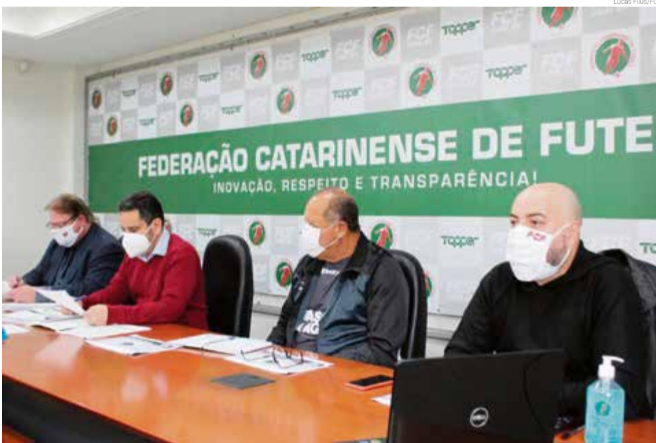
Reunião definiu a agenda do campeonato

O campeonato terá duas fases, a primeira com os dez clubes jogando todos entre si, em sistema de turno único, classificando-se para a final