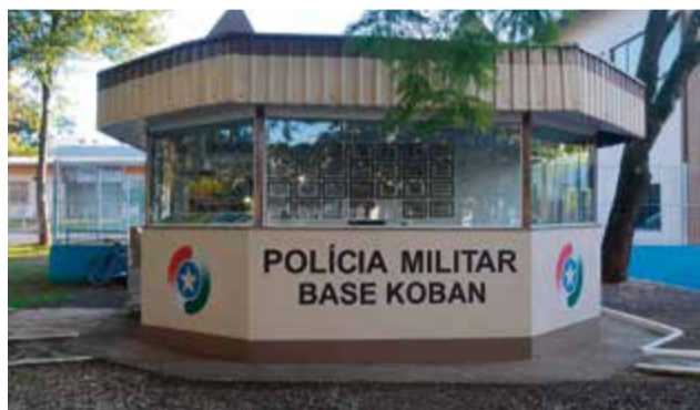
Base Policial Koban foi inaugurada há três anos

aproximação cada vez maior da Polícia Militar com a sociedade, possibilitando identificar e compreender a dinâmica das dificuldades locais e assim atuar estrategicamente para a resolução dos problemas de ordem pública existentes, contribuindo com sua principal missão: proteger a comunidade e seus cidadãos.