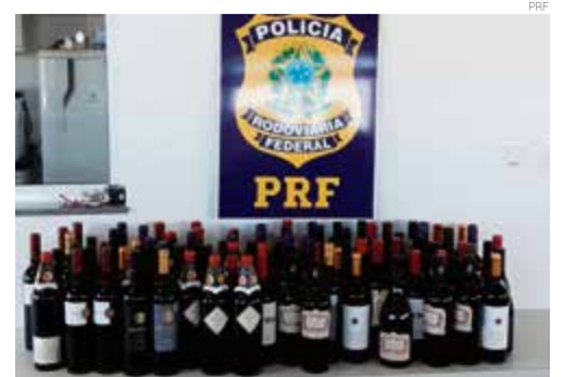
Homem mentiu afirmando que levava sabonete líquido, mas vinhos estavam escondidos

Um homem foi flagrado com vinho irregular nesta semana na BR-163, em Guaraciaba. Foi mais uma apreensão de carregamento de vinho ilegal da Argentina. Os policiais rodoviários federais abordaram um caminhão, placas de São Miguel do Oeste, que transportava sabonete líquido. Porém, no meio da carga os policiais localizaram o carregamento de vinho. O motorista foi notificado e o vinho apreendido.