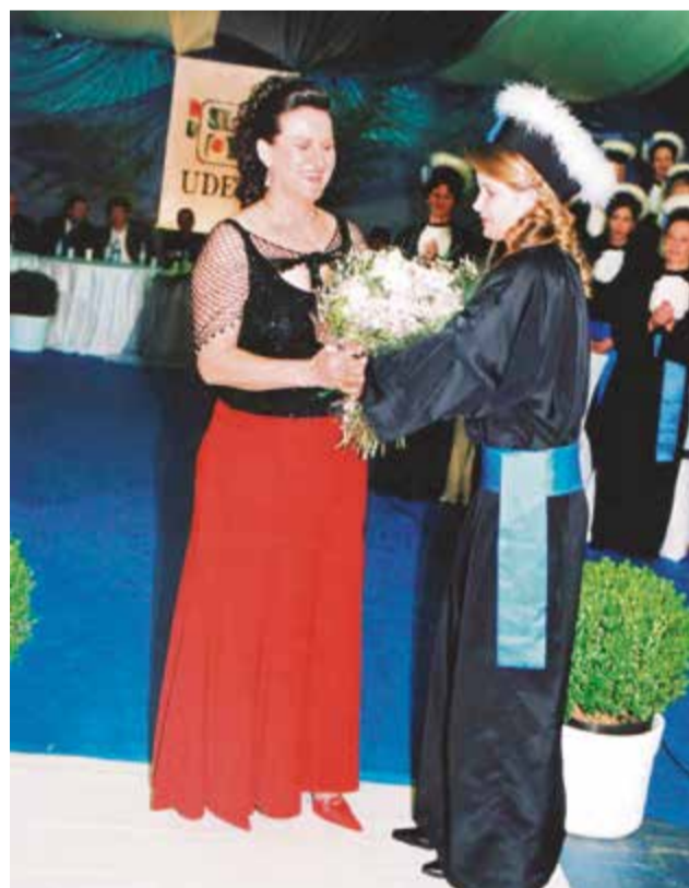
Ela foi paraninfa das turmas na formatura do curso de pedagogia da Udesc em 2004