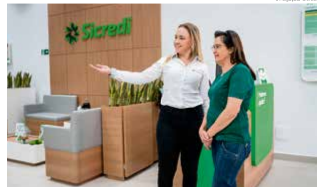
No primeiro semestre, cooperativa teve crescimento de aproximadamente mil associados por mês

nos enche de orgulho e alegria, pois representa a credibilidade, a confiança e o reconhecimento que a sociedade deposita na cooperativa. Esta credibilidade se reflete pelo trabalho sério, sempre alicerçado nos princípios do cooperativismo e valores do Sistema Sicredi. Ao longo destes 39 anos, a eficácia e transparência na gestão, alinhada com o interesse genuíno pelos associados e as comunidades, foram os direcionadores determinantes para o crescimento do Sicredi Alto Uruguai RS/SC/MG. Queremos comemorar esta conquista