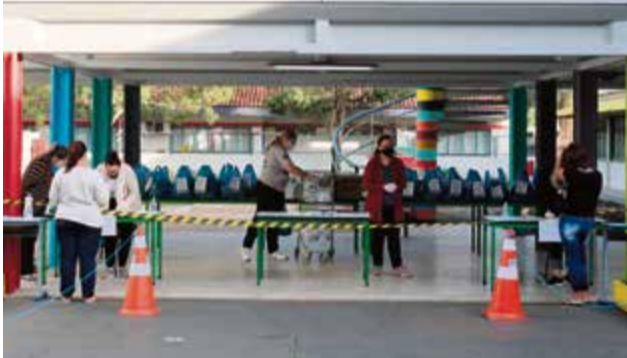
Para evitar a contaminação do coronavírus, kits foram entregues ao ar livre