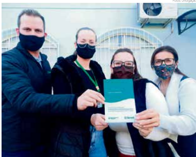
Recurso será utilizado na compra de brinquedos de polietileno pigmentado para área externa da instituição

Conforme a equipe do CEI, a ideia foi contemplar os alunos do maternal ao pré-escolar com um parque ao ar livre. “Com o dinheiro faremos a compra