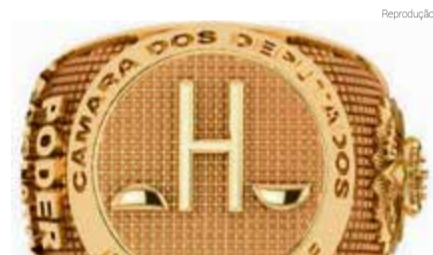
Reprodução Modelo de anel banhado a ouro distribuído pelo Capitão Augusto

Candidato à presidência da Câmara e presidente da bancada da bala, o deputado Capitão Augusto (PL-SP) está distribuindo dois modelos de anéis aos colegas, um banhado a ouro e outro de prata. O parlamentar diz que teve a ideia de entregar os presentes quando foi "muito elogiado" ao desfilar pelo plenário com o adereço dourado, que carrega a inscrição "Poder Legislativo" e o desenho arquitetônico do Congresso Nacional.