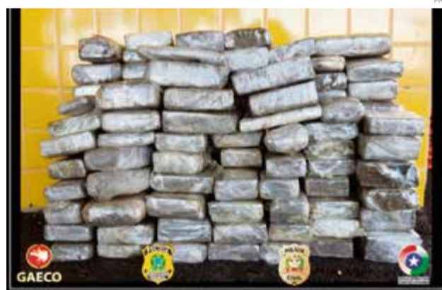
Droga estava escondida em um veículo Jeep alugado em Belo Horizonte

Segundo as investigações, o destino provável da maconha seria o Rio Grande do Sul. Os dois envolvidos foram encaminhados para a Delegacia de Polícia de Maravilha, onde vão responder por tráfico de drogas.