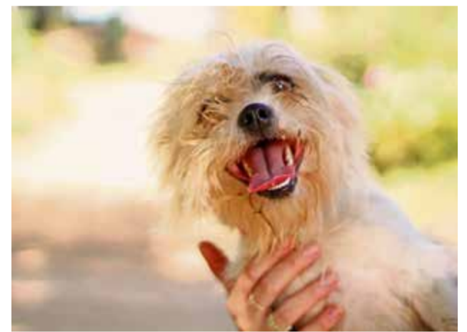
Entidade pede mais conscientização à comunidade

Os integrantes esperam que no futuro mais pessoas se conscientizem com a causa. "Esperamos que mais denúncias sejam feitas para os órgãos competentes. Esperamos também que esse crime tenha punições mais rígidas em nossa cidade e que o projeto de castração continue", declaram.