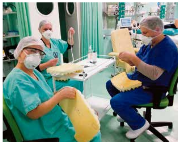
Treinamento foi para profissionais da UTI

volver lesões por pressão. "Estamos sempre trabalhando essa cultura de segurança do paciente entre nossos profissionais. Diariamente a equipe também presta orientações de educação aos nossos pacientes, familiares e cuidadores no engajamento das ações de prevenção de lesão que vão além da hospitalização", ressalta.