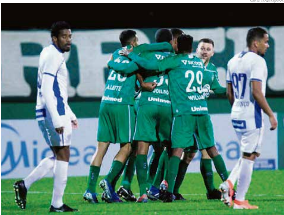
Jogo entre Chapecoense e Avaí vai ser na quarta-feira (29)

Os jogos de volta das quartas de final começam na terça-feira (28), às 18h30 entre Marcílio Dias x Criciúma, em Itajaí. No mesmo dia, às 20h se enfrentam Figueirense x Juventus, em Florianópolis. Na quarta-feira (29), às 19h tem jogo em Brusque x