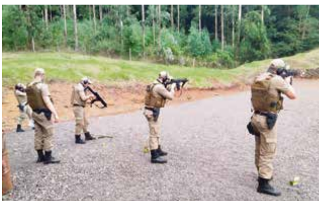
Profissionais participam de treinamentos

venção, além das atividades em escolas, os policiais militares desenvolvem ações no intuito de conhecer a realidade dos bairros (Rede de Vizi-