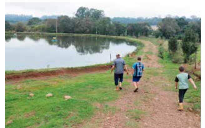
Família possui três açudes, sendo dois novos para a criação de tilápias e carpas

ção foi ampliada com mais dois açudes grandes, com área de tanques de 30 mil metros quadrados. Foram cerca de R$ 300 mil para deixar a propriedade como está hoje para a produção de peixes. Com isso, a produção deve aumentar em 30%, elevando para 40 toneladas de peixe.