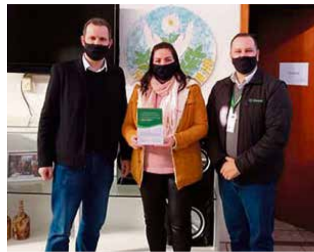
Apae Marisol e Copamar também foram contemplados com recursos

(Copamar). O projeto da entidade solicitou recurso para a aquisição de câmeras de segurança. Com o valor aprovado, a Copamar fará a compra dos eletrônicos que serão instalados para auxiliar na segurança de integrantes e patrimônios.