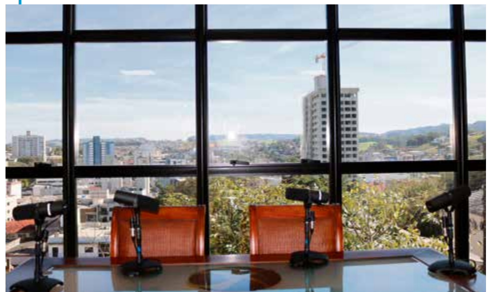
Estúdio panorâmico possibilita vista de cima da cidade de Maravilha

comunidade, além de amplo espaço para debates e participação de convidados. Um dos diferenciais do novo estúdio é a vista para o centro da cidade de Maravilha. Edificado com vista panorâmica, os convidados poderão observar a cidade com olhar privilegiado.