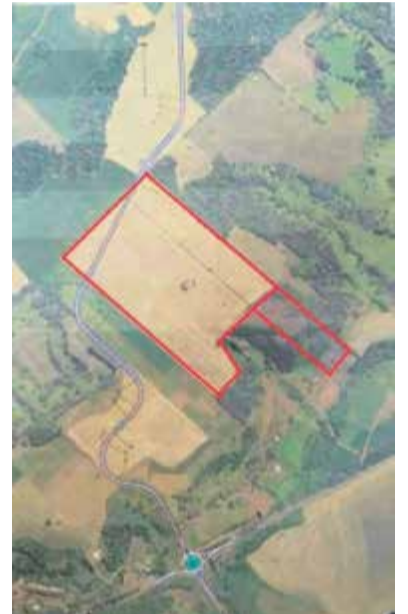
Área de terra adquirida pela prefeitura na Linha Barra do Segredo

do do Paraná e a tendência é que novas empresas se instalem naquela região também.