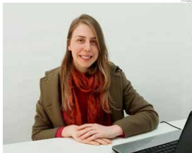
Nutricionista reforça que o melado contém altos valores nutritivos

importante para os ossos. O melado contém todos esses nutrientes em maior quantidade se comprado aos outros tipos de açúcares. Assim, ele se caracteriza como um adoçante natural muito saudável", salienta.