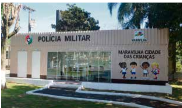
Base Policial Comunitária fica localizada na Praça Cidade das Crianças