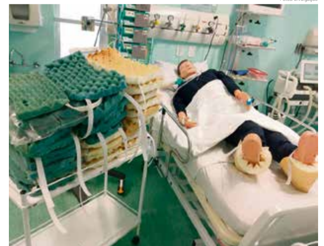
Demonstração de uso dos aliviadores em pacientes