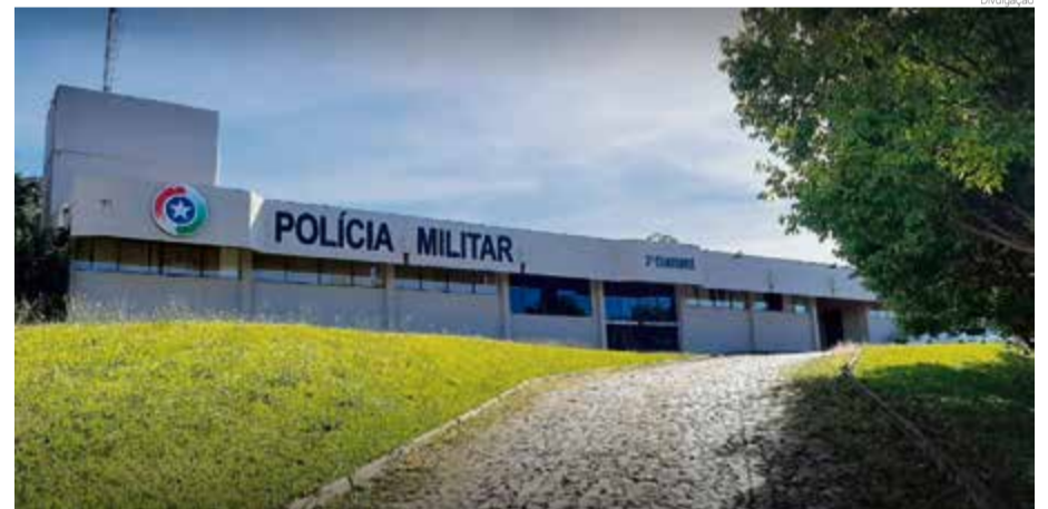
Companhia está localizada na Rua Hercílio Luz

Em maio de 2016 uma nova conquista foi alcançada: o então 3º Pelotão de Polícia Militar foi transformado na 3ª Companhia de Polícia Militar de Fronteira de Maravilha, trazendo novas projeções para a segurança pública local e maior