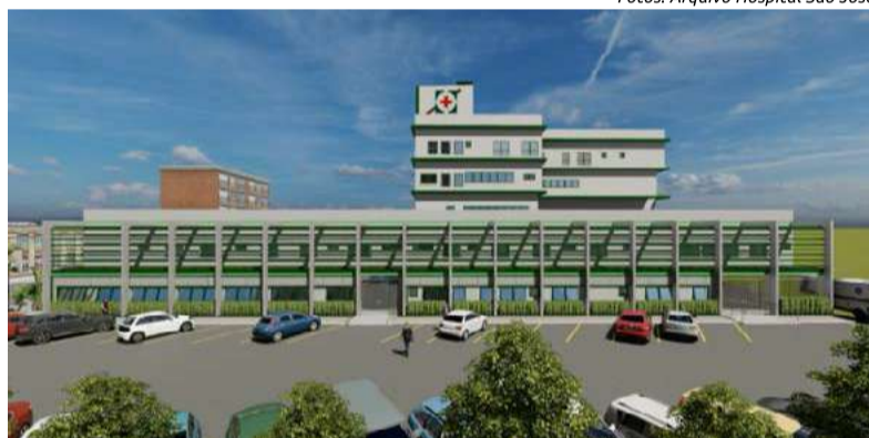
Projeto de ampliação e nova estrutura