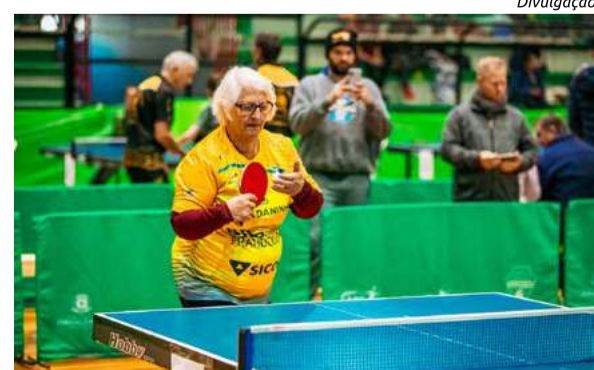
Atleta da categoria veterano

colinha da Secretaria de Esportes, Juventude e Lazer de Maravilha e também da parceria com o Serviço de Convivência e Fortalecimento de Vínculos.