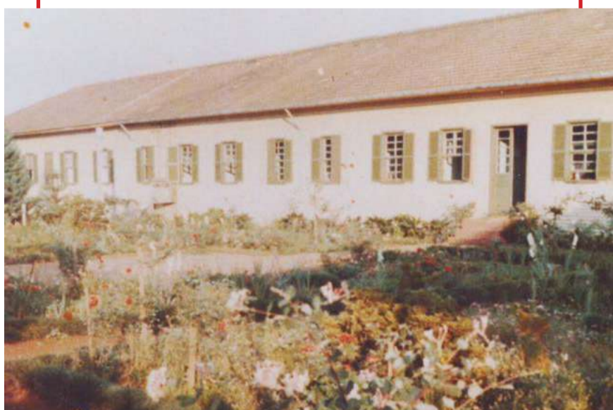
Primeira estrutura do Hospital

O hospital se destaca em projetos do grupo de trabalho de humanização, se torna referência a nível local, regional e estadual em urgência e emergência. Visa auxiliar na reabilitação, acolhimento e segurança no atendimento humanizado aos pacientes. Atualmente, a entidade conta com uma área de 5400 m 2 e 81 leitos de internação. Distribuídos nas áreas da clínica médica obstetrícia, pediatria e cirúrgica. Conta com 10 leitos de UTI e salas de observação. Hoje em dia a associação conta com mais de 900 associados, que contribuem para o avanço e desenvolvimento da entidade.