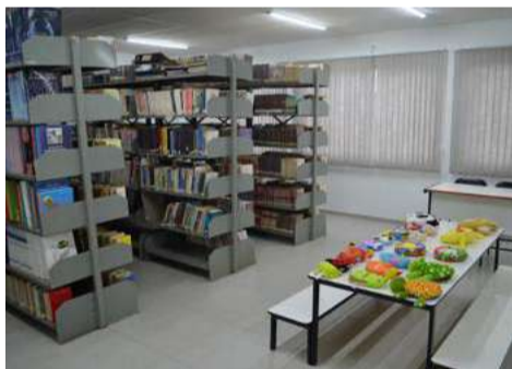
Biblioteca fica no primeiro andar

A estrutura de dois pavimentos é ampla e confortável, somando 1.046 metros quadrados. O local conta com espaço para a biblioteca, Banda Marcial, ala administrativa, salas para as oficinas, sala de dança, banheiros, além de um auditório para 246 pessoas.