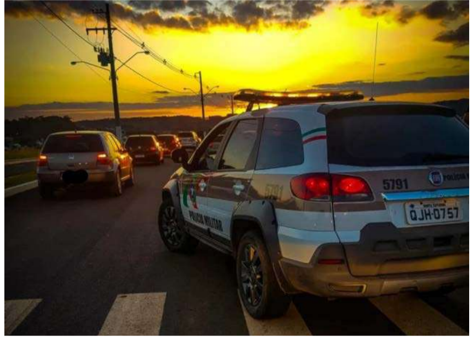
Foram registradas em média 330 ocorrências por mês