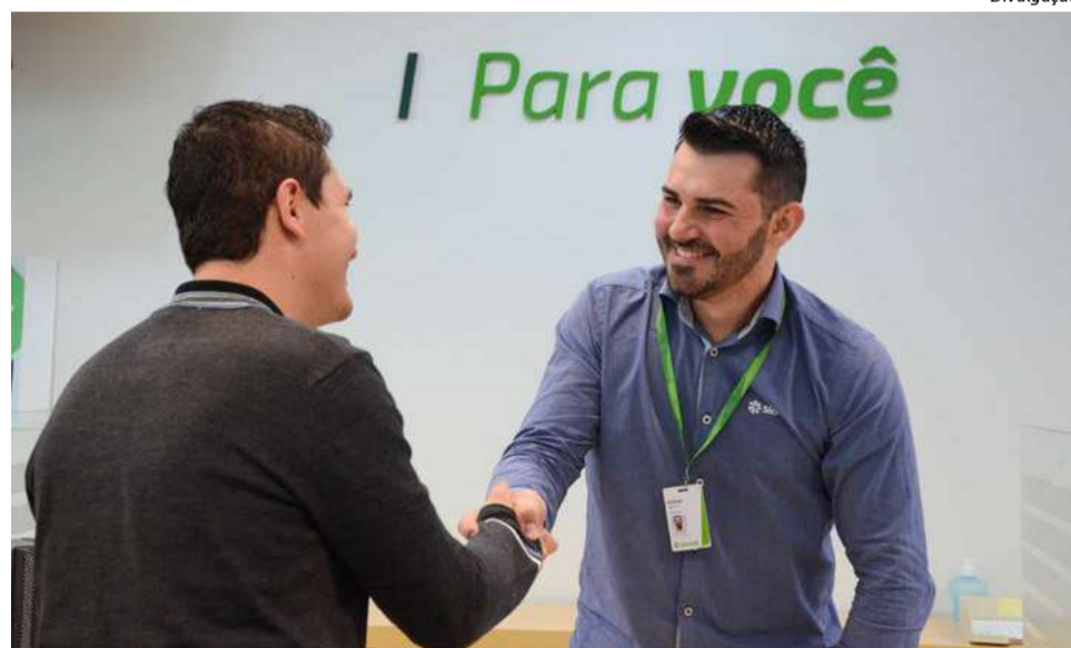
O maior aumento foi no número de Pessoas Físicas, com 933 mil novos associados