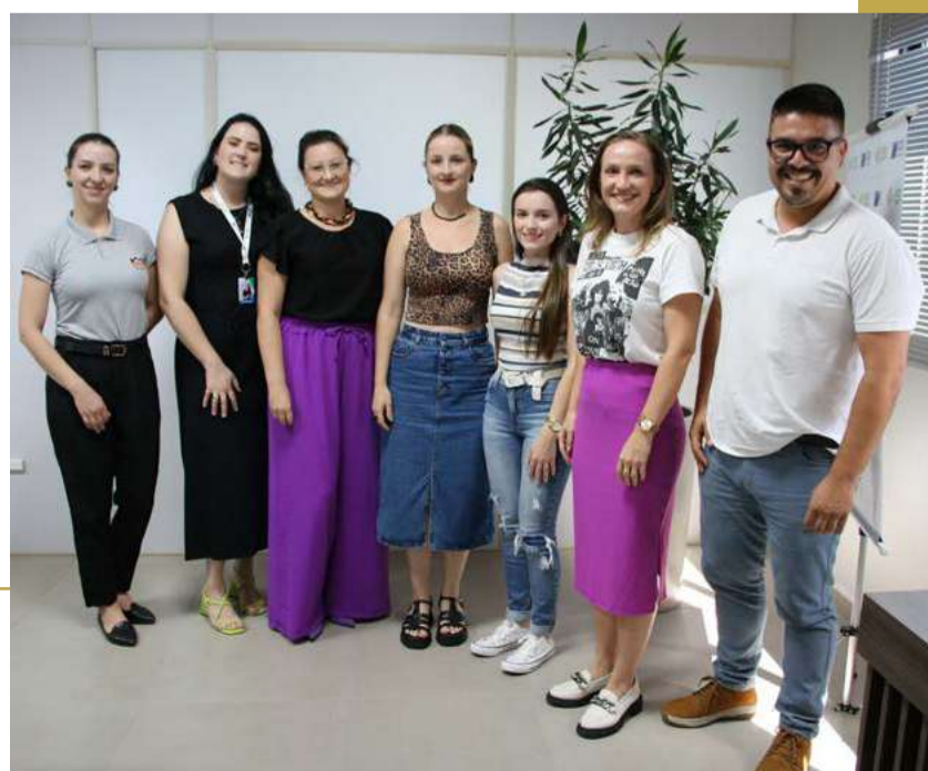
Conquista foi reivindicada pelo Núcleo de Arquitetos e Engenheiros, ligado a Associação Empresarial de Maravilha