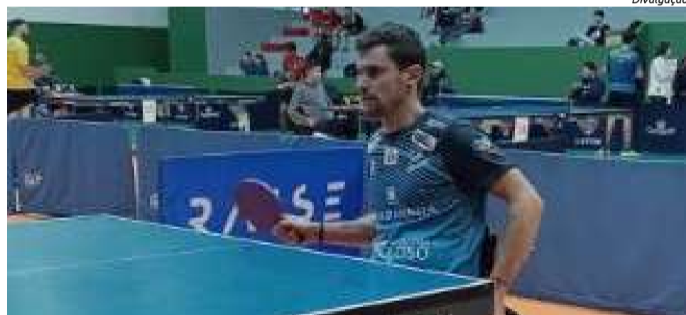
O mesatenista paralímpico se destaca nas competições