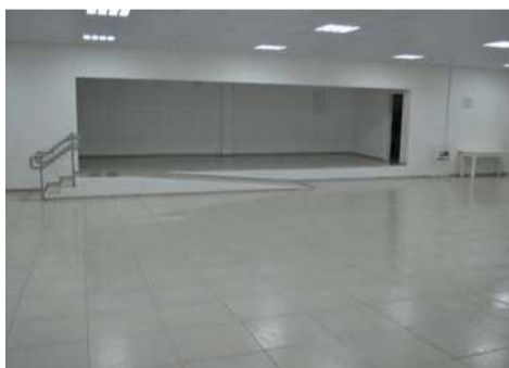
Auditório possui capacidade para mais de 200 pessoas