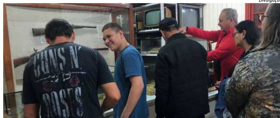
Visitas foram acompanhadas pela equipe gestora do museu

alunos puderam conhecer objetos que fizeram parte da colonização e que auxiliaram a vida das pessoas durante o desenvolvimento social e econômico do município. Nas três visitas, com auxílio da equipe gestora do museu, os alunos puderam agregar conhecimentos além da sala de aula, contribuindo ainda mais para o aprendizado.