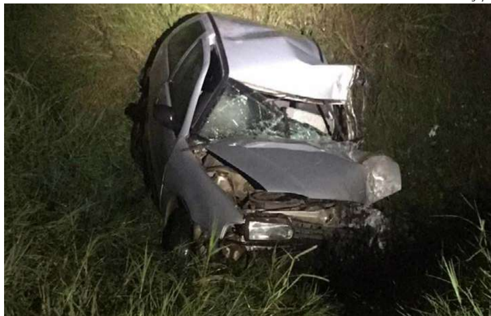
Após a batida, carro caiu em um barranco