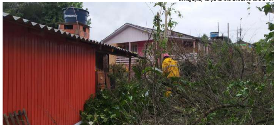
Árvore caiu sob o telhado de uma casa