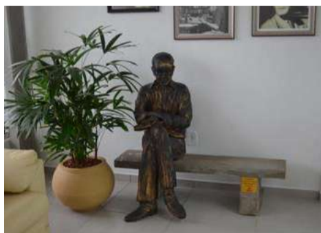
Estátua foi instalada no local, perto da entrada