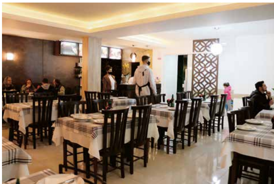
Novo ambiente é moderno e aconchegante