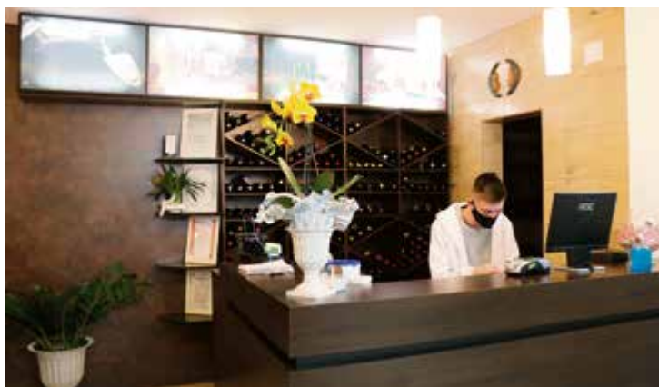
Telefone do Degustar é o (49) 3664 4439