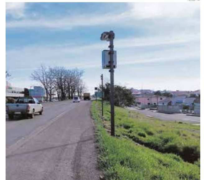
Radar instalado na região de Nova Erechim

Esses primeiros radares instalados ainda estão em caráter educativo. A aplicação de multas começa após aferição dos equipamentos realizada pelo Inmetro. A previsão é que até o fim