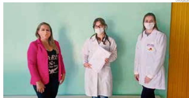
No total, foram feitos 3.600 kits contendo escova, creme dental, fio dental e cartilha de informações

Contendo escova, creme dental e fio dental, o kit de higiene bucal foi distribuído aos alunos da pré-escola até o 6º ano. A entrega foi feita junto com os kits de alimentação escolar. Conforme a secretária de saúde, Miriane Sartori, a ação é organizada pelo setor odontológico do município que realizava antes da pandemia, o trabalho educativo e preventivo de higiene bucal nas escolas. “Encontramos na distribuição dos alimentos uma maneira de fazer chegar até as crianças os produtos