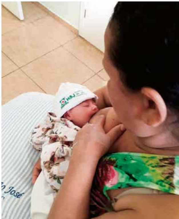
Campanha lembra a importância da amamentação

nizada pela equipe multiprofissional, com apoio do grupo de trabalho humanização e da equipe do setor, como enfermeiras e técnicos de enfermagem. A cor escolhida para a campanha faz alusão à definição da Organização Mundial da Saúde (OMS) para o leite materno: alimento de ouro para a saúde dos bebês.