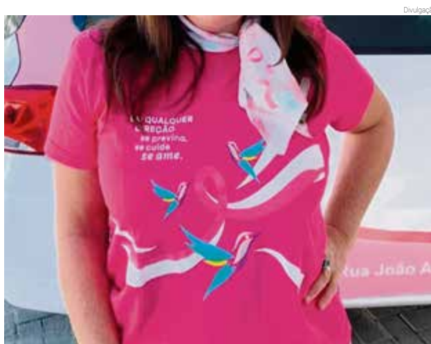
Camisetas do Outubro Rosa 2020