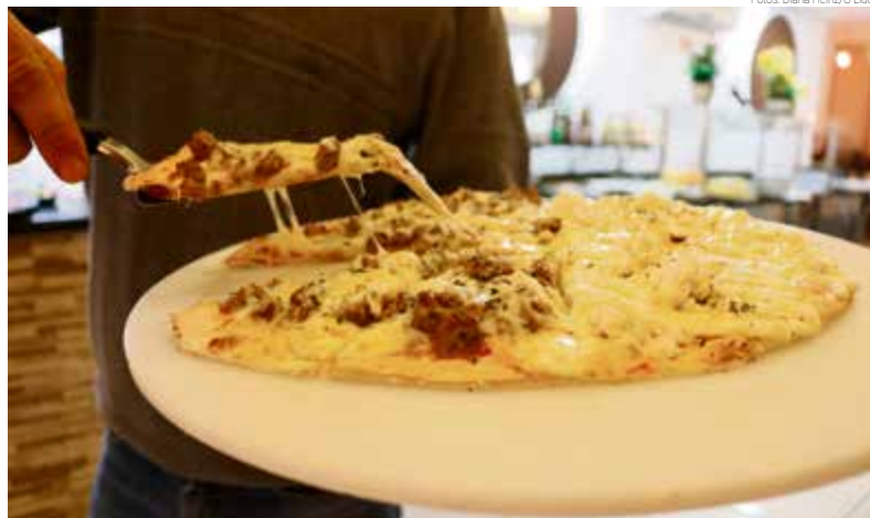
Nas segundas-feiras o rodízio entra em promoção por R$ 28