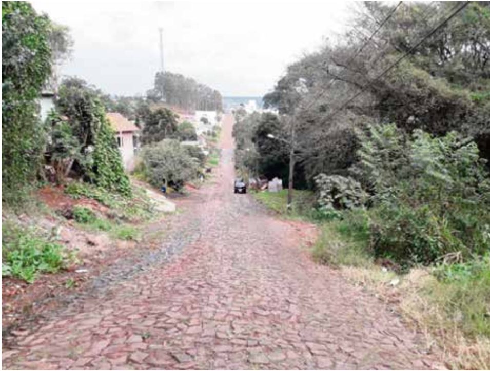
Rua Nidolfo Carlos Matje é um dos trechos que receberá melhorias