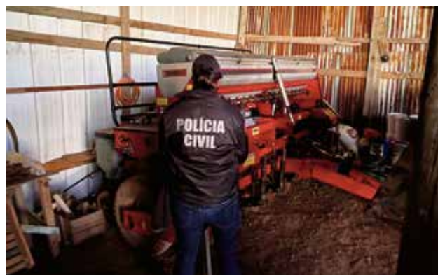
Máquina de Maravilha estava no Rio Grande do Sul e dono já acionou a Justiça