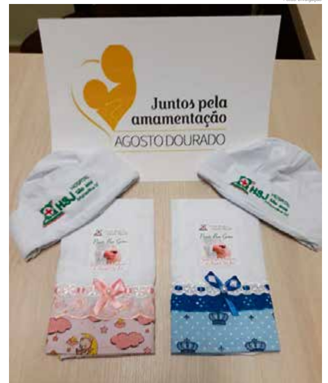
Equipe vai entregar touca personalizada e toalha higiênica para os bebês