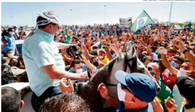
Presidente montou em cavalo e acenou para pessoas que o chamavam de "mito"

O presidente, Jair Bolsonaro, foi recebido por dezenas de pessoas ao desembarcar no aeroporto de São Raimundo Nonato, no Piauí (reduetos da esquerda), na manhã de quinta-feira (30), na primeira viagem após ser diagnosticado com coronavírus, no início do mês. No sábado (25) Bolsonaro anunciou pelas redes sociais que um novo teste deu negativo para a doença. Com chapéu branco de couro, o chefe do Executivo nacional montou em um cavalo e acenou para as pessoas que o chamavam de "mito". Pelo que se nota, o presidente está aclamado em todo o Brasil... Bom para o reerguimento de nosso país.