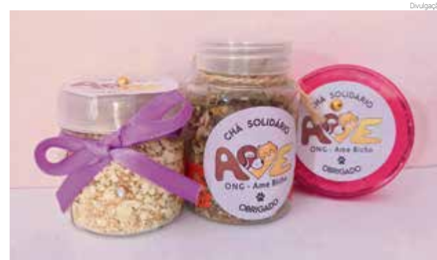
Em breve as vendas serão retomadas