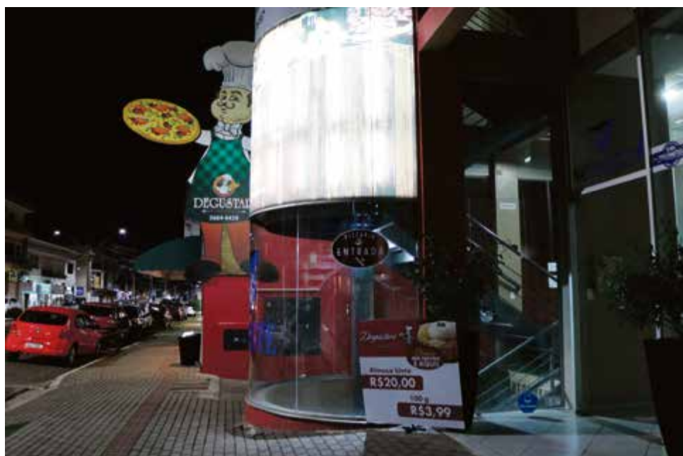
Restaurante trabalha com almoço, rodízio de pizzas, massas, salada e sushi