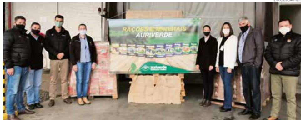
Entrega foi promovida na terça-feira (28)

ajudar aqueles que mais precisam, principalmente neste momento em que estamos vivendo de pandemia, com um produto que sabemos que faz muito bem à saúde de todos. Gostei desta ação porque a campanha também valoriza e beneficia o produtor, o agronegócio, os associados, clientes, entidades, parceiros, a cooperativa e a comunidade como um todo", enfatiza.