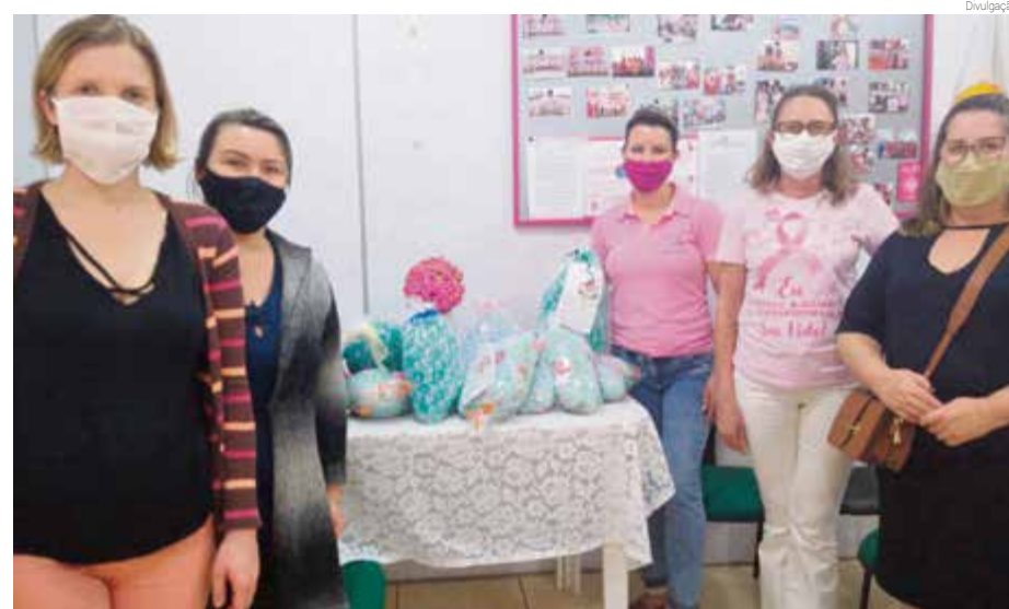
Produtos foram entregues pela equipe técnica do Cras de São Miguel da Boa Vista

O produto é direcionado para as pacientes com pós-cirúrgico de câncer de mama e conta com finalidade terapêutica. Feitas de tecido de algodão e fibra siliconada, as almofadas proporcionam diversos benefícios, como redução do inchaço, alívio da dor e diminuição da tensão nos ombros.