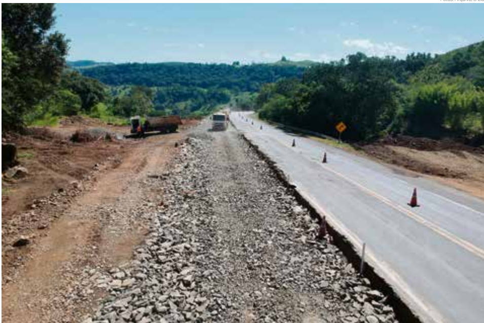
Obras têm recurso garantido para este ano

Conforme o Departamento Nacional de Infraestrutura de Transportes (Dnit), cerca de 30% dos serviços já foram executados. Os trabalhos estão concentrados atualmente entre os municípios de Maravilha e São Miguel do Oeste na construção de terceiras faixas. Já entre Chapecó e Maravilha há frentes de restauração da pista e implantação de interseção em Nova Ere-