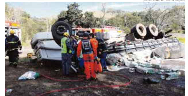
Motorista jogou veículo para fora da pista após ficar sem freio

Guarnições do Corpo de Bombeiros de São Miguel do Oeste e Maravilha, além de uma equipe do Samu, PRE, Polícia Militar e do Saer/Sara/Fron, foram acionadas para atender a ocorrência. O motorista fi-