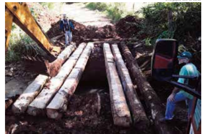
Local ficou interditado na quarta-feira (29) para a realização dos serviços

Ele explica que as melhorias garantem mais segurança aos usuários da via. Além desta, outras pontes do município estão no cronograma de recuperação da Secretaria de Obras e Infraestrutura.