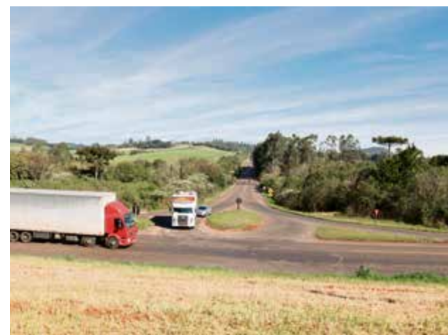
Entroncamento das BRs vai ganhar um elevado