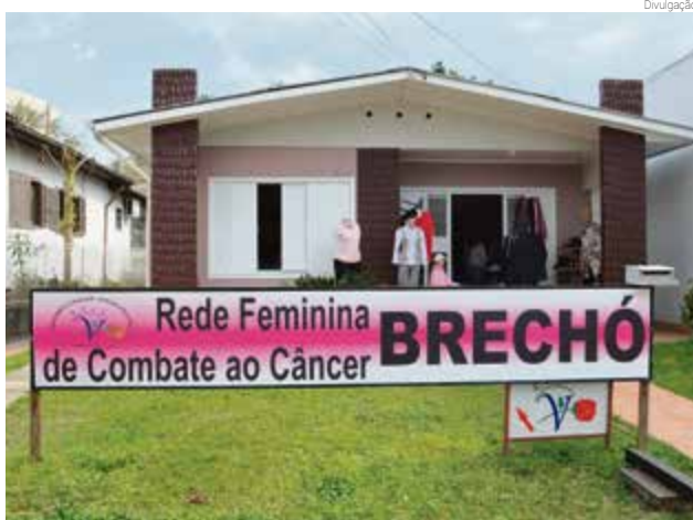
Brechó fica na Rua Duque de Caxias, próximo da Praça Padre José Bunsen

que é obrigatório o uso de máscara e álcool em gel, além de manter o distanciamento entre pessoas. Haverá controle de acesso para evitar aglomerações. A sede do brechó fica na Rua Duque de Caxias, próximo da Praça Padre José Bunsen, no centro da cidade. O local oferece peças de roupas e calçados com preços acessíveis para a população. Todo o recurso arrecadado é usado para a manutenção dos serviços da Rede Feminina.