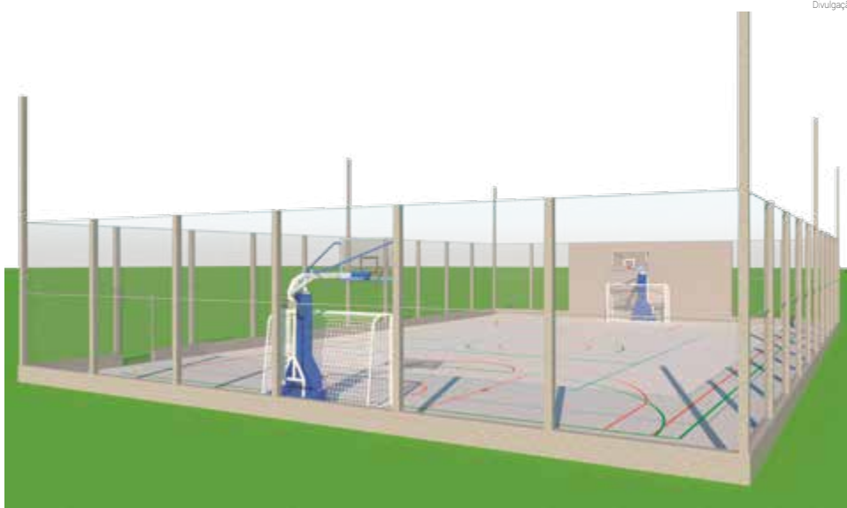
Projeto da nova quadra poliesportiva