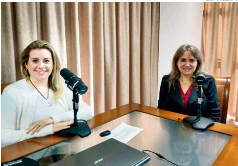
Presidente explicou as vantagens da campanha e os prêmios sorteados

De acordo com a Associação Empresarial, a campanha terá como principais pilares, movimentar as vendas e valorização das empresas locais, atrair novos clientes,