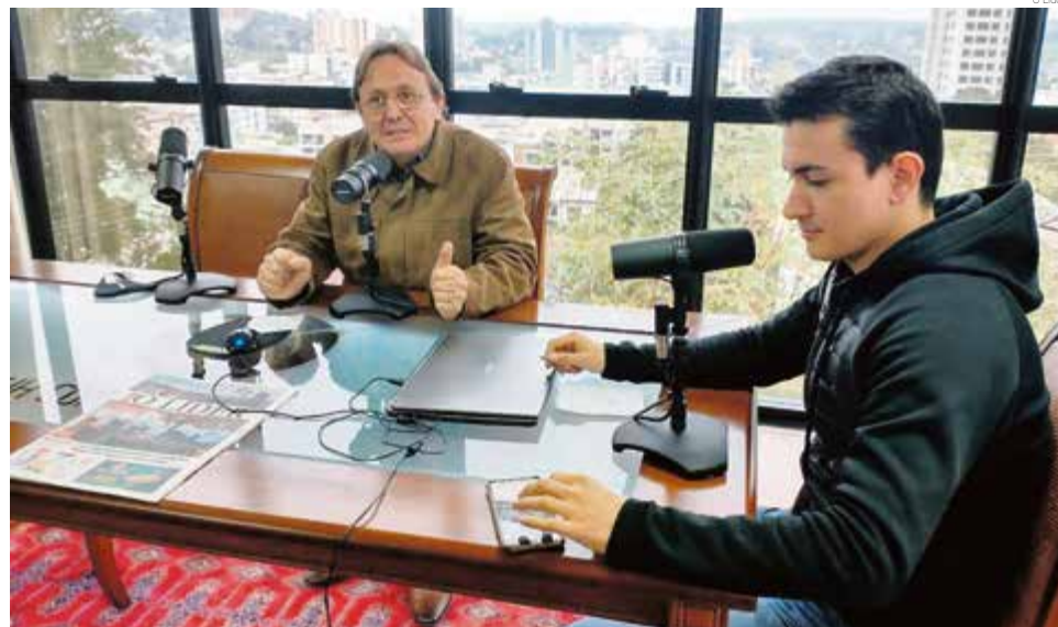
Vice-prefeito afirma que município fará licitação e obra deve começar em breve