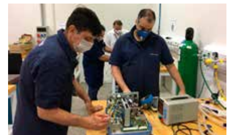
Respiradores pulmonares foram restaurados pelo SENAI em Joinville.

A iniciativa Mais Manutenção de Respiradores, uma ação de enfrentamento do novo coronavírus desenvolvida em âmbito nacional pelos Institutos SENAI de Inovação teve, em Santa Catarina, o conserto de 61 aparelhos, utilizados em Unidades de Tratamento Intensivo (UTIs). A estimativa é que eles salvem de 600 a 1,2 mil vidas. Além disso, representam economia de R$ 1,4 milhão, valor que seria necessário para a aquisição de novos equipamentos. A atividade está sendo interrompida, dada a inexistência de novas demandas, mas poderá ser retomada caso surja necessidade. Uma live no dia 20 congregou as empresas parceiras no projeto.