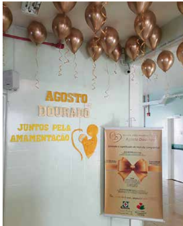
Setor do bloco da unidade obstétrica foi decorado na cor dourada