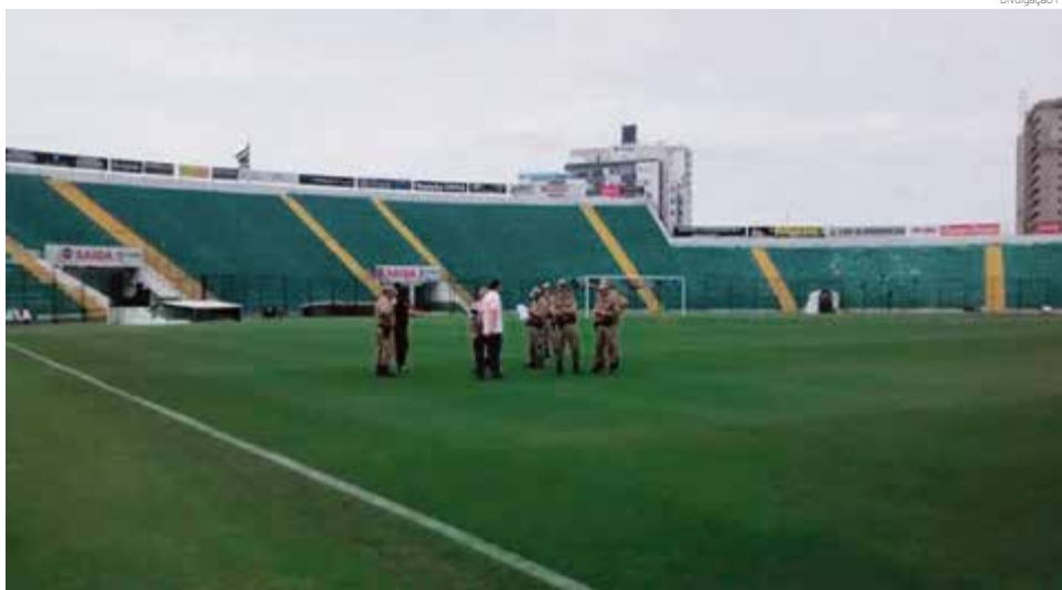
Polícia Militar atua na fiscalização das medidas sanitárias

“Nossa preocupação também foi com as torcidas organizadas. Realizamos uma reunião digital com vários membros e lideranças das diversas torcidas, para que ajudassem no respeito às medidas protetivas contra a covid-19”, ob-