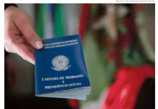
Interessados devem levar currículos e carteira de trabalho

O Sine/SC divulgou na quarta-feira (29) a lista atualizada das vagas de emprego disponíveis no Estado. São 2.549 oportunidades em aberto. As ofertas estão distribuídas em mais de 50 cidades e são para diferentes graus de instrução e funções. O Oeste do Estado é a região com mais oportunidades, tendo como referência a cidade de São Miguel do Oeste com 562 vagas, Chapecó (223), seguidas por Concórdia com 160 e Campos Novos com 101.