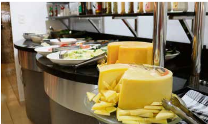
Degustar trabalha de segunda-feira a sábado

O Degustar trabalha de segunda-feira a sábado, das 11h às 13h15 e das 19h às 22h30. O restaurante também atua com tele-entrega através do telefone (49) 3664 4439. O número também é WhatsApp. Nas segundas-feiras o rodízio entra em promoção por R$ 28.