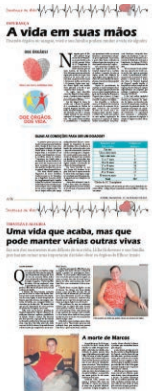
A matéria "A vida em suas Mãos", sobre doação de sangue, conquistou o primeiro lugar na categoria Reportagem Livre

vilha ficou mais uma vez entre os Top Ten do Estado na categoria Jornalismo e na categoria Publicidade, sendo o vencedor na categoria reportagem livre. Dos 51 jornais que disputaram premiação na edição 2016 do Prêmio Adjori/SC de Jornalismo - Troféu Luiz Henrique da Silveira, 22 receberam menção honrosa por estar entre os finalistas na disputa. Alguns chegaram entre os melhores em várias categorias. O Jornal O Líder de São Miguel do Oeste foi finalista em duas categorias e conquistou duas menções honrosas.