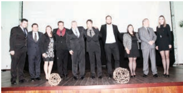
O Jornal O Líder de Maravilha ficou entre os Top Ten do Estado nas categorias Jornalismo e Publicidade