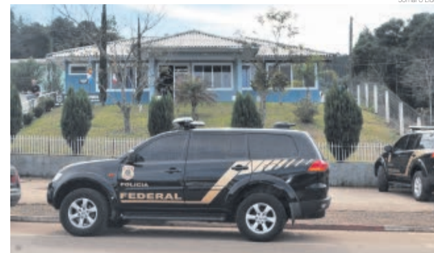
Policiais ouviram 11 pessoas na delegacia de Tigrinhos

A polícia informou que as informações coletadas na ação realizada na manhã de quarta-feira (29) serão anexas ao inquérito e encaminhadas para a Justiça. A operação contou com a Polícia Civil de Maravilha e a Polícia Militar de Tigrinhos.