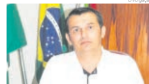
Prefeito de Santa Helena, Gilberto Giordano

Em outra ação, o prefeito e mais três pessoas são acusados de compras diretas e sucessivas de peças e serviços de mão de obra para manutenção de máquina pá carregadeira, ultrapassando o limite permitido para compras diretas. De acordo com a ação, o prefeito e os outros réus realizaram compras para a manutenção desta máquina 131 vezes entre 2009