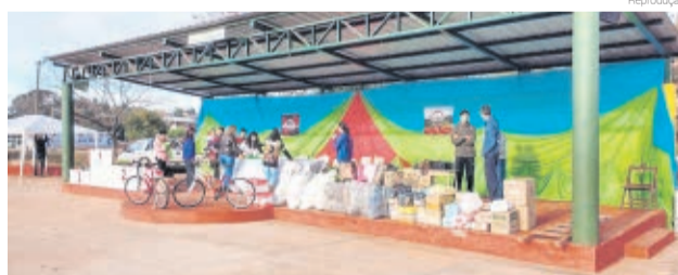
Atletas disputaram prova beneficente às crianças órfãs de San Pedro, na Argentina

O agrupamento Mborevi Mtb San Pedro foi responsável pela atividade, que contou com a participação do Clube do Pedal, de São Miguel do Oeste, e se comprometeu a incluí-lo no calendário de atividades do mês em San Pedro.