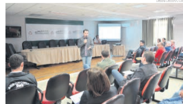
Objetivo foi apresentar o que é um Comitê de Bacias, o Plano de Recursos Hídricos da RH 01 e o Cadastro de Usuários de Água

Em reunião na segunda-feira (27), na Fundação Municipal de Cultura de São Miguel do Oeste, com representantes da área militar, foi confirmada a participação da 9ª Região de Polícia Militar, 12º Batalhão do Corpo de Bombeiros e do 14º RCMec - Regimento de Cavalaria Mecanizado para a Semana da Pátria e o tradicional Desfile de 7 de Setembro. No próximo dia 5 de julho a equipe da fundação se reúne com os gestores das escolas municipais, estaduais e particulares para discutir a organização das atividades de 7 de setembro.