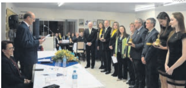
Diretorias ficarão no cargo até 2017

A solenidade festiva de posse das novas diretorias do Lions Clube Maravilha, Lions Clube Maravilha Oeste e Leo Clube Maravilha foi realizada na sede das entidades. O evento contou com a presença dos integrantes, familiares, lideranças e convidados. As diretorias empossadas ficarão no mandato até 2017.