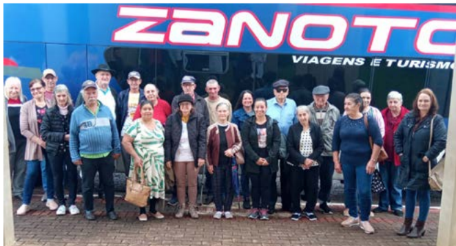
Procedimentos foram realizados em Iporã do Oeste