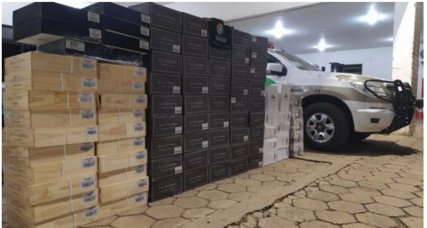
Mais uma carga foi flagrada pela polícia na fronteira

Após alguns quilômetros, o veículo parou e o motorista saiu correndo em meio à mata fechada, não sendo possível lo-