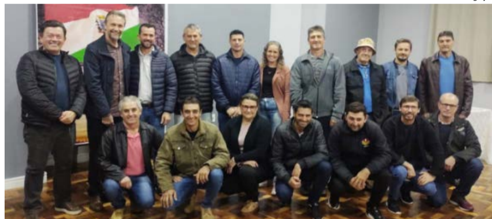
Membros dos conselhos, juntamente com o deputado Pedro Uczai, prefeito e vice-prefeito