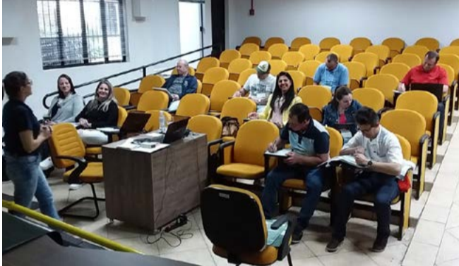
Treinamento foi promovido na sede da Amerios