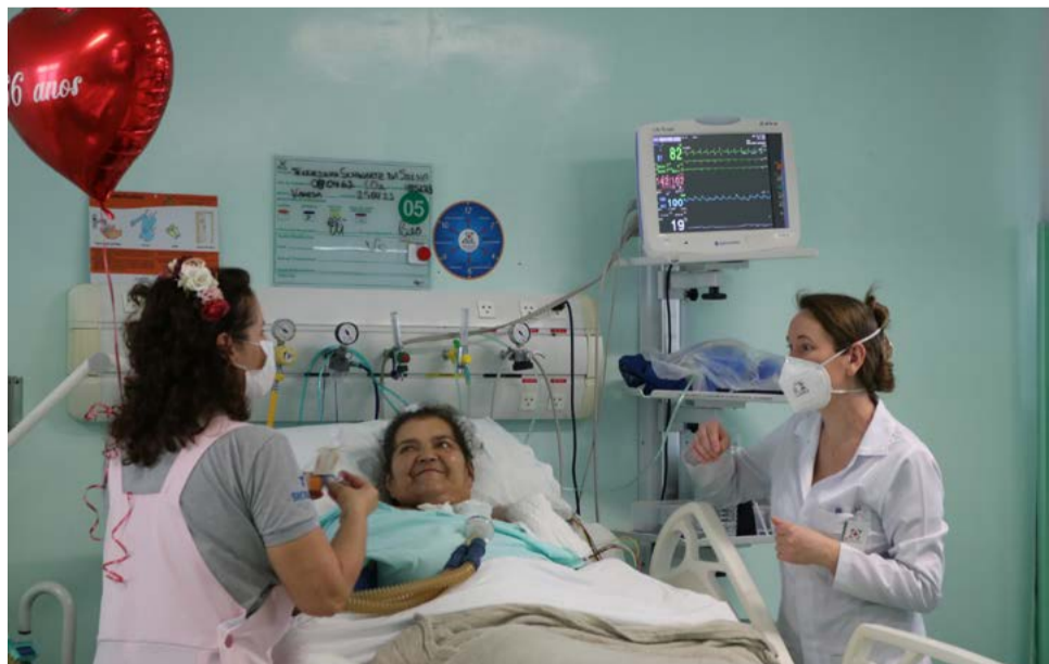
Interação com uma paciente da UTI