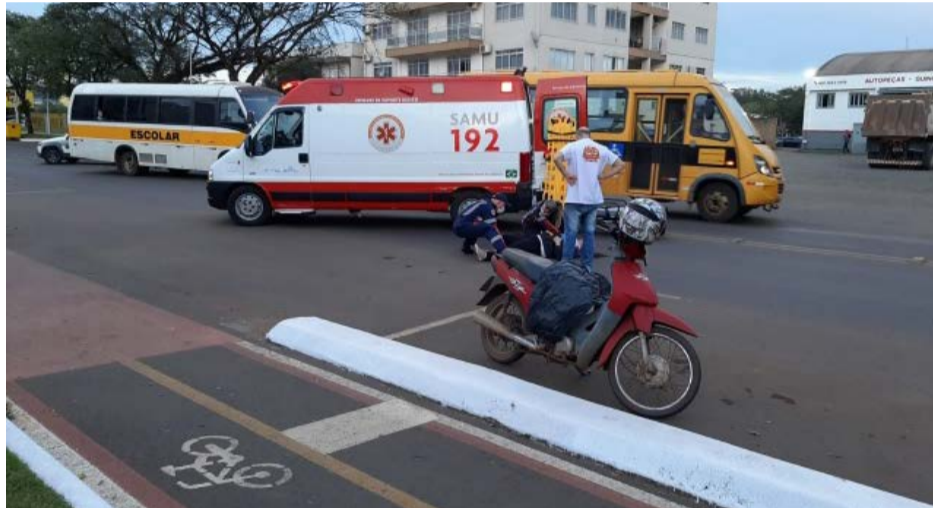
Uma mulher foi encaminhada para atendimento médico

Ela foi conduzida para atendimento médico no Hospital São José. A Polícia Militar de Maravilha também foi acionada e fez o controle do trânsito no local.