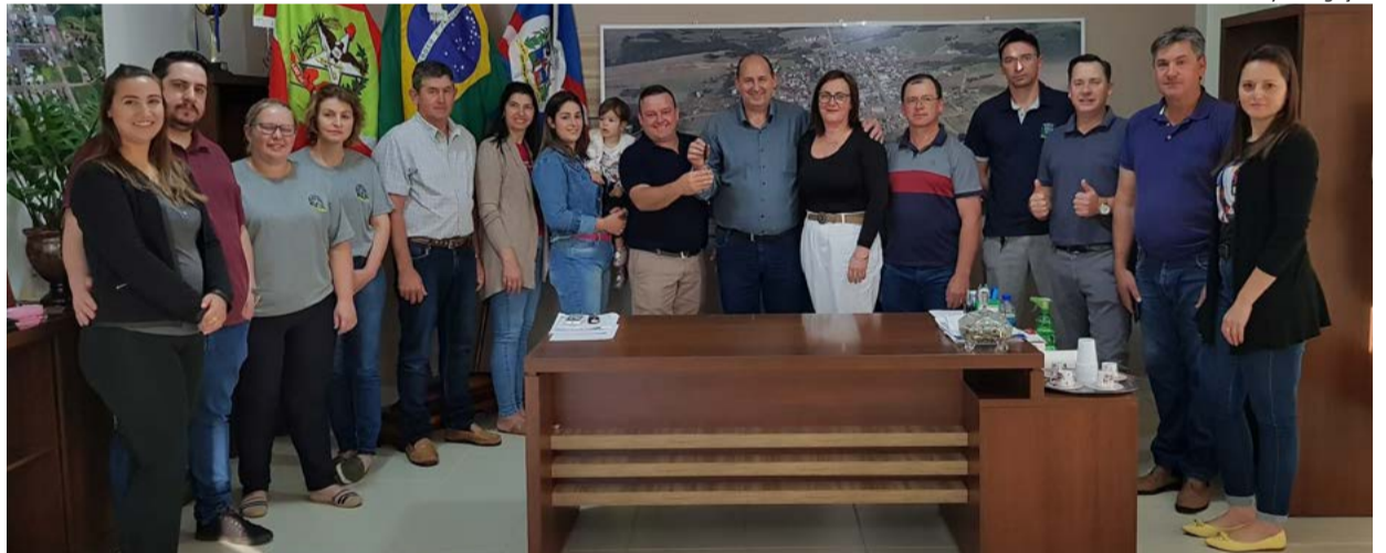
Reunião foi promovida na segunda-feira (4), no gabinete do prefeito