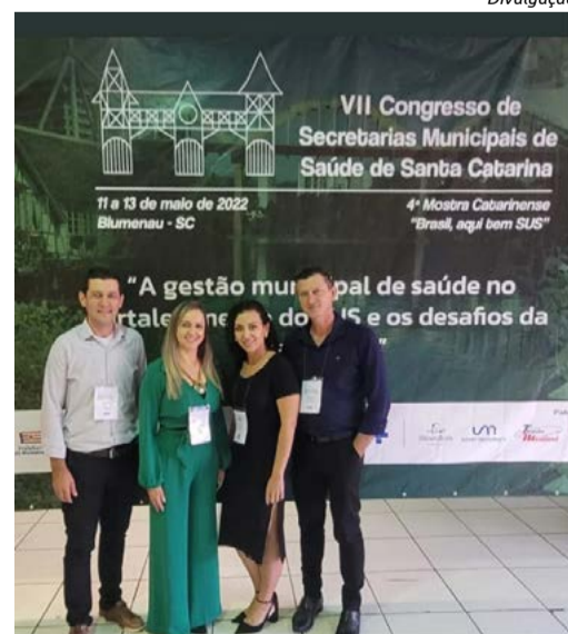
Classificação foi obtida em evento realizado no mês de maio

Pilates no SUS”. A profissional explica ser um trabalho de análise dos últimos oito anos de todos os atendimentos individuais realizados pelo setor de fisioterapia da Secretária Municipal de Saúde de São Miguel da Boa Vista, em conjunto com outros profissionais da saúde. “Foi realizado um levantamento de dados de todos os atendimentos, incluindo uma avaliação do prognóstico e resolutividade. Foi avaliada ainda a viabilidade da implantação do método Pilates no SUS”, ressalta.