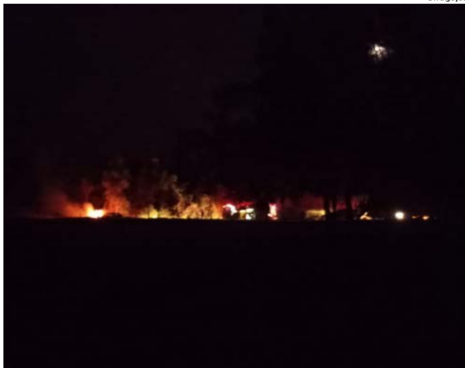
Carro foi danificado no motor e causou grande prejuízo ao motorista