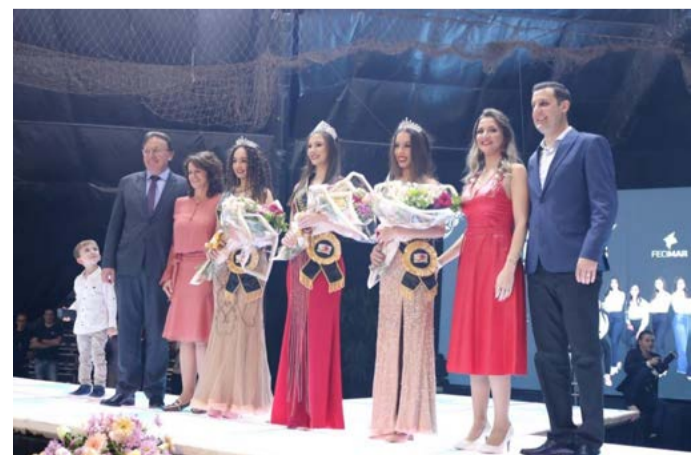
Município parabenizou escolhidas e agradeceu a participação de todos