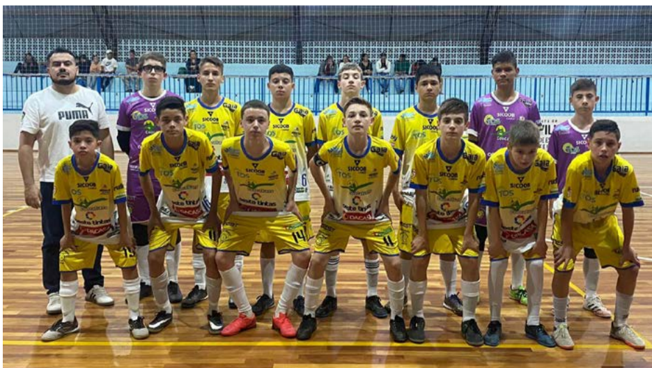
Copa Oeste reúne times de toda a região