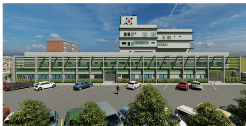
Projeto de ampliação da unidade