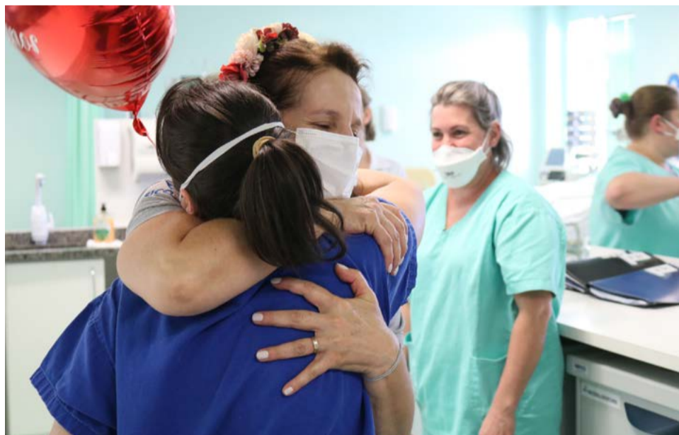
Momentos de emoção marcaram a visita