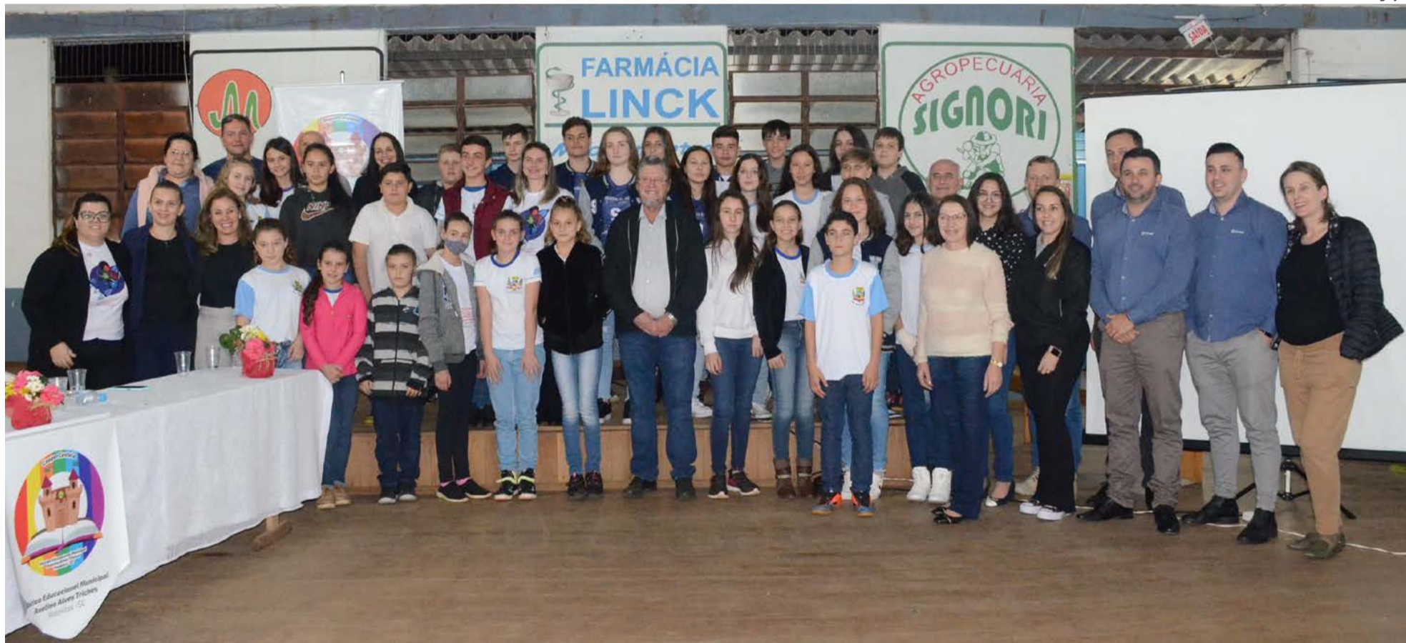
Assembleia foi promovida na última semana