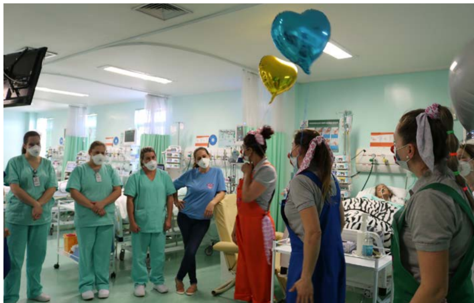
Equipe da UTI recebendo a visita