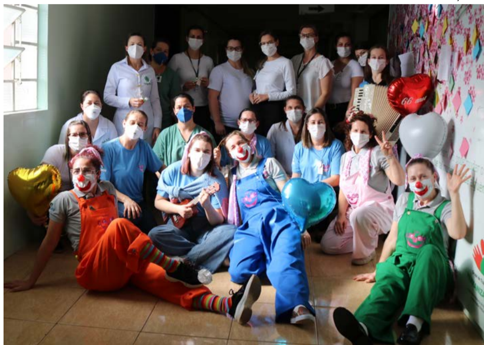
Foto das voluntárias do projeto com equipe e direção do hospital