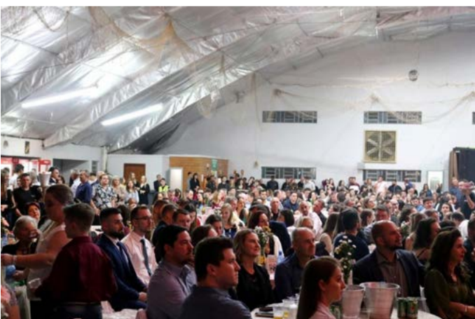
Salão Paroquial ficou lotado para escolha das soberanas