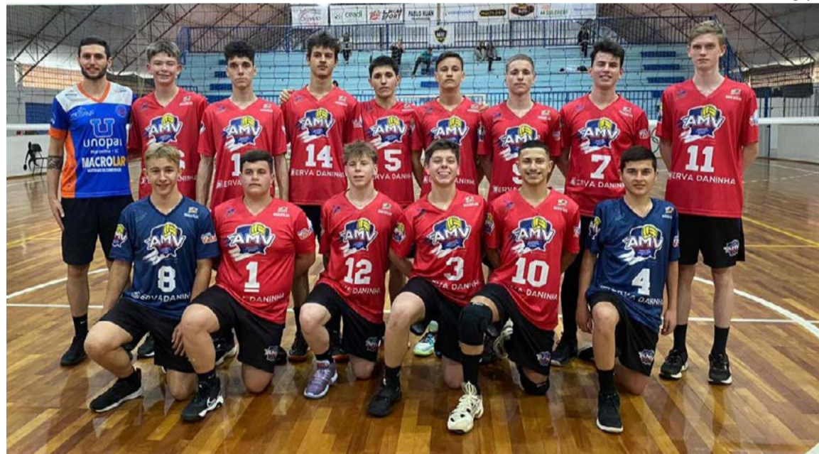
Meninos da Cidade das Crianças ganharam de todos os adversários