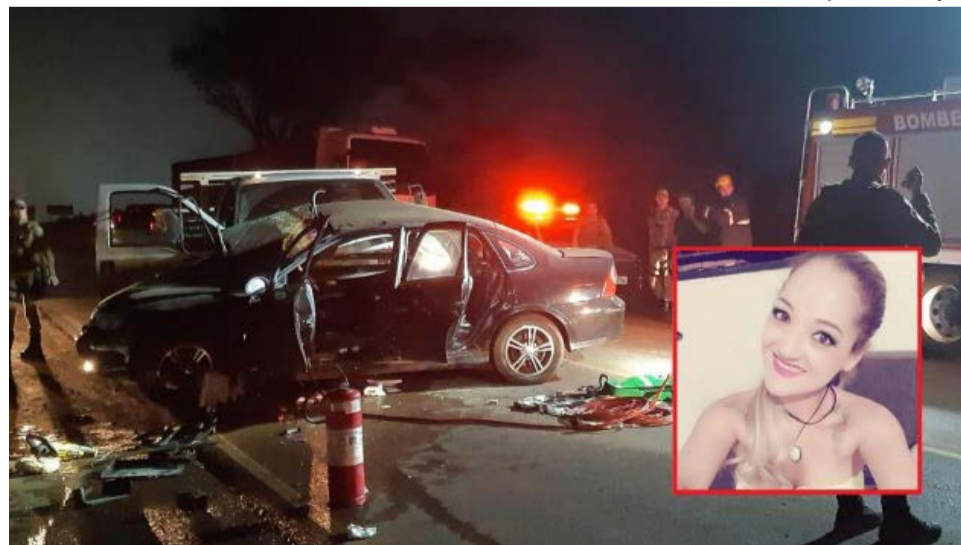
Carro ficou destruído após o acidente