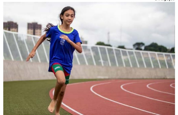
Podem estar lá atletas destaques das Paralimpíadas Escolares 2021