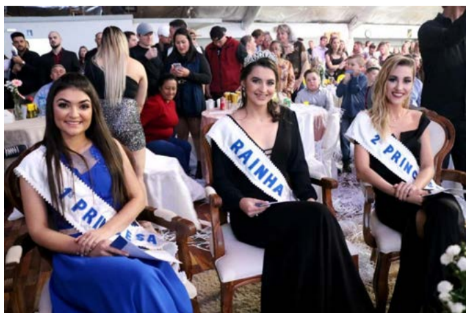
Soberanas repassaram faixas após quatro anos de representatividade