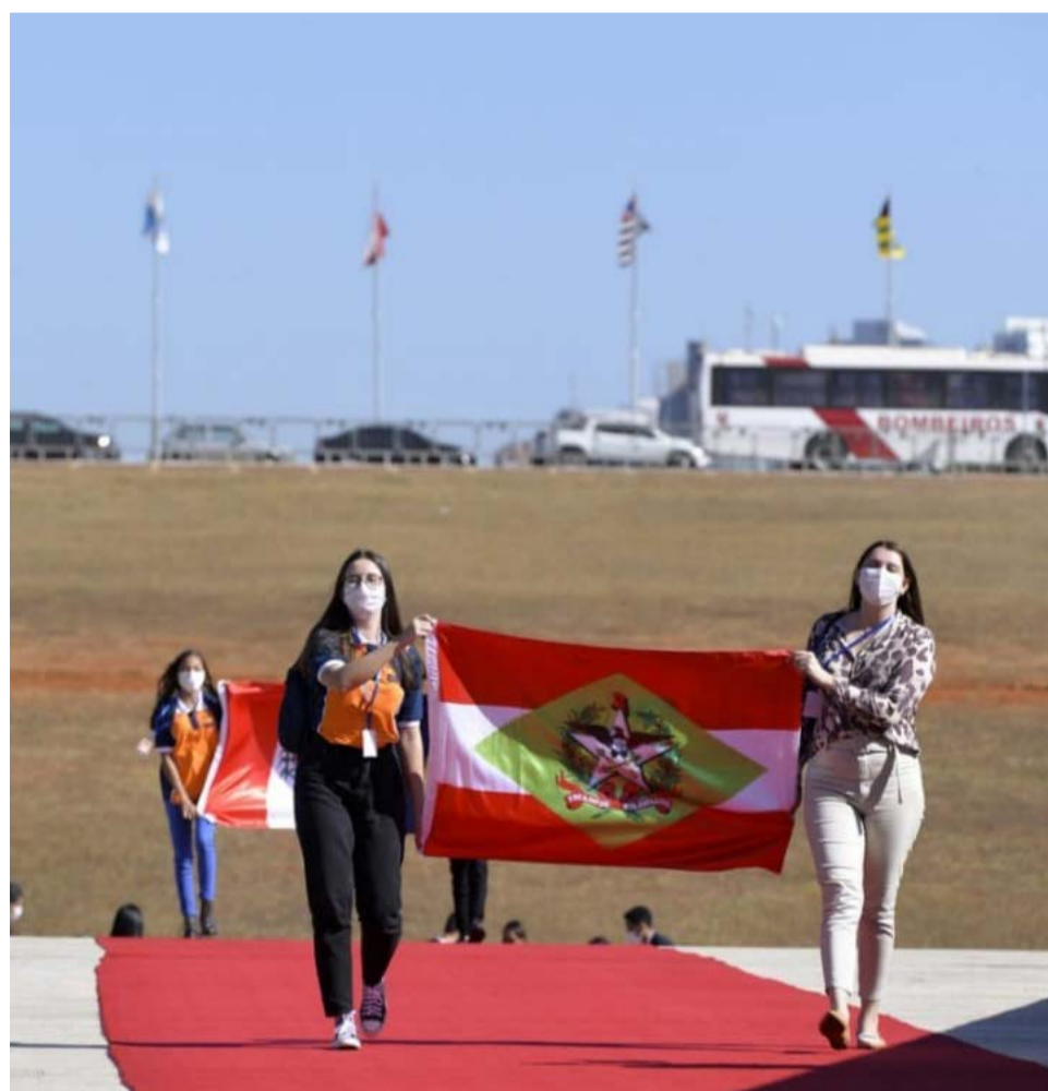
A subida pela rampa do Palácio do Planalto

Durante a semana o grupo de estudantes também visitou pontos turísticos e importantes na capital federal, como o Palácio do Planalto, Senado, Arquivo Nacional e Praça dos Três Poderes. Eles também tiveram um encontro com o presidente do Senado, Rodrigo Pacheco, além de conhecer outras figuras importantes como o senador Randonfe Rodrigues e o jornalista e historiador Eduardo Bueno.