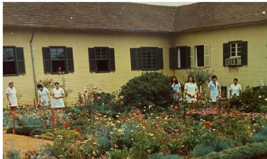
Atendimento iniciou em uma estrutura antiga de madeira