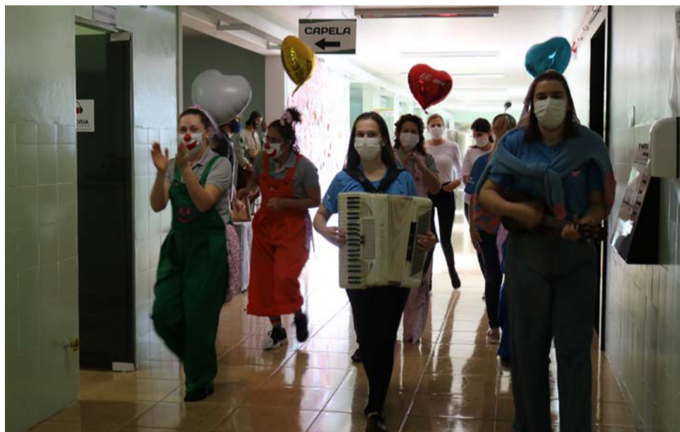
Grupo levou alegria pelos ambientes