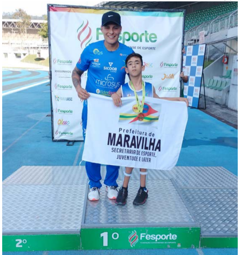
Agora o atleta espera a confirmação da vaga para as Paralimpiadas Escolares