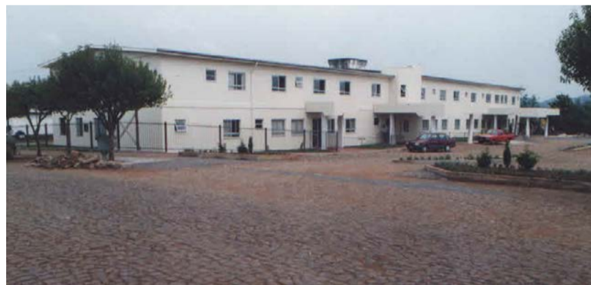
Construção da estrutura em alvenaria em 1961