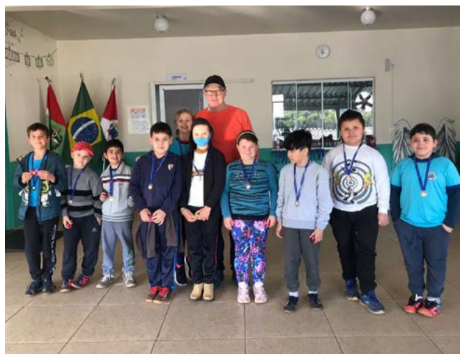
Alunos foram contemplados com medalhas