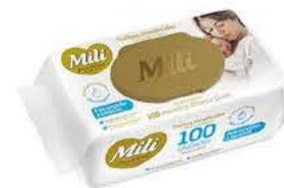
Toalha umedecida Mili Love Care