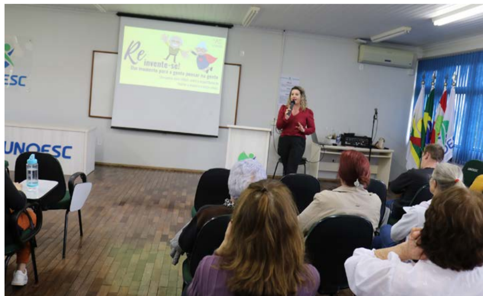
Seminário teve duas palestras durante a tarde

dia 10 de dezembro. Também vamos trabalhar uma nova matriz de aperfeiçoamento, para oportunizar que os alunos já formados deem continuidade ao processo de formação. O programa da Uniti vem se qualificando a cada semestre. Hoje estamos numa fase madura do curso, já contamos com a experiência dos professores e principalmente com a contribuição dos alunos que vão nos dando a direção de suas expectativas”, finaliza.