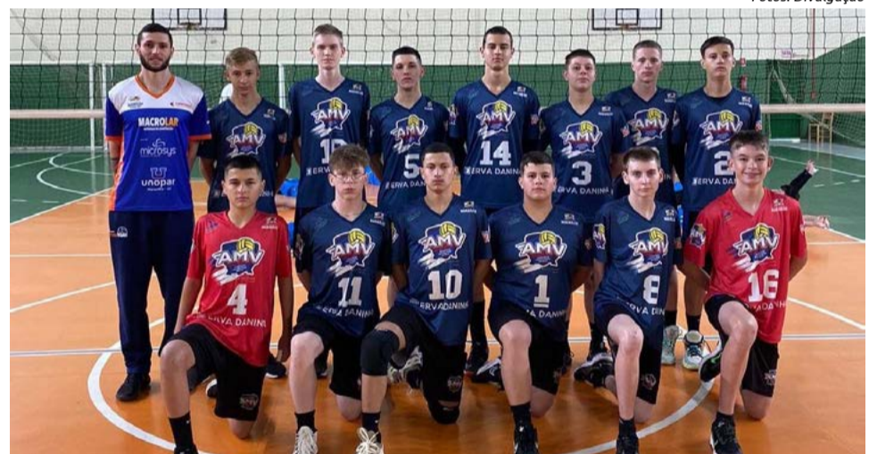
Equipe masculina de Maravilha