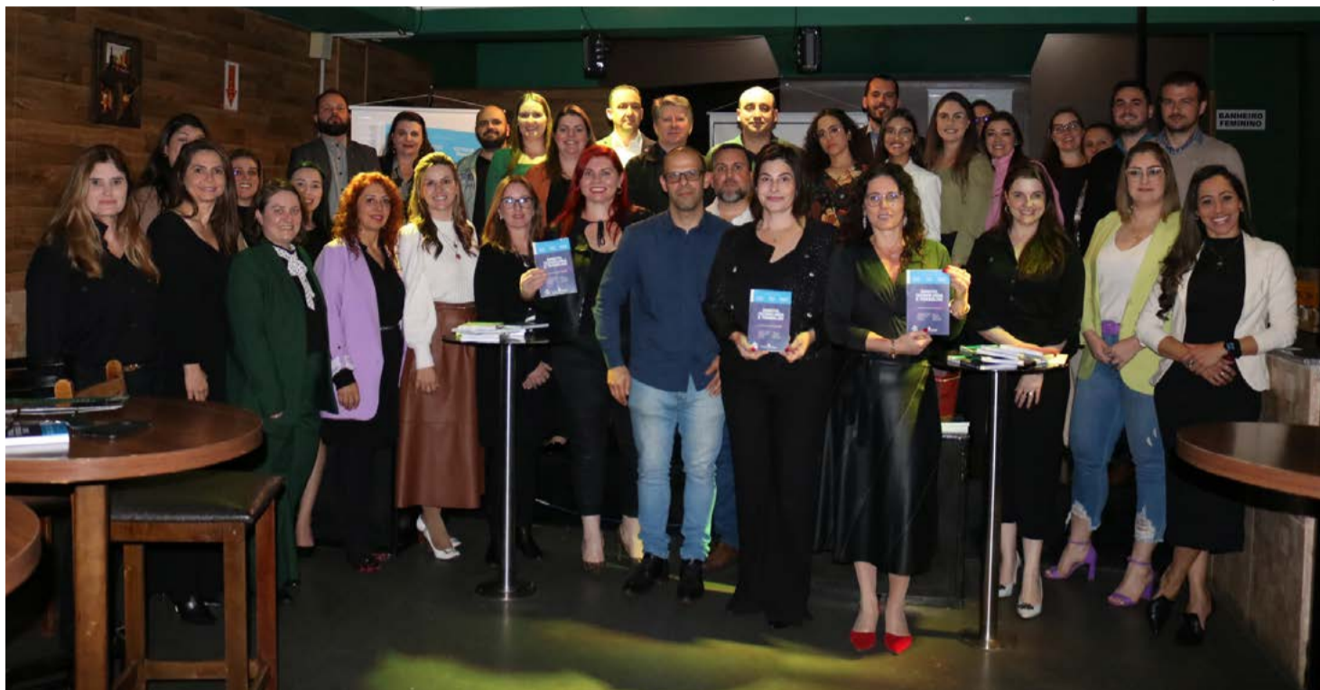
Evento de lançamento do livro em Maravilha

A obra está disponível em aplicativos e sites de venda, ou diretamente com a edito-