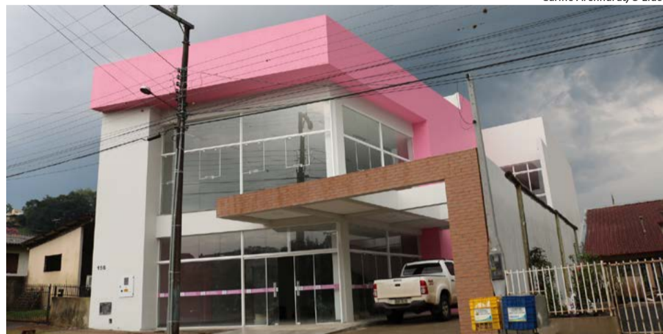
Nova sede está em fase final de construção