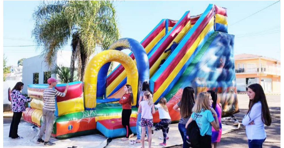
Espaço kids para as crianças foi montado na praça