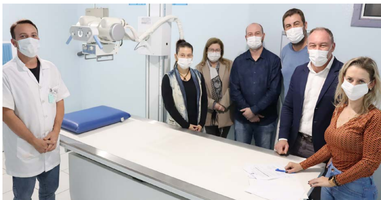
Entrega contou com a presença de autoridades municipais

para agilizar e auxiliar no diagnóstico de exames, evitando com que os pacientes precisem ser levados a cidades vizinhas e recebendo o atendimento necessário o mais rápido possível.