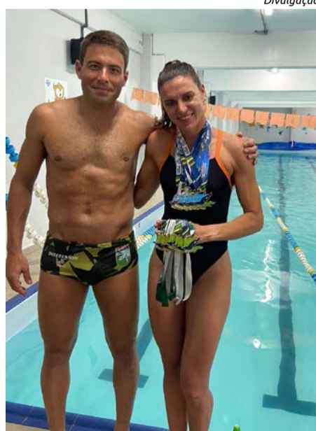
Em todas as provas individuais a atleta estabeleceu novo Recorde