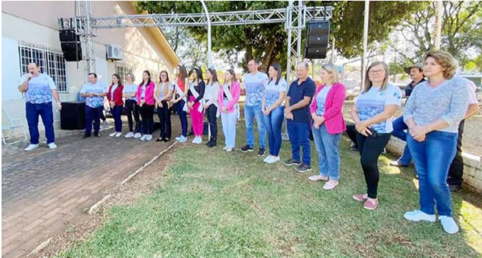
Autoridades agradeceram a participação dos munícipes nos eventos realizados durante o mês