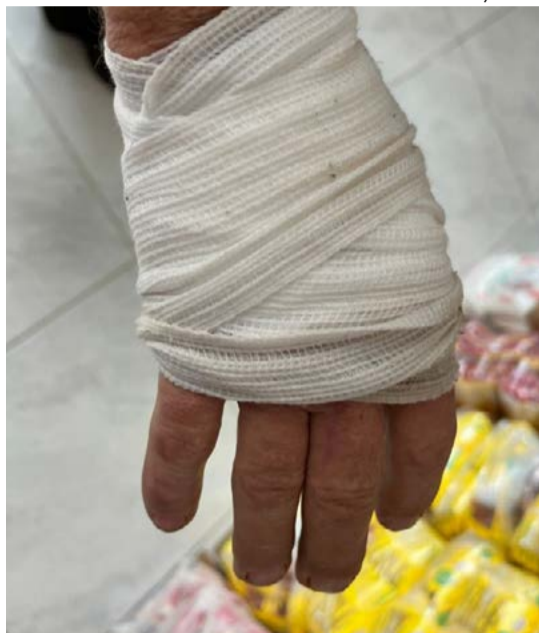
Ederson Abi/O Líder

Ninguém foi preso e o caso está sendo investigado.