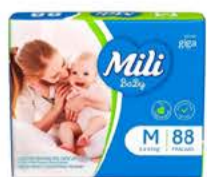
Fralda Mili Baby Giga