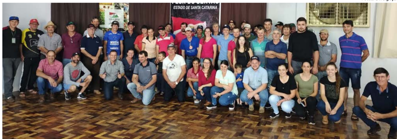
Dezenas de agricultores participaram do evento e qualificaram seus negócios rurais