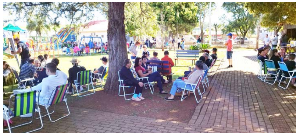
População atendeu o pedido e participou da mateada