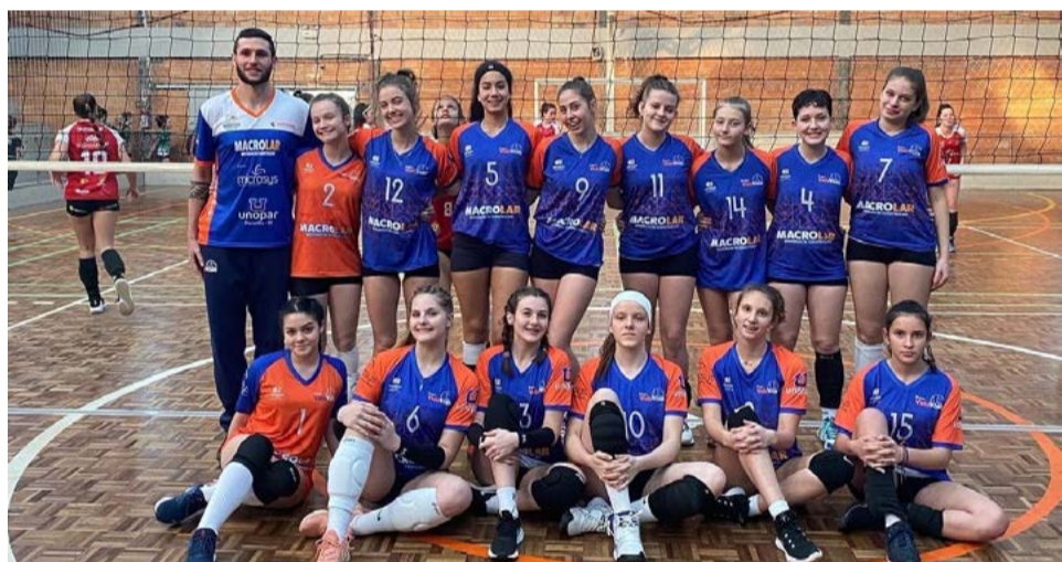
Equipe feminina de Maravilha

A próxima competição será a segunda fase da Liga Oeste, categoria adulto masculino em Xanxerê, no dia 13 de agosto.