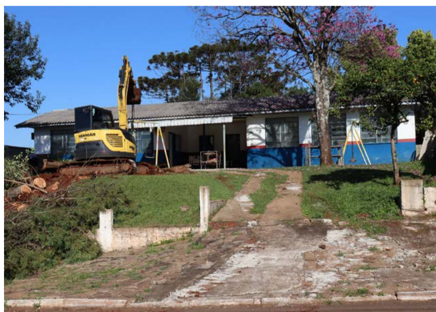
Reformas e adequações terão um investimento de R$ 323 mil