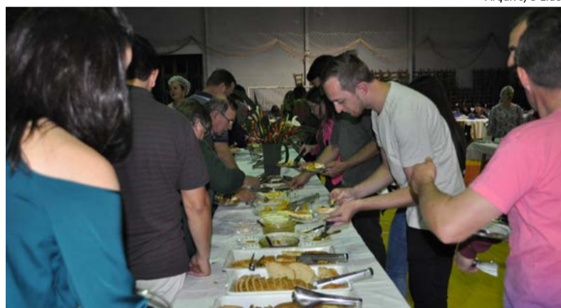
Evento já é tradicional no município