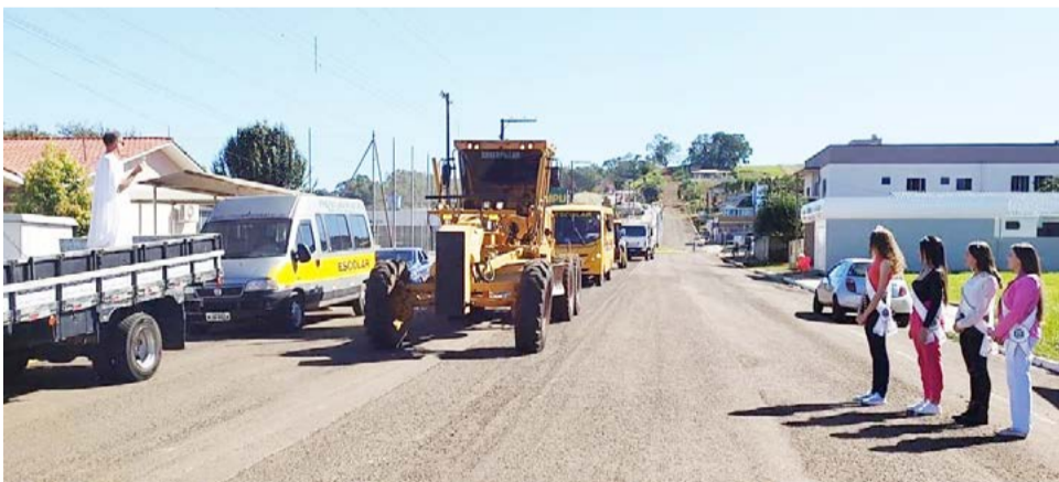
Carros, caminhões e máquinas desfilaram e receberam a benção