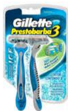
Aparelho Prestobarba 3 c/ 2un (vários tipos)