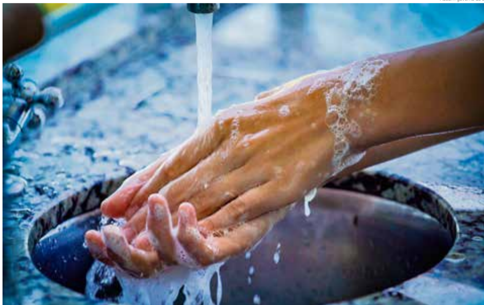
Medidas de proteção contra o vírus são fundamentais para evitar a contaminação

Maravilha segue com quatro óbitos registrados, todos