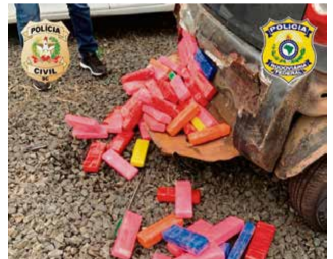
Droga estava escondida no fundo falso de um veículo já apreendido pela polícia

Na quinta-feira (21), na segunda ação, 32 quilos de maconha foram recolhidos pela Polícia Civil. Conforme a investigação, a droga estava escondida no fundo falso de um carro que já estava apreendido no pátio. Segundo a polícia, o proprietário da droga já está preso e res-