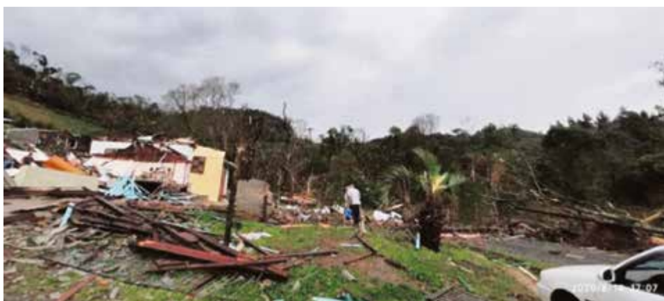
Força do vento destruiu residências na região do Meio-Oeste e Planalto Norte

A Celesc reforçou que situações de emergência na rede elétrica devem ser registradas pelos canais oficiais de atendimento ao consumidor – o 0800 048 0196, o aplicativo da Celesc, através do site ou, ainda, enviar um SMS para 48196 com a mensagem SEM LUZ e o número da unidade consumidora.