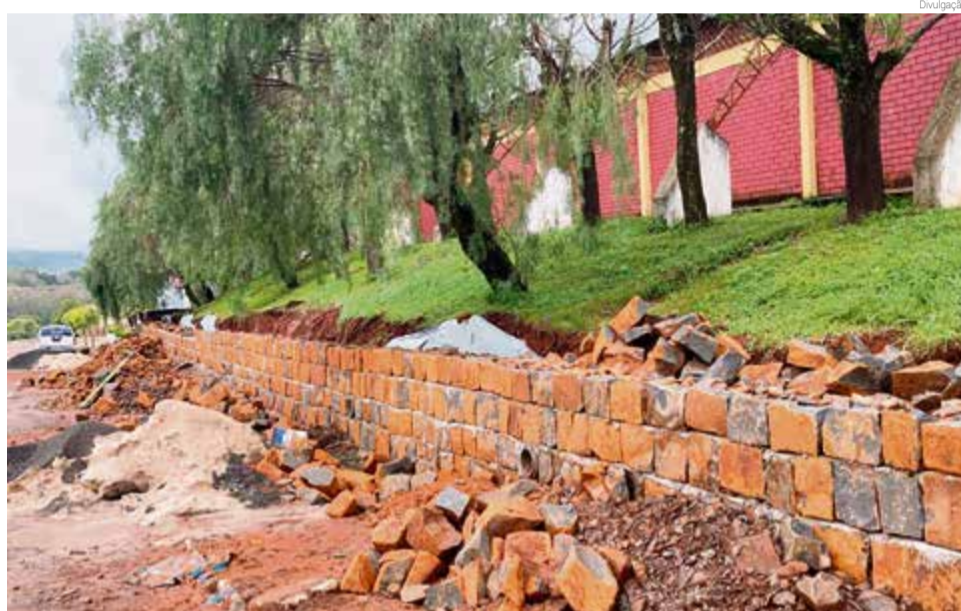
Obras de manutenção na EEF Anita Garibaldi de Romelândia

O coordenador regional destaca que o temporal do último dia 14 e o ciclone do dia 30 de junho deixaram aproximadamente 450 unidades escolares do Estado danificadas e que também precisaram de reparos. Na regional de Maravilha apenas uma escola, no município de Formosa do Sul, sofreu danos com destelhamento.