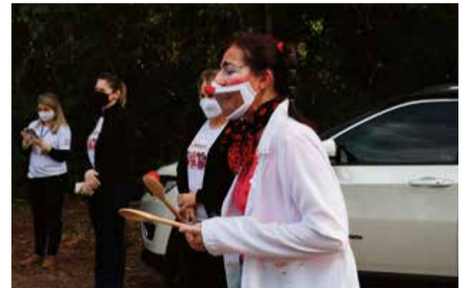
Diversas poesias foram contadas durante as apresentações