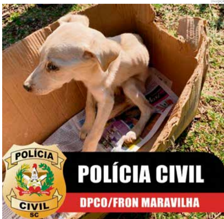
Cachorro resgatado neste mês, após denúncia de maus-tratos