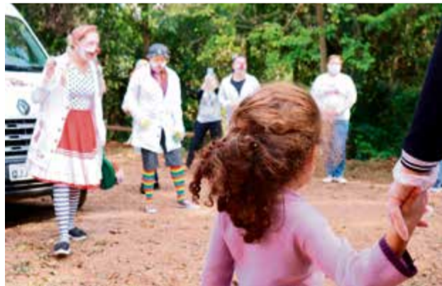
Visitas são realizadas três vezes por semana

ideia nasceu da parceria entre a Secretaria de Assistência Social de Maravilha com a Secretaria de Educação e da necessidade em desenvolver ações voltadas às famílias durante o período de pandemia, que promovam bem-estar, cuidado e fortalecimento de vínculos afetivos. “Nós apenas visitamos famílias que permitiram o encontro. Nós mantivemos a distância e respeitamos as me-