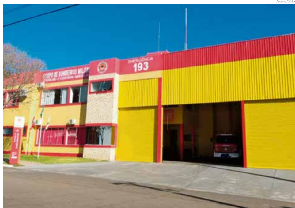
Arrecadação obrigatória pelo bloco de IPTU chega a R$ 180 mil

De acordo com ele, o programa de contribuição voluntária será feito pela conta de luz dos moradores interessados. “Essa modalidade foi implementada no município de São Miguel do Oeste no ano 2017 pelo mesmo motivo que está acontecendo aqui. Tomamos essa decisão, pois essa modalidade foi bem recebida pela população nos outros locais onde foi implementada. Já temos algumas pessoas que aderiram aqui em Maravilha”, explica.