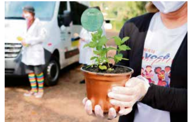
Mudas de chás e ímãs de geladeira foram doados

ma podemos fortalecer nossos vínculos. Como eles importam, nós fomos até a porta das famílias. Faremos uma avaliação após as visitas para uma segunda etapa”, declara.