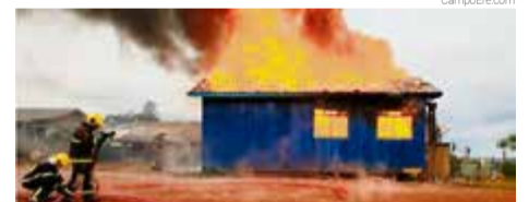
Equipes eliminaram o fogo e salvaram um cachorro que estava amarrado próximo da residência

O Corpo de Bombeiros de São Lourenço do Oeste foi acionado para auxiliar na ocorrência, mas a casa ficou destruída.