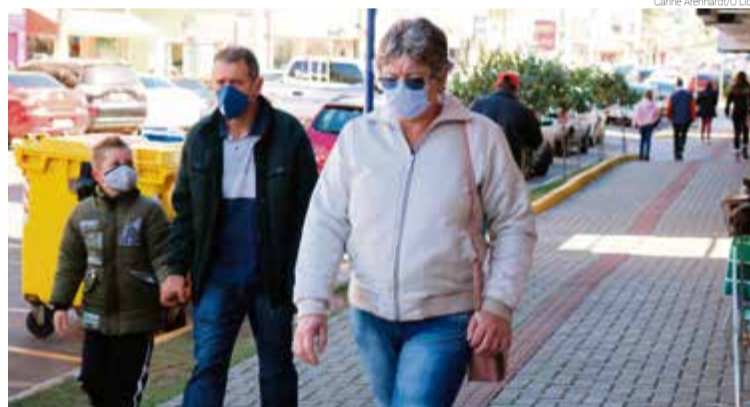
Carne Arenhardt/O Líder

O frio que chegou veio com todo o rigor. Os cuidados devem ser redobrados, nos precavendo de gripes e resfriados que podem desencadear em moléstias mais graves. É hora de se agasalhar bem, e cabe uma sugestão: nosso comércio está todo com ótimas promoções de fim de estação, com descontos que valem a pena para renovar o guarda-roupa.