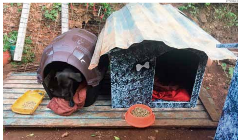
Itens são doados a pessoas com baixa renda

Mas as vendas da campanha Chá Solidário continuam. Os pacotes custam R$ 15 e a venda auxiliará no pagamento de dívidas da entidade.