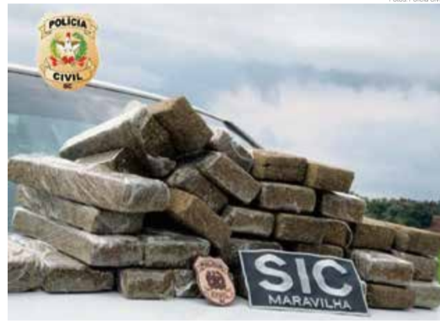
Droga foi localizada na casa e no carro do suspeito

Segundo a polícia, os agentes realizaram diligências com objetivo de identificar o traficante, bem como qual veículo era utilizado para o transporte da droga. Assim, os policiais civis realizaram a abordagem do veículo, quando se deslocava para Maravilha, sendo encontrados 22 quilos de maconha. Posteriormente, foram encontrados mais