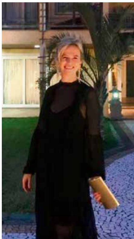
Geni, abrace os novos começos e os novos desafios dessa nova fase. Feliz aniversário!