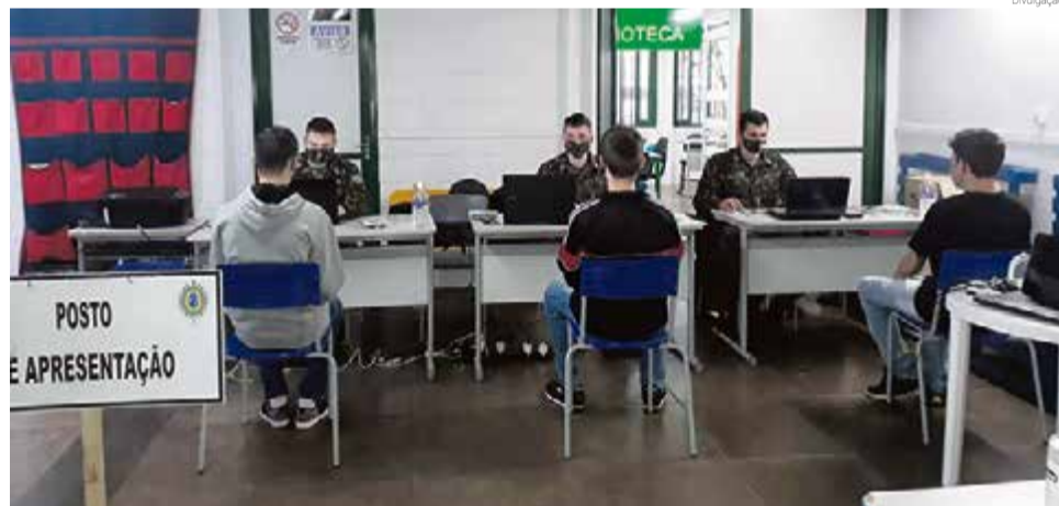
Série de testes para o alistamento foi realizada no Centro Educacional Mundo Infantil