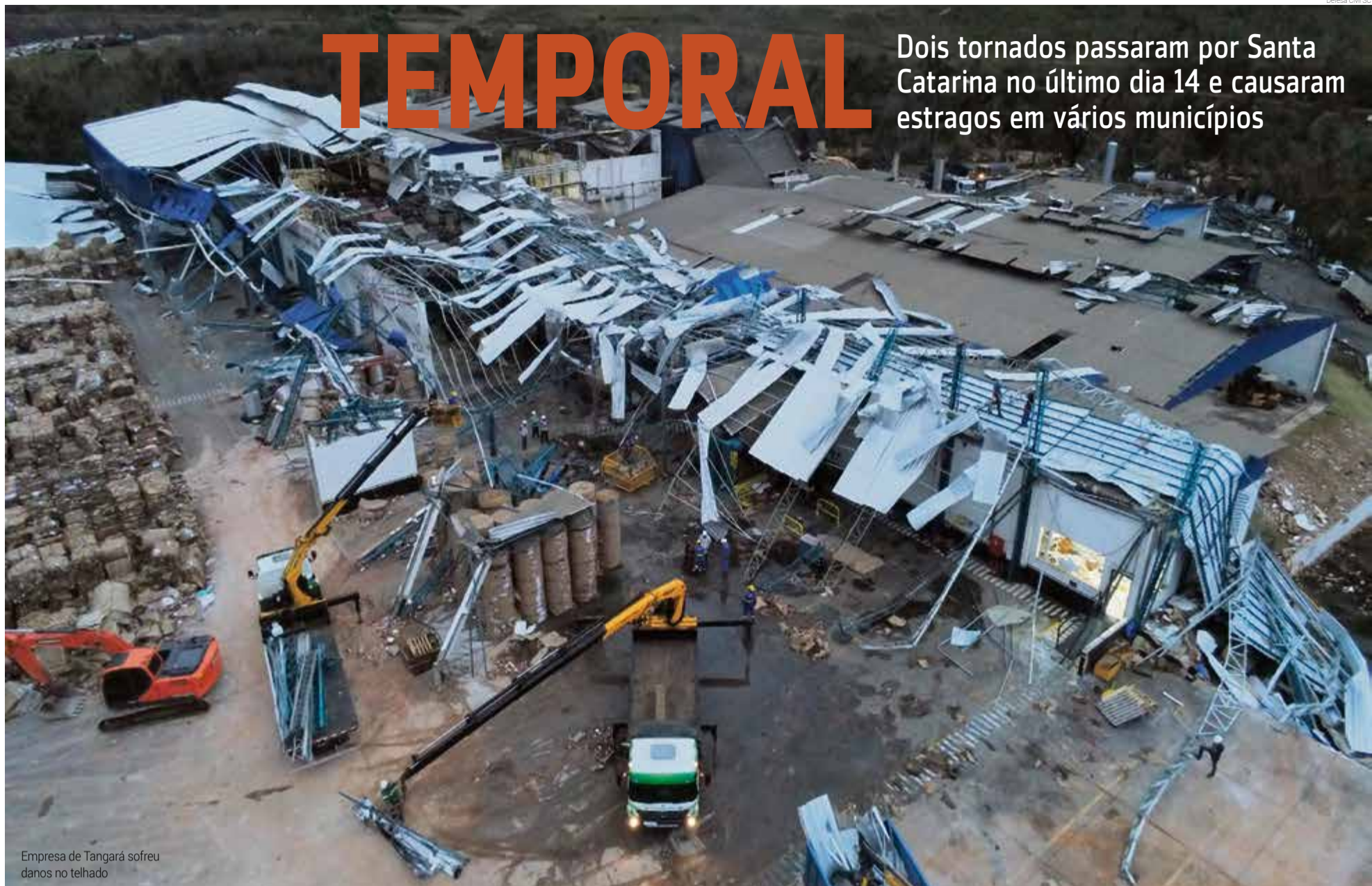
Empresa de Tangará sofreu danos no telhado

Dois tornados passaram por Santa Catarina no último dia 14 e causaram estragos em vários municípios