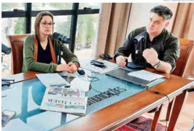
Professores visitaram o novo estúdio da Rádio Líder e explicaram as possibilidades

Eles abordaram a necessidade de mudança no campo, mas com a permanência do recurso humano e o trabalho com pessoas, um dos mais