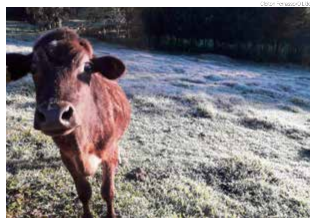
Registro feito na Linha Poletto, interior de Maravilha, na sexta-feira (21)