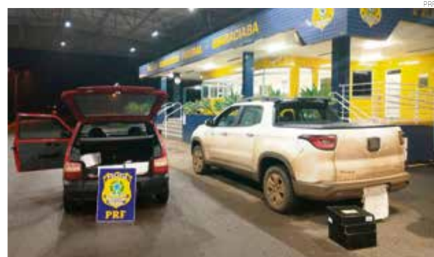
Caixas estavam em dois veículos, na BR-282 e em um posto de combustíveis

ções, os policiais abordaram um veículo Fiat Toro e um