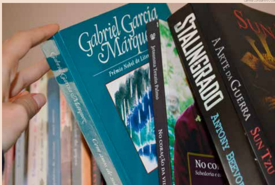
Em 2019, país produziu 395 milhões de livros físicos

Segundo levantamento da consultoria Nielsen Book, 395 milhões de livros físicos foram produzidos no último ano no Brasil. Entretanto, o acesso a esses produtos muitas vezes ainda é privilégio de uma minoria - 63% dos compradores são da