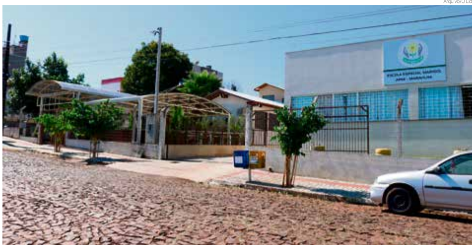
Sede da Apae Marisol em Maravilha