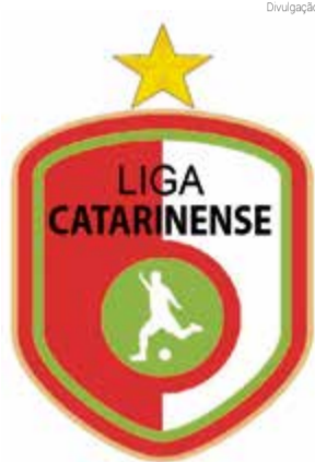
Entidade pede respeito pelo futsal

O acaso que o futsal está sendo submetido demonstra que apenas o futebol, que gira rios de dinheiro, é que vale a pena