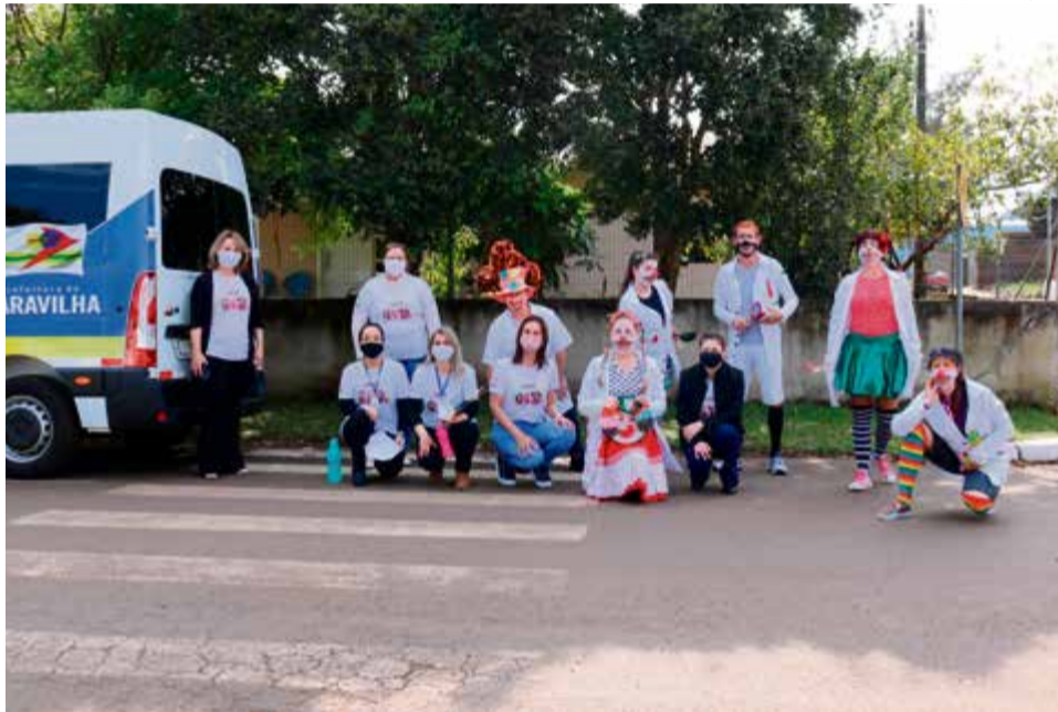
Equipe e lideranças inauguraram o projeto na segunda-feira (17)