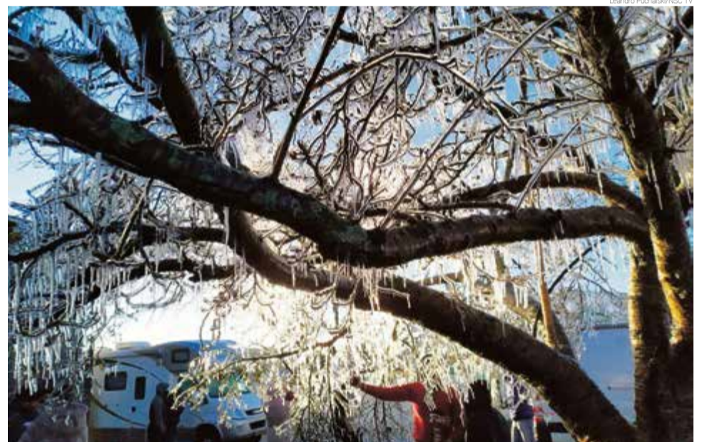
Árvore ficou com galhos congelados em São Joaquim

Na serra catarinense os termômetros chegaram a registrar -8^{\circ}\text{C} no amanhecer de sexta-feira, entre Urubici e Bom Jardim da Serra. A região serrada no Estado também registrou neve na quinta-feira (20), atraindo centenas de turistas. Já no início da semana a rede hoteleira confirmou que estava com 100% de ocupação, respeitando a capacidade máxima devido à pandemia. Os turistas puderam visualizar até galhos de árvores congelados em municípios da Serra.