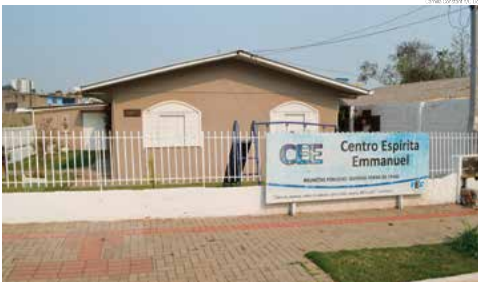
Sede própria fica localizada na Avenida Presidente Kennedy

O mês de aniversário do Centro Espírita Emmanuel terá uma programação especial e algumas ações diferenciadas, que ainda serão anunciadas. Você pode acompanhar os trabalhos e explanações públicas por meio do Facebook e Instagram.