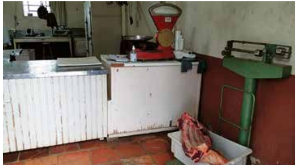
Local não tinha permissão para abate e estava irregular

Segundo a polícia, foi constatado que em uma propriedade rural estaria funcionando um abatedouro sem o devido licenciamento ambiental e sem cumprir as normas sanitárias. “Na mesma propriedade, constatou-se a atividade de criação de suínos sem o devido licenciamento ambiental, bem como a criação de javalis e de híbridos (cruzamento de javali com suíno, conhecido como javaporco)”, informou a polícia.