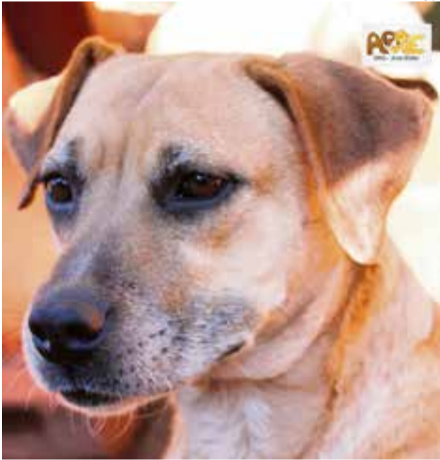
ONG atende mais de 200 animais em situação de abandono