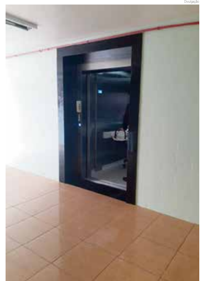
Segundo elevador dá acesso entre primeiro e segundo piso

Os recursos para a instalação dos elevadores foram repassados ao Hospital através de emenda parlamentar do senador Espiridão Amim (PP) no valor de R$ 195.000,00, com contrapartida de recursos próprios no valor de R$ 127.400,00. O total investido nos dois elevadores é de R$ 242.400,00, mais custos de instalação (mão de obra, material de construção, escadas externas, marmores, parte elétrica) no valor R$80.000,00, somando assim R$ 322.400,00 em custos totais.