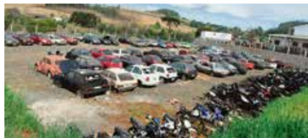
Pátio possui diversos veículos, novos e antigos, que aguardam desfecho

No pátio de Maravilha estão veículos apreendidos pelas polícias Civil e Militar, sendo leiloados apenas as motos e carros recolhidos pela Polícia Militar. São aproximadamente