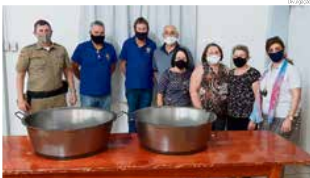
Entrega contou com a presença de membros das duas entidades

membros da entidade, agradeceu o gesto, reforçando a disposição em manter a parceria de longa data que existe entre o Rotary e o Lar de Convivência. A presidente do Rotary destacou que foi mais um momento de reconhecimento e fortalecimento entre as duas entidades. A parceria promete novas oportunidades de surpreender a comunidade maravilhenense com eventos deliciosos.