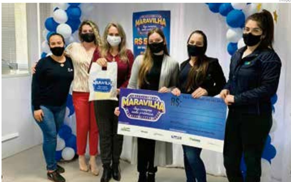
Empresas receberam blocos e itens personalizados para divulgar a campanha

Além dos blocos, as empresas participantes receberam itens personalizados para divulgação da Campanha. Nessa edição serão R$ 50 mil em prêmios e 51 ganhadores em cinco sorteios.