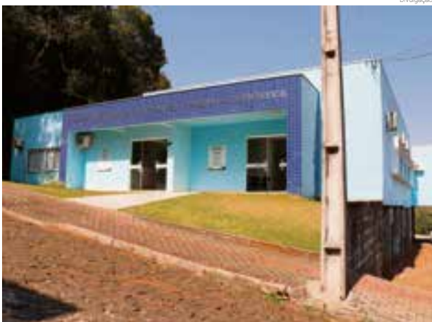
Benefício é concedido através da Secretaria de Assistência Social

Para os novos pedidos de Isenção do IPTU, dívida ativa e contribuição de melhoria, os munícipes interessados deverão comparecer na Secretaria de Assistência Social, nos meses de setembro, outubro e novembro. O atendimento é nas segundas ou sextas-feiras para avaliação pela assistente social. Nas terças-feiras à tarde, as avaliações dos novos pedidos serão feitas no CAMU – Centro de Múltiplo Uso do Bairro Bela Vista.