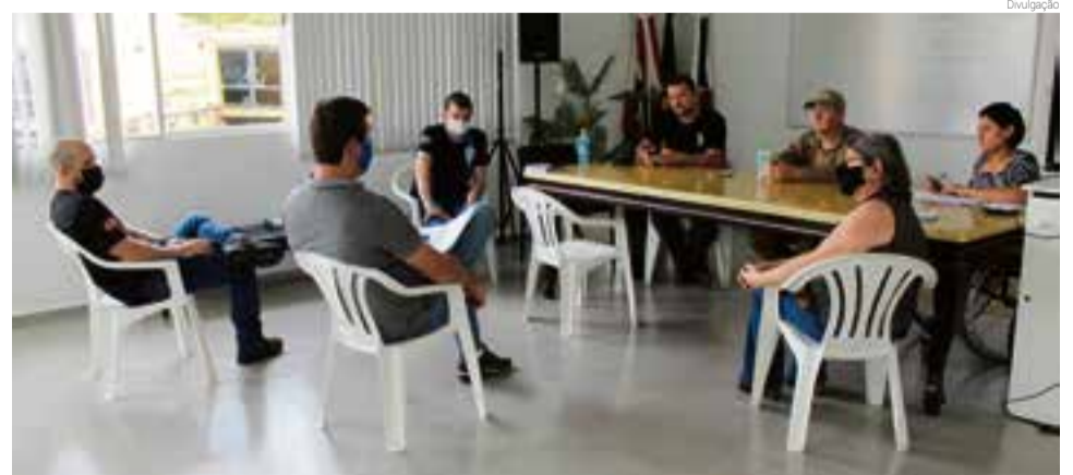
Encontro foi realizado no último dia 18

Os representantes das instituições de ensino trouxeram para o encontro a necessidade da alteração dos estacionamentos próximos