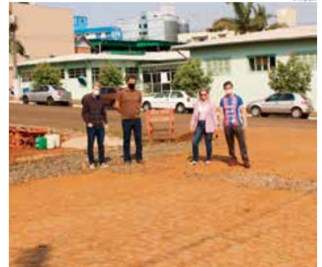
Visitas foram realizadas durante a última semana na cidade e interior

Praça da Juventude e o Heliponto que irá agilizar ainda mais os atendimentos de urgência também foram avaliadas. Conforme a prefeita, as visitas são importantes para que as obras ocorram de maneira eficiente e traga o resultado esperado.