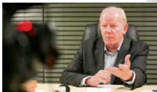
Deputado comenta investimentos previstos para a região

ta que até o próximo ano, quase toda a rodovia estará em obras, que ao todo podem chegar a ter investimentos de R$ 700 milhões. “Depois vamos em busca dos recursos para pavimentar os 56 quilômetros entre Mondai e Itapiranga”, explica.