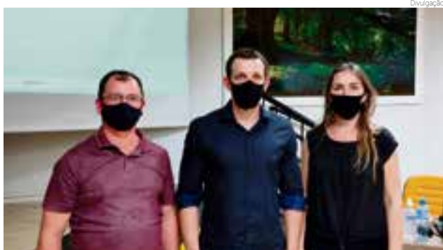
Representantes do município avaliam de forma positiva o evento

Conforme Senhor, a capacitação foi de extrema importância, pois a preocupação com o destino adequado do esgoto produzido por uma casa deve começar no momento em que ela é projetada, é fundamental que a residência seja legalmente conectada à rede de esgoto de forma correta.