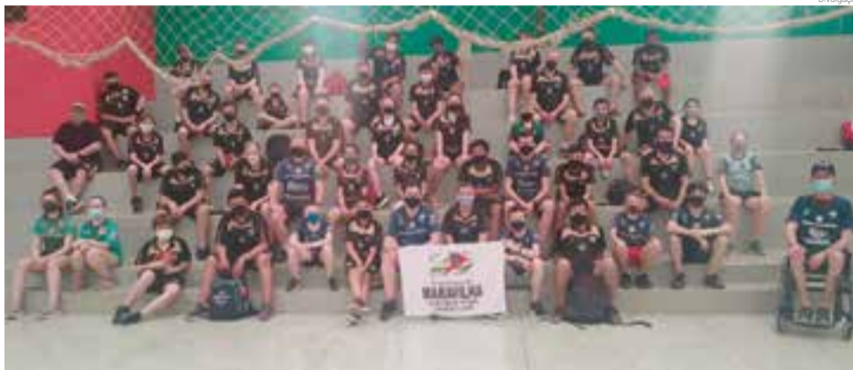
Participaram do sub-11 até o adulto, nos naipes masculino e feminino, olímpico e paraolímpico

sor, todos os protocolos de vigilância sanitária de Maravilha e São Domingos foram observados.