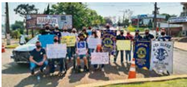
Na parte da manhã a demonstração ocorreu em frente a Casa do Agricultor

Com o objetivo de conscientizar a população sobre os cuidados no trânsito, o Leo Clube Omega de Maravilha, em parceria com Lions Clube Maravilha Oeste, Lions Clube Maravilha, Corpo de Bombeiros e Polícia Militar desenvolveu uma ação no sábado (21), em dois pontos estratégicos. A entidade ainda contou com a parceria da CT Auto Peças que emprestou uma sucata de carro para fazer a demonstração e o