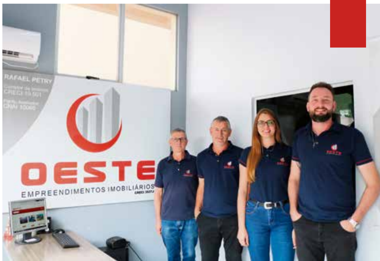
Equipe da empresa Oeste Empreendimentos Imobiliários de Maravilha