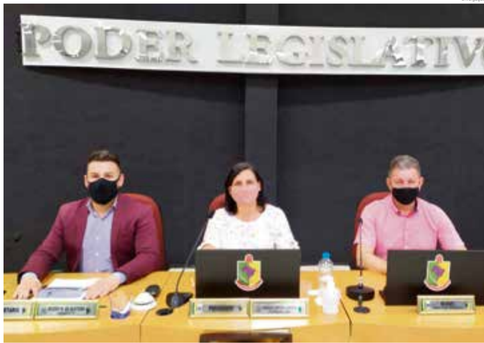
Sessão foi realizada na última segunda-feira