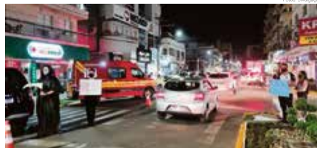
À noite foi realizado na Avenida Sul Brasil

do Agricultor. Na oportunidade, pessoas seguravam cartazes com frases de impacto, algumas estavam em cadeira de rodas, enfaixadas e uma pessoa ainda representava a morte.