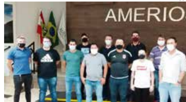
Representantes que foram empossados durante o encontro