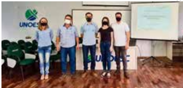
Durante a capacitação vários assuntos sobre liderança foram abordados

A Cooperativa Regional Auriverde realizou um treinamento de Desenvolvimento de Lideranças em parceria com a Unoesc para os colaboradores, onde diversos assuntos foram trabalhados ao longo do treinamento: desenvolvimento contínuo, relações interpessoais, análise e solução de problemas.