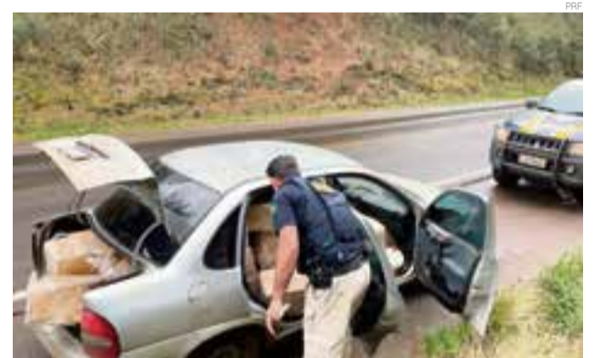
Veículo estava lotado com camarão e foi flagrado em Água Doce

O motorista, de 26 anos, disse que o destino da mercadoria seria restaurantes da região de Curitiba. Ele vai responder pelo crime de contrabando. A mercadoria e o veículo foram entregues à Receita Federal em Joaçaba, que deve descartar o produto por estar impróprio ao consumo humano.