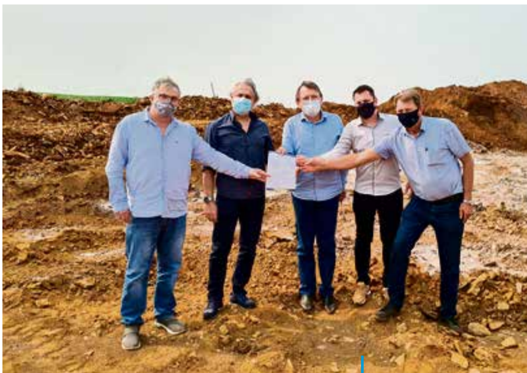
Entrega da ordem de serviço, na segunda-feira (23)

Vencedora da licitação, a empresa Gaia Rodovias tem o prazo de 12 meses para executar o projeto, de abertura do traçado de 9,5 quilômetros e pavimentação asfáltica de um trecho de 1,5 quilômetro. O investimento nesta obra é de R$ 14.240.072,73, recurso que foi destinado pelo governo do Estado.