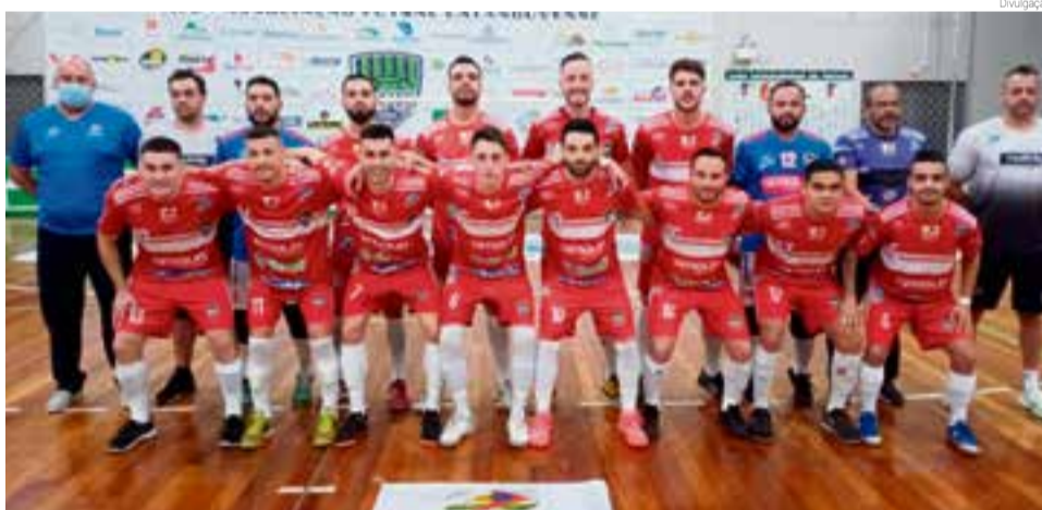
Depois de virar o placar time sofreu revés e perdeu

ses voltam em quadra neste sábado (28), pela série