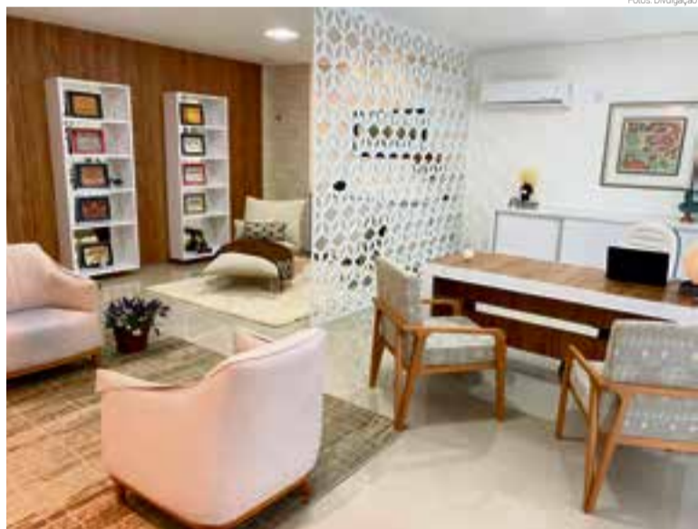
Atendimentos são realizados na Policlínica, Centro de Maravilha