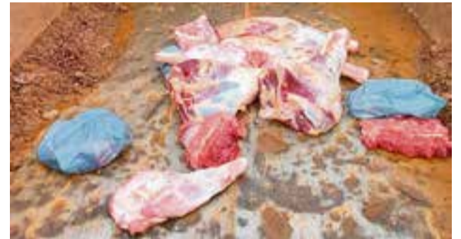
Carne apreendida foi descartada pelos órgãos sanitários

Diante das irregularidades constatadas, o proprietário foi autuado. Ainda, mais de 300 quilos de carne foram apreendidos e destinados para um aterro sanitário.