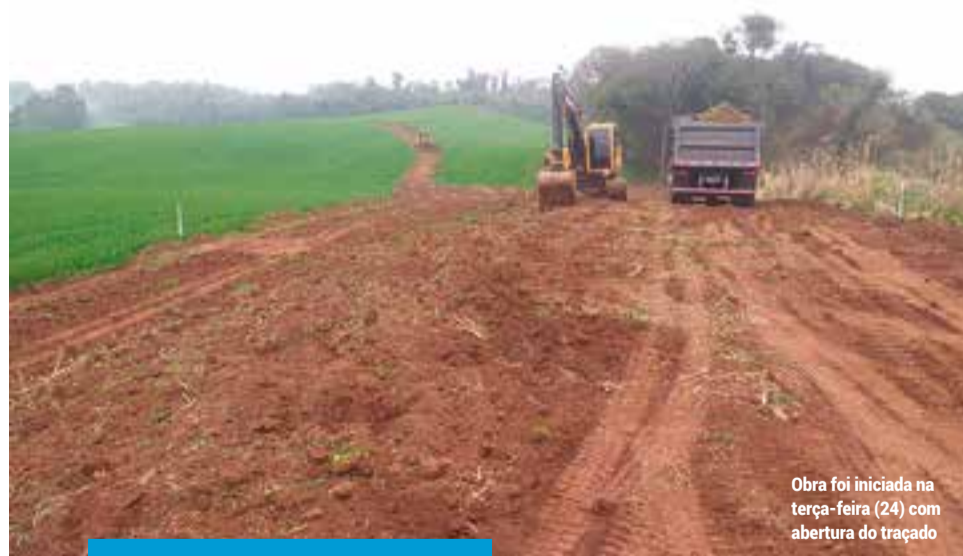
Obra foi iniciada na terça-feira (24) com abertura do traçado

Nesta primeira etapa, a empresa vai fazer a abertura de todo trajeto de 9,5 quilômetros, com início no entroncamento das BRs 282 e 158 até a localidade conhecida como Pinheiro Grosso. Todo trajeto já fica com o trabalho de drenagem concluído, terraplanagem, desmatamentos, limpeza, supressão de vegetação, escavações, cortes e aterros necessários.