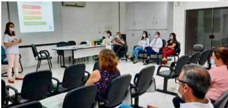
Resultados foram apresentados aos pais no último encontro realizado dia 24

A atividade consistiu em sete encontros, um por semana, realizados no âmbito escolar respeitando os decretos municipais e estaduais em vigor, sobre distanciamento,