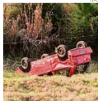
Veículo ficou com as rodas para cima após capotamento

De acordo com o Samu, a ocupante do veículo estava com corte profundo na cabeça, hemorragia intensa e possível