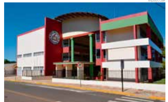
Escola tem um ponto de vendas na secretaria

O valor da pizza é R$ 20 e os sabores disponíveis são: frango, bacon, calabresa, mista (chocolate branco e preto). A entrega será no dia 17 de setembro, nas dependências do educandário, das 10h às 12h e das 13h às 17h.