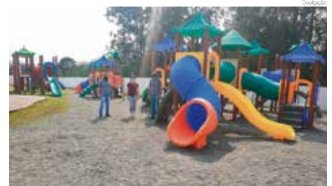
Novos brinquedos foram instalados no parque