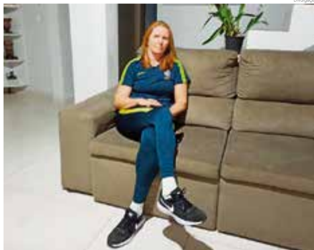
Atualmente a profissional trabalha como treinadora de goleiras da categoria sub-17 da Seleção