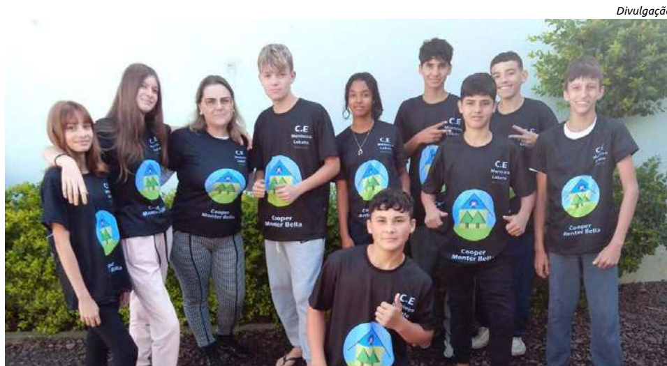
Estudantes divulgaram o projeto na agência do Sicredi

Na cooperativa os alunos podem desenvolver atividades econômicas, sociais e culturais. Com a comercialização dos produtos os cooperados não apenas adquirem uma compreensão mais ampla sobre Educação Financeira, mas também estabelecem contato direto com o público. Através disso, os adolescentes aprimoram suas habilidades de comunicação e aprendem sobre a importância do trabalho em equipe.