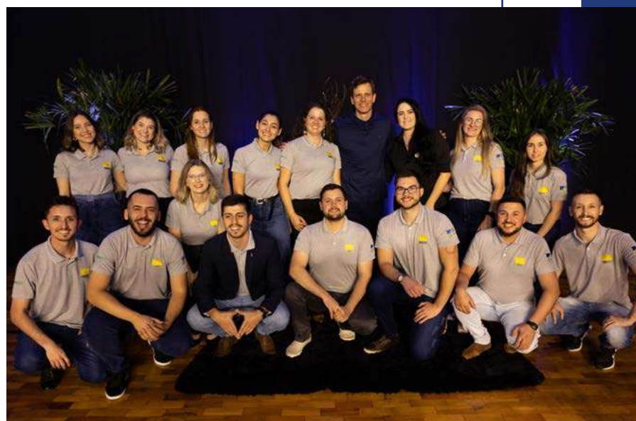
Evento foi organizado pelo Núcleo do Jovem Empreendedor