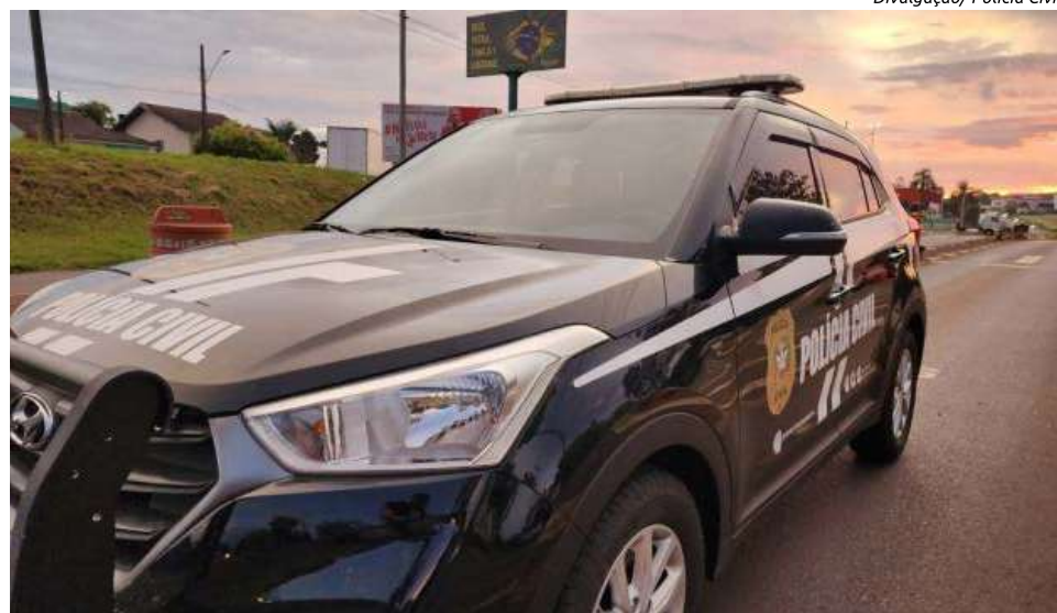
Operação contou com a participação de diversos policiais da região