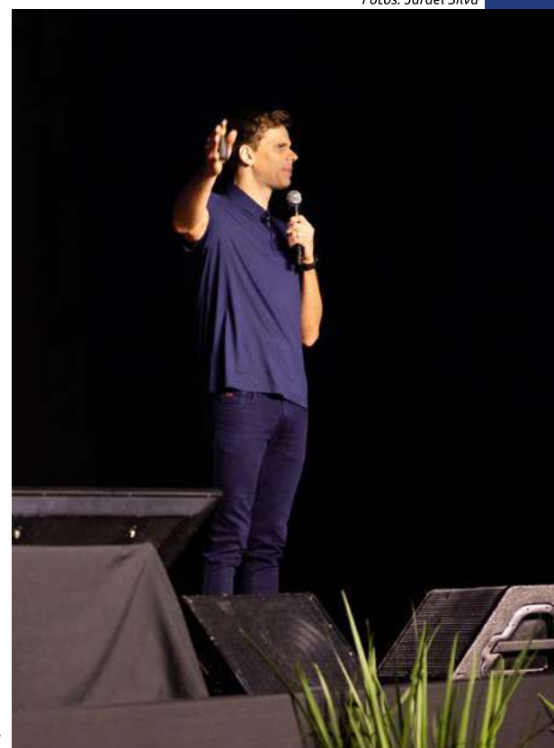
Cesar Cielo é nadador, medalhista olímpico e recordista mundial