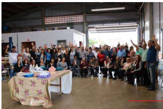
Em 2019, dez grupos de vizinhos promoveram confraternizações

O projeto Vizinho Maravilha já havia sido desenvolvido em anos anteriores, contando com ampla participação da comunidade local. Em 2019 – antes da pausa por conta da pandemia, a iniciativa reuniu aproximadamente 450 pessoas e foi considerada muito positiva pelos organizadores e também pelos participantes, que contaram com momentos de conversa e descontração.