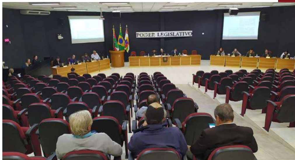
Sessão foi prestigiada pelos maravilhenses