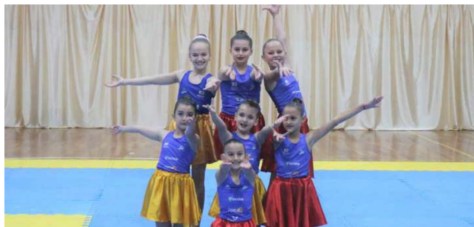
Coreografias encantaram o público