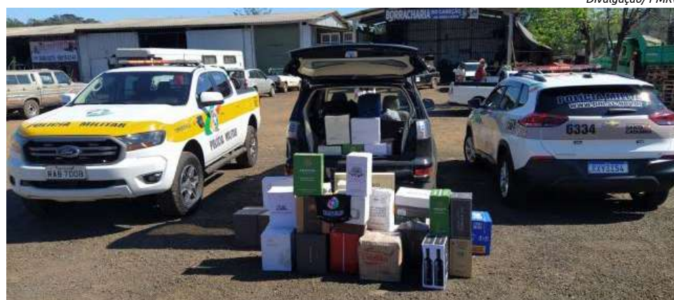
Garrafas de vinho estavam dentro do porta-malas de veículo