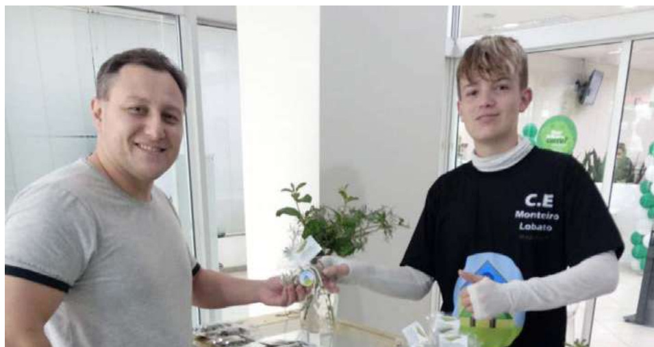
Produtos foram apresentados no local