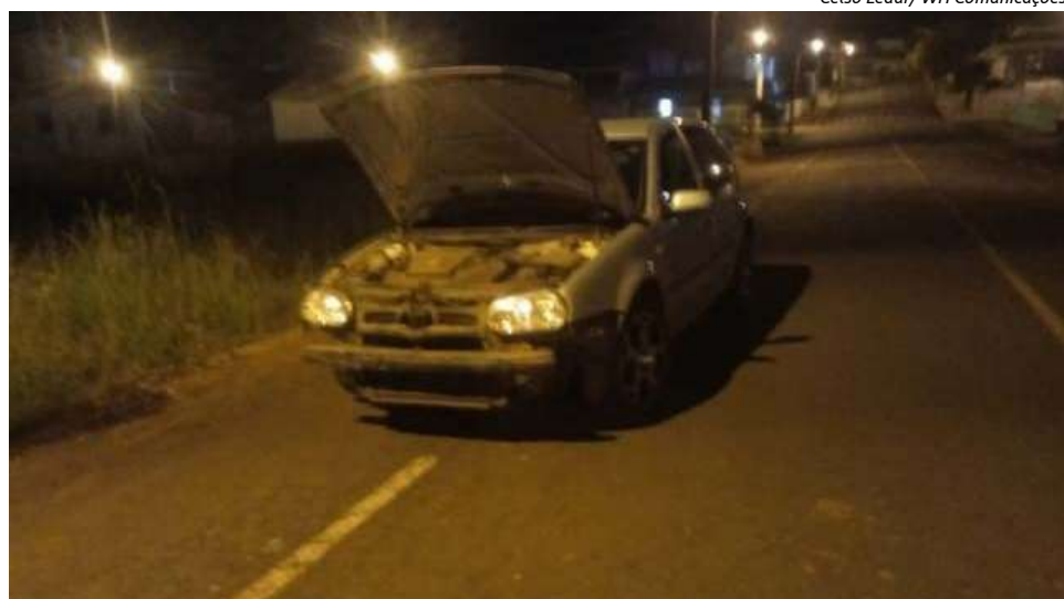
Acidente resultou em danos materiais