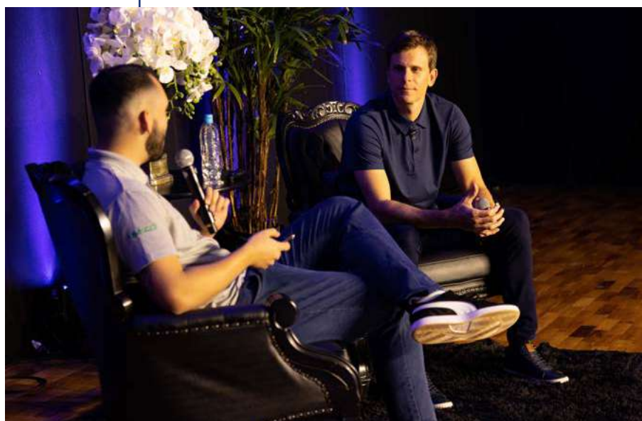
Palestra foi promovida na última semana