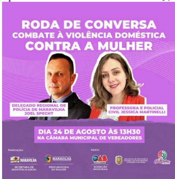
Evento será realizado na próxima semana

e pela Prefeitura de Maravilha, por meio da Secretaria de Assistência Social. A ação conta ainda com apoio da OAB, DPCAMI e Rede Catarina.