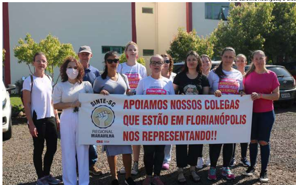
Com cartazes, participantes se reuniram na Coordenadoria Regional de Educação