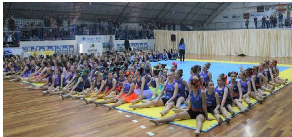
Cerca de 190 atletas compareceram na ação