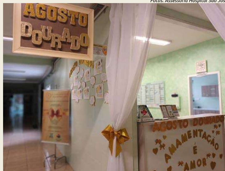
Decoração e atividades especiais marcam a campanha

▲ “a amamentação vale ouro, pois é símbolo de saúde e também uma prova de amor”.