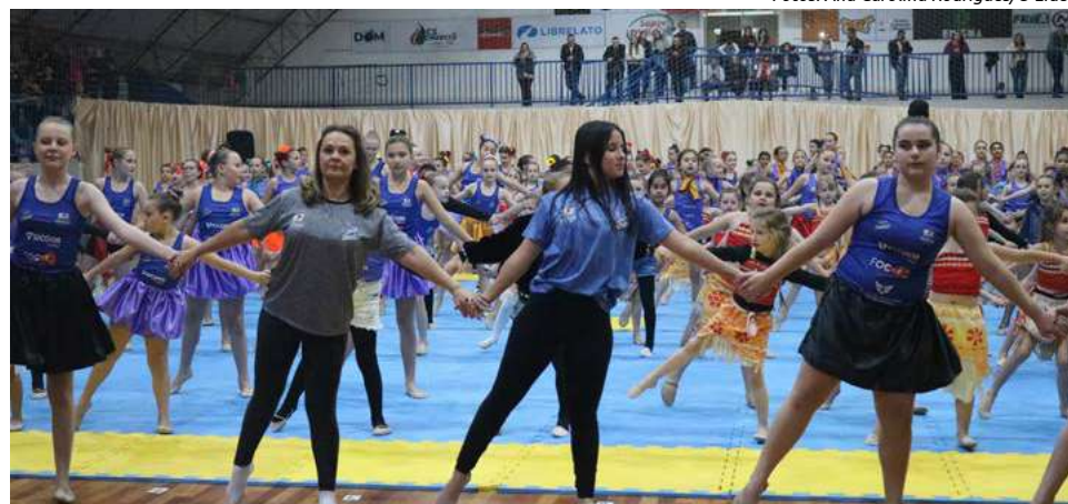
Professoras participaram das apresentações