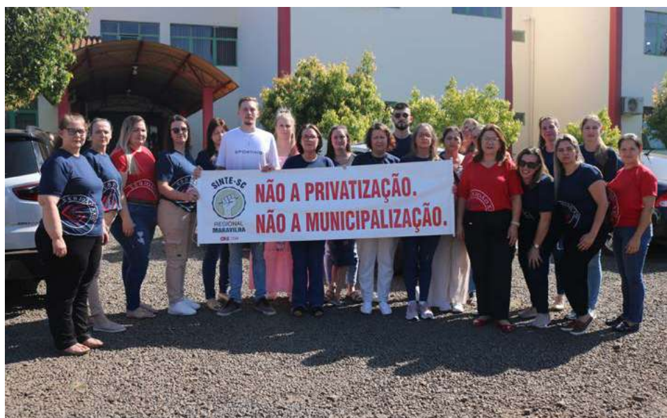
Ato foi realizado na tarde de ontem (17)