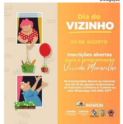
Além da confraternização, iniciativa visa a promoção de segurança

A programação acontece das 8h às 14h e cada grupo terá responsabilidades sobre suas confraternizações, como controle do som alto e a coleta dos lixos e limpeza do local. A organização também conta com o apoio do Conselho Municipal de Turismo (Comtur), da Polícia Civil, Polícia Militar e Corpo de Bombeiros.