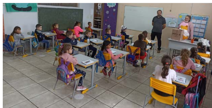
Higiene e saúde bucal foram os assuntos tratados

Na ocasião foram abordados temas como higiene e saúde bucal, além de orientações de higiene bucal, também foram entregues kits de escovação contendo estojo, escova, creme dental e fio dental. A direção da escola agradeceu a parceria entre Saúde e Educação.