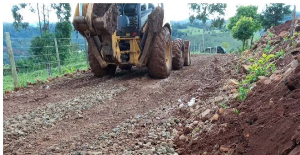
Vinte novos bueiros foram feitos no interior do município

Em conversa com o vice-prefeito Jairo Luft, com o secretário da pasta, eles lembram que foi realizado um levantamento para avaliar os bueiros para reformar e os locais para colocar novos. “Foram mais de 20 bueiros novos e dez concertos com emendas e também houve a colocação de placas de sinalização em todo o nosso