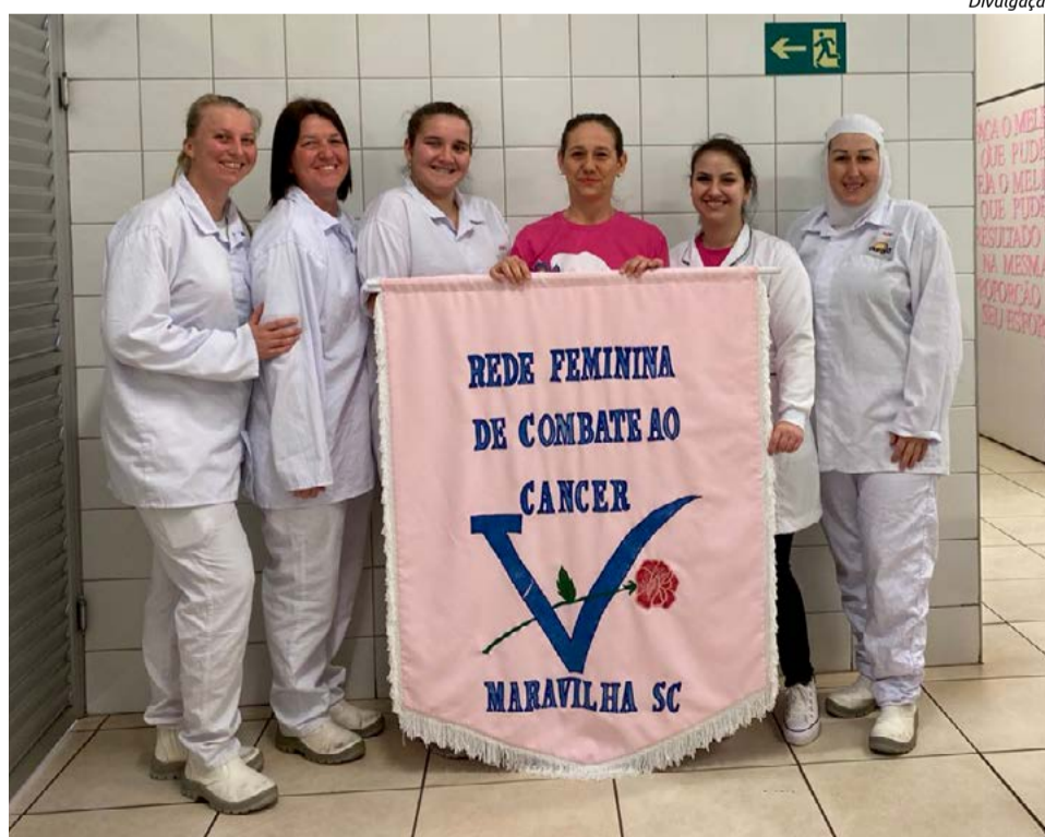
Visitas nas empresas já atenderam 70 mulheres

Desde a sua fundação, há 25 anos, a Rede Feminina vem prestando grande auxílio às mulheres maravilhenses e de municípios vizinhos, através do grupo de vo-