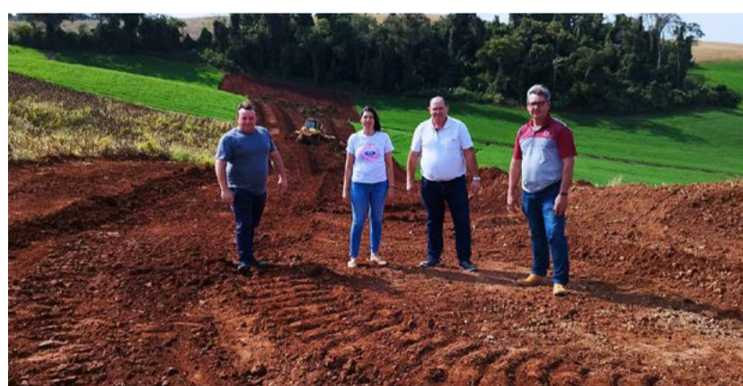
Equipe fez uma visita nas obras que estão sendo executadas pela Gaia Rodovias

“O sorriso no rosto, é uma consequência do tão sonhado asfalto sair do papel, finalmente podemos dizer, agora esta obra, tão sonhada pela população está sendo executada. Isso aqui foi muito esperado, é um momento histórico para mim e para a população bom-jesuense, porque esperamos há muitos anos essa ligação asfáltica”, finaliza o prefeito.