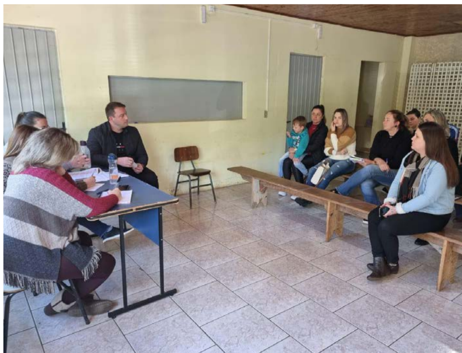
Reunião foi para alinhar os detalhes da semana da Pátria no município

O hasteamento das bandeiras será realizado todos os dias às 8h e o arreamento das bandeiras será às 16h30, com organização e apresentação das entidades e escolas, tendo o seguinte cronograma: 01: Departamento de Assistência Social e Cras; 02: Escola