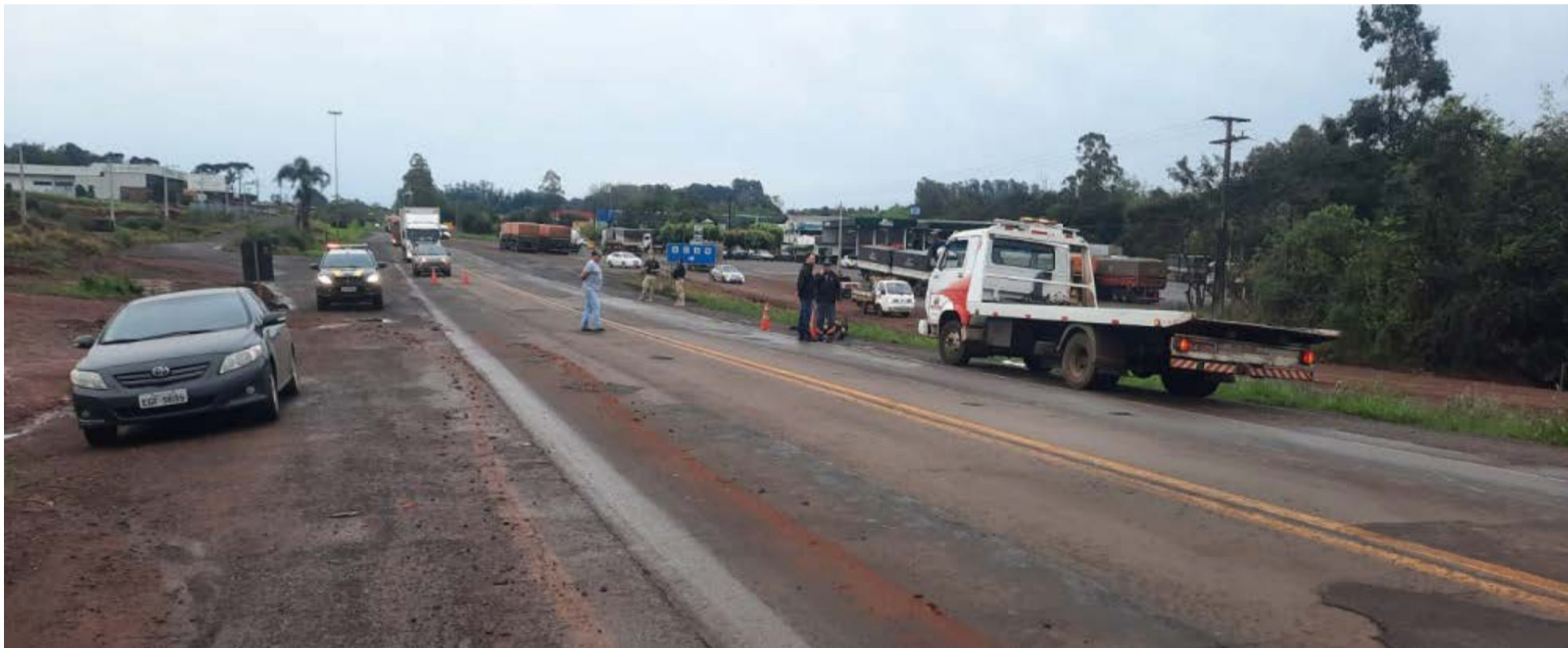
Homem morreu no local do acidente