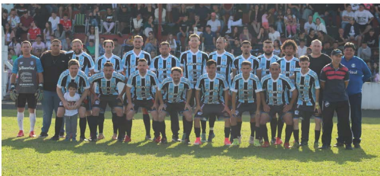
O Esportivo tem um certo conforto por ter vencido o primeiro jogo