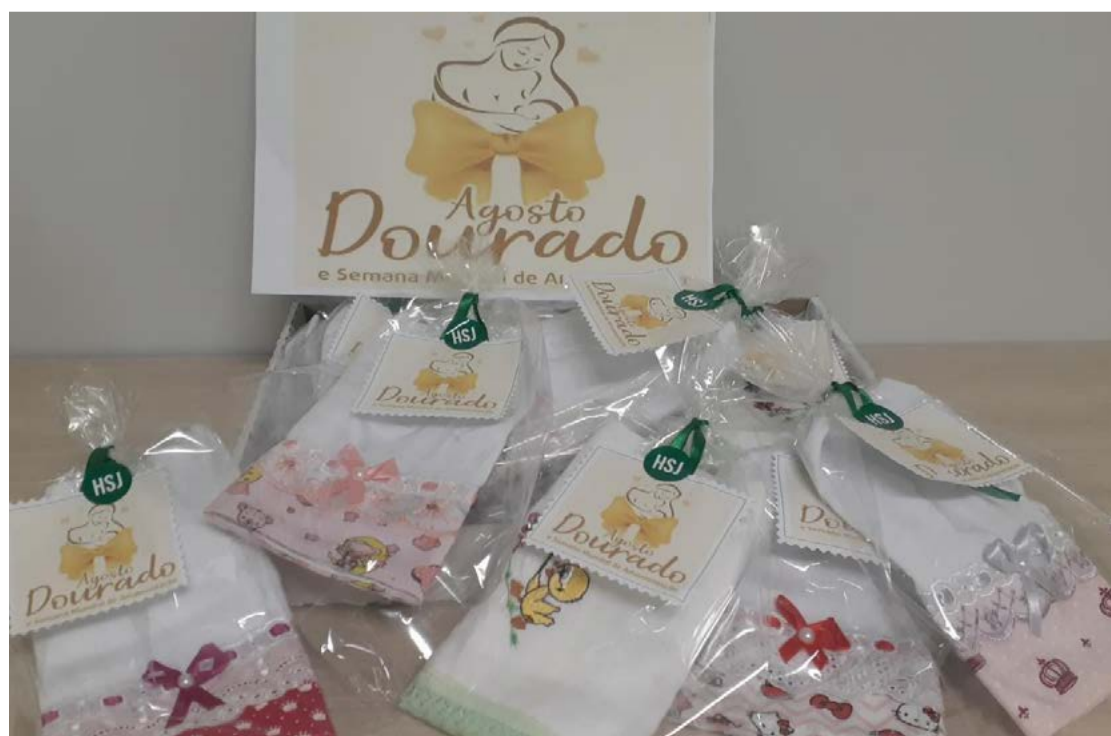
Mães recebem também uma toalhinha e informações