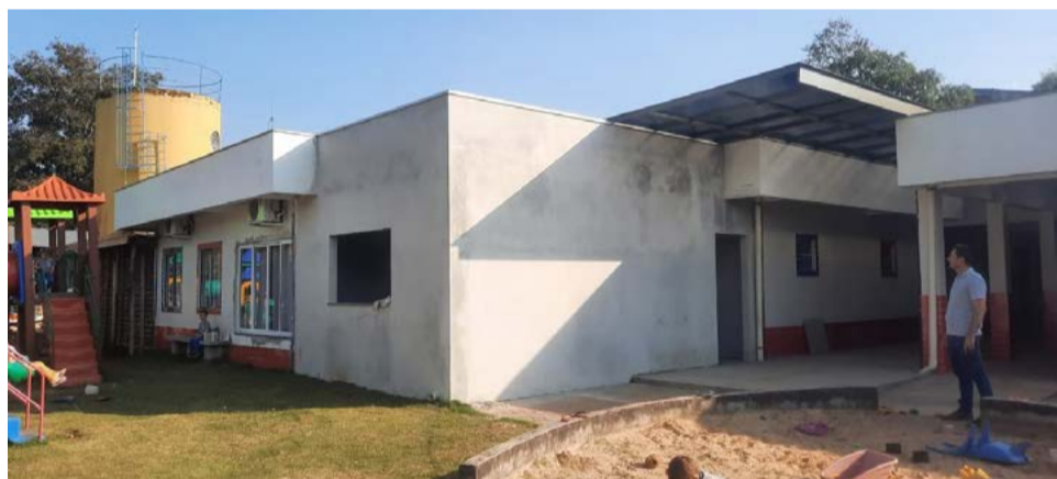
Prefeito visitou o local e pode acompanhar as reformas que estão sendo realizadas