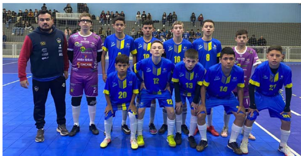
E no sub-18 mais uma vitória agora por 2 a 1