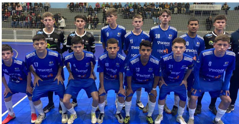
Sub-16 placar de 2 a 0