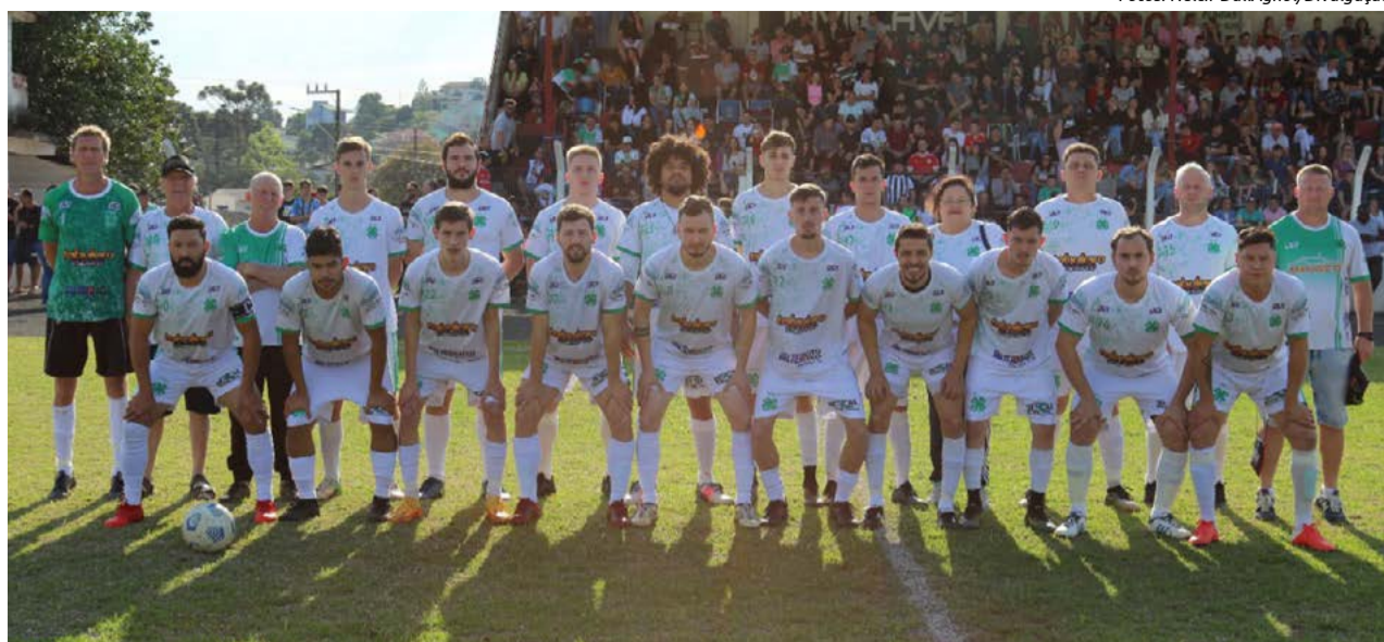
4S Amizade no primeiro jogo saiu na frente, mas tomou empate

Já na categoria principal a disputa está sendo travada pelo Esportivo Bela Vista e 4S Amizade. O Esportivo tem leve favoritismo por ter ganho a primeira partida pelo placar de 1 a 0. O empate favorece o time do Bairro Bela Vista. Os jogos acontecem na tarde de domingo (21).