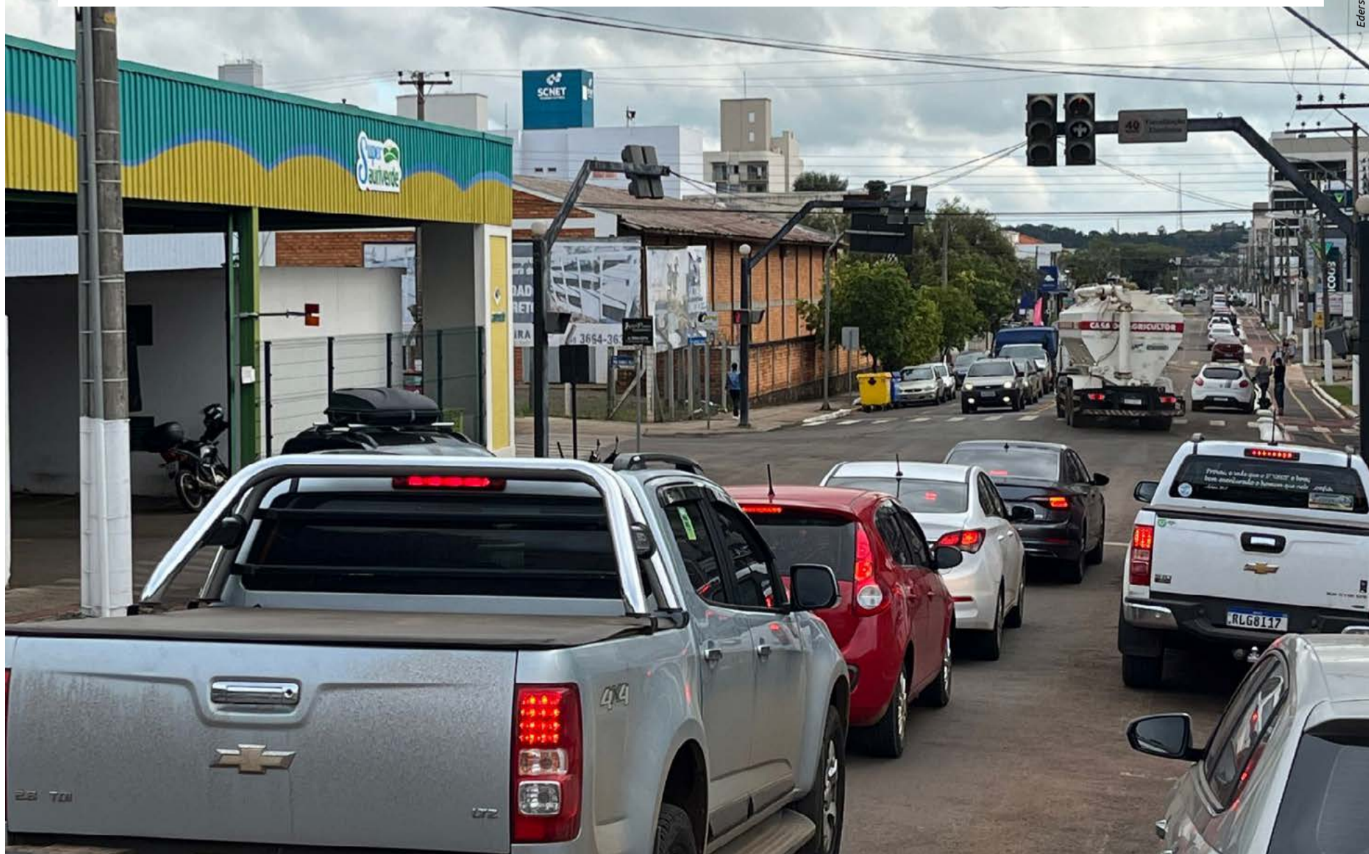
Local tem intenso trânsito em horário de picos