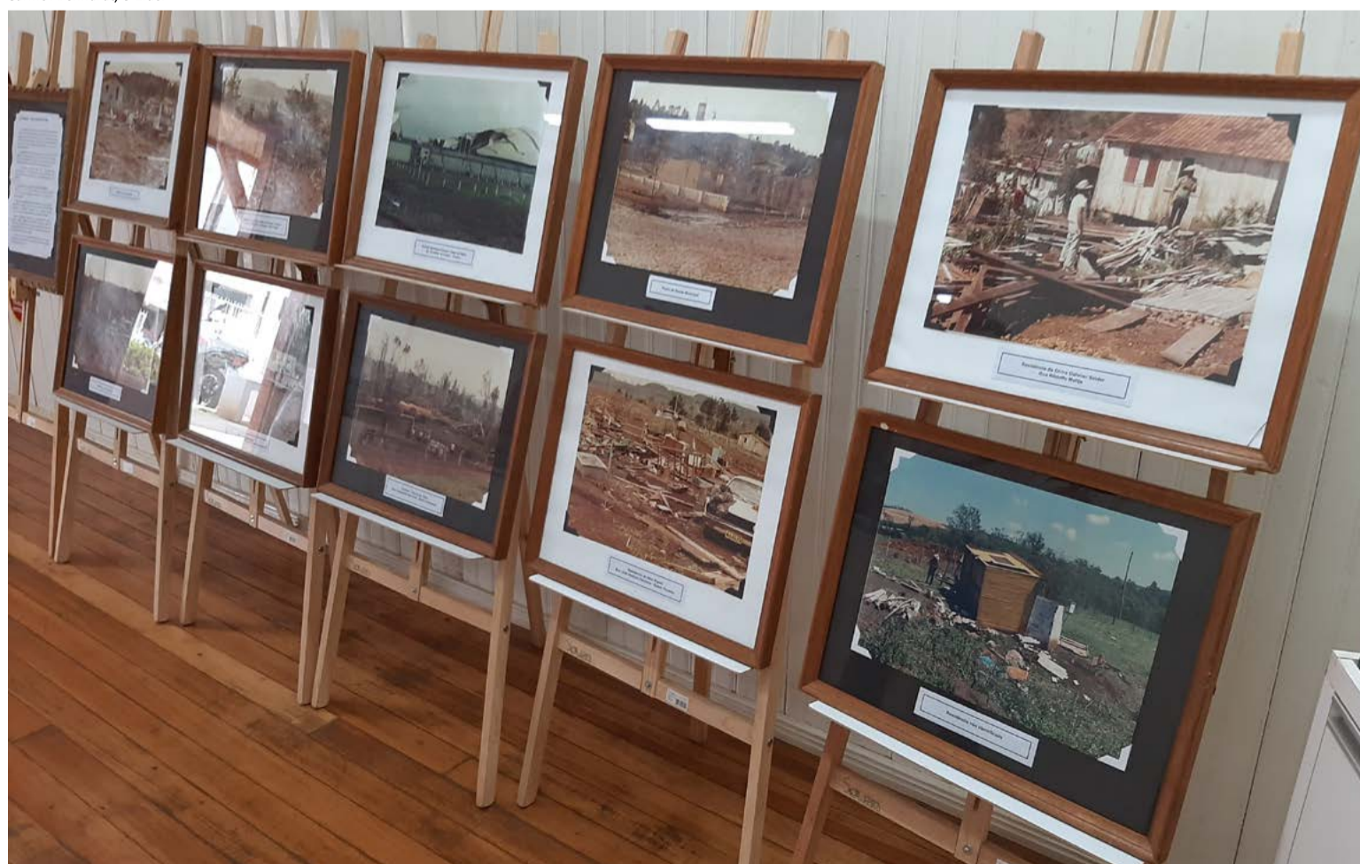
Exposição no Museu conta a história do vendaval