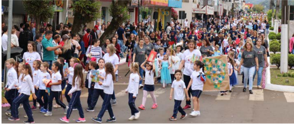
Desfile cívico será retomado após dois anos suspenso