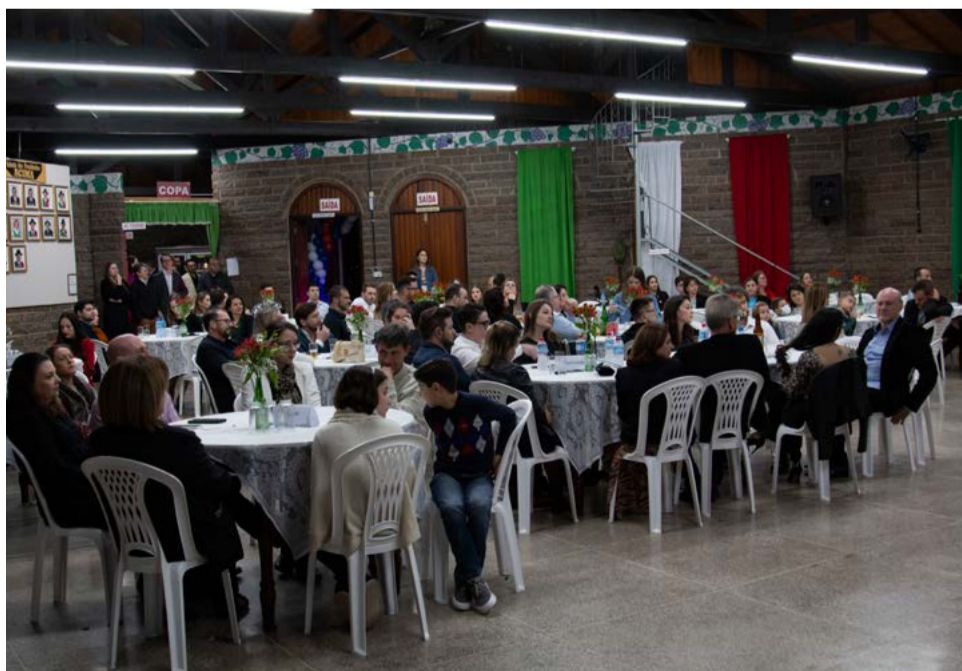
Espaço ficou lotado por profissionais e seus familiares