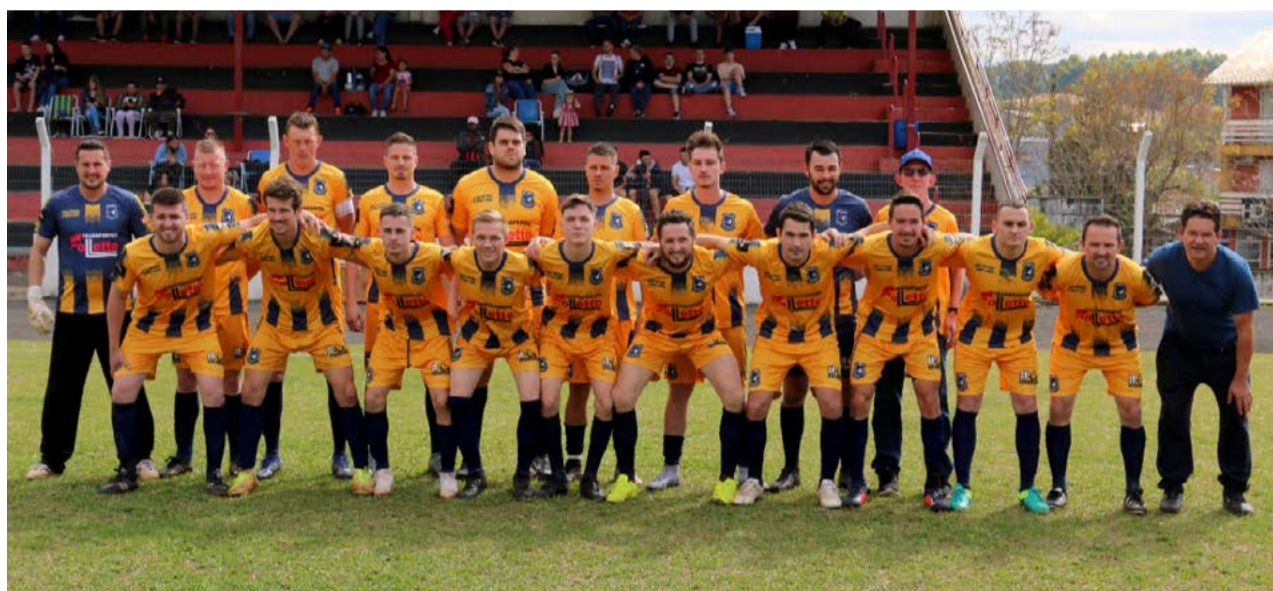
Canarinho buscou forças correu atrás e empatou agora está tudo igual