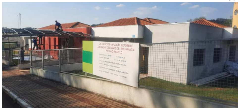
Entrada e corredores foram cobertos com acrílico