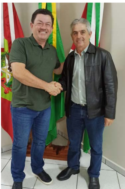
Transmissão de cargo ocorreu na terça-feira no gabinete do prefeito

Dentre as principais ações em andamento, estão o asfaltamento do trecho entre a cidade e a Linha Pedra Branca, a ampliação do Centro Educacional, a construção da quadra esportiva sintética e a sala de lazer anexa ao ginásio de esportes, além da conclusão da garagem da Secretaria de Agricultura e da ampliação