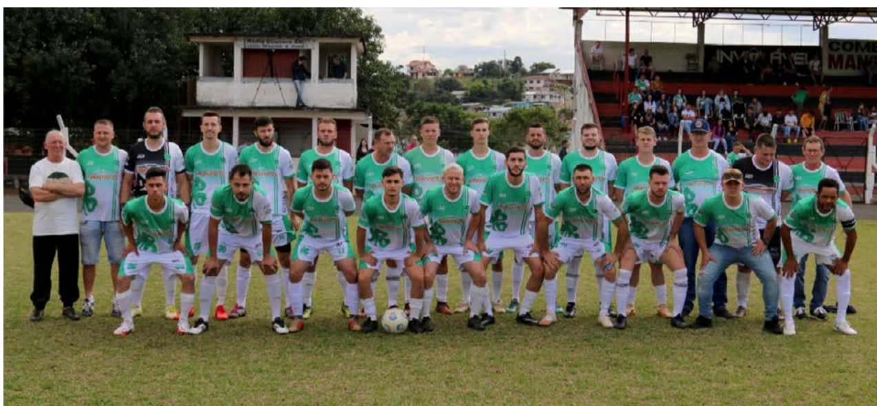
Na categoria principal o 4S Amizade vai ter que buscar o resultado