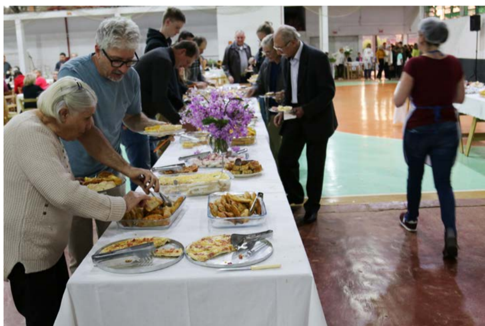
Café colonial já é tradicional no município