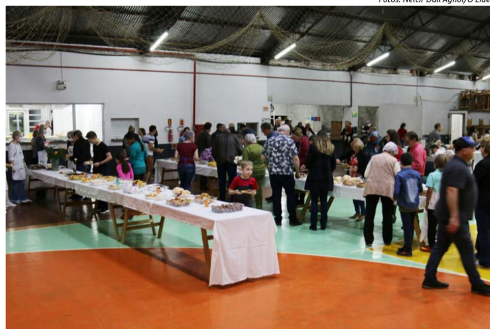
Mais de 500 fichas foram vendidas