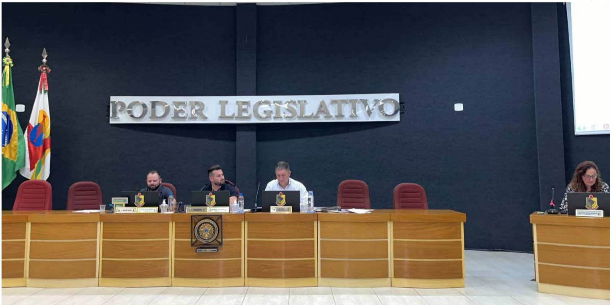
Denominação de mais uma creche nova em Maravilha teve nome votado