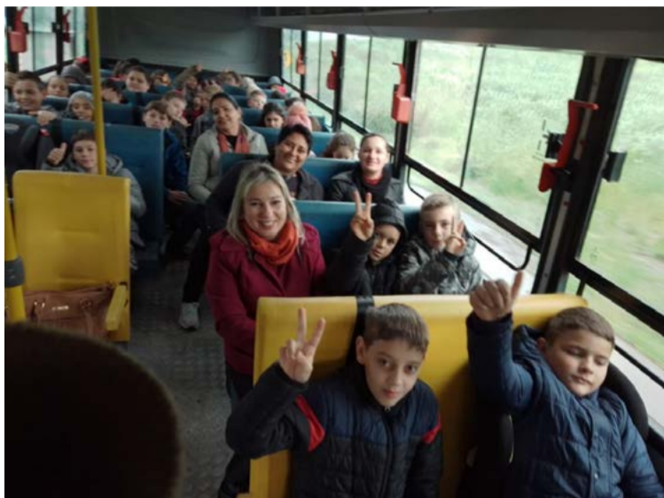
Alunos tiveram uma tarde diferenciada na última semana

Os filmes contribuem para o enriquecimento do intelecto das crianças, pois permitem que elas aprendam a ouvir, e comunicar-se sobre várias situações vividas pelos personagens. Pensando nisso no último dia 10 de agosto, para comemorar o Dia do Estudante, os alunos de 1º ao 5º ano do Núcleo Escolar Professora Maria Olinda Hermann, de Iraceminha, foram ao cinema em São Miguel do Oeste. A direção da escola agradece a todos pelo empenho, professores, famílias, motoristas e demais funcionários que contribuirão para proporcionar uma tarde divertida para as crianças.