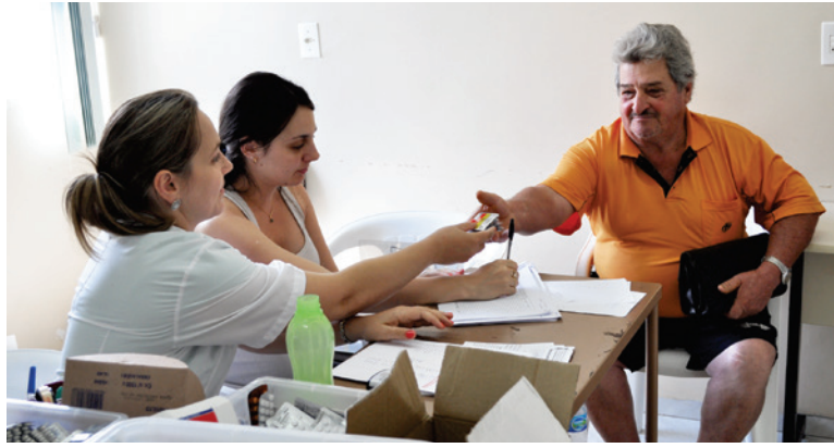
Medicamentos foram entregues na última semana