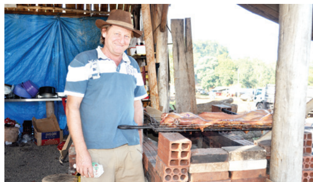
Porco-pizza sendo preparado no quiosque da Rede Leve