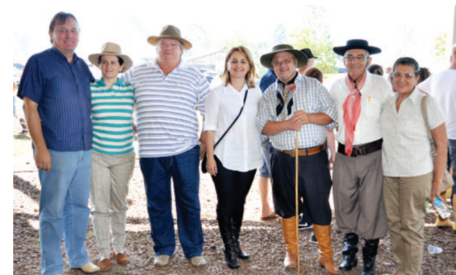
Prefeita e os maravilhenses que prestigiaram a festa da tradição