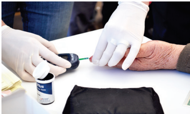
130 exames de diabetes foram realizados