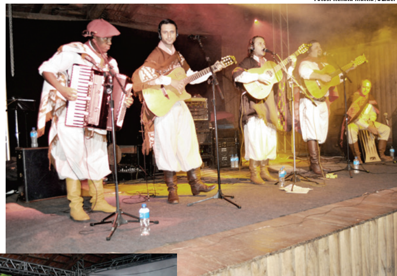
Show nativista do Grupo Paraná encantou a todos os presentes