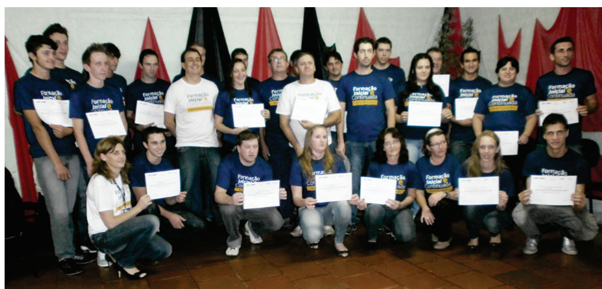
O programa qualificou 27 alunos