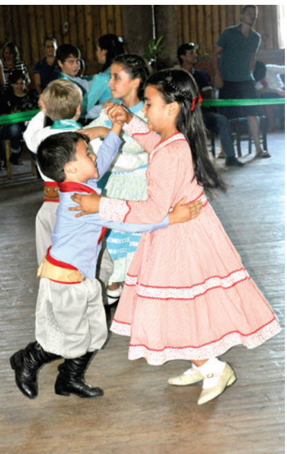
Gauchinhos mirins dando show no palco