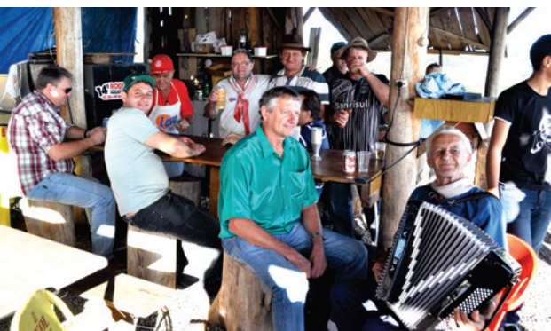
Quiosque da Rede Leve sempre com muitos amigos