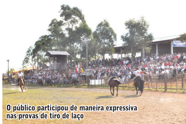
O público participou de maneira expressiva nas provas de tiro de laço