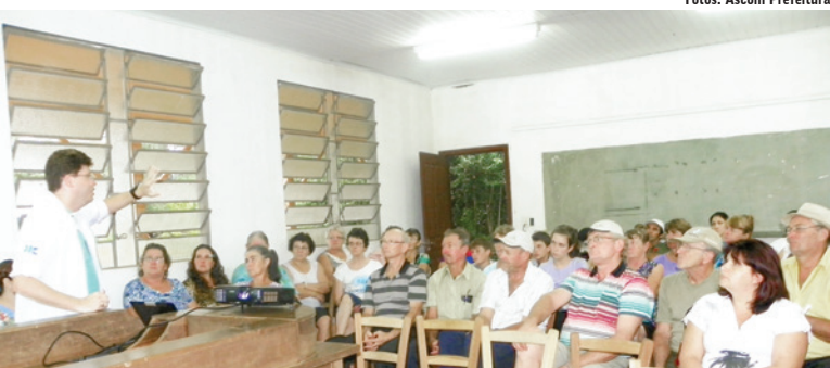
Palestra teve como objetivo orientar os munícipes sobre os cuidados para evitar a doença