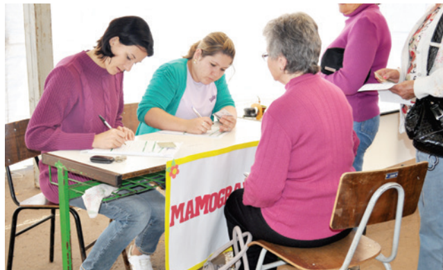
Na oportunidade, público agendou exames