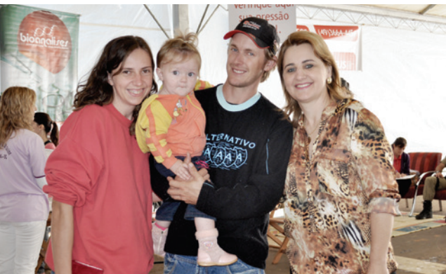
Famílias prestigiaram o evento