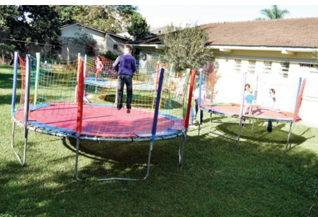
Crianças com vacinas em dia puderam aproveitar os brinquedos