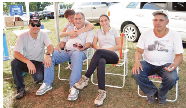
Rodeio proporcionou momentos de descontração