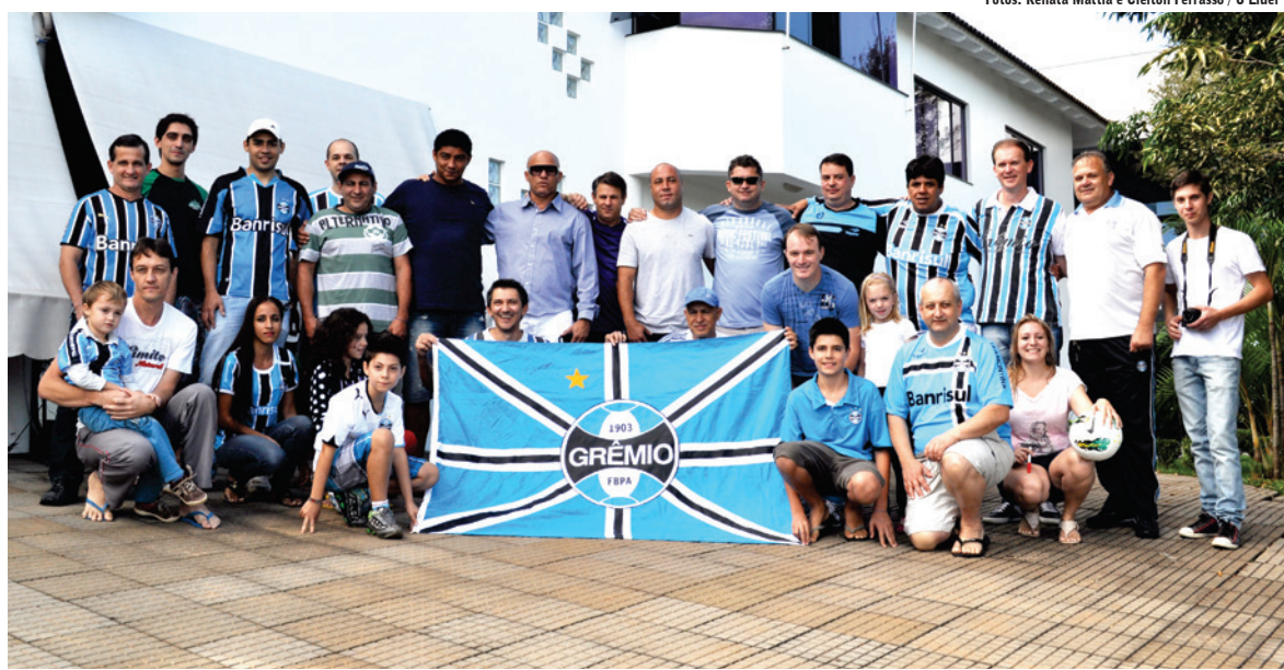
Torcedores encontraram os ídolos na sede da Rádio Líder FM/Jornal O Líder