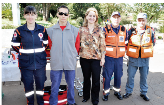
Equipe do Samu esteve presente no “Saúde em Ação”