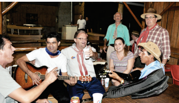
As festas foram até a noite de domingo (07)