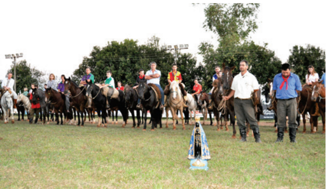
A tradicional oração da Ave Maria teve a participação de mais de 200 cavalos