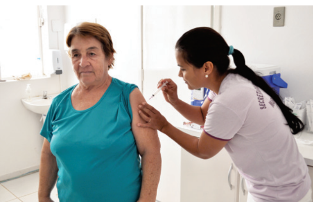
Foram realizadas 400 vacinas de rotina e vacinas em atraso