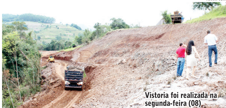
Vistoria foi realizada na segunda-feira (08).

De acordo com o secretário regional, a obra está em fase inicial, sendo realizados trabalhos de terraplanagem, escavação em rocha e limpeza da vegetação. "O trecho da obra localiza-se no contorno do município de Romelândia e está entre os mais demorados, devido à abertura do traçado da rodovia. Porém, o cronograma está sendo cumprido e os trabalhos não foram paralisados", destaca.