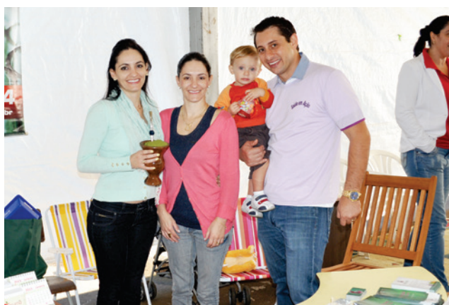
Equipe do Laboratório Bioanálises esteve presente