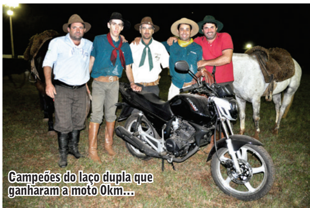
Campeões do laço dupla que ganharam a moto 0km...