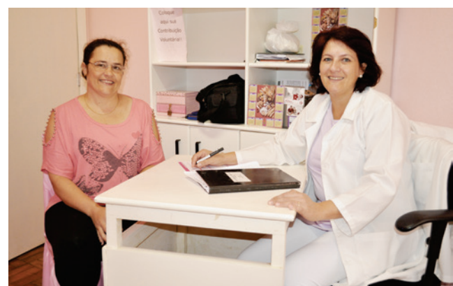
Foram realizados 20 exames preventivos pela enfermeira da Rede Feminina de Combate ao Câncer