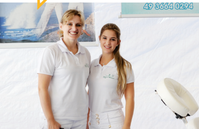
Equilibrium Vitae esteve disponibilizando seus serviços no evento