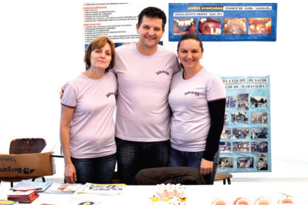
Dentistas do município estiveram prestando esclarecimentos