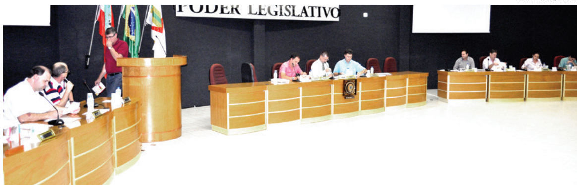
Vereadores entraram com várias indicações