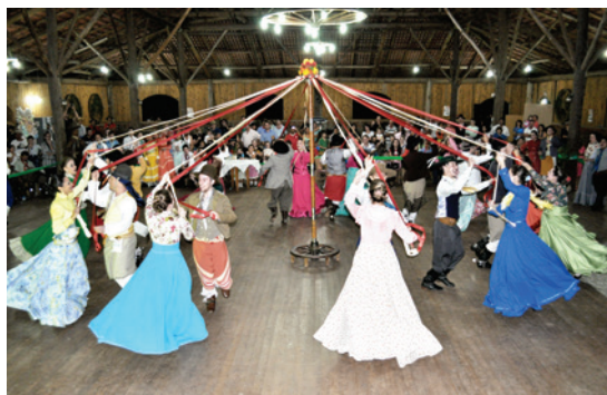
Herança Gaúcha de Chapecó/SC foi o campeão das invernadas adultas