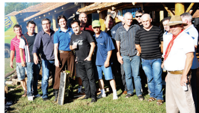
Grupo Oliveira recepcionou amigos e empresários