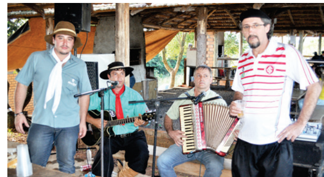
Gaitaço nos quiosques alegrou a tarde dos presentes