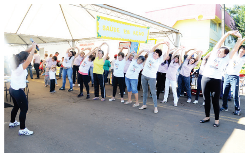
Professores do Vida Ativa realizaram alongamentos com o público