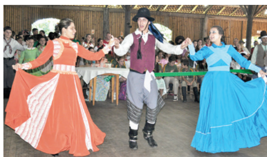
Chote das duas damas encantou o público