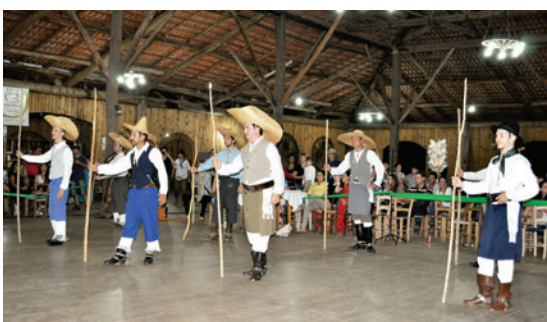
Grupo Biriva Ruivos Tropeiros de Maravilha/SC