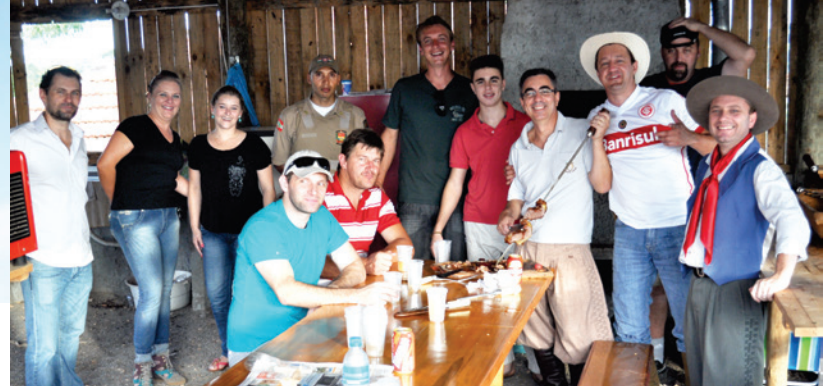
Amigos apreciando um succulento churrasco

No sábado (06), a programação iniciou desde cedo. A fumaça dos costelões assando nos quiosques espalhados pelo parque foi uma das atrações desta edição, que contou com a organização e descontração de todas as empresas, também de quiosques particulares, e do público presente.