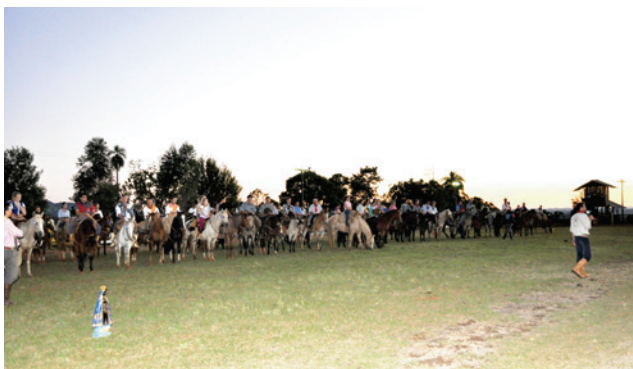
Pôr do sol embelezou ainda mais o momento