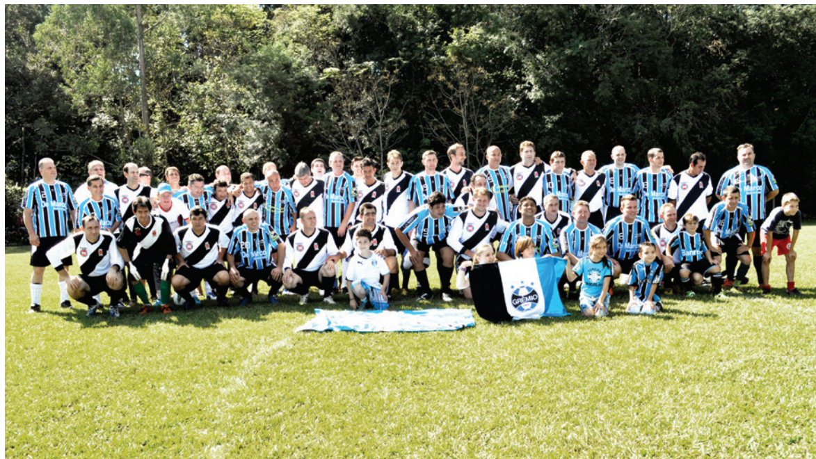
Amigos do Tucha venceram o jogo contra o Vasco Da Gama pelo placar de 5x2

SERVIMOS TODOS OS DIAS PIZZAS E MASSAS COM BUFFET DE SALADAS