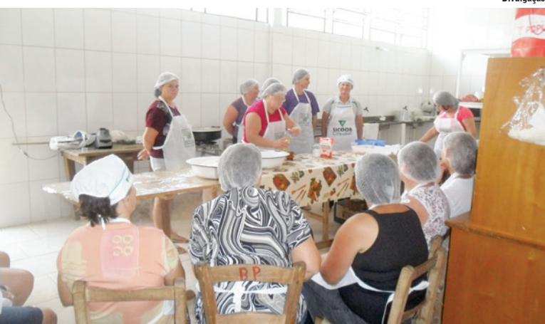
16 mães participaram do curso na Linha Barro Preto

Ao todo 16 mães participaram do curso que ensinou novas receitas de esfiра, empadinhas, torta salgada, bolos e doces para festas.