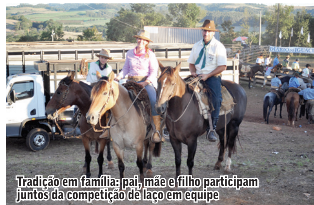
Tradição em família: pai, mãe e filho participam juntos da competição de laço em equipe