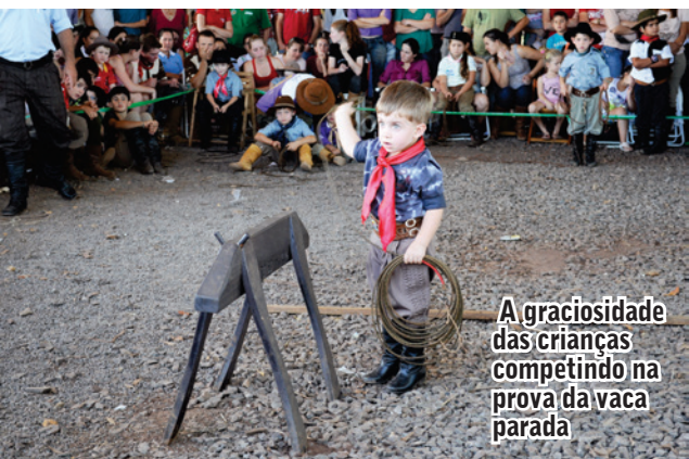
A graciosidade das crianças competindo na prova da vaca parada