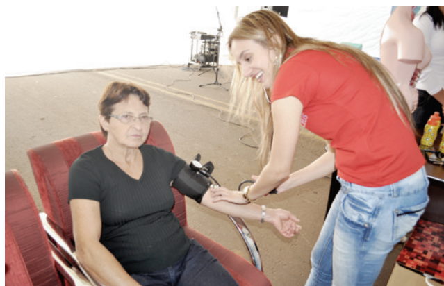
Escola Ceus oferece cursos de Técnico em Enfermagem, e na oportunidade, enfermeiras estavam aferindo a pressão dos presentes