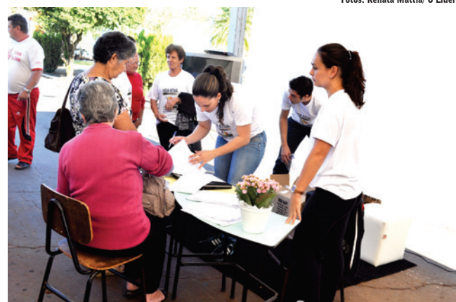
Foram realizadas mais de 200 inscrições para o programa Vida Ativa