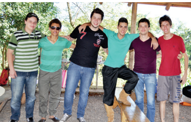
Escoteiros do Grupo Raízes de Maravilha também compareceram