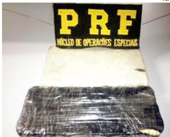
Droga estava escondida no compartimento do filtro de ar do motor

O condutor do veículo disse aos policiais que a droga teria sido comprada em Foz do Iguaçu/PR e que teria como destino a cidade gaúcha de Sarandi. O homem, que segundo a Polícia Rodoviária Federal (PRF), estava no regime semiaberto, condenado por tráfico de drogas, foi preso em flagrante e conduzido para a Polícia Civil de São Miguel do Oeste.