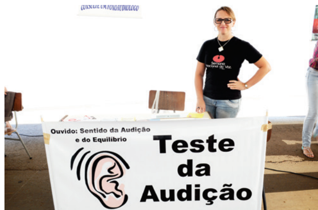
Também estavam disponíveis os testes de audição