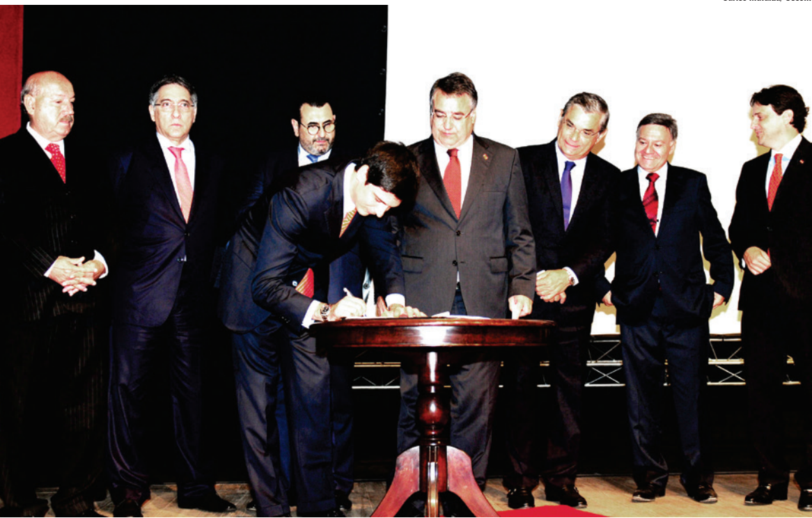
Na presença de diversas autoridades, o governador Raimundo Colombo e o presidente da montadora oficializaram a vinda da BMW para Santa Catarina