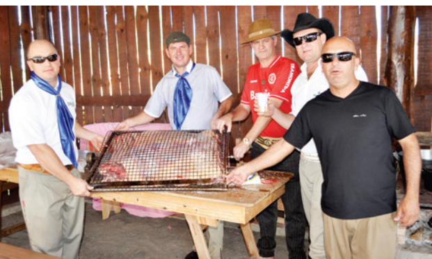
Amigos do Rancho Fogo de Chão exibem o costelão pronto para ser assado