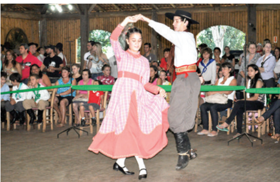
Invernada juvenil dançando com muito tradicionalismo

1º lugar, CTG Vaqueanos D'Oeste de Chapecó; 2º lugar, CTG Coxilha do Quero-quero de Chapecó; 3º lugar, CTG Juca Ruivo de Maravilha; 4º lugar, CTG Herança Gaúcha de Chapecó; 5º lugar, CTG Amizades Sem Fronteira de São Lourenço do Oeste; 6º lugar, CTG Candeeiro do Oeste de Descanso; e em 7º lugar, CTG Espelho da Tradição de Xanxerê.