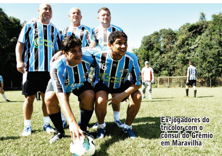
Ex-jogadores do tricolor com o cônsul do Grêmio em Maravilha