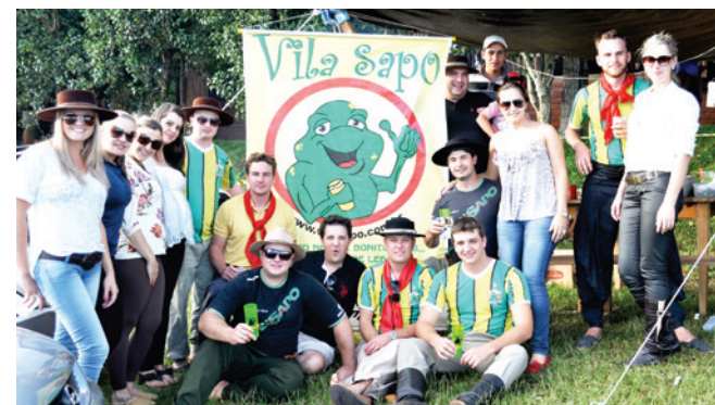
Vila Sapo presente no evento