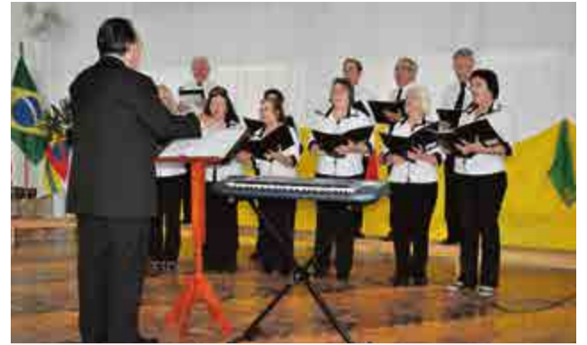
Centro Cultural 25 de Julho