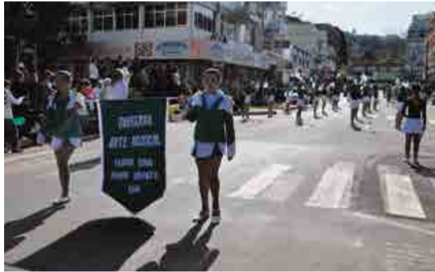
Fanfarra do Caic deu sincronia ao desfile da escola