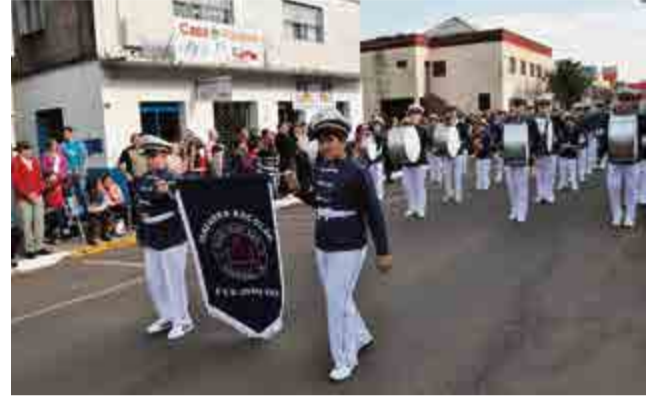
Há quatro anos a escola João XXIII conta com a fanfarra e o corpo coreográfico