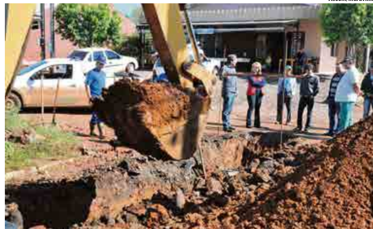
Abertura das valas para a rede coletora começou a ser executada nesta semana

As outras ruas onde o saneamento básico será executado, são: B, C, D, E, F, Inácio Rambo, Pedro Muller, Erno Brutscher, Armindo Grelmann, Eduardo Gruber, Pedro Muller, rua Cândido Rondon, Menegassi e Foz do Iguaçu, além das avenidas Sete de Setembro e Sul Brasil.