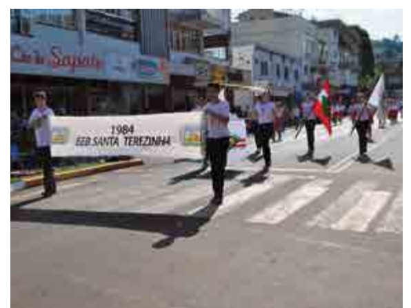
Desfile foi acompanhado pelos alunos da escola Santa Terezinha