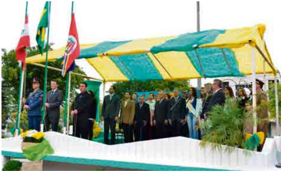
Lideranças participaram do desfile cívico em Modelo