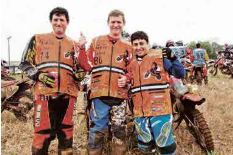
Em Descanso a trilha percorreu mais de 70 km