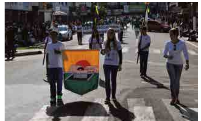
Caic também desfilou no Dia da Independência