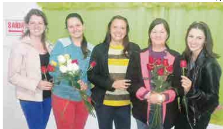
Idealizadoras do projeto com a proprietária do Lar Coração de Maria

Além do projeto, são realizadas visitas mensais ao local, com realização de diálogo com cada idoso, oportunidade em que as profissionais procuram, por meio de atenção, proporcionar saúde psíquica e bem-estar aos idosos.