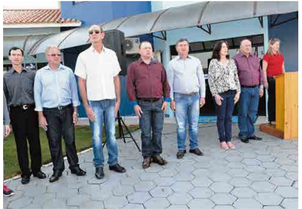
Autoridades prestigiaram o desfile e as apresentações culturais