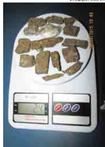
Cerca de 100 gramas de maconha foram apreendidas

rários, o suspeito foi encaminhado para o Presídio de Chapecó.