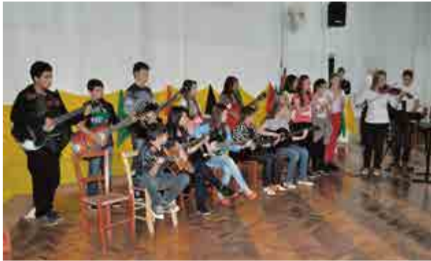
Crianças da oficina de violão e flauta