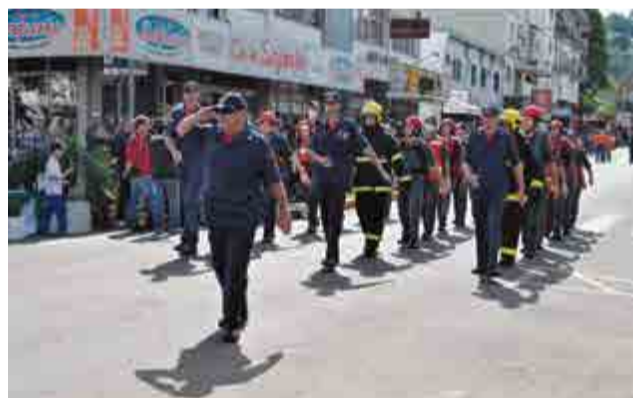
Bombeiros maravilhenses demonstraram seu patriotismo