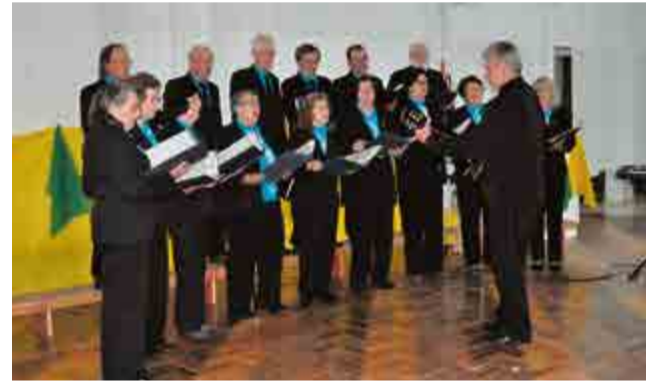
Coral evangélico de Palmitos