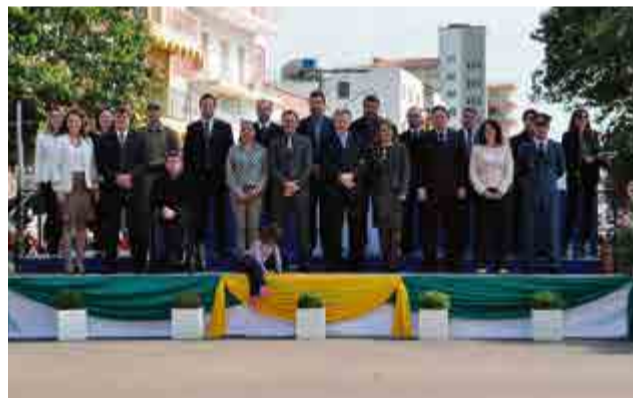
Desfile foi prestigiado pelas autoridades