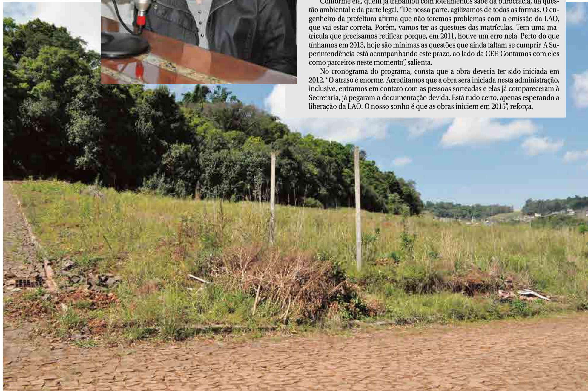
Área do loteamento Minha Casa Nosso Sonho

No cronograma do programa, consta que a obra deveria ter sido iniciada em 2012. “O atraso é enorme. Acreditamos que a obra será iniciada nesta administração, inclusive, entramos em contato com as pessoas sorteadas e elas já compareceram à Secretaria, já pegaram a documentação devida. Está tudo certo, apenas esperando a liberação da LAO. O nosso sonho é que as obras iniciem em 2015”, reforça.