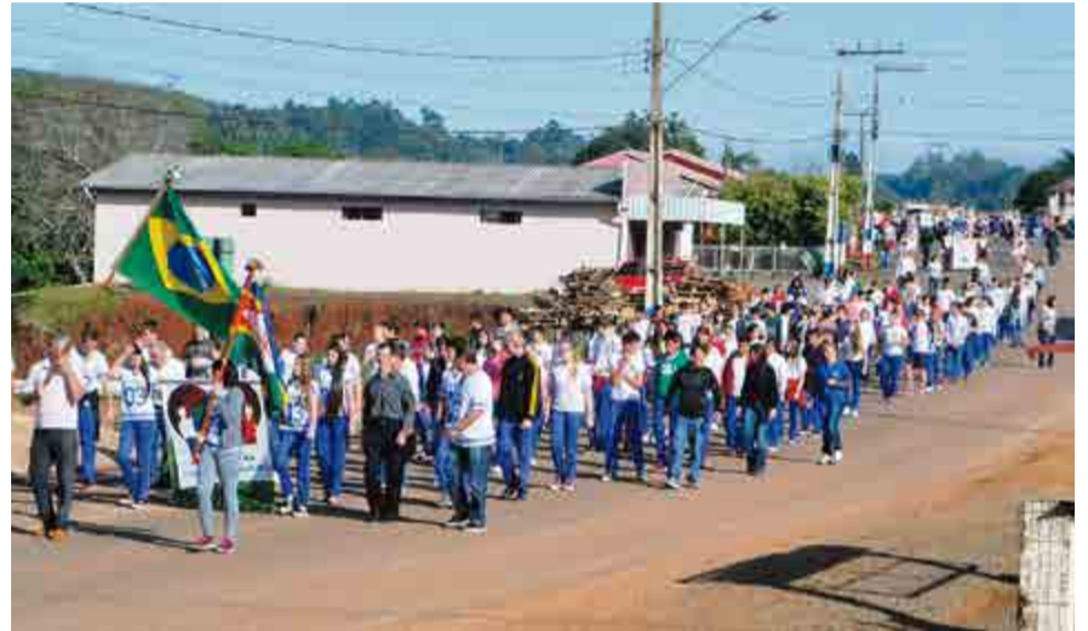
Desfile envolveu toda a comunidade escolar do município