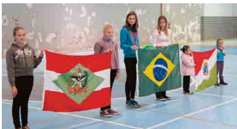
Hora cívica marcou o Dia da Independência

O momento ocorreu em duas ocasiões. A primeira no turno matutino e outra no vespertino, e contou com apresentações culturais dos alunos dos dois educandários. Lideranças do município prestigiaram o momento.