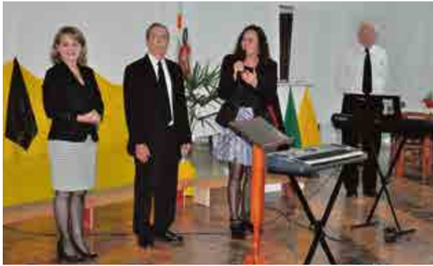
Lideranças prestigiaram o II Encontro Cultural

O coral assumiu a missão de acompanhar as celebrações