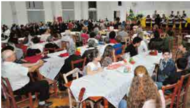
Comunidade maravilhense e da região acompanhou o evento