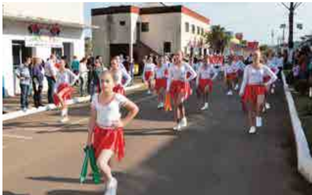
Fanfarra da escola Santa Terezinha está sob a coordenação dos acadêmicos da Unoesc