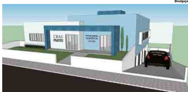
Obra será na Rua Portugal, no Loteamento Nosso Sonho