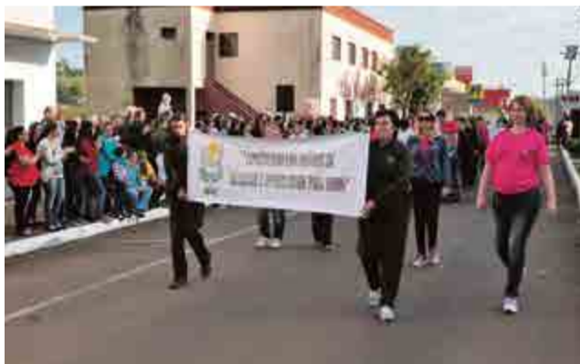
Alunos da Apae participaram