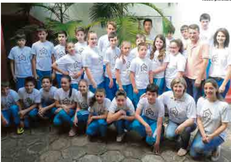
Ao todo 69 alunos do projeto receberam uma camiseta