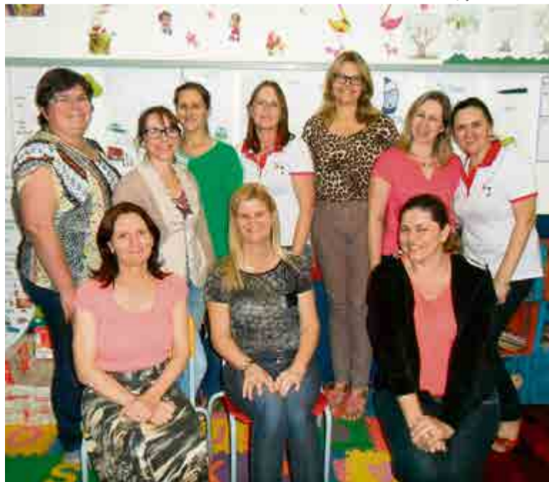
Professores que integram capacitação no município