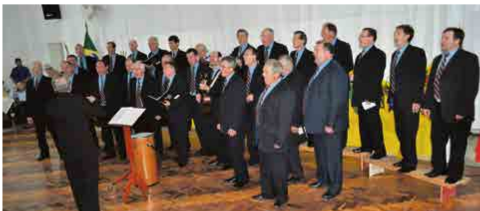
Coral Santa Cecília, de Santo Cristo (RS)

Agropecuária Maravilha; Tarumã Alimentos; Deco Materiais de Construção Ltda; Casa Marte; Relojóias; Bregomar Veículos; Lojas Becker; Mercado Bom Gosto; Loja Mari Modas; RPM Pneus; Super Auriverde; Iguatemi Alimentos; DIX Confeções; Rosimar Maldaner; Atacarejo Kluge; Irma Pilger; 1001 Utilidades Vendruscolo; Contabilidade Solução; Tumelero Utilidades; Dinfer Ferragens; Mercado Vivian; Nossa Loja; Ragazzon Materiais de Construção; Loja Ficagna; Pega-Pega Utilidades; Loja Taísa; Loja Vama; Eco Jardim; Mercado do Calçado; Casa do Bom Negócio; Schumann Móveis; Chica Bakana; Mercado Altas Horas; Amauri Supermercados; Móveis Staudt Nohato Alimentos; e todos os sócios do Coral Immer Fröhlich.