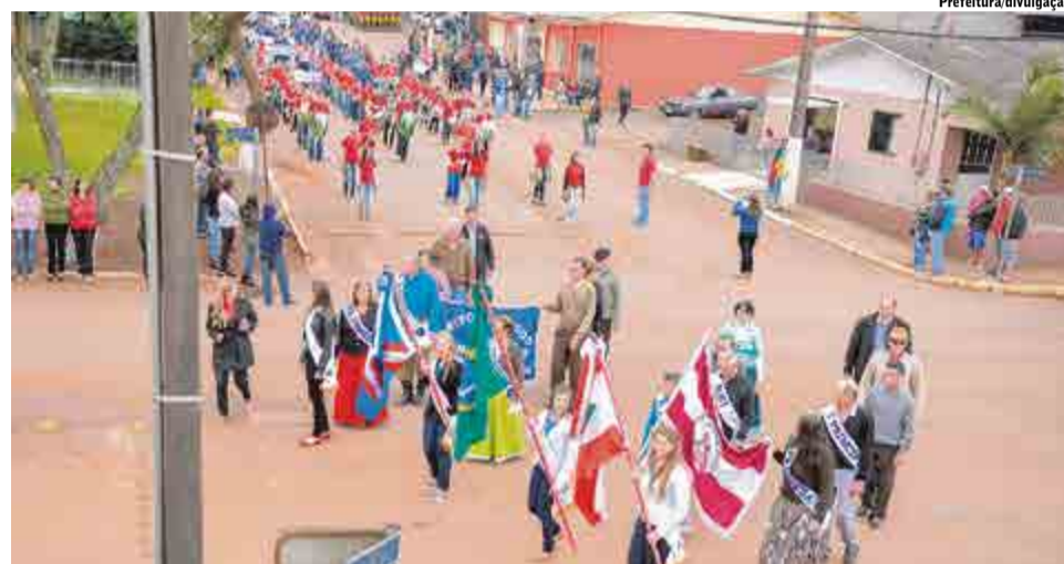
Desfile percorreu as principais vias públicas da cidade