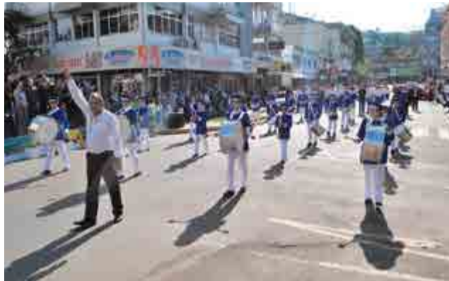
Este foi o primeiro ano que o Caic desfilou com a fanfarra própria