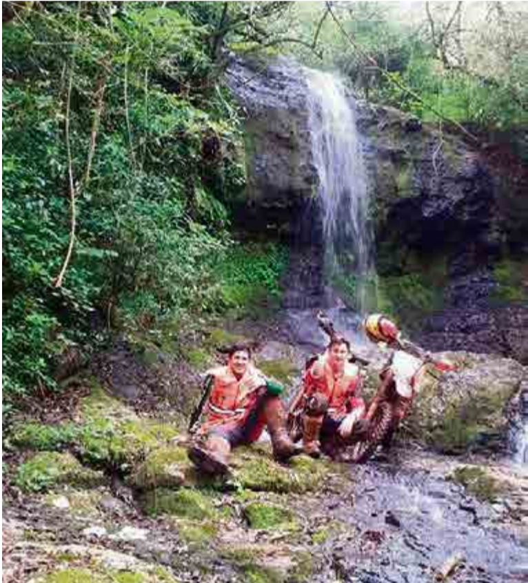
Em Cordilheira Alta as belas paisagens chamaram a atenção