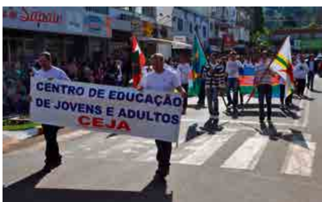
Jovens e adultos do Ceja