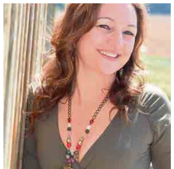
Dere... A vida tem seus momentos difíceis, mas tem suas compensações. Que nesta quarta-feira (16) ao completar mais um ano de vida, você possa comemorar a dádiva de ter ao seu lado pessoas maravilhosas e realizar todos os seus sonhos. Parabéns, felicidades!!