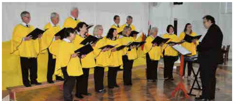
Coral anfitrião, Immer Fröhlich