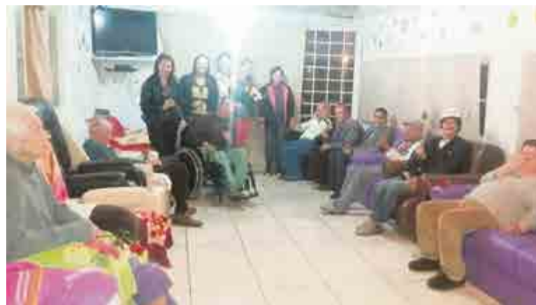
Projeto "Uma rosa por um sorriso" foi desenvolvido nesta semana