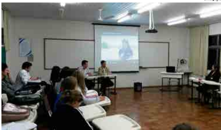
Acadêmicos do curso de Administração acompanharam as explicações dos nucleados

"Pela primeira vez na história estão sentando à mesma mesa