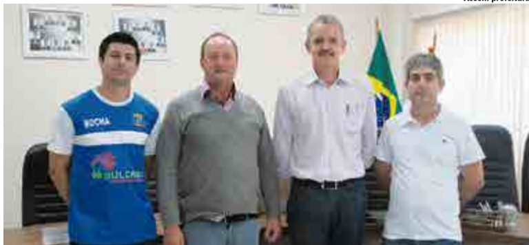
Deputado esteve reunido com o vice-prefeito e vereadores petistas

Conforme o vice-prefeito, para Flor do Sertão sempre é gratificante contar com a presença de uma autoridade comprometida com os interesses municipais, como é o caso de Dresch. "Já fomos beneficiados diversas vezes através de auxílio do nobre deputado, e para nós, sempre é uma honra poder recebê-lo e discutir ações que venham a trazer ainda mais benefícios para a população flor-sertanense", pontua Storch.