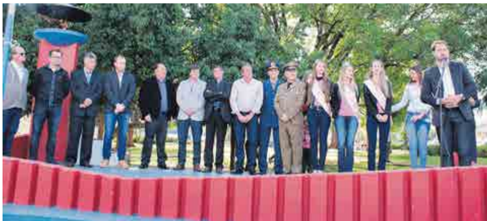
Lideranças realizaram a abertura do evento e acompanharam o desfile no palanque oficial