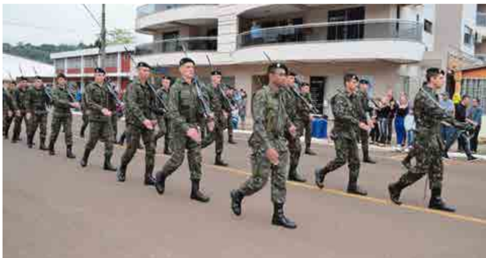
Desfile contou com o Pelotão e Banda do Exército de São Miguel do Oeste