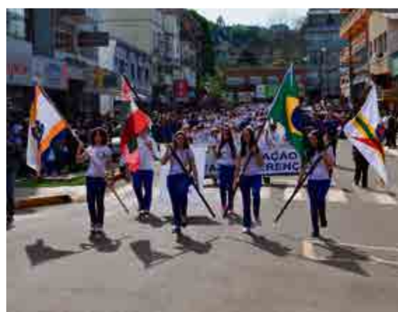
Alunos do Salete marcharam em comemoração à Independência do Brasil