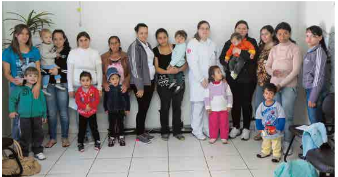
Crianças, pais e responsáveis participaram do encontro

Ainda no encontro foram realizadas ações de acompanhamento de desenvolvimento nutricional, como verificação de peso e altura e fornecido lanche nutritivo.