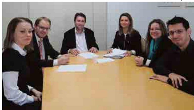
Promotores da região participaram da reunião sobre o termo de cooperação