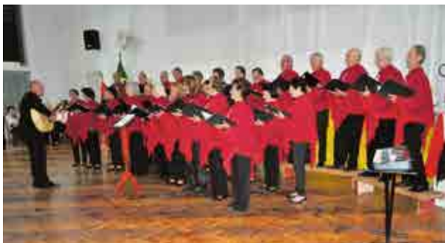
Coral “Cantar é viver” do Lar de Convivência