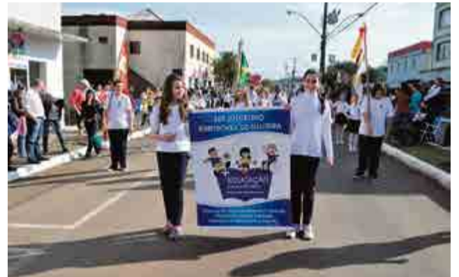
Patriotismo foi demonstrado pelos alunos do Juscelino Kubitschek de Oliveira