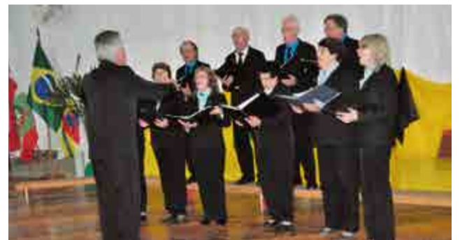
Coral Acorpa de Palmitos

litúrgicas, cultivar as tradições dos imigrantes alemães e, posteriormente, participar de intercâmbios culturais.