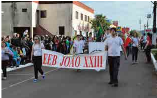
Alunos do João XXIII participaram