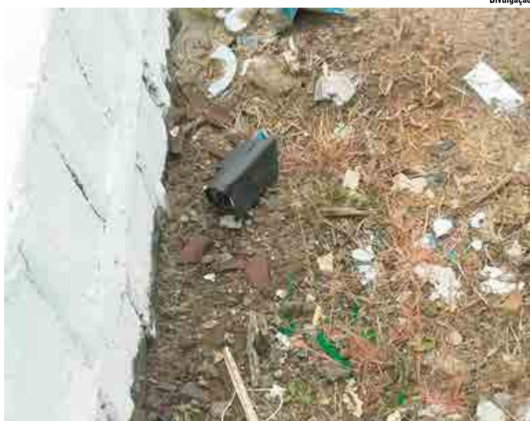
Câmeras estavam quebradas nos arredores da unidade

De acordo com informações repassadas pela PM, as imagens foram recuperadas e foi possível ver dois homens no local. As imagens e o Boletim de Ocorrência foram encaminhados para a Polícia Civil, que investigará o caso.