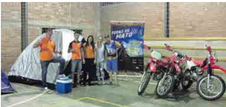
Integrantes presentes em Aratiba (RS)