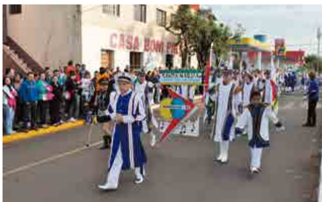
Banda Marcial Cidade das Crianças foi a primeira a desfilar