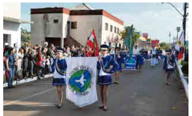
Escola Raymundo Veit esteve representada