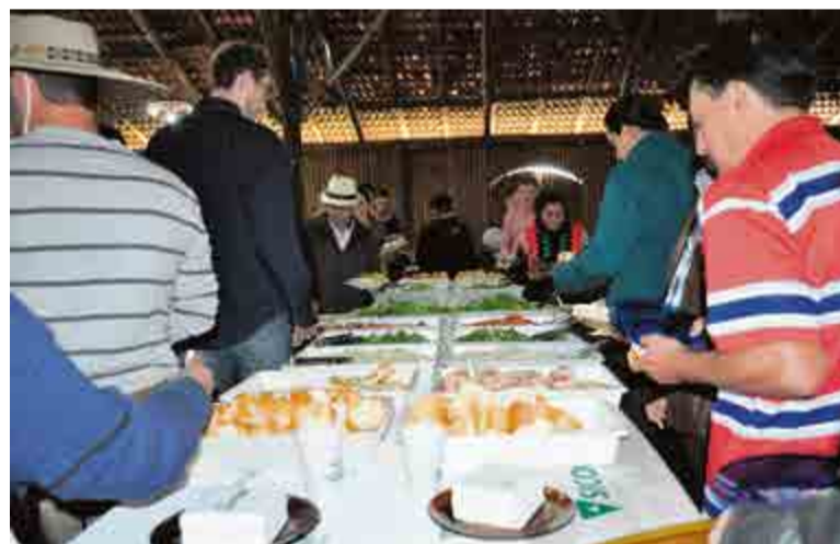
Mais de 900 almoços foram servidos

à tarde foi realizada uma matinê, com animação da banda Harmonia Fandagueira.