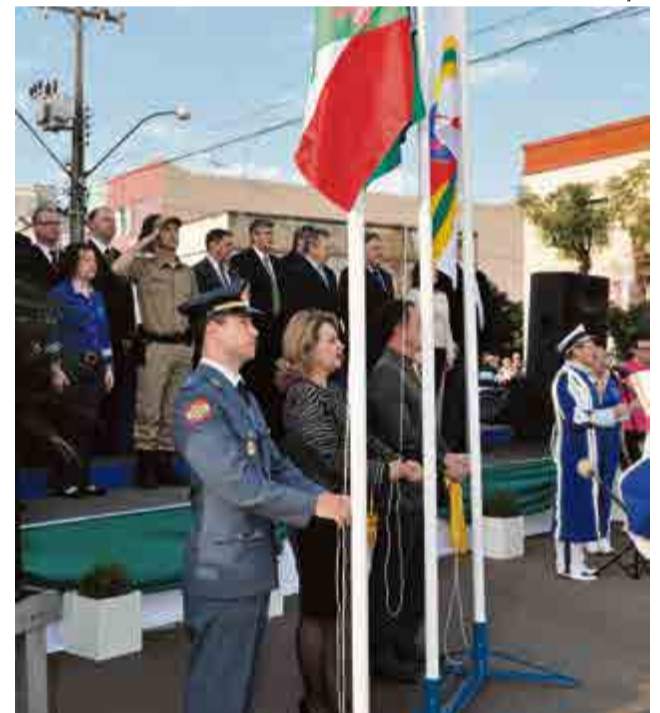
Hasteamento das bandeiras foi realizado por lideranças municipais