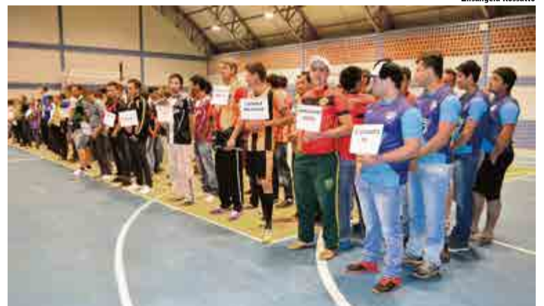
Vinte e cinco equipes participam da competição