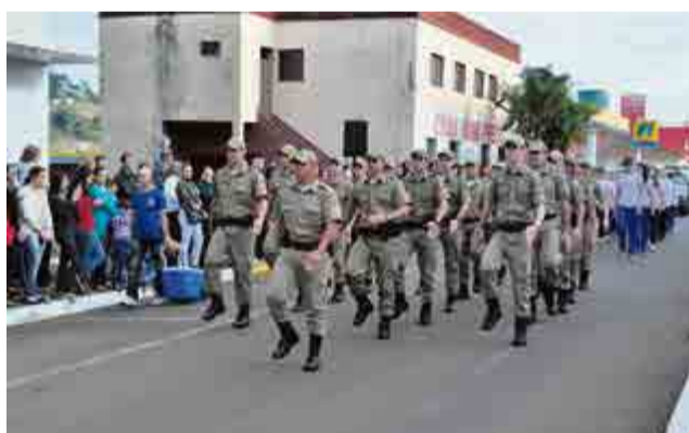
Em marcha ritmada os policiais militares enaltecem o desfile