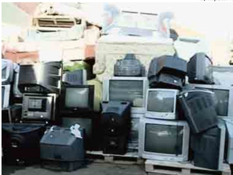
Equipamentos em bom estado serão doados às famílias de Maravilha e Saudades

A campanha também recolheu televisores e celulares que não têm mais utilidade. Esses equipamentos serão encaminhados a empresas específicas de reciclagem. "A maioria das pessoas não tem onde colocar esse tipo de produto. A gente, ecologicamente, coloca no lugar certo, com empresas certi-