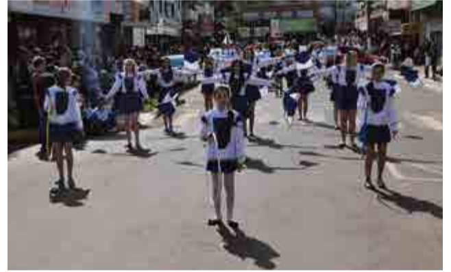
Fanfarra da escola Salete foi retomada em 2013