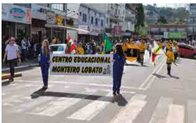
Alunos do Centro Educacional Monteiro Lobato também foram às ruas marchar