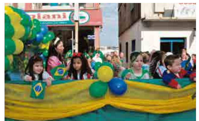
Crianças encantaram evento