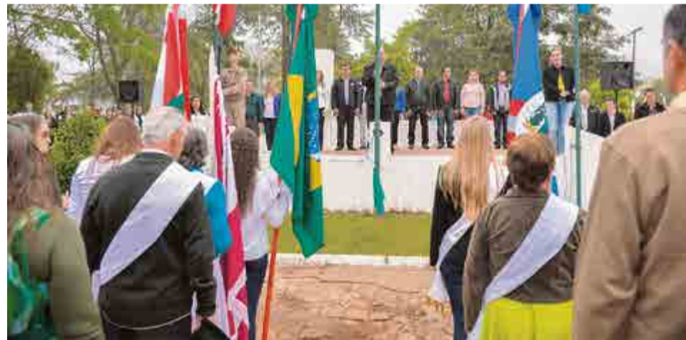
Lideranças acompanharam o hasteamento das bandeiras com a execução dos hinos nacional e do município