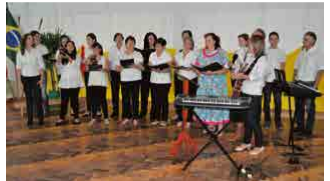
Coral adulto de São Miguel da Boa Vista