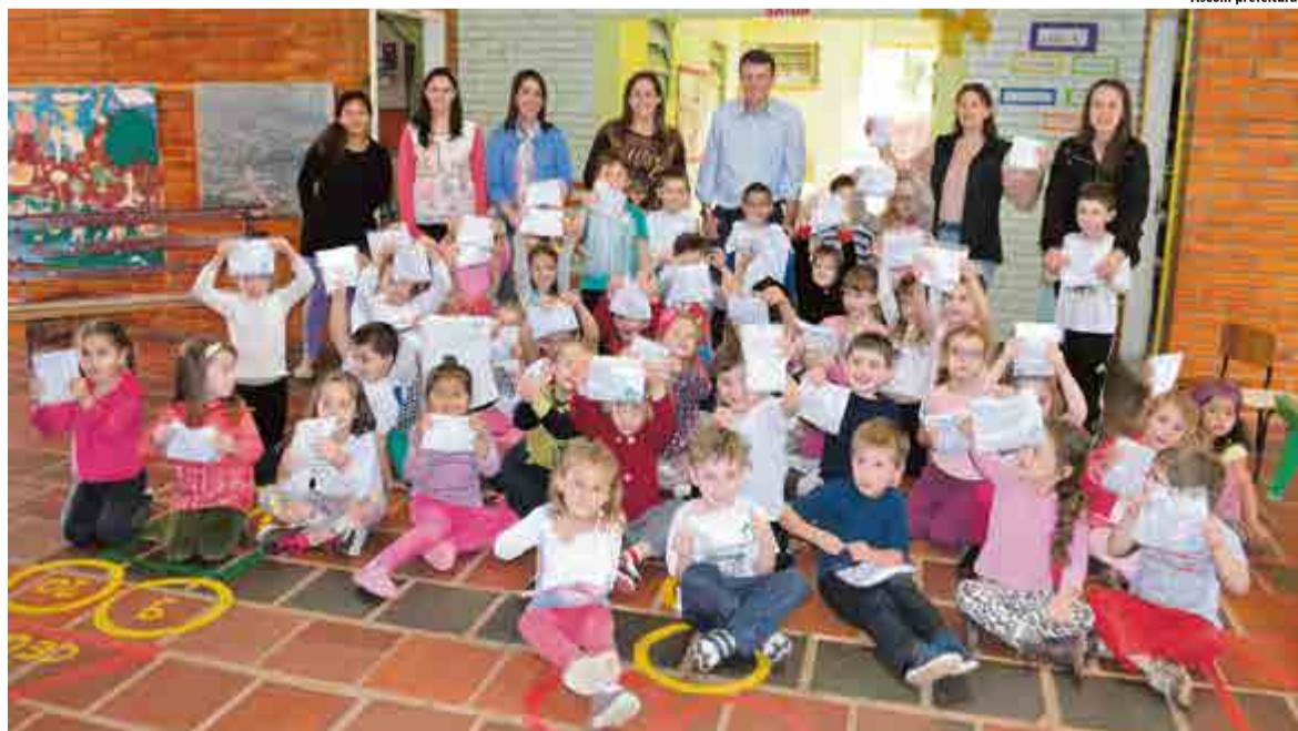
Nova camiseta foi entregue pelo prefeito e diretora de Educação