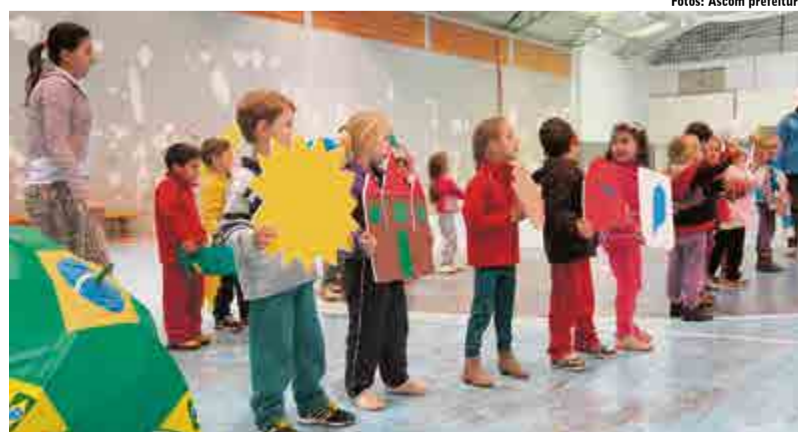
Alunos realizaram diversas apresentações relativas à data