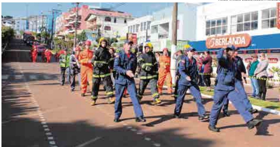
2º Grupamento de Bombeiros Militar de Cunha Porã abriu desfile