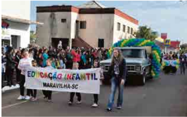
Educação infantil de Maravilha esteve representada