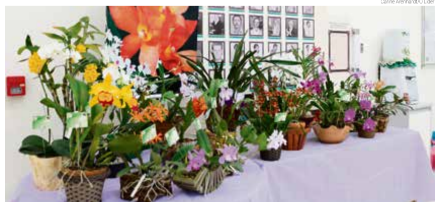
Orquídeas ficaram expostas na agência do Sicoob

cies colecionadas pelos integrantes. As orquídeas chamavam a atenção de quem passava pelo local. Sem flores para venda, a ação foi apenas uma exposição.