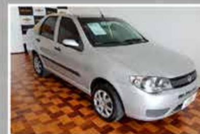
SIENA FIRE FLEX 2010