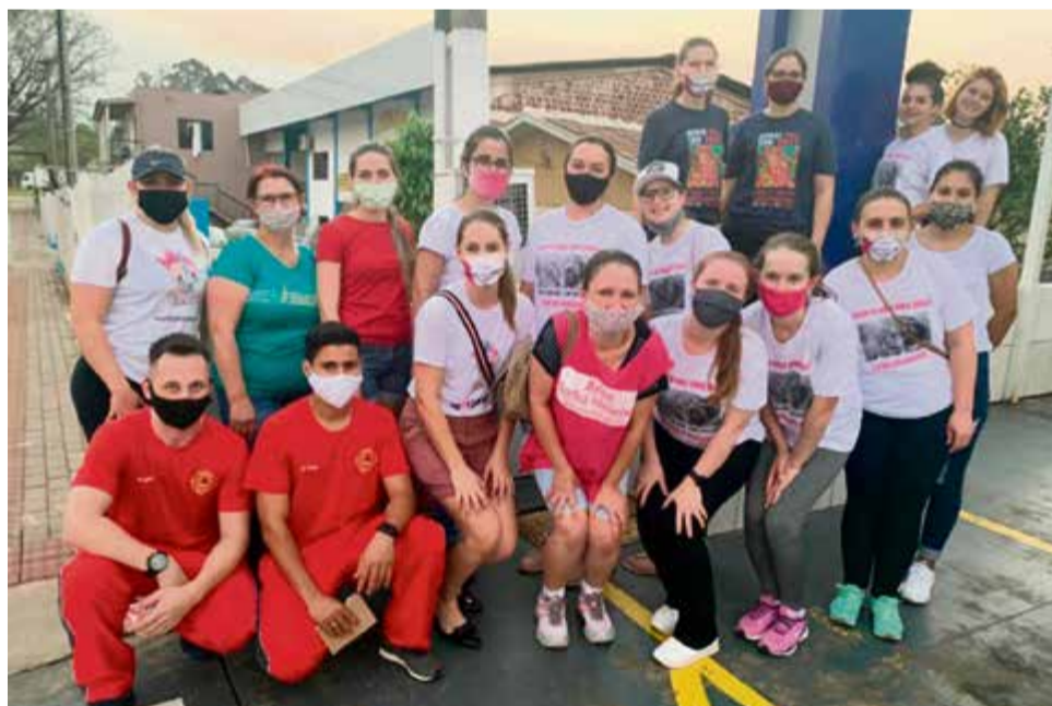
Grupo de voluntários se reuniu em Maravilha no sábado