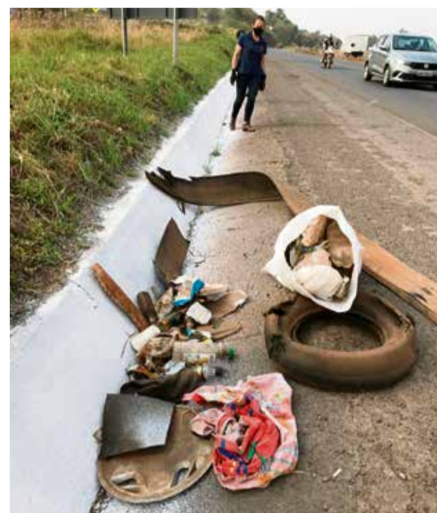
Material reciclável foi doado