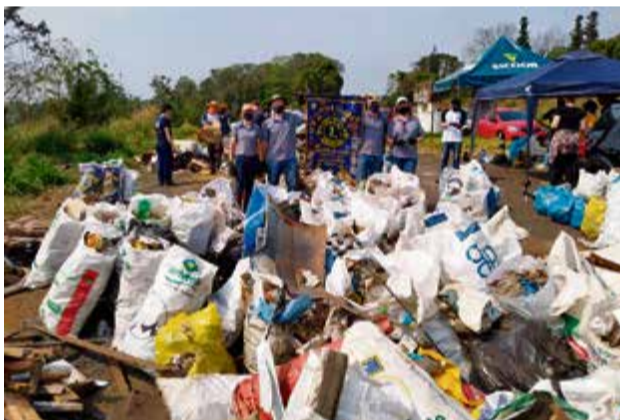
Mais de 60 pessoas participaram da limpeza

encontrado muito lixo depositado irregularmente nas laterais da rodovia, cenário preocupante que demonstra a falta de conscientização na preservação do meio ambiente. “Essa foi uma grande ação para além da limpeza promover a consciência nas pessoas de que há, sim, muito lixo nas rodovias. Agradecemos a todos os envolvidos”, declarou a organização.