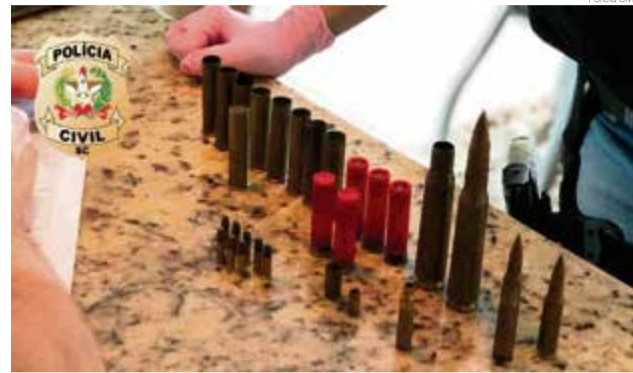
Munições de uso restrito das Forças Armadas foram apreendidas pela polícia

Assim, os agentes de Polícia Civil, juntamente com o destacamento da Polícia Militar local, que prestou apoio à operação,