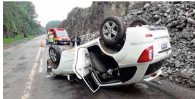
Motorista tentou desviar de pedra e capotou sobre a pista

controle ao desviar de uma pedra que estava sobre a pista. O carro capotou e ficou com as rodas para cima. A BR-282 passa por obras intensas e a construção de terceira pista em alguns trechos.