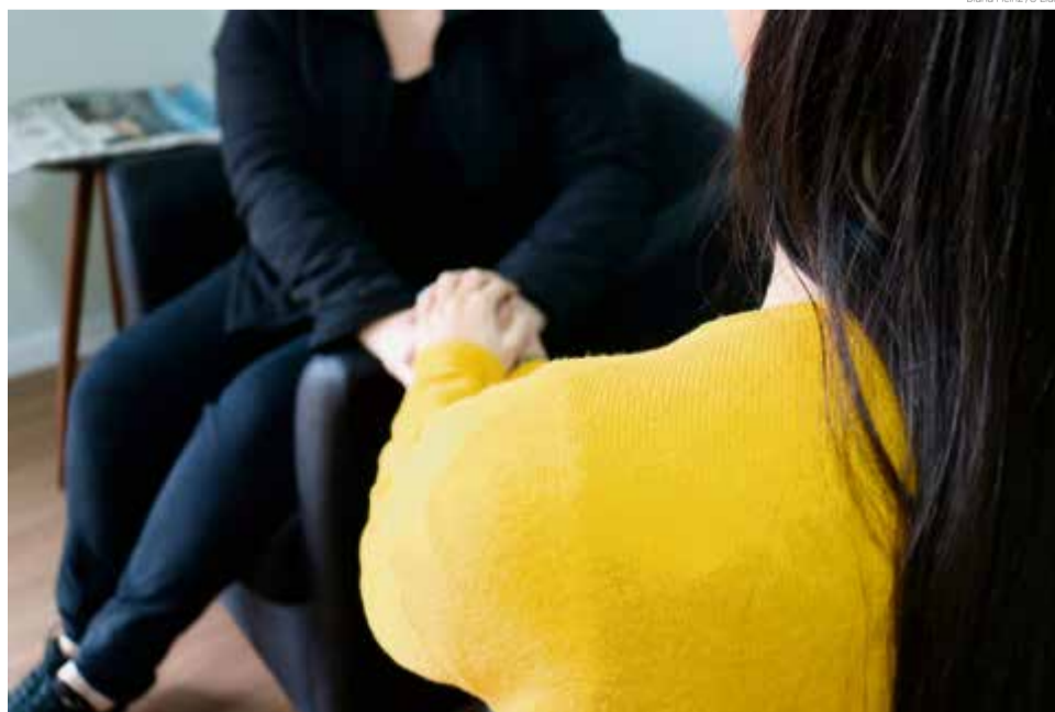
Orientação profissional é que essas pessoas busquem falar sobre suas emoções

Busque equilíbrio - Importante um momento de meditação, de busca do equilíbrio e de contato com a natureza onde se possa refletir.