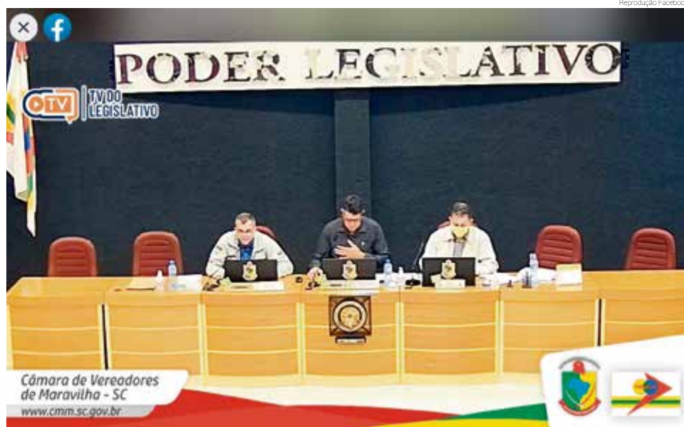
Sessão teve transmissão on-line pelo Facebook

Deu entrada a Indicação nº 64/2020, que pede que o Executivo providencie a pa-