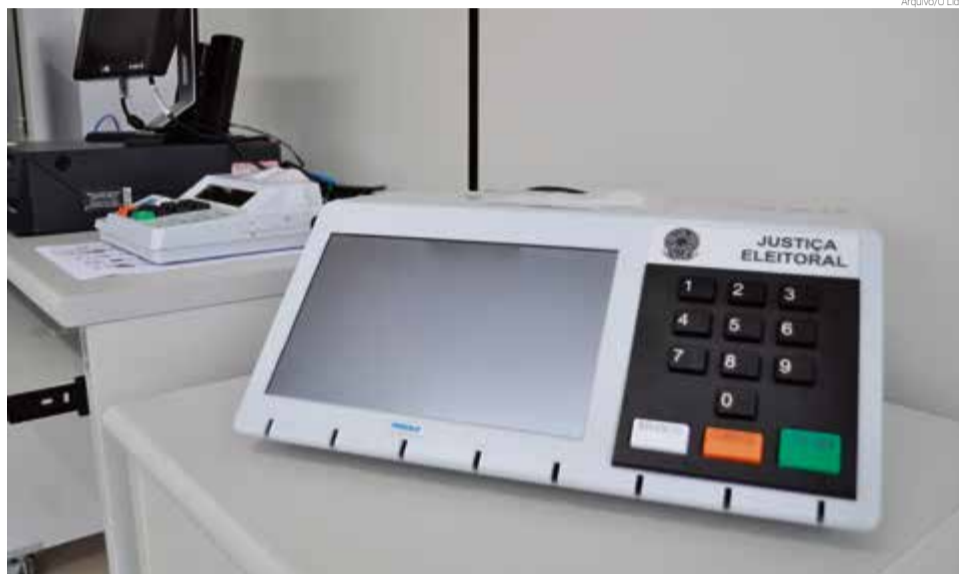
Partidos se organizam e fecham coligações e nominata para concorrer nas eleições deste ano

na terça-feira (15), de forma presencial, das 11h às 18h, na sede do diretório municipal do MDB, na Rua Duque de Caxias. Devido ao estado de pandemia, o partido agendou os horários de votação individual para cada um dos votantes, para evitar aglomerações.