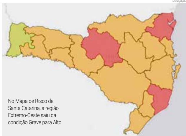
No Mapa de Risco de Santa Catarina, a região Extremo-Oeste saiu da condição Grave para Alto