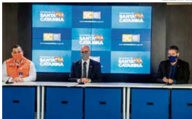
Apresentação do Plano de Contingência na quarta-feira

“Nós teremos nas escolas professores por área do conhecimento para tirar as dúvidas e reforçar todo aquele conteúdo que foi trabalhado nas atividades não-presenciais. Assim, teremos menor quantidade de alunos nas