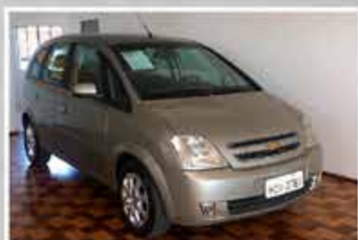
MERIVA PREMIUM 2011

Você ainda leva o tanque cheio, a transferência grátis e o IPVA 2020 pago.