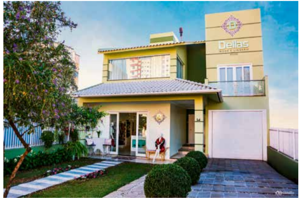
Loja está situada na casa dos proprietários, na Rua General Osório

Uma palavra que pode resumir a receita de sucesso da Dellas House ao longo de três décadas é renovação, necessidade que surgiu ao longo de diversas etapas da história de Derenice Ma-