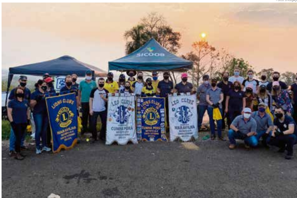
Lixo foi destinado ao descarte correto

A campanha do meio ambiente é trabalhada em nível internacional. Conforme equipe de voluntários, foi