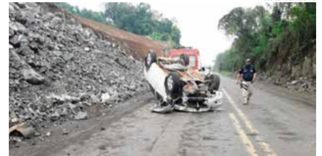
Polícia Rodoviária Federal controlou o trânsito no local, que está em obras