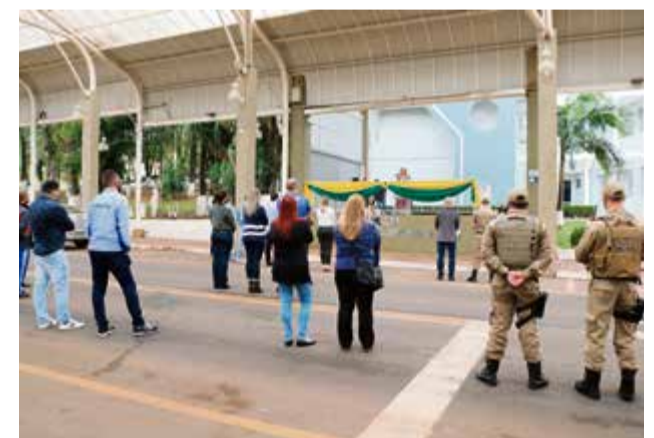
Algumas pessoas acompanharam o pronunciamento da prefeita na Rua Coberta