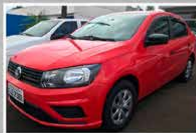
VOYAGE 1.0 2019