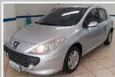
307 16 FX PREVILEGE 2011