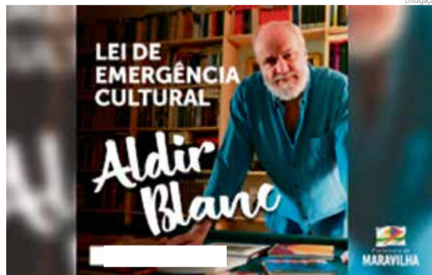
Todas as informações de interesse público relativas à aplicação da Lei Federal nº 14.017 ficarão disponíveis no site da prefeitura de Maravilha: www.maravilha.sc.gov.br

O decreto 707 prevê que a Secretaria de Educação e o Departamento de Cultura ficarão responsáveis pela execução dos recursos recebidos da União. Com isso, compete aos órgãos distribuir os subsídios mensais para a manutenção de espaços artísticos e culturais,