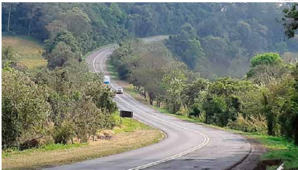
Ultrapassagem em local proibido registrada na BR-163, em São José do Cedro