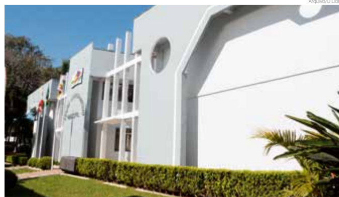
Pedidos devem ser feitos no auditório da prefeitura, nas segundas ou sextas-feiras

Para quem já recebeu a isenção no pagamento do IPTU neste ano, a renovação para 2021 é automática. A medida foi tomada em função da pandemia do coronavírus. Em Maravilha, 269 famílias ficaram isentas do pagamento do IPTU 2020, tendo feito o pedido ainda no fim de 2019. A Secretaria de Assistência Social já fez o contato via telefone com estas famílias, informando que não há necessidade de renovar o pedido.