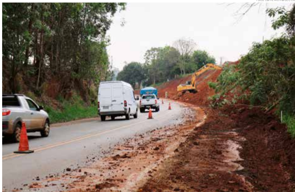
Máquinas trabalham na lateral das pistas, alterando o fluxo do trânsito

ções da pista antiga e serviços de manutenção. O supervisor destaca que o ritmo dos trabalhos está mais acelerado nos últimos meses, com a garantia de recursos para continuidade da obra.