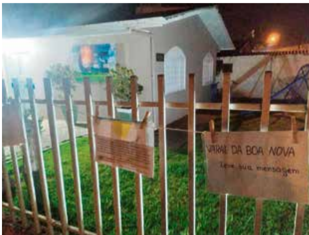
Varal da Boa Nova é uma novidade do Centro