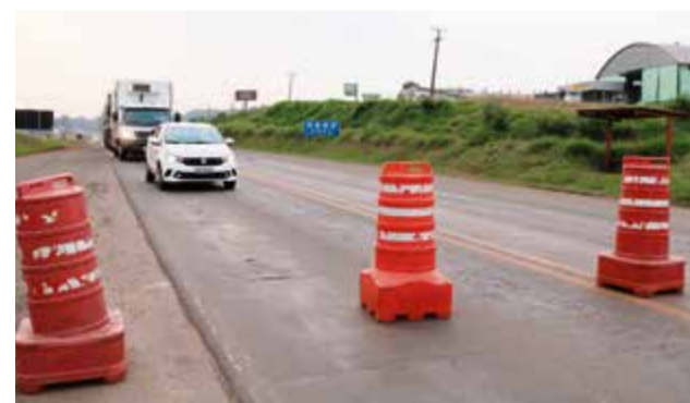
Paradas obrigatórias são comuns neste período de obras

Conforme o supervisor regional do Dnit, a perspectiva é que os trabalhos sejam concluídos ao fim do primeiro semestre de 2021. Este prazo incluiu a finalização dos trabalhos na BR-282, entre Chapecó e São Miguel do Oeste, e também no trecho da BR-158, de Maravilha até a divisa com o Rio Grande do Sul.