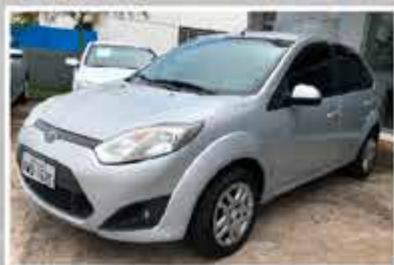
FIESTA SEDAN 2013