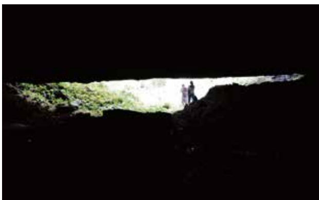
Cavidades naturais serão mapeadas no sistema nacional do ICMBio

mento dos municípios que têm as cavidades. Quem souber de informações e puder contribuir pode entrar em contato com ele pelo telefone (49) 99814 3938. A partir do ano que vem, Budke pretende ir nas propriedades para cadastrar as cavernas no sistema nacional.