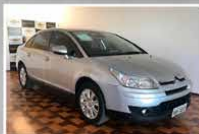
CITROEN C4 PALLAS 2013