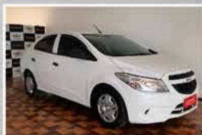
PRISMA JOY 2018