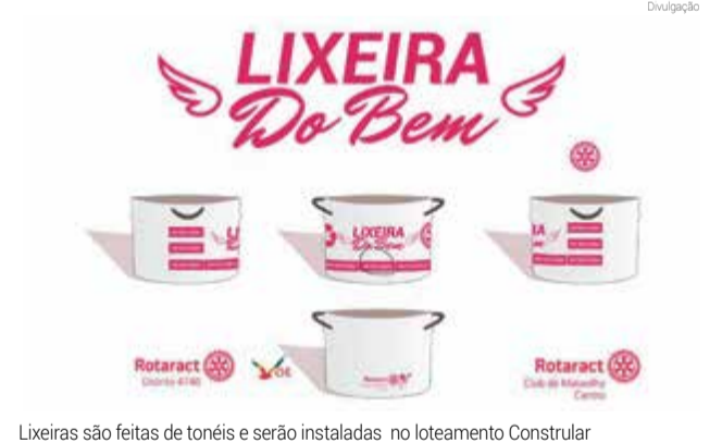
Lixeiras são feitas de tonéis e serão instaladas no loteamento Constrular

"O projeto contribui com a natureza no sentido de dar um descarte correto ao material jogado no loteamento e que pode gerar outros problemas na cidade, como o en-