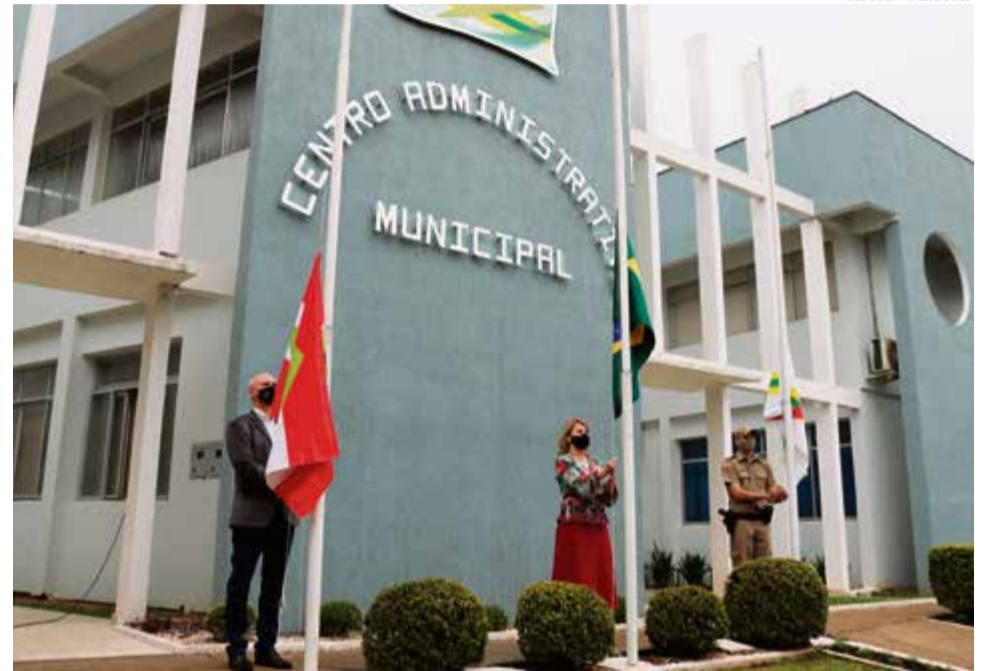
Semana da Pátria encerrou no dia 7 de setembro com ato cívico em frente à prefeitura

para me solidarizar com as famílias dos maravilhenses que perderam suas vidas nesta pandemia e para desejar uma pronta recuperação a quem ainda enfrenta as dificuldades do contágio. Também peço a todos uma profunda reflexão sobre este momento, sobre a importância de