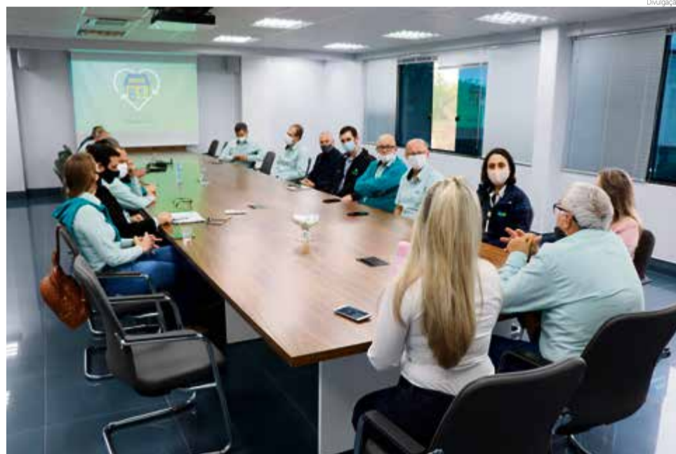
Lançamento foi feito no último dia 4

O Sicoob já vinha trabalhando com uma linha de crédito emergencial covid-19, específica para capital de giro. Foi disponibiliza-