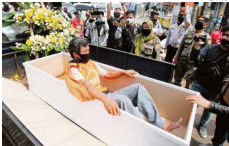
Caixões nas ruas de Jacarta para punir quem não usa proteção

Na Indonésia as autoridades inventaram um jeito um tanto estranho de punir quem é flagrado sem o uso de máscara de proteção pelas ruas. Para não pagar multa ou ter de prestar serviço comunitário, os infratores podem optar por entrar em um caixão e lá permanecer por no mínimo um minuto. Ficam, durante esse período, expostos a fotos, vídeos e olhares curiosos - e por vezes condenatórios - de quem estiver por perto, na via pública. Não é a primeira vez que as autoridades de Jacarta utilizam caixões para tentar conscientizar as pessoas sobre a necessidade de obedecer às medidas de restrições e distanciamento para evitar a disseminação do coronavírus. Meses atrás exibiram nas ruas os esquifes com um aviso sobre o número de infectados e de mortos no país. Segundo a Universidade Johns Hopkins, a Indonésia registra até o momento 184 mil casos da doença e 7,7 mil mortos.