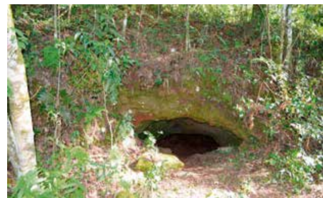
Cavernas de todos os tamanhos entram na lista