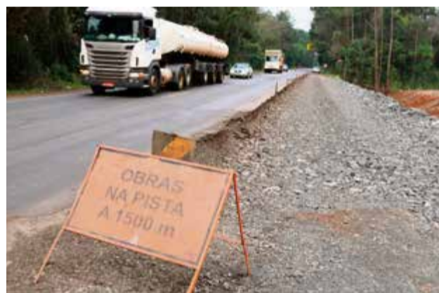
Pistas estão mais estreitas e sem acostamento em trechos de implantação de terceiras faixas

do veículo da frente e não forçar ultrapassagem. A gente vê ultrapassagens inclusive em trechos sinalizados com indicação de obras, são situações preocupantes", reforça.