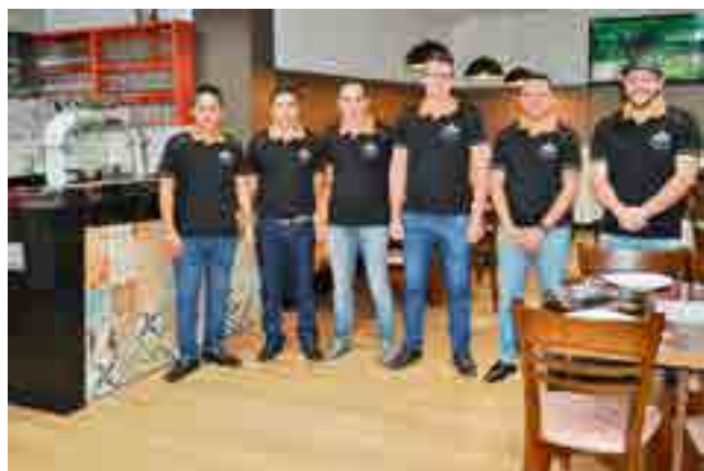
Equipe de garçons e cozinheiros