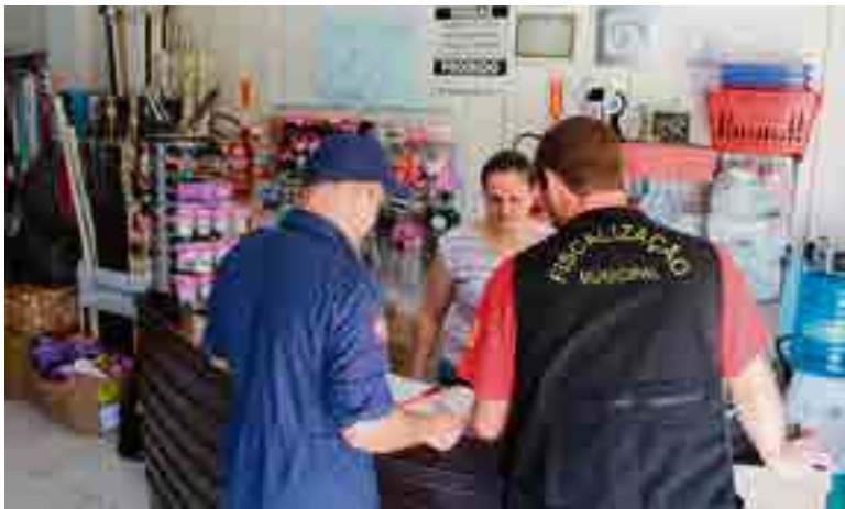
Objetivo foi verificar situação dos alvarás dos Bombeiros