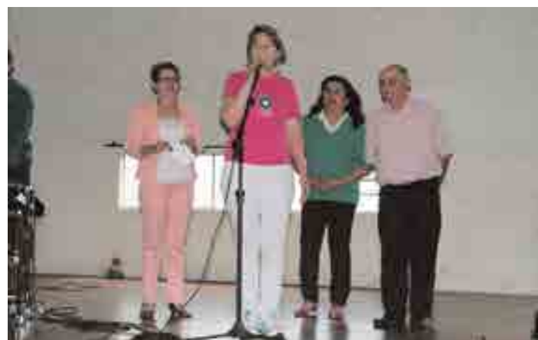
Costelão Beneficente foi realizado pela RCFF e CAEP