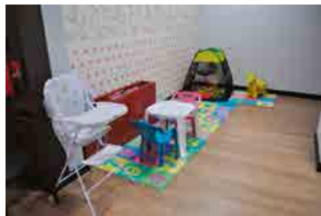
Ambiente foi pensando para a comodidade e bem-estar dos clientes