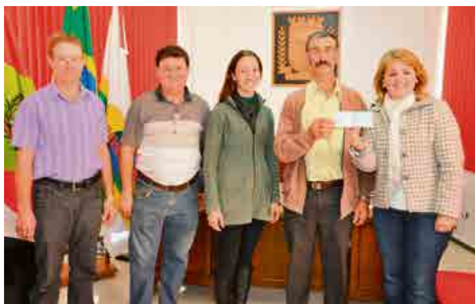
Família recebeu recursos da administração para incentivar o negócio