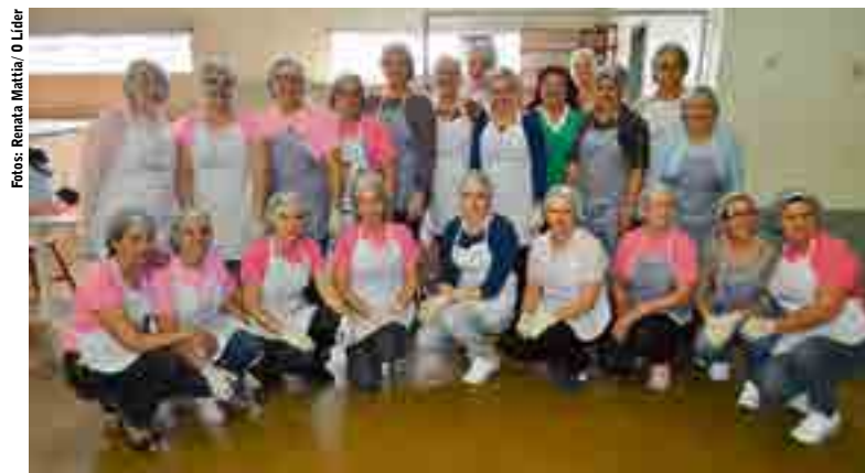
Voluntárias do CAEP e da RFCC auxiliam com os trabalhos da cozinha

O tradicional Dia da Responsabilidade Social, promovido pela Universidade do Norte do Paraná (Unopar), novamente será realizado em Maravilha. O evento inicia na segunda-feira (15) e encerra no sábado (20) e conta com a parceria da administração municipal. Porém, a oportunidade que os acadêmicos terão para expor seus trabalhos será no sábado (20), na Praça Padre José Bunsse, das 13h30 às 17h, juntamente com a Rua do Lazer, projeto este que é desenvolvido pela prefeitura, por