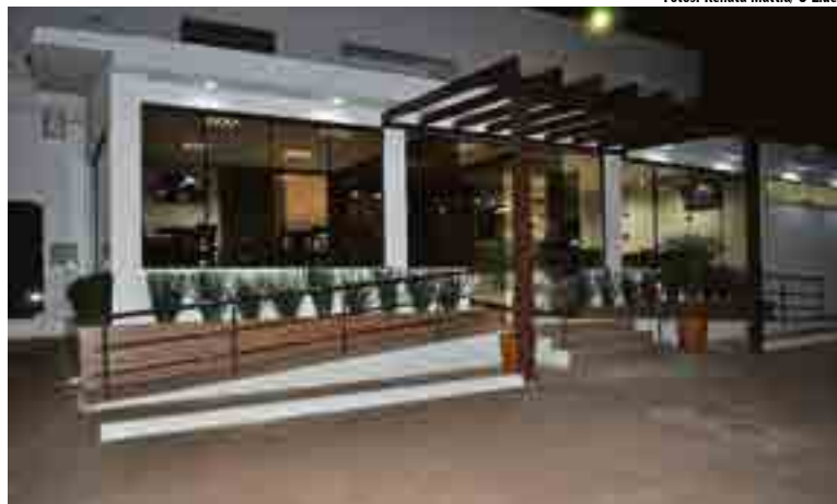
Restaurante Braseiro abriu iniciou trabalhos na terça-feira (9)