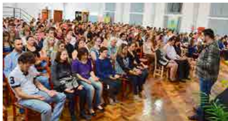
Grande público acompanhou as oficinas e palestras oferecidas no 2º Fórum Empresarial