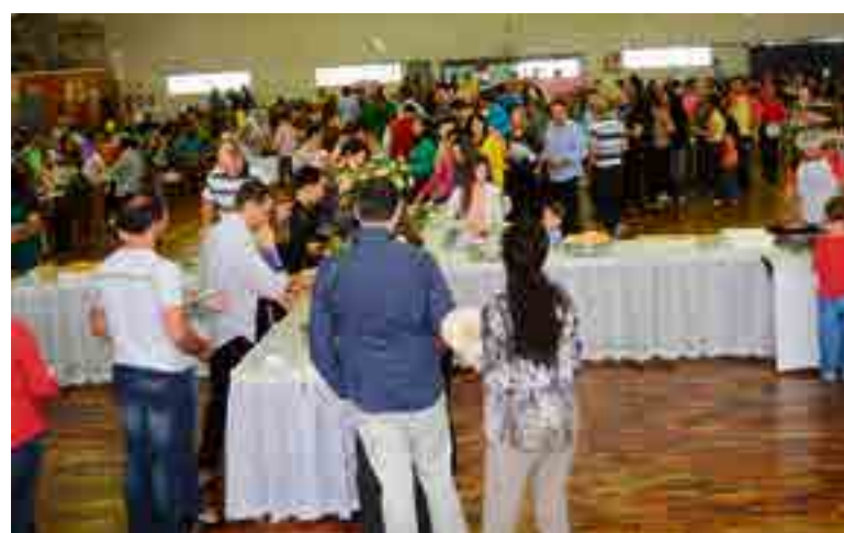
Mais de 600 pessoas prestigiaram o evento

meio das secretarias de Assistência Social e de Educação e dos departamentos de Cultura e Esportes.