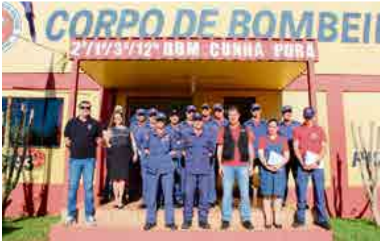
Ação contou com profissionais de Cunha Porã, Maravilha e São Miguel do Oeste