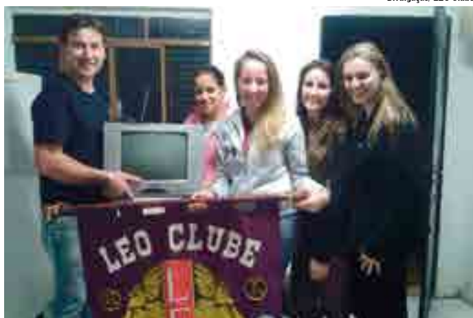
Integrantes do clube realizaram a entrega do televisor

Os companheiros do LEO Clube agradecem aos doadores do televisor. “Gostaríamos de enaltecer este tipo de ação, sendo que com isso conseguimos fazer mais pessoas felizes em nosso município”, finalizou Iana.