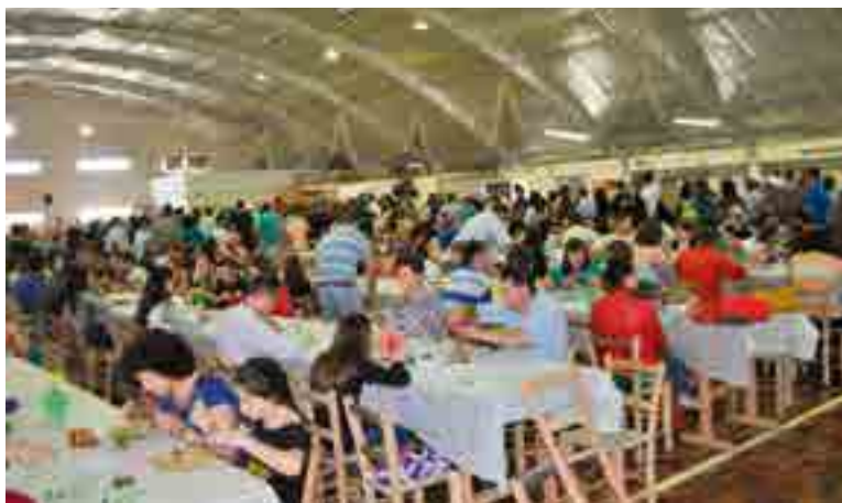
Mais de 900 fichas foram comercializadas para o Almoço Beneficente