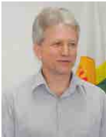
Autoridades estiveram presentes na posse do novo secretário

Para garantir a integridade das urnas e do processo eleitoral, medidas de segurança do TRE-SC, em parceria com as forças policiais (Polícia Federal, Militar e Civil) do Estado, serão executadas. A polícia já tem feito rondas nos locais de guarda dos equipamentos. Próximo ao dia do pleito e no dia da votação a Sala de Situação (formada por representantes da Justiça Eleitoral e das Forças de Segurança Pública) será instalada no TRE-SC, para que qualquer acontecimento fora da normalidade possa ser controlado. A organização contará com a presença de representantes das forças policiais que estarão em contato direto com seus efetivos.