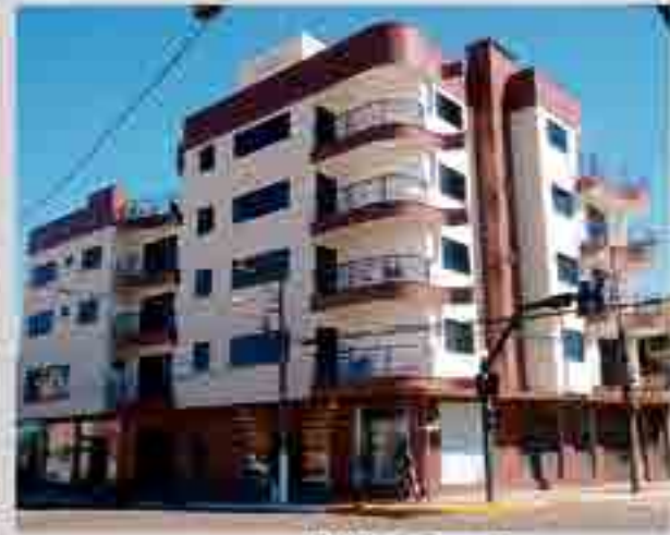
Ed. São Francisco