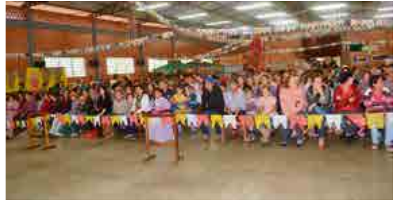
Última edição do Sábado Família teve tema junino