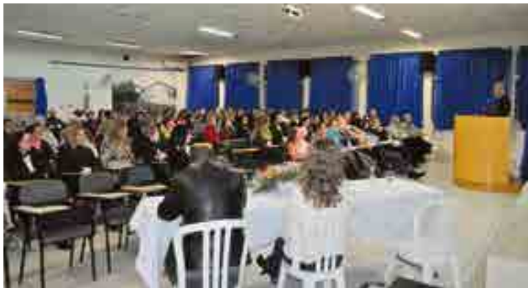
Público lotou o auditório da Escola de Educação Básica Nossa Senhora da Salete

momentos como estes vêm com o intuito de divulgação do espiritismo, trazendo ao público a oportunidade de autorreflexão e autodescobrimento. “Agradecemos a todos que estiveram prestigiando este momento fantástico em Maravilha”,