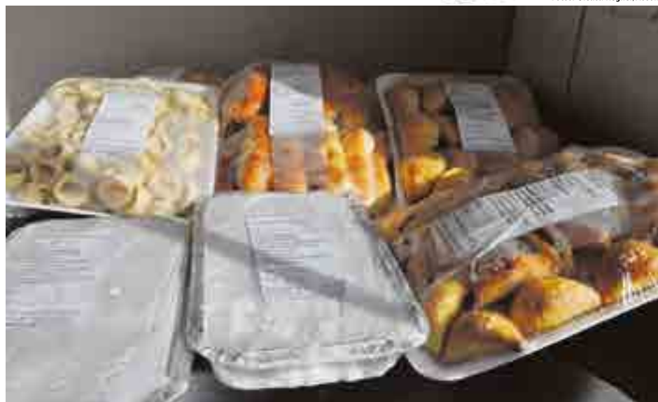
Produtos são fabricados e comercializados pelas irmãs