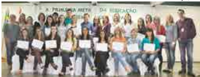
Curso foi oferecido pela prefeitura de Maravilha e Senac de São Miguel do Oeste