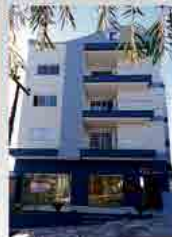
Ed. Presidente Vargas