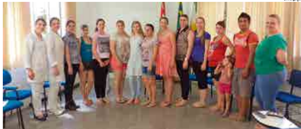
Gestantes estiveram reunidas na terça-feira (9) com equipe de profissionais da ESF Centro I

A vacina é a maneira mais simples e eficiente de prevenir doenças. Uma vez vacinado, caso a criança ou adulto entre em contato com o vírus ou bactérias, o sistema imunológico tem condições de reconhecê-los e prontamente eliminá-los. “É um dever dos pais prevenir as doenças da infância e um direito da criança receber as vacinas gratuitamente nas salas de vacinas e unidades de saúde”, explicam as enfermeiras.