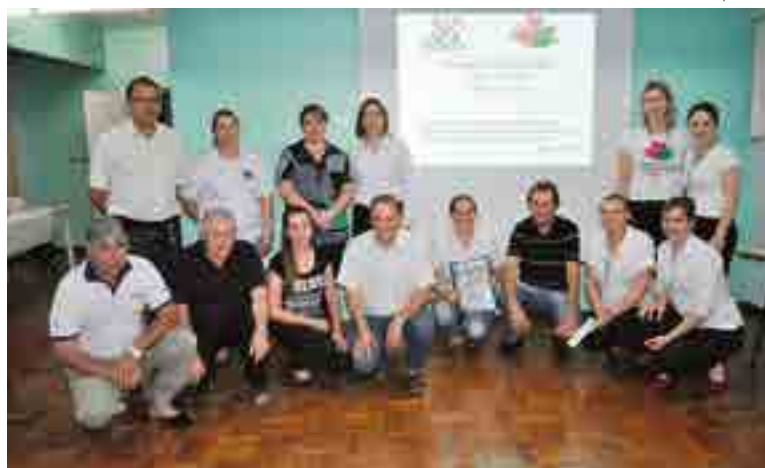
Representantes das entidades parceiras participaram de prestação de contas e comemoram o sucesso nas arrecadações