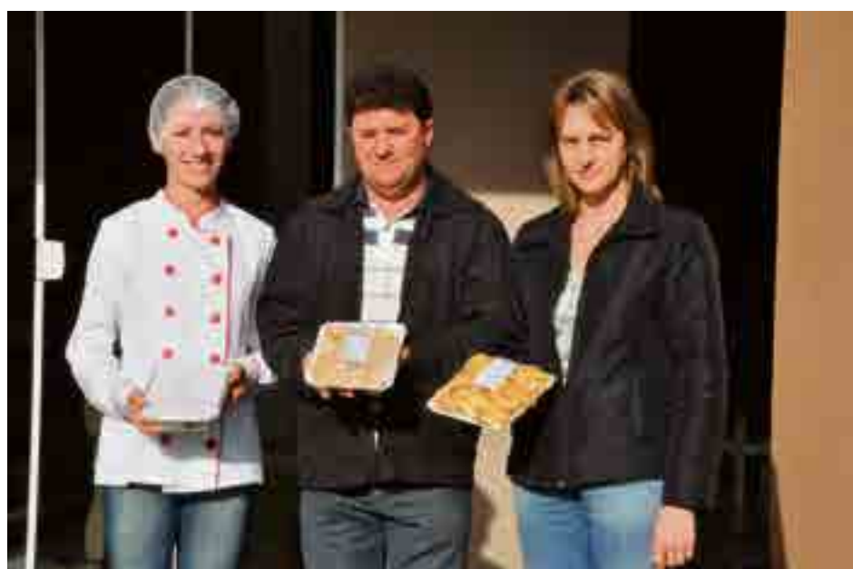
Secretário e técnica de Agricultura visitaram a agroindústria