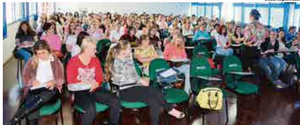
Encontro teve como tema a organização da proposta de avaliação para educação infantil a partir da elaboração de portfólios

De acordo com as professoras, além da importância pedagógica desta proposta de avaliação, está se atendendo às exigências do Art. 31 da LDB Lei Nº 9.394/96 (redação dada pela Lei Nº 12.796, de 2013), atendendo o inciso 5º, que exige a “expedição de documentação que permita atestar os processos de desenvolvimento e aprendizagem da criança.