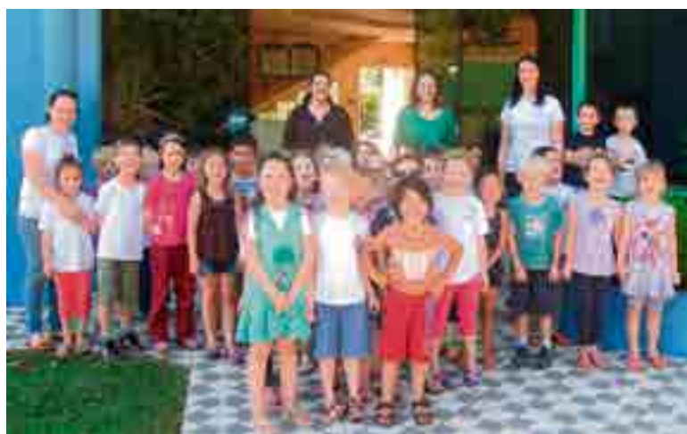
Crianças do turno matutino e vespertino puderam conhecer a empresa Erva Daninha