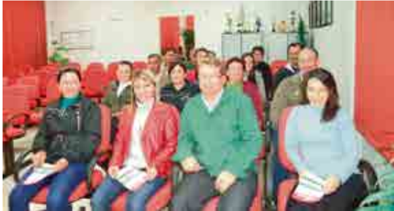
Novo grupo conta com 11 famílias