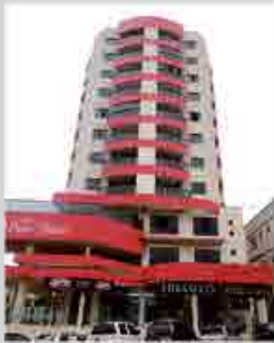
Ed. Dom Riciéri