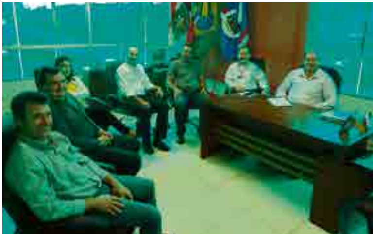
Objetivo foi estreitar laços e melhorar parcerias