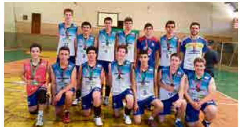
Meninos conquistaram a terceira colocação e garantiram vaga para o estadual

cou dois meses treinando com a seleção em Saquarema/RJ, em preparação para a disputa do Sul-Americano, que ocorreria em julho na Venezuela. A competição foi transferida, mas em novembro ele deve retornar ao Rio de Janeiro, com nova convocação.