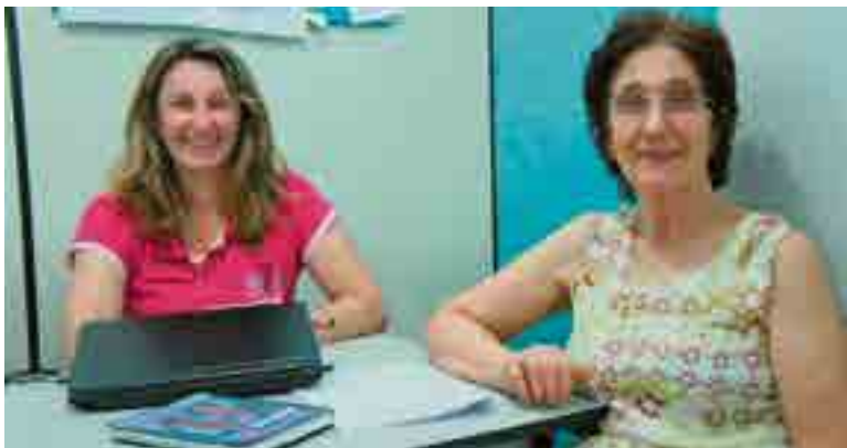
Profissionais ressaltam que nota é reflexo do empenho e investimento na educação no município

As médias de desempenho utilizadas são as da Prova Brasil, para escolas e municípios, e do Sistema de Avaliação da Educação Básica (SAEB), para os estados e o país, realizados a cada dois anos. As metas estabelecidas pelo IDEB são diferenciadas para cada escola e rede de ensino, com o objetivo