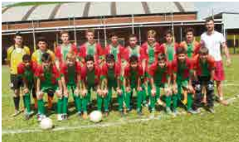
Meninos do sub-14 seguraram o empate