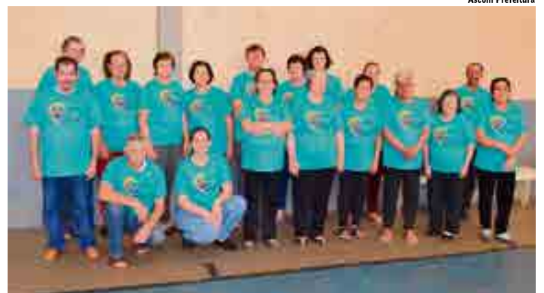
No final do encontro, grupo recebeu camisetas