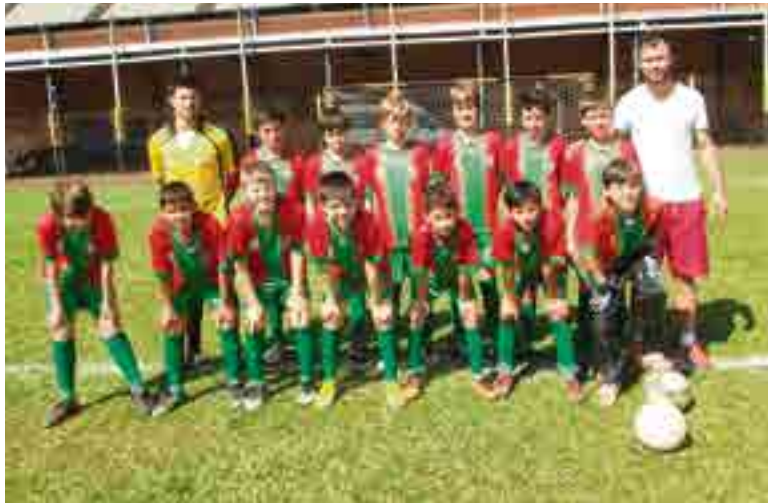
Equipe sub-12 perdeu para os visitantes por 5 x 3