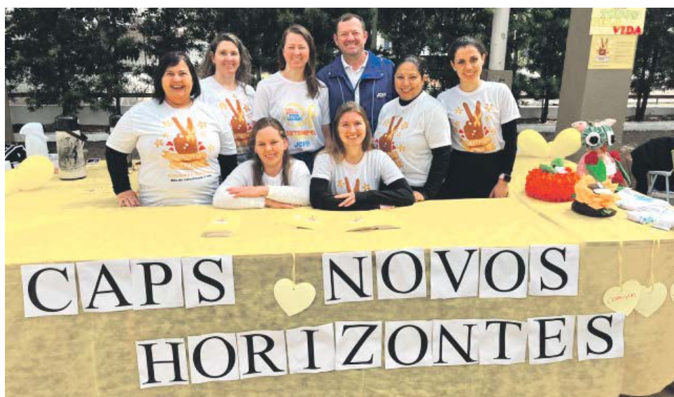
Caps também esteve presente no sábado (10), na Rua Coberta