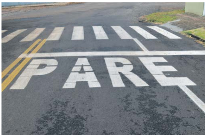
Pintura feita na Rua Armando Weber

SINALIZAÇÃO: Em um ano, em média, foram feitos cerca de 20 mil metros quadrados de sinalização horizontal (pintura). Além disso, foram colocadas mais de 500 placas, no Centro e nos bairros.