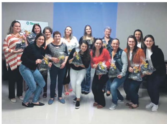
Participantes do Sicredi Mulher no município

Despertar nos jovens de 16 a 21 anos a busca pelos seus sonhos, estimulando o empreendedorismo e o espírito de liderança, são objetivos do programa Líder Jovem. Nesta segunda turma de 2022, o programa conta com 395 inscritos dos três estados de atuação da cooperativa. Os módulos estarão focados também na teoria das múltiplas inteligências. As transmissões acontecem nas segundas-feiras das 20h às 21h.