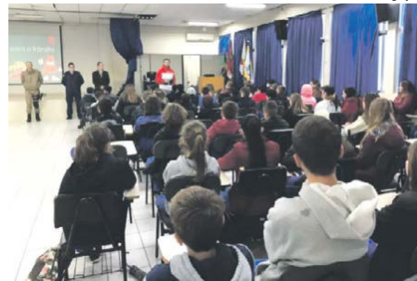
Iniciativa envolveu mais de 6 mil alunos