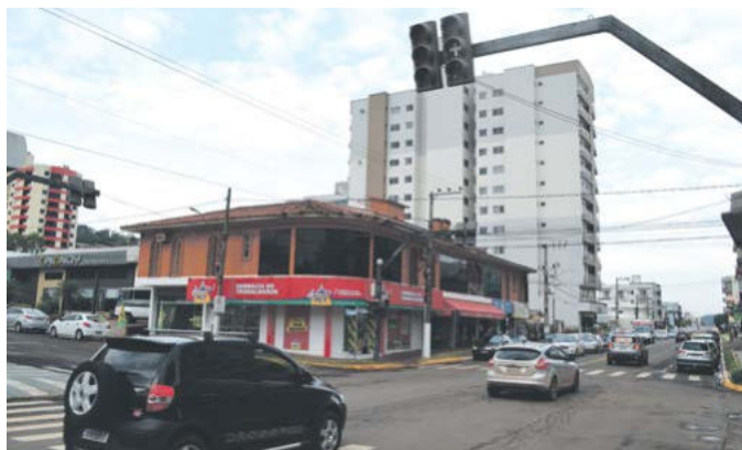
Avenida Sete de Setembro irá contar com rotatórias experimentais

SEMÁFOROS: Após reclamações de motoristas alegando que os semáforos em alguns locais não são eficazes e travam o fluxo de veículos, mudanças estão sendo previstas. Nos semáforos da Avenida Sete de Setembro, nas proximidades da Magazine Luiza e do Restaurante Zatt, serão colocadas rotatórias experimentais. Será feita análise do andamento do trânsito com as mudanças, para então realizar a substituição de forma definitiva. Já na Avenida Anita Garibaldi, esquina com a Rua Prefeito Albino Cerutti Cella, foi optado por uma plataforma elevatória, em razão da circulação de veículos pesados no local.