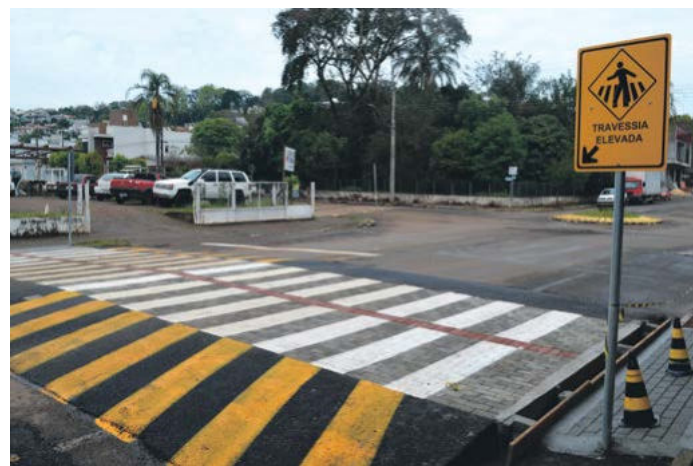
Faixa elevada na Avenida Padre Antônio

FAIXAS ELEVADAS: Foi realizada a implantação de faixas elevadas na frente das escolas, proporcionando maior segurança para a comunidade escolar.