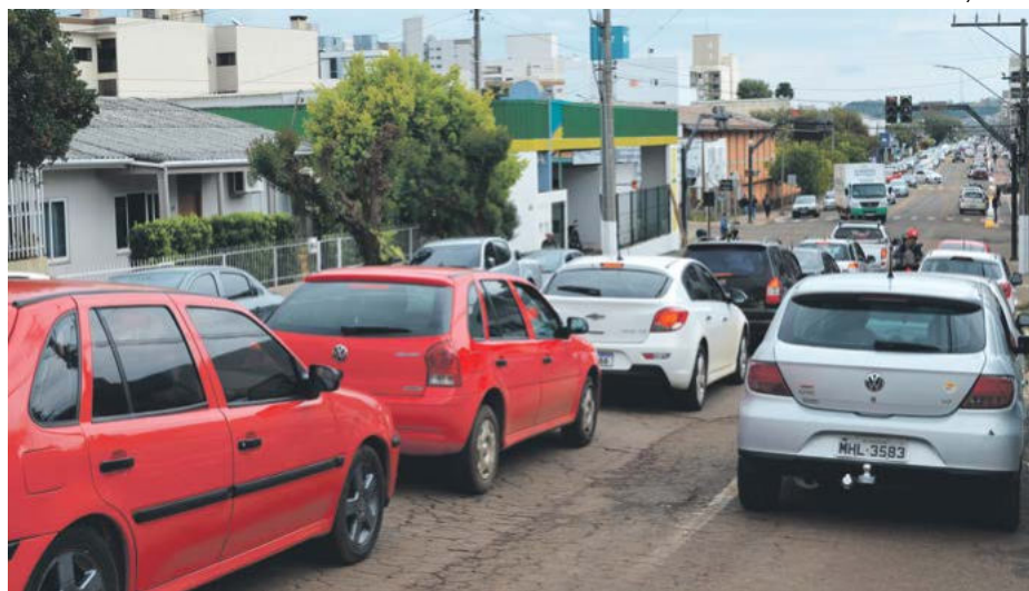
Maravilha registra 23.874 veículos em circulação, conforme dados oficiais do Detran consultados nesta semana