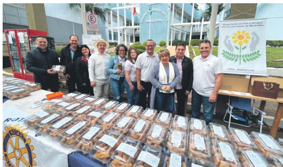
Apae e Rotary estiveram em ação conjunta