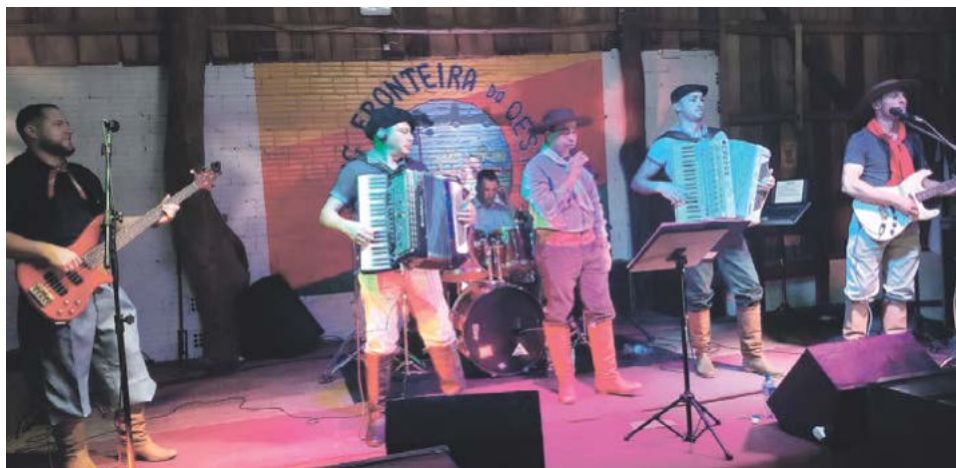
Os Gaudérios de Guaraciaba vão animar o fandango na noite

O Projeto de Resgate Histórico de Flor do Sertão segue neste sábado (17), com mais um evento, a Noite Cultural Gaúcha-Cabocla. Este será o 4º evento alusivo às culturas e etnias que compõem a base cultural da população florsertanense. Este ano, já foram realizadas três noites culturais, enaltecendo e homenageando as culturas polonesa, italiana e alemã, respectivamente. Agora, chegou a vez de homenagear as centenas de famílias que têm raiz cabocla, uma mistura de raças que forma uma das bases étnicas e culturais do município. O evento também fará alusão à tradição gaúcha, de forte presença na