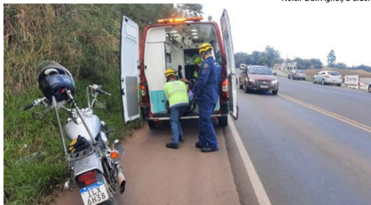
Homem teve ferimentos e foi atendido pelo Corpo de Bombeiros