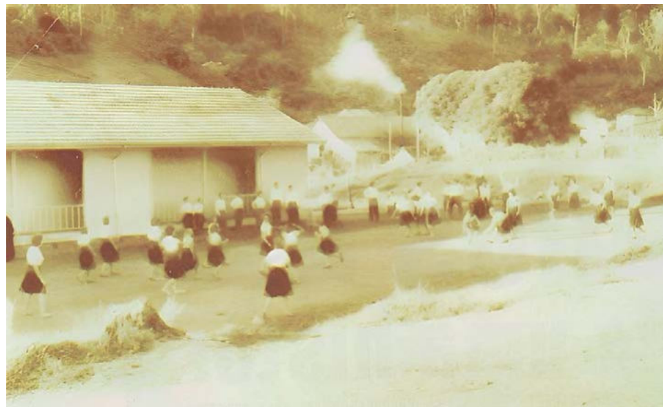
Escola foi, inicialmente, construída de madeira com as mãos da comunidade