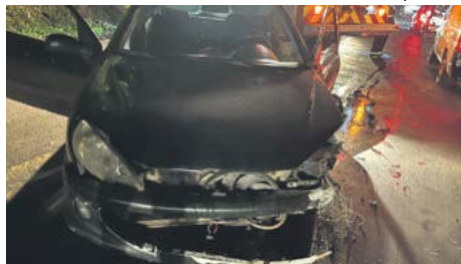
Motorista fugiu logo após o acidente e não foi localizado