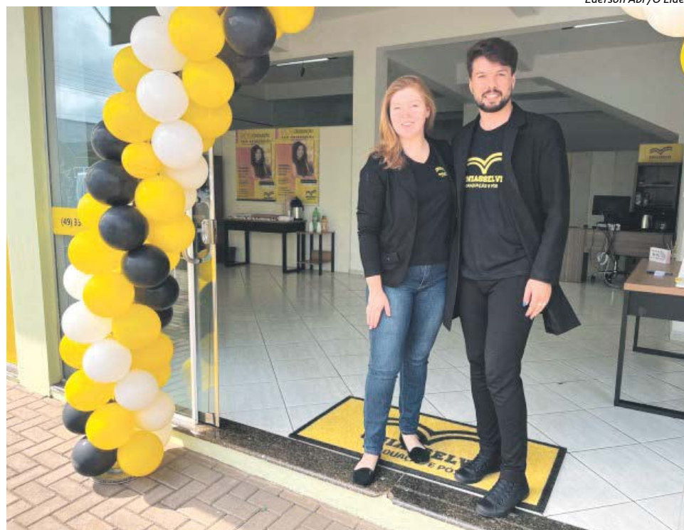
Uniasselvi Graduação e Pós reinaugurou no sábado (10), na Avenida Sete de Setembro