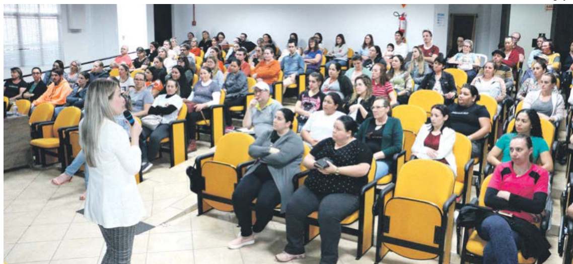
Palestra foi promovida no auditório da Amerios