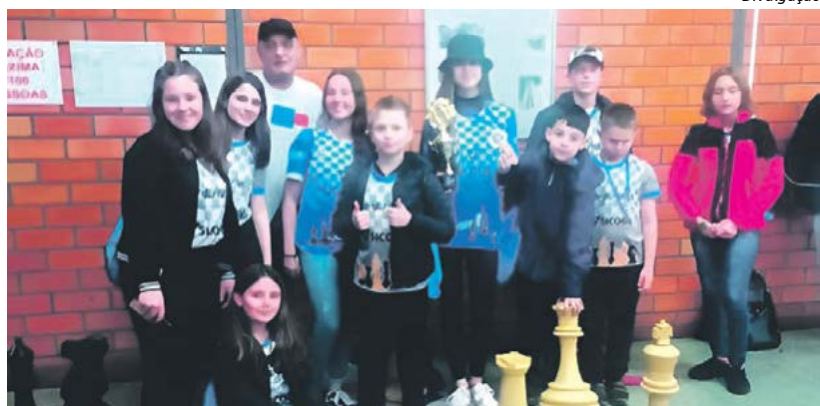
Maravilha participou com 20 atletas