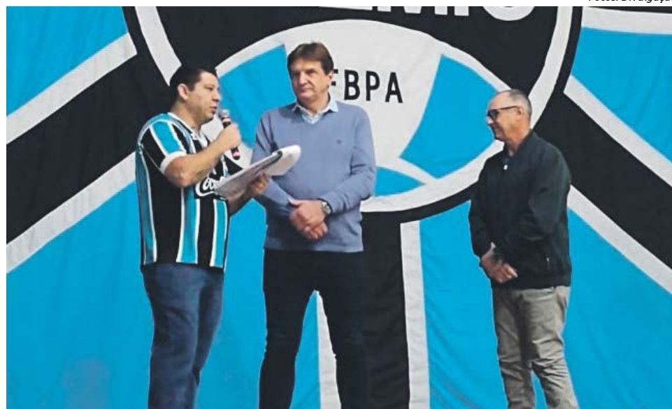
Cônsul do grêmio apresenta os convidados especiais