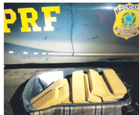
Homens receberam ordem de parada e fugiram momentos antes do acidente

fora do carro já sem vida. O corpo ficou aos cuidados da Polícia Científica para os procedimentos legais.