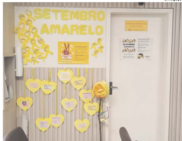
Mural fica na sala de espera