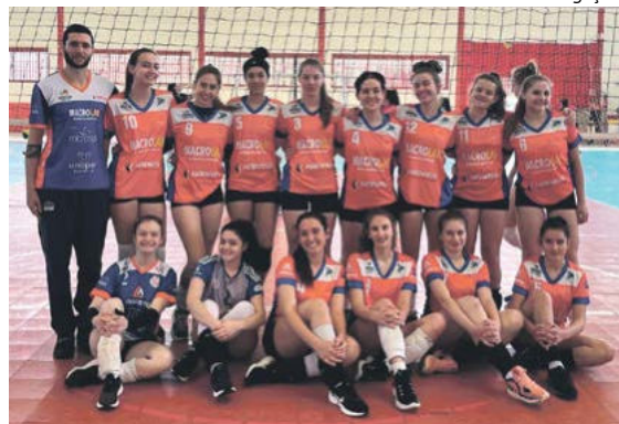
As meninas jogaram em Guaraciaba no sábado (10)

Já no domingo (11), em Maravilha, a equipe Vida Vôlei participou da etapa final da Liga Oeste. Nas duas primeiras etapas os maravilhenses saíram com o título, ficando em primeiro lugar na classificação geral, garantindo a disputa da grande final em casa. O troféu de campeão veio após vitória contra Chapecó por 2 sets a 0, vitória sobre Cunha Porã por 2 sets a 0, e na final jogo ganho por 2 sets a 0 na disputa contra Pato Branco. Maravilha ficou campeão invicto da Liga Oeste Sub-17. O próximo compromisso será a fase estadual dos joguinhos, de 15 a 24 de setembro em Blumenau.