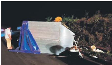
Reboque que levava cavalo tombou na pista após impacto