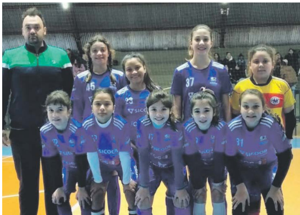
Pelo sub-11 vitória sobre Guaraciaba por 9 a 5

No domingo (11), o município de Maravilha foi representado pelas equipes sub-11 e sub-17 do futsal feminino da