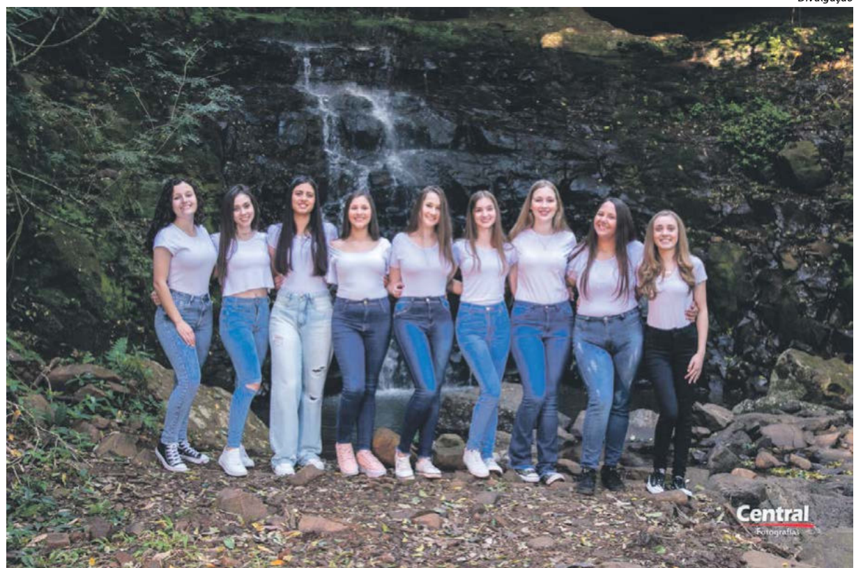
Nove moças disputam o título de rainha

O evento inicia às 21h, no Centro Municipal de Eventos, com acesso gratuito aos participantes.