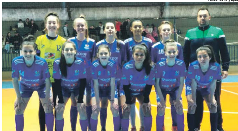
Pelo sub-17 vitória contra Sul Brasil por 3 a 2