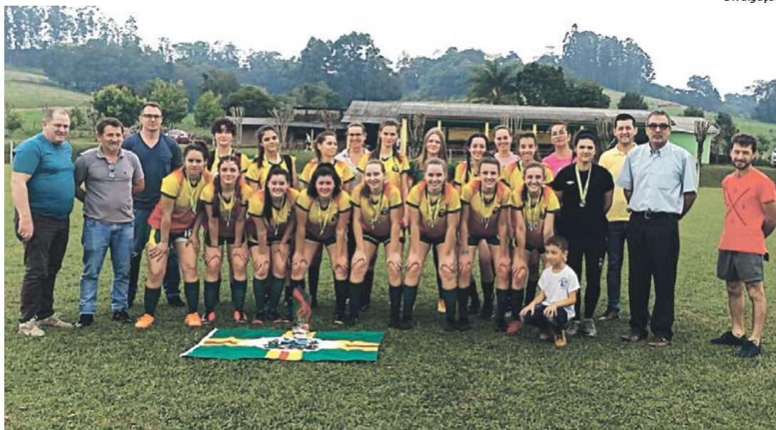
Meninas empataram no tempo normal sem gols e nos pênaltis perderam pelo placar de 4 a 3