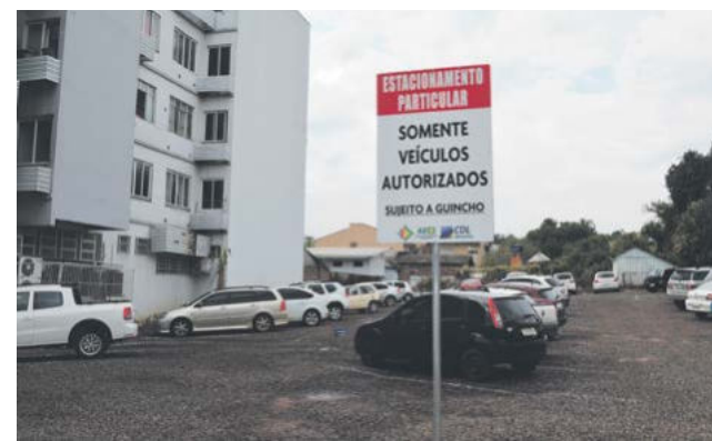
Estacionamento na Avenida Sul Brasil foi inaugurado no último mês

ESTACIONAMENTOS: Os cinco estacionamentos do projeto Vagas Livres Vendem Mais, inaugurados até o momento, somam mais de 200 vagas. A iniciativa é da CDL e Associação Empresarial, em parceria com a Prefeitura.