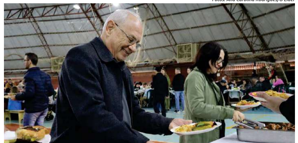
A tradicional macarronada contou com um almoço completo com saladas, galetto e sobremesa