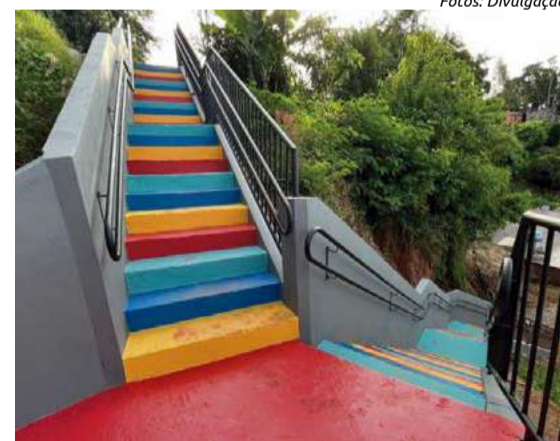
Escada colorida que fica localizada no Bairro Bela Vista faz parte da rota