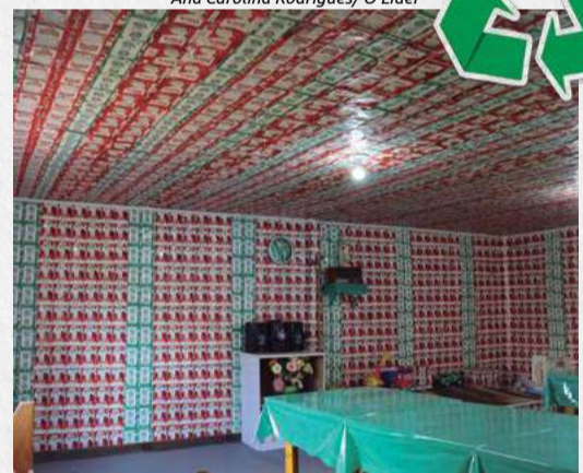
A nova decoração conta com caixinhas verdes e vermelhas