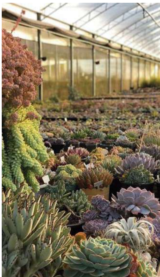
Suculentas Maravilha fica localizada na Linha Nova Brasília