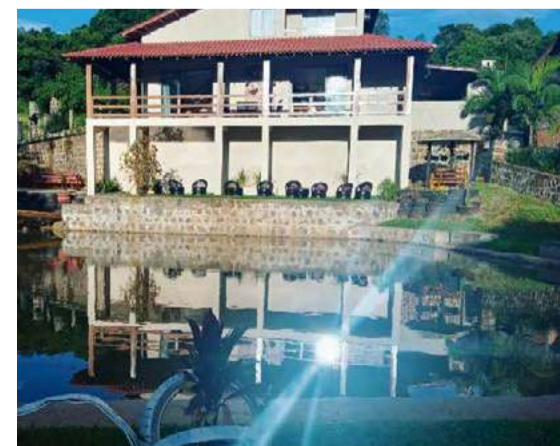
Sítio AcquaVita foi um dos lugares apresentados na reportagem