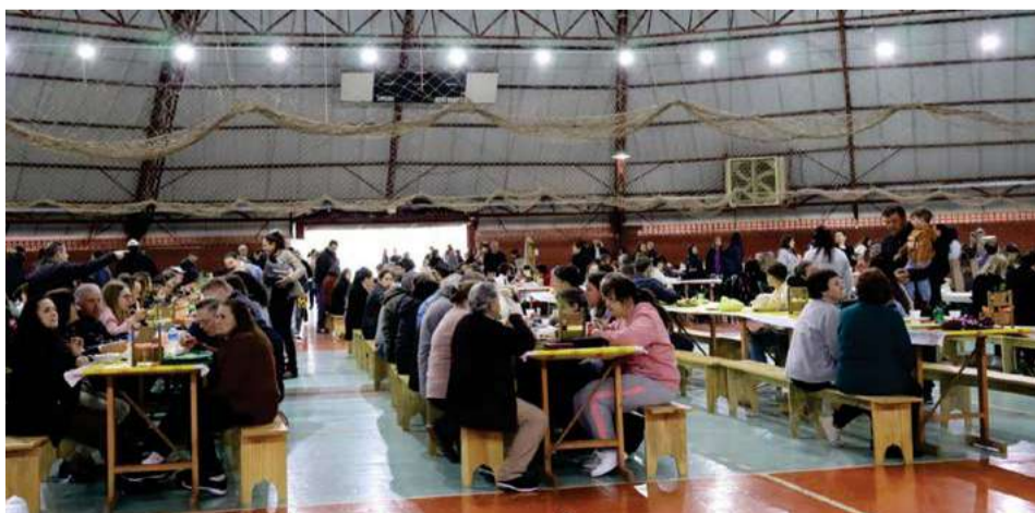
O tradicional almoço reuniu cerca de 900 pessoas

los, sendo um do Grêmio e outro do Internacional, para movimentar os torcedores presentes. E, também, exposição e venda de peças de artesanato, mudas frutíferas e enfeites.