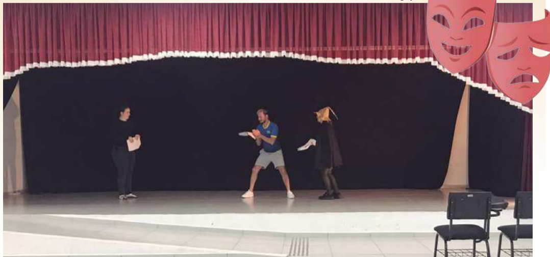
Apresentações iniciam hoje (30)