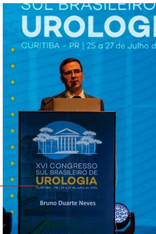
Dr. Bruno Neves aborda as dificuldades em ureteroscopia

O evento teve como objetivo permitir a atualização científica e a troca de experiência entre os participantes, além de promover a exposição de produtos e serviços na área.