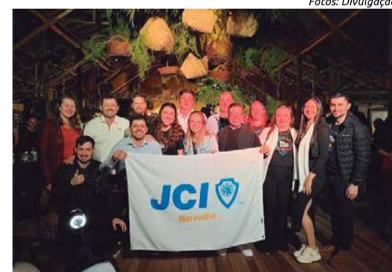
Evento foi acompanhado por membros da JCI de Maravilha