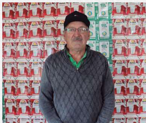
Vilson Cerbaro foi o criador do novo espaço