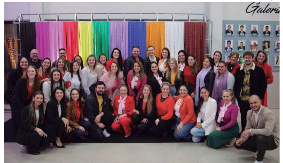
No evento, cada núcleo foi representado por uma cor