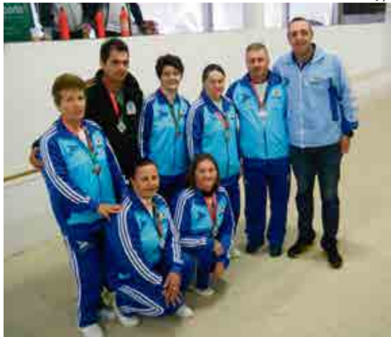
Bocha feminino sagrou-se vice-campeã na fase microrregional