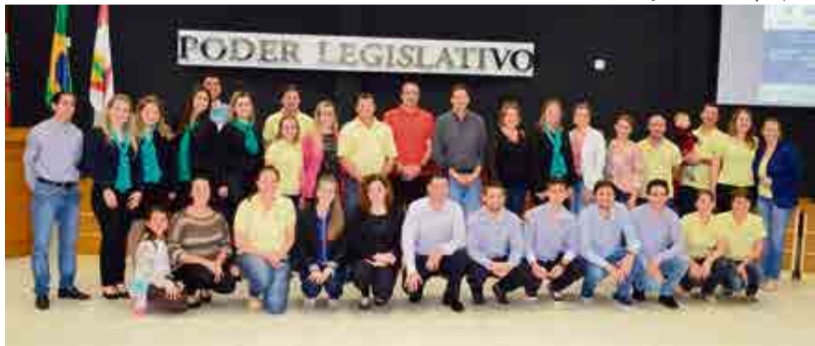
Lançamento oficial do evento foi realizado na noite de terça-feira