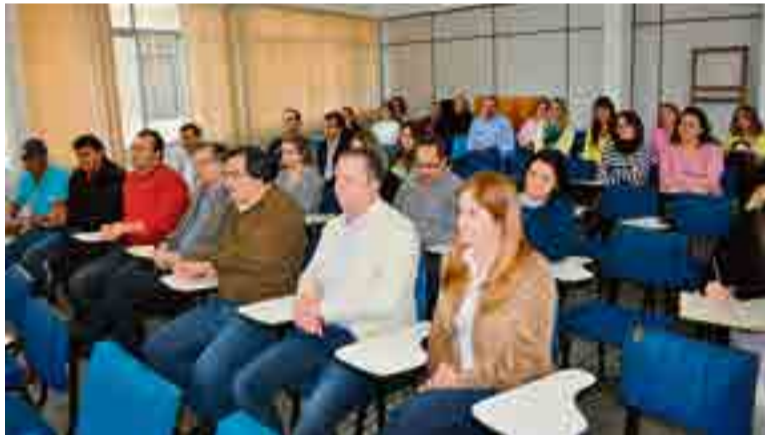
Secretários, diretores e colaboradores estiveram presentes na transmissão de posse