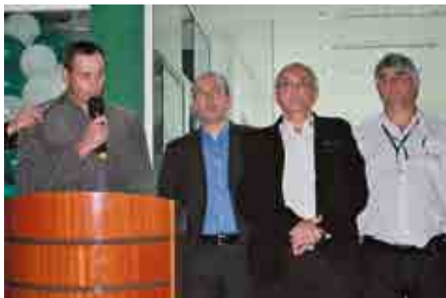
Presidente e fundadores da Cooperativa enaltecem crescimento da mesma