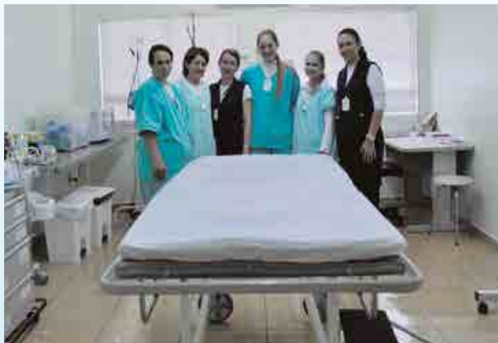
Equipe de enfermagem que auxiliou os médicos na cesárea realizada no Pronto Socorro

Para elas não tem explicação, tampouco como