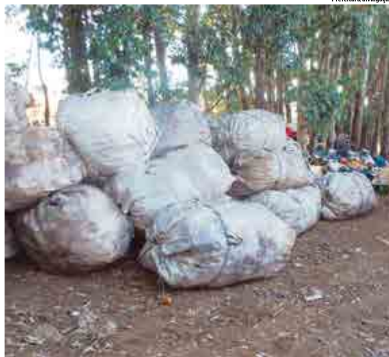
Lixo foi encaminhado ao aterro sanitário particular localizado no município

O material recolhido foi encaminhado ao aterro sanitário particular localizado no município, para onde se destina o lixo urbano coletado diariamente. O aterro está dentro de normas técnicas recomendadas, sendo aprovado pela Fatma.