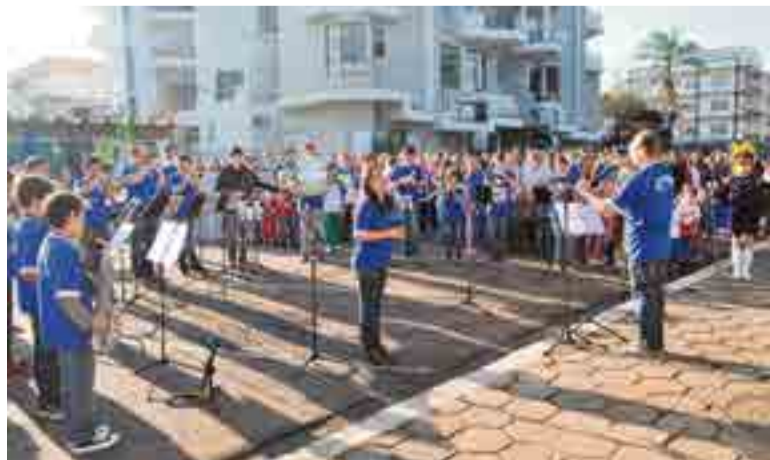
Apresentação da Banda Marcial e das escolas presentes marcou o início da Semana da Pátria