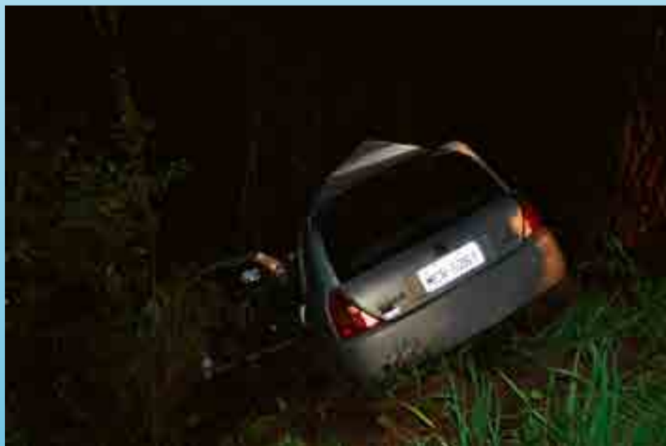
Veículo Clio ficou totalmente destruído