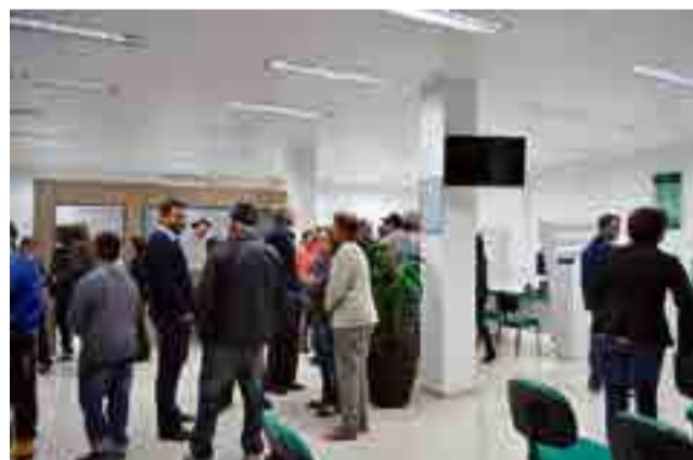
Associados e convidados puderam conhecer as novas instalações