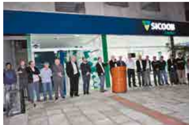
Autoridades do município e colaboradores do Sicoob prestigiaram a inauguração