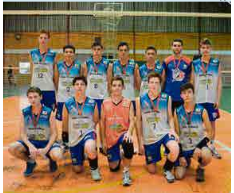
Equipe do voleibol infantil obteve boa participação na Liga Oeste, agora participa da Olesc em São Lourenço do Oeste

da liga serviu para aprimorar o time para os Jogos da Juventude Catarinense (Olesc) que iniciou nesta sexta-feira (5) e segue até terça-feira (9), em São Lourenço do Oeste. “Quero agradecer o apoio da administração municipal, os atletas pelo empenho, e esperamos trazer um ótimo resultado da Olesc, para conseguirmos alcançar o objetivo que é a fase Estadual em Criciúma”, afirmou o professor.