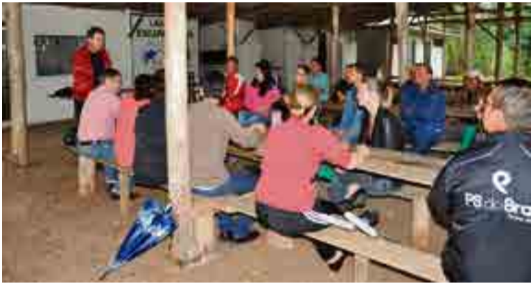
Encontro foi organizado pela Associação de Moradores dos loteamentos Jardim América I e II