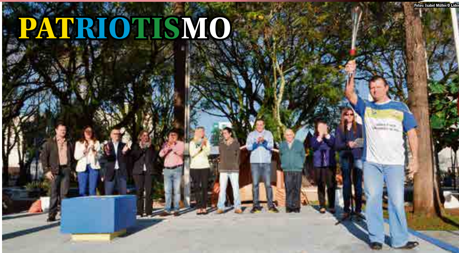
Autoridades participaram da abertura e receberam o fogo simbólico