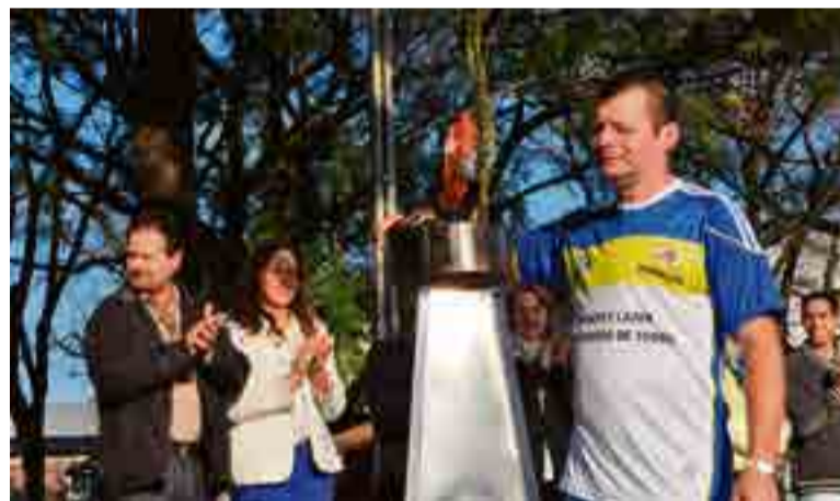
Fogo, principal símbolo da Semana da Pátria, permaneceu na Praça Padre José Bunse durante toda a semana

Nos meses seguintes os brasileiros venceram facilmente o ataque das tropas portuguesas, com apoio inglês. Em pouco tempo, vários países da América, que já haviam se libertado do domínio europeu, apoiaram oficialmente a independência e Pedro tornou-se o primeiro imperador do Brasil, com o título de Dom Pedro I. O Brasil passou a ser uma monarquia, uma forma de governo em que os poderes são exercidos pelo imperador ou rei.