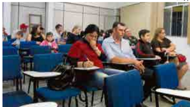
Profissionais do CRAS e do SCFV tiveram um diálogo com os pais sobre as atividades desenvolvidas