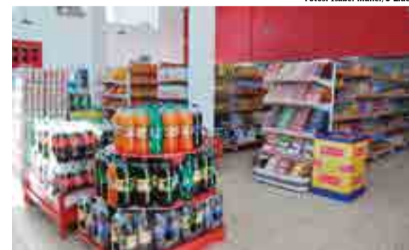
Mercado conta agora com espaço amplo de 375m²