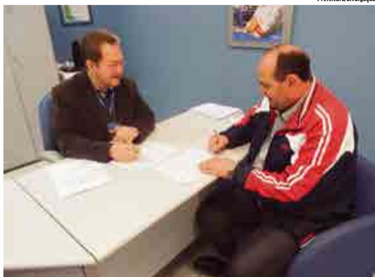
Assinatura foi realizada na Caixa Econômica Federal de Maravilha

Os contratos assinados através da Caixa Econômica Federal e do Ministério das Cidades tratam da pavimentação de partes das ruas Irmão Ambrósio, Padre Júlio, Edu-