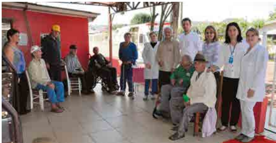
Equipe também esteve no Lar Coração de Maria

A Cidade das Crianças foi o terceiro município do Estado a implantar o programa. Apenas os municípios de Blumenau e Aranguá possuem habilitação até o momento.