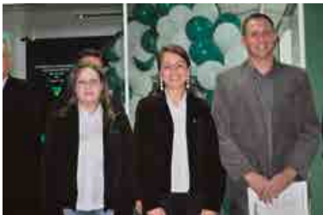
Atuação dos colaboradores da agência de Flor do Sertão foi lembrada