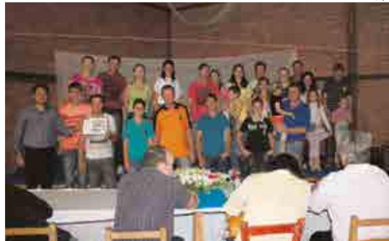
Vencedores foram premiados com uma viagem para Ametista do Sul