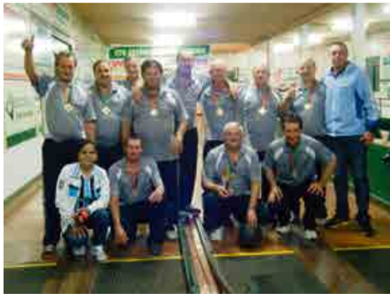
Bolão 23 masculino obteve a primeira colocação