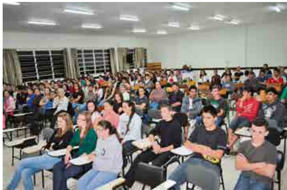
Alunos da E. E. B. João XXII, de Maravilha, e da Escola de Educação Básica Jorge Lacerda, de Flor do Sertão