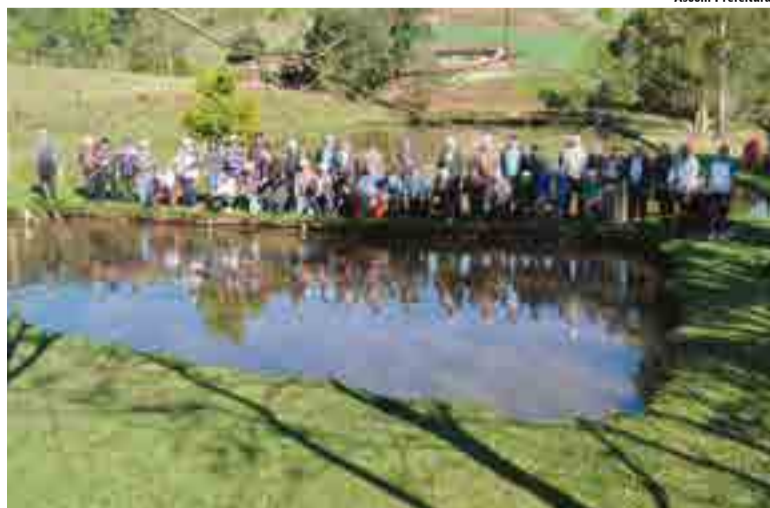
Aproximadamente 60 idosos participaram da segunda edição da pescaria