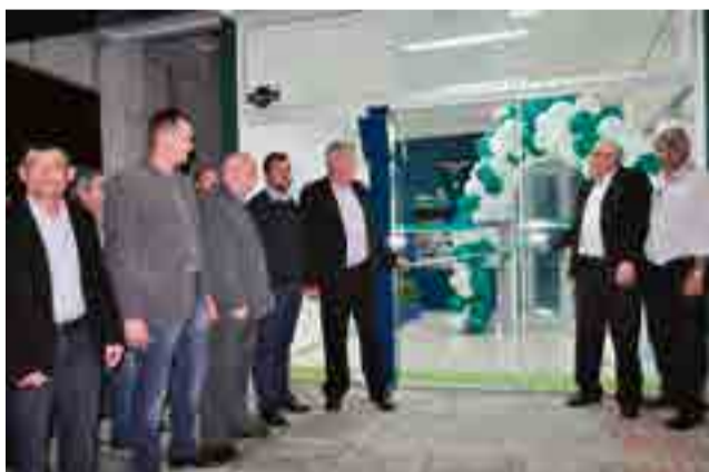
Desenlace da fita marcou a inauguração da agência de Flor do Sertão