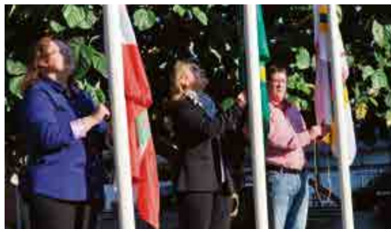
Hasteamento e arriamento da bandeira foram realizados todos os dias, com a participação de alunos e integrantes de entidades do município