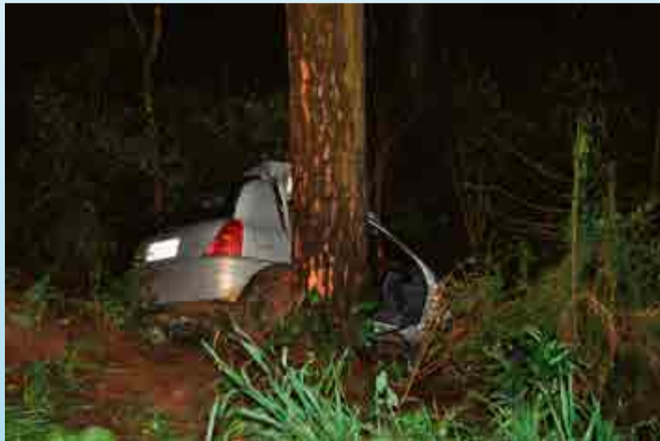
Acidente ocorreu por volta das 17h40, na BR-282 em Cunha Porã