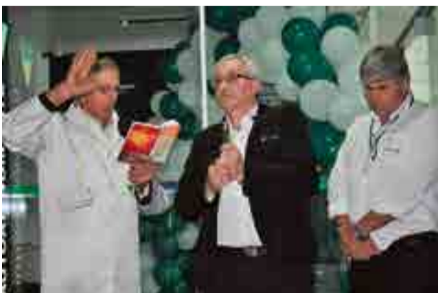
Benção foi realizada em toda a instalação