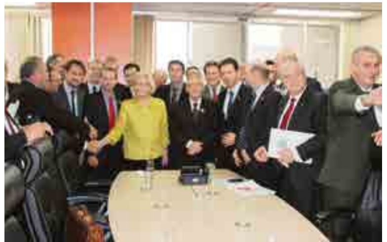
Encontro objetivou apresentar real situação diante da problemática que compromete a estrutura da ponte