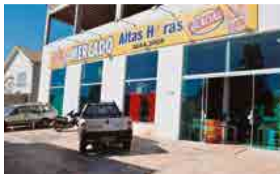
Altas Horas está localizado na Rua 15 de Novembro, 186