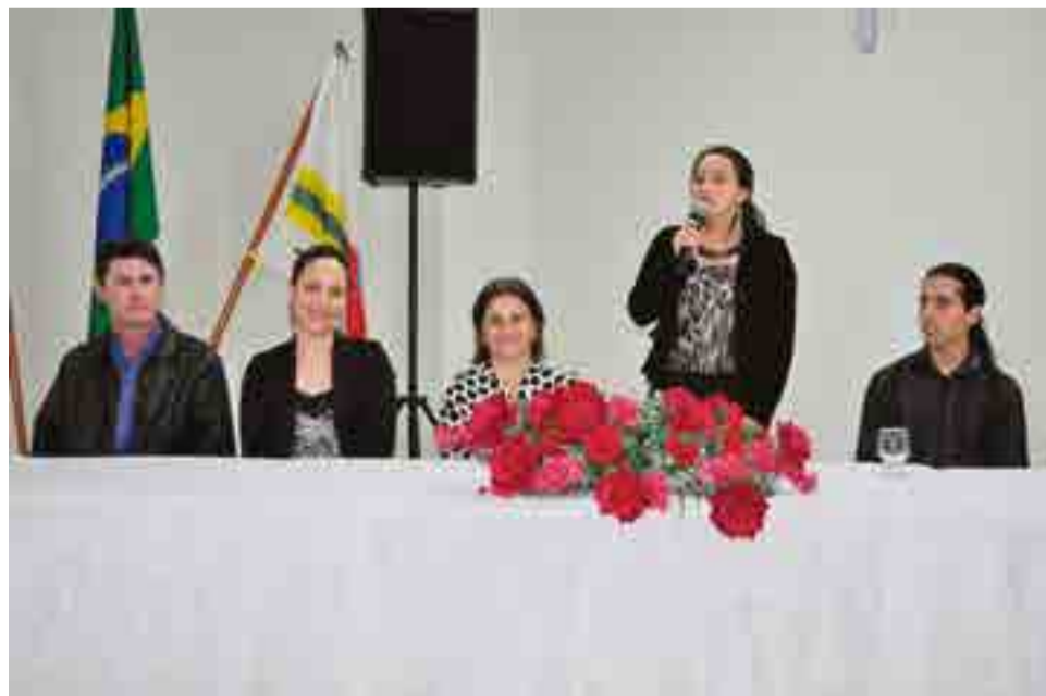
Professora de História, diretoras das escolas presentes e representante do Poder Legislativo acompanharam o lançamento do livro