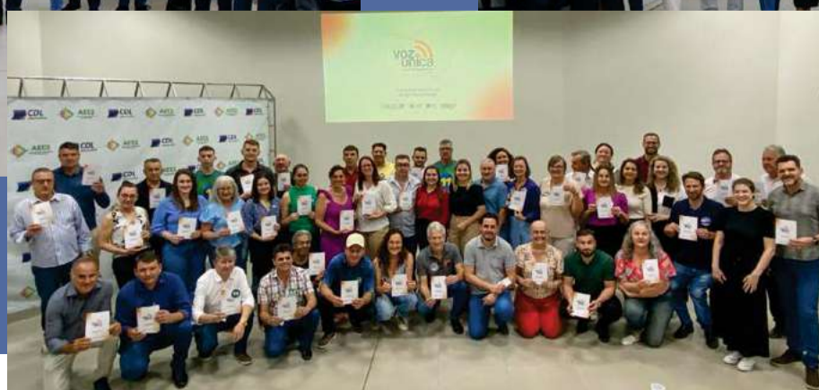
Candidatos ao legislativo receberam cartilha