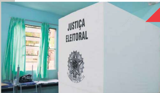
Cerca de 15 mil eleitores compareceram às urnas

As eleições municipais em 2020, originalmente marcadas para outubro, foram adiadas para o mês de novembro em razão da pandemia de coronavírus. Para garantir maior segurança ao eleitor, foram feitas diversas adaptações e o processo contou com regras inéditas, como o uso obrigatório de máscaras. As principais orientações foram: manter distância mínima de um metro nas filas e usar álcool em gel antes e depois de votar.