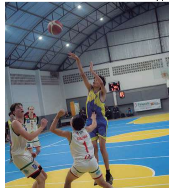
Neste ano, 120 municípios participaram da Olesc