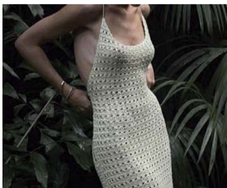
Vestido longos surgem como protagonistas nesta temporada

De acordo com o meteorologista do Grupo WH Comunicações, Piter Scheuer, a primavera no Extremo-Oeste deve ser caracterizada por uma alternância entre momentos de calor prolongados e de frio fora de época. Já a chuva deve ser irregular, com possibilidade de temporais. “Fenômeno La Niña atuando. Um mês chove bem, no outro chove pouco” , diz. Ele adianta que o mês de outubro deve ter chuvas próximas ou acima da média climatológica. Novembro, apesar de começar chuvoso, deve ser mais seco, trazendo dias de sol e calor.