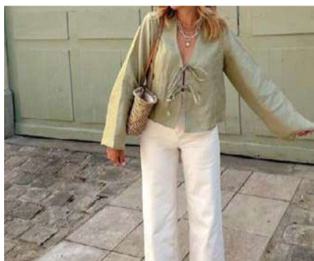
Bata com amarração transmite leveza e frescor