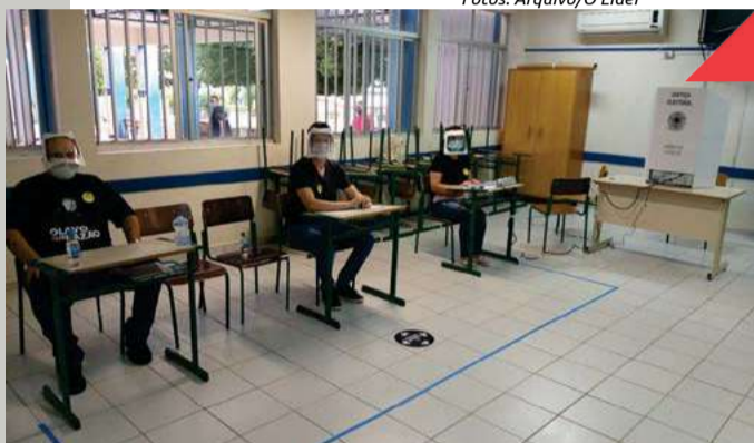
Em 2020, uso de máscaras era obrigatório