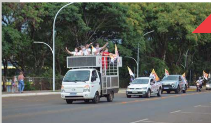
Carreata marcou a comemoração