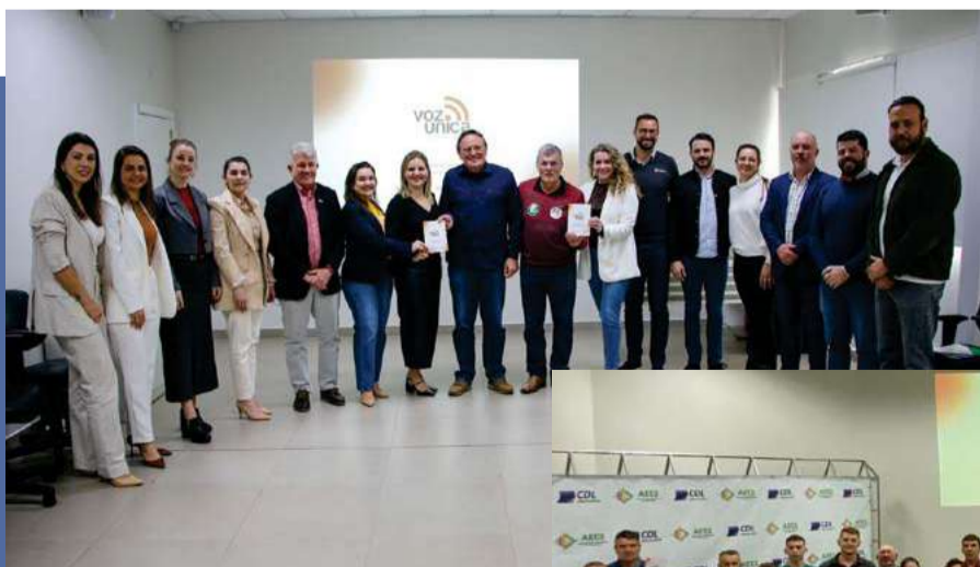
Coligação "Juntos faremos ainda melhor" (MDB e PL)