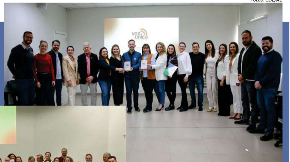
Coligação "Maravilha precisa de você" (PP, PSDB/Cidadania, PSD e União Brasil)