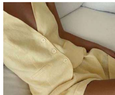
O amarelo manteiga é uma das principais tendências da estação