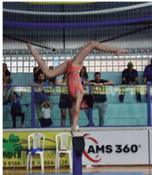
Modalidade de ginástica artística teve competições no Ginásio Municipal

Nesta sexta-feira (20) e sábado (21) ainda vão ter as finais das modalidades de basquete feminino, ciclismo, futsal masculino, handebol, taekwondo, tênis de mesa masculino e feminino, voleibol feminino, vôlei de praia masculino e feminino, e xadrez. A programação completa e atualizada fica disponível no site da Fesporte.