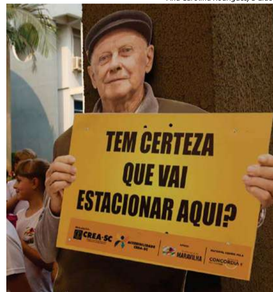
Cerca de 14 placas educativas foram espalhadas pela cidade