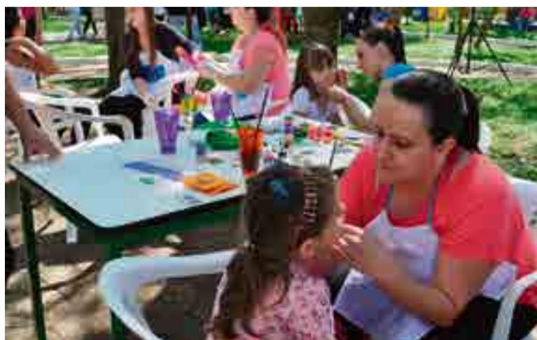
Pintura facial foi realizada no local