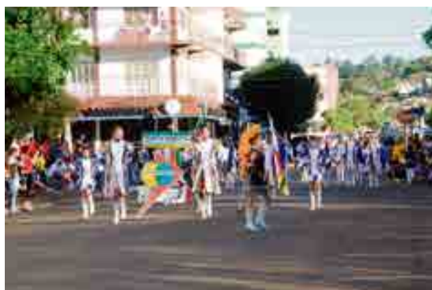
Banda Marcial Cidade das Crianças