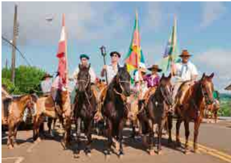
Pais e filhos levaram a chama crioula e as bandeiras, conduzindo o desfile