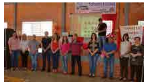
Autoridades prestigiaram o evento