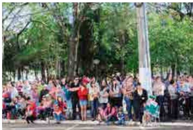
Centenas de pessoas prestigiaram a 7ª edição do Festival