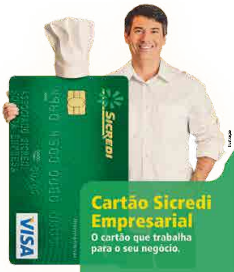
Cartão Sicredi Empresarial tem aceitação nacional e internacional

O cartão Sicredi Empresarial tem aceitação nacional e internacional. O Sicredi oferece também a praticidade de uma fatura única e de demonstrativos de despesas por portador, o que permite a identificação dos gastos por usuário do cartão.