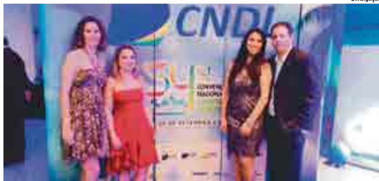
Presidente e vice-presidente da CDL/Associação Empresarial prestigiam evento nacional

Durante a solenidade de abertura, no dia 17, houve a entrega do Mérito Lojista Nacional, prêmio destinado a fornecedores, imprensa e parceiros que tenham se destacado em prol do varejo. Atracões paralelas também foram realizadas na convenção, entre elas o 14º Encontro Nacional da CDL Jovem e o 9º Encontro Nacional de Comunicação do Movimento Lojista. No encerramento, destaque para o show com a cantora Ivette Sangalo.