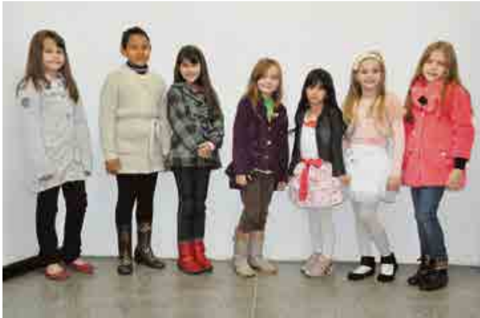
Oito meninas concorrem ao título. O desfile será no dia 6 de outubro