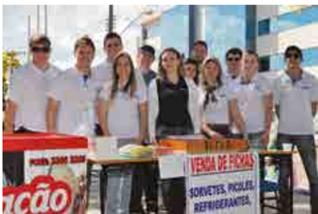
Formandos de Administração venderam pizzas, sorvetes, águas e refrigerantes