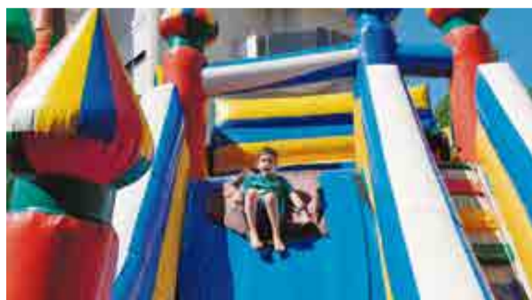
Brinquedos infláveis fizeram a alegria dos pequenos