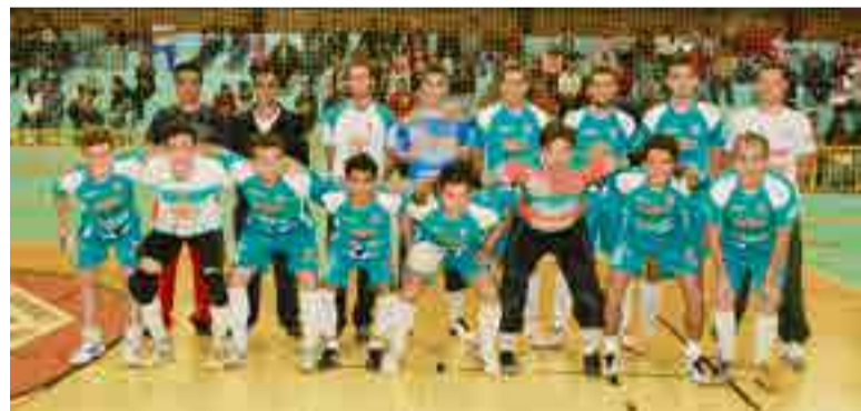
Equipe masculina enfrentará Bom Jesus do Oeste