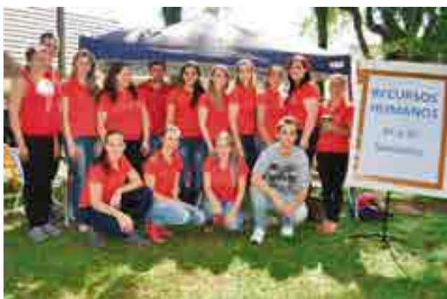
Recrutamento de currículos foi feito pelos 3º e 4º semestres de Recursos Humanos