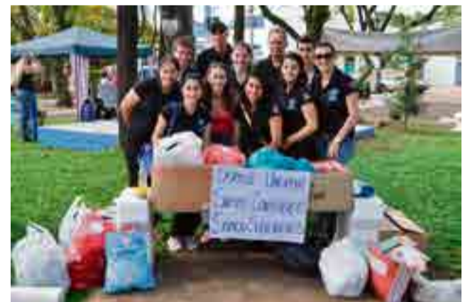
Quarto semestre de Ciências Contábeis arrecadou roupas e brinquedos para a Assistência Social de Maravilha