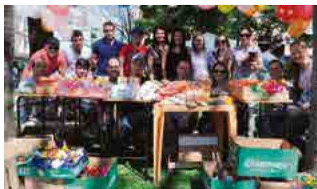
Alunos de Processos Gerenciais do 2º semestre recolheram alimentos não perecíveis e em troca entregaram uma flor. Alimentos serão doados para o Lar de Idosos e para as mães acolhedoras