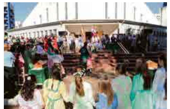
Inverno artística do CTG participou da celebração