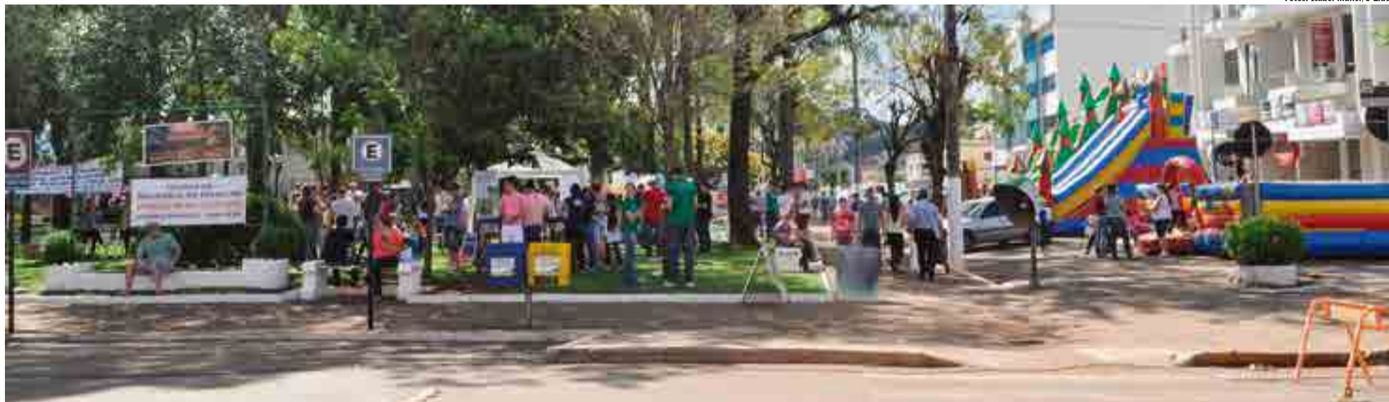
Diversas pessoas acompanharam as atividades na Praça Padre José Bunse