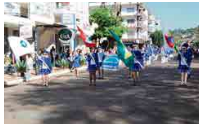
Fanfarras do Centro Educacional Vereador Raymundo Veit