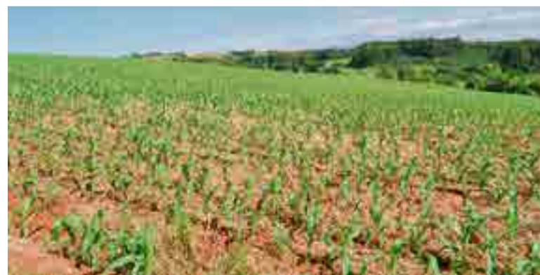
Agricultura é destaque no município, com cerca de 380 famílias que ainda residem no interior