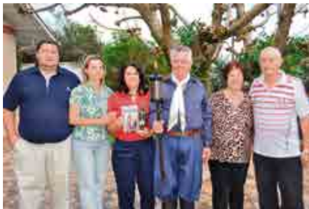
Família de Boqueirão acompanhou a homenagem e recebeu os integrantes do CTG Juca Ruivo