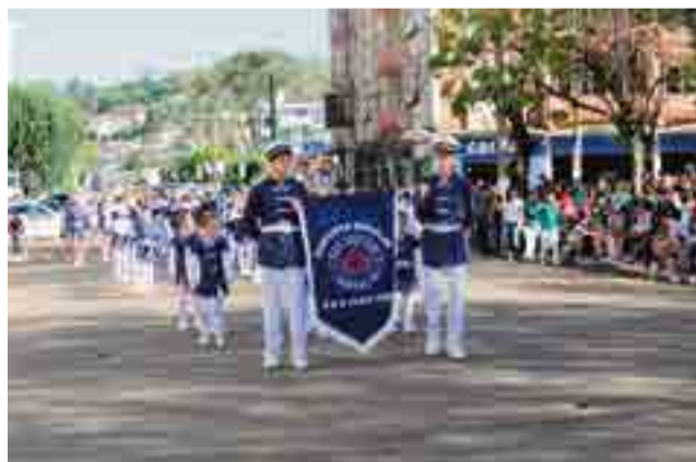
Fanfarras da Escola de Educação Básica João XXIII