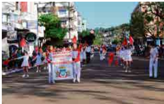
Fanfarras Municipais de Tigrinhos

Fanfarras era como antigamente se chamava o toque de trompas e clarins nas caçadas. Posteriormente a designação foi estendida às bandas marciais que acompanhavam os cortejos cívicos ou regimentos de cavalaria. Sete grupos se apresentaram, sendo que receberam um troféu de participação: Fanfarras Arte Musical do Centro Educacional Mundo Infantil (CAIC), Fanfarras do Centro Educacional Vereador Raymundo Veit, Fanfarras da Escola de Educação Básica João XXIII, Fanfarras do Centro Educacional Monteiro Lobato, Fanfarras da Escola de Educação Básica Nossa Senhora da Salette, Fanfarras Municipais de Tigrinhos e Banda Marcial Cidade das Crianças.