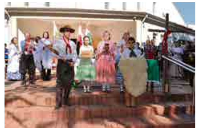
Símbolos lembraram costumes da tradição