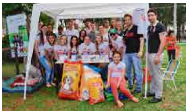
Feira da Adoção, com orientação dos maus-tratos, venda de camisetas, chaveiros e arrecadação de ração foi organizada pelo 4º semestre de Administração, 4º semestre de Marketing e ONG Ame Bicho