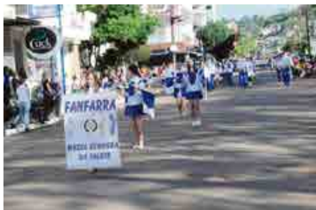
Fanfarras da Escola de Educação Básica Nossa Senhora da Salette