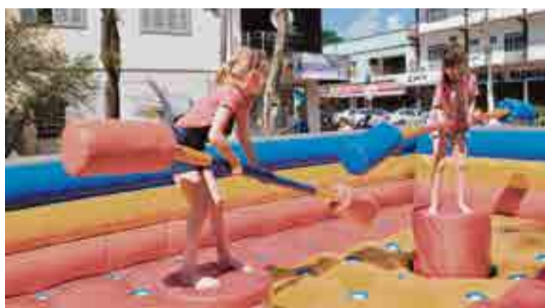
Atividades diferenciadas e brinquedos atraíram as crianças

Estamos satisfeitos com o resultado, foi uma parceria que reuniu muitos maravilhenses, que puderam se divertir e participar de diversas atividades oferecidas durante todo o dia”