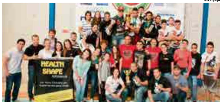
Equipe Elite Jiu-Jítsu conquistou título de Campeão Geral Estadual