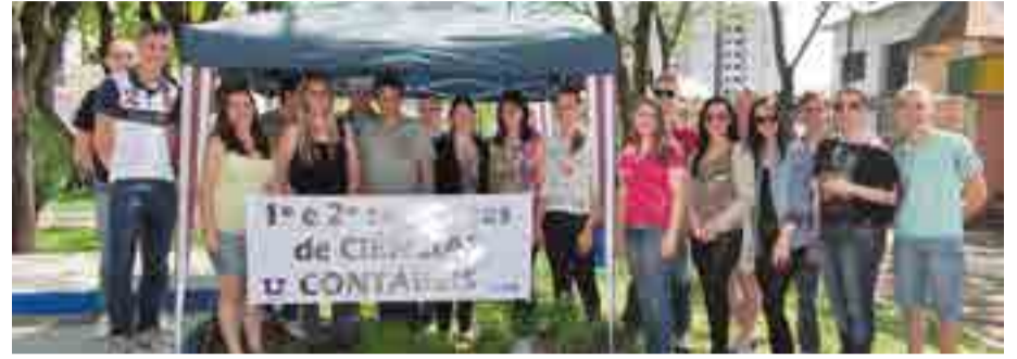
Acadêmicos do 1º e 2º semestres de Ciências Contábeis entregaram mudas de árvores

do pelos acadêmicos nos municípios onde residem. É uma forma inovadora para difundir a ideia, dando a oportunidade às instituições responsáveis socialmente integrarem-se à comunidade, contribuindo com a sustentabilidade.