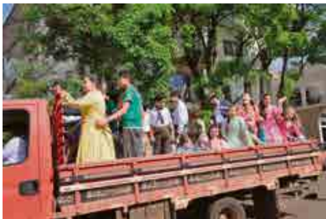
Crianças da inverno artística também participaram