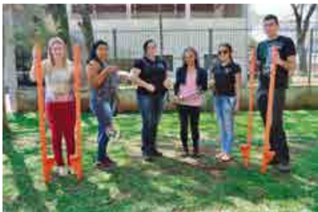
Alunos do 3º e 4º semestres de Letras levaram brincadeiras com materiais recicláveis