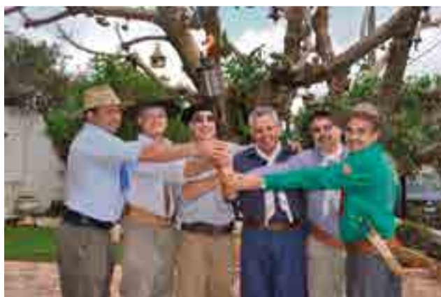
Ex-patrões do CTG Juca Ruivo acenderam a chama crioula