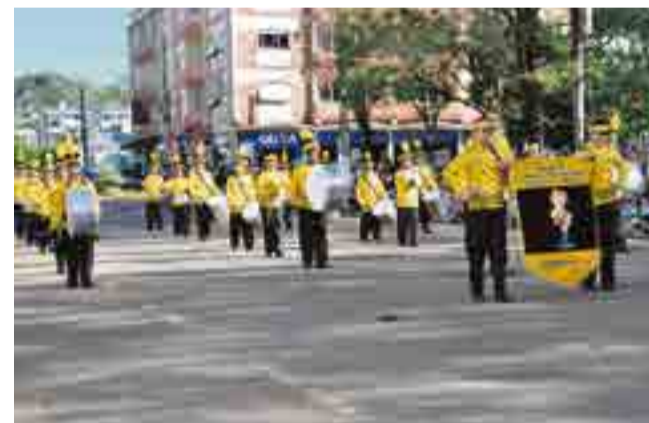
Fanfarras do Centro Educacional Monteiro Lobato