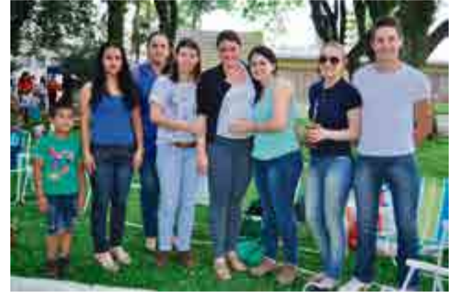
5º e 6º semestres de Ciências Contábeis arrecadaram doações para o Lar de Idosos Nupai, de Palmitos