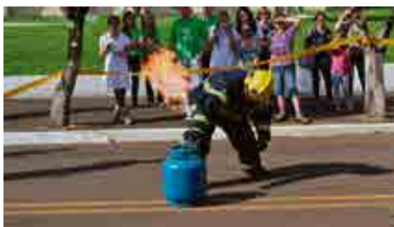
Bombeiros realizaram demonstração de atividades