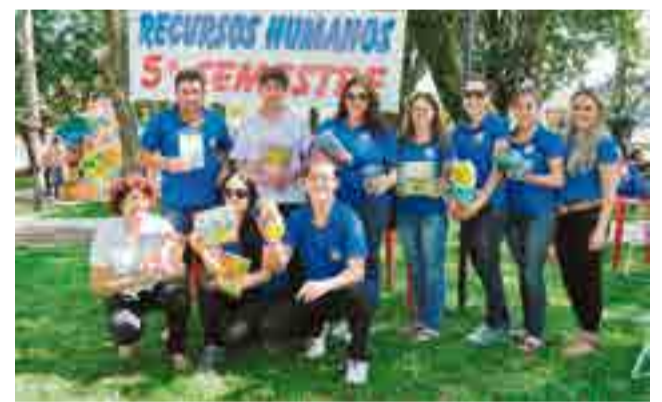
Pedágio do Brinquedo e do Livro arrecadou donativos que serão doados para creches e escolas que possuem pouco acervo, pelo 5º semestre de Recursos Humanos