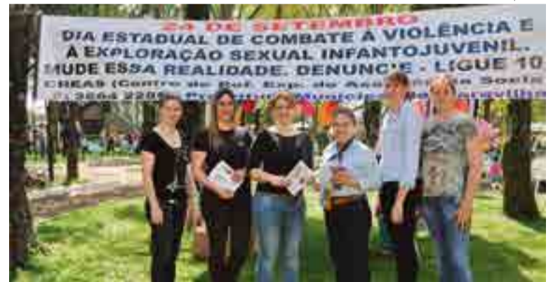
Equipe do Creas repassou orientações e entregou folders informativos