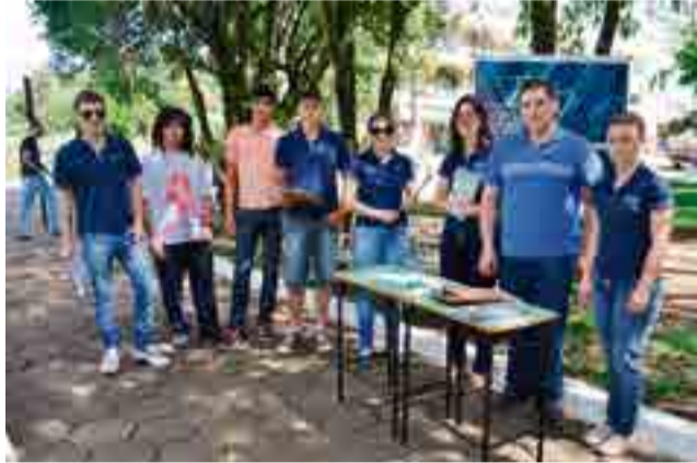
Acadêmicos do 5º semestre de Administração realizaram pesquisa de mercado