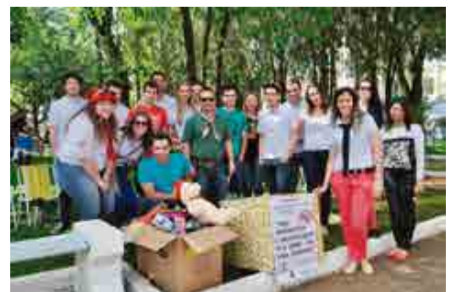
Curso de Processos Gerenciais do 2º, 3º e 4º semestres arrecadaram brinquedos para o CRAS de Maravilha