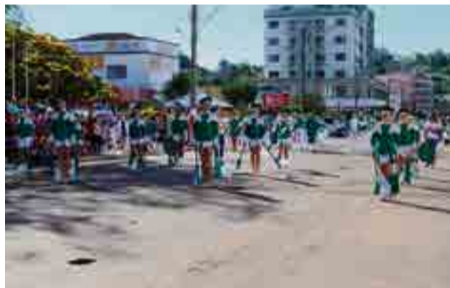
Fanfarras Arte Musical do Centro Educacional Mundo Infantil