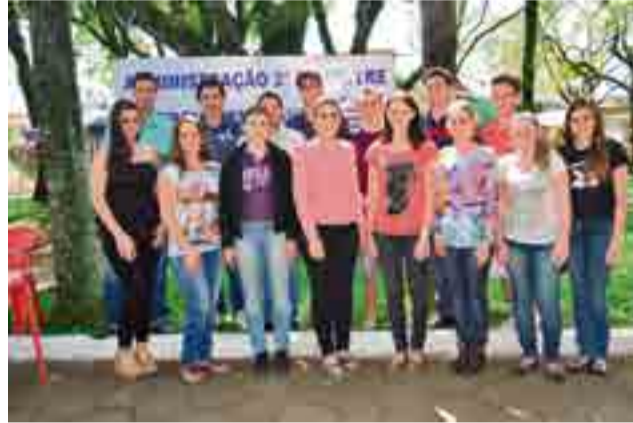
Segundo semestre de Administração abordou "Economia de energia e energia renovável"