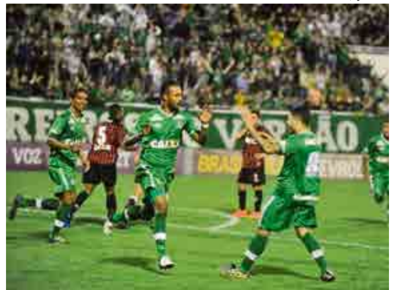
Com a vitória a equipe foi a 27 pontos

FIQUE TRANQUILO A GAMBATTO PREPAROU OFERTAS IMPERDÍVEIS