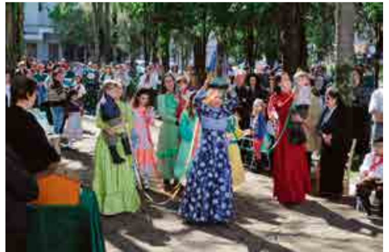
Nossa Senhora e as cores da Bandeira do Rio Grande do Sul foram levadas até o altar