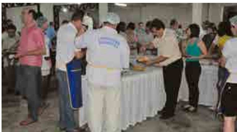
Integrantes do Lions Clube Maravilha Oeste e Clube de Lions Maravilha auxiliaram no jantar