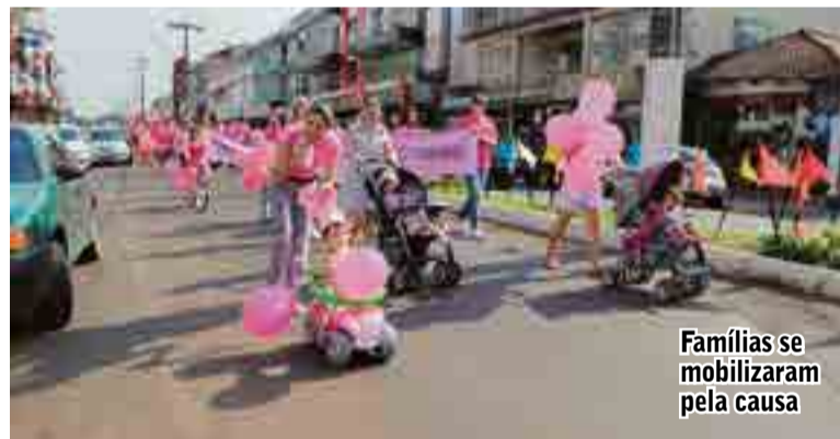
Famílias se mobilizaram pela causa