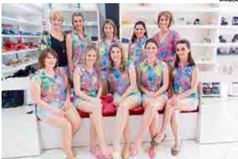
Equipe Duetto Modas apresentou as novidades Primavera/Verão

A equipe da Duetto Modas agradece pela participação no evento, em especial aos modelos, fornecedores, amigos e clientes. "Esperamos que os clientes e amigos venham conhecer a coleção Frescor Primavera/Verão 2015. Venha sentir na pele essa sensação. A cor transforma, a brisa toca e o frescor contagia", afirmam as sócias-proprietárias.