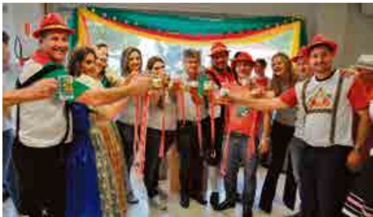
Sicredi recebeu as autoridades para a sangria do segundo barril de chope