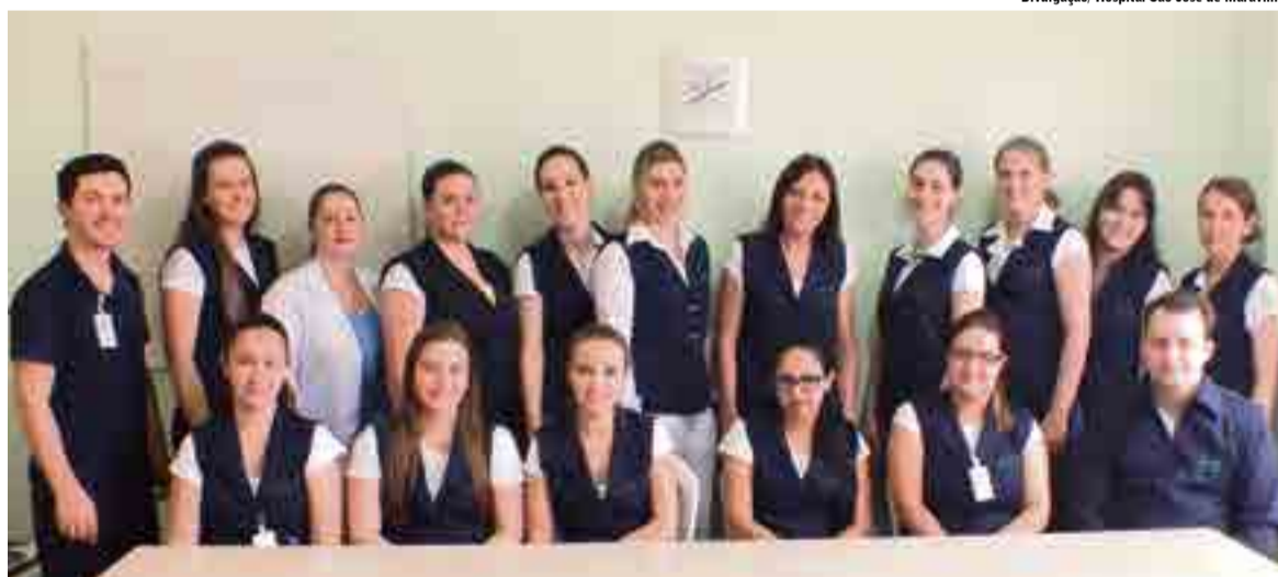
Seis profissionais da Enfermagem do Hospital São José de Maravilha estarão trabalhando no programa