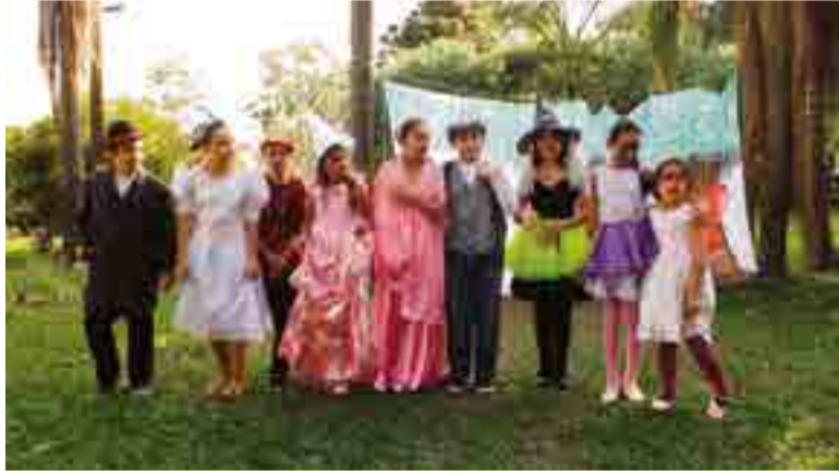
Diversas brincadeiras e brinquedos infláveis fizeram a alegria das crianças