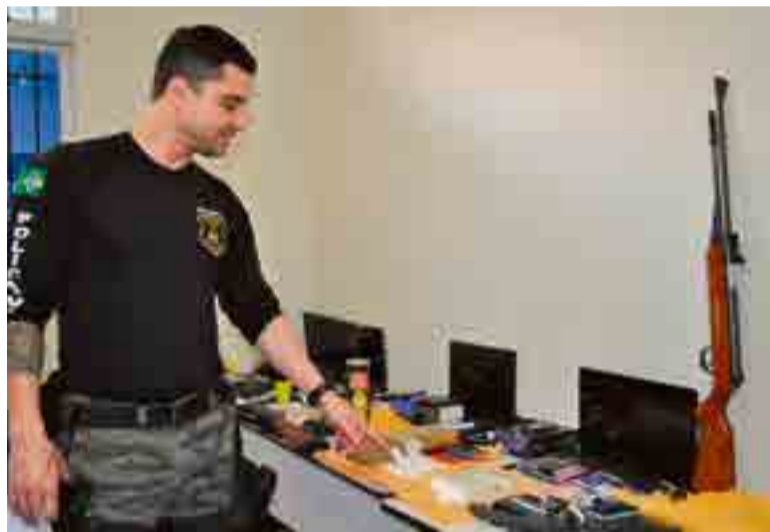
Delegado fez balanço das apreensões

Conforme o delegado, essas são prisões temporárias de 30 dias, revogáveis para mais 30, para a conclusão das investigações. “Certamente utilizarei o prazo inteiro para realizar essas investigações, pois somente em usuários já identificados são mais de 100 pessoas que teremos que ouvir a partir da segunda-feira. Temos ainda bastante trabalho pela frente”, afirmou.