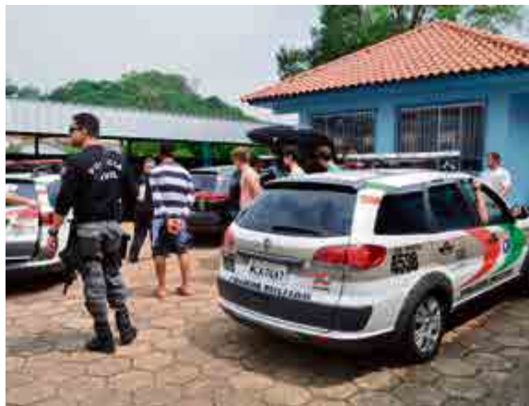
Os mais de 20 presos foram encaminhados para a Cadeia Pública de Maravilha, onde permanecem à disposição da justiça