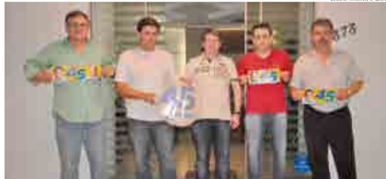
Isabel Müller/O Líder

Os partidos políticos de Maravilha que sinalizaram apoio a Aécio Neves neste segundo turno, além do PSDB, partido do presidencialismo, são: DEM, PSD, PSB, PPS, Solidariedade, PR, PTB e PP, que pretendem, hoje (18), a partir das 15h, promover, na Praça Padre José Bunse, a "Mateada do Aécio". Na ocasião haverá adesivação de veículos e bandeiraço.