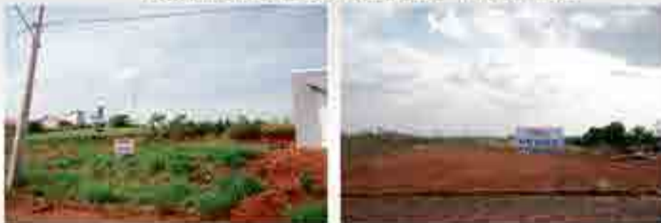
Loteamento Belo Horizonte - Maravilha