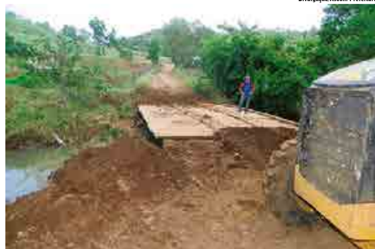
Ponte permite a ligação entre Cunha Porã e Maravilha

Ebeling lembra que o município de Cunha Porã teve grandes danos decorrentes das chuvas dos meses de julho e setembro, que causaram prejuízos em estradas, tubulações,