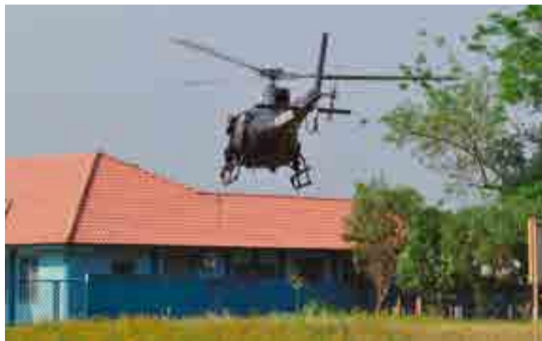
Helicóptero da Polícia Civil auxiliou na operação, que iniciou por volta das 6h em Maravilha