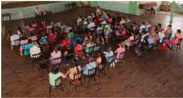
Viviane Seben/Ascom Prefeitura

Segundo Andreis, as crianças não precisam de presentes, mais de amor e atenção, entretanto é dever dos pais serem atuantes na educação dos filhos e impor limites diante das diversas situações vividas diariamente. "A lei tem como principal intuito proibir os castigos físicos e o tratamento degradante e cruel. O melhor caminho sempre é o diálogo e a paciência", explicou o