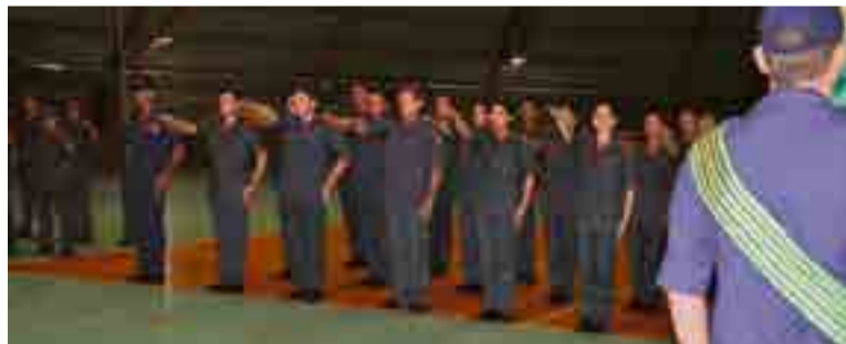
Maravilha agora conta com os trabalhos de mais 20 bombeiros comunitários

São 20 novos bombeiros comunitários que irão somar esforços na 3ª Companhia de Bombeiros Militar de Maravilha, auxiliando no efetivo já existente nos atendimentos às emergências. "Os programas de capacitação da comunidade objetivam a formação de cultura preventiva e reativa frente às emergências, facultando ainda a membros da comunidade a condição de atuar em apoio na execução desses serviços públicos", destacou Moura.