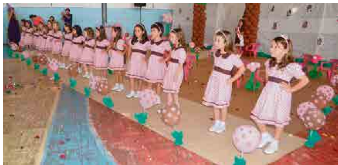
Dezessete meninas que concorreram ao título desfilaram de forma coletiva e individual