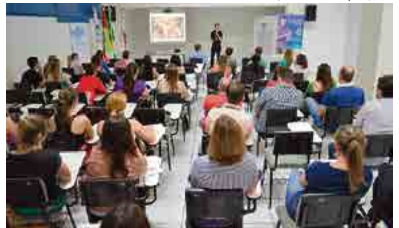
Palestras fazem parte da programação da Semana Nacional de Ciência e Tecnologia, realizada pelo Sebrae

Angela Batisti/CDL/Associação Empresarial