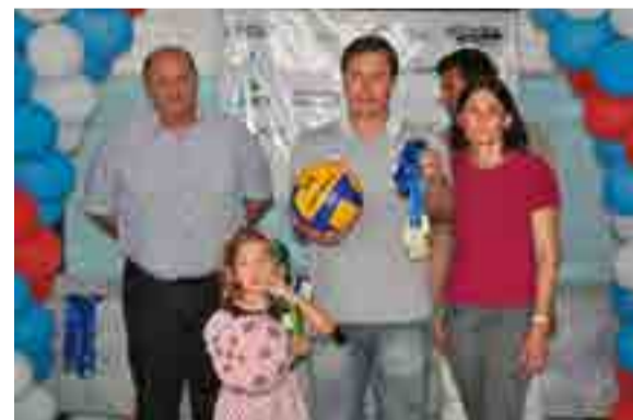
Equipe Zero Grau foi a campeã do vôlei quarteto