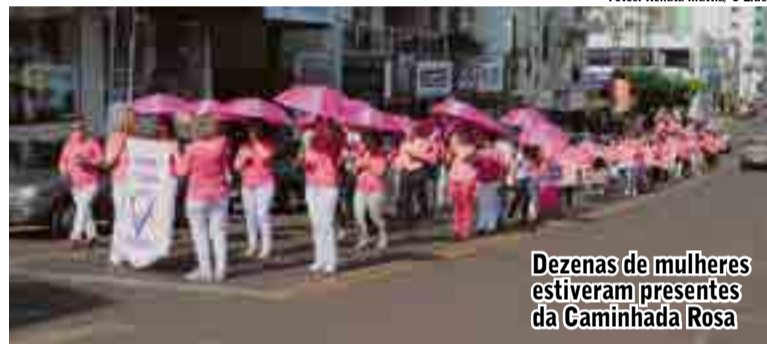
Dezenas de mulheres estiveram presentes da Caminhada Rosa