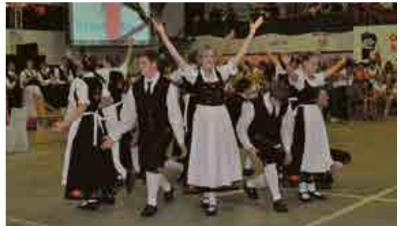
Apresentações culturais marcaram a noite de sexta-feira