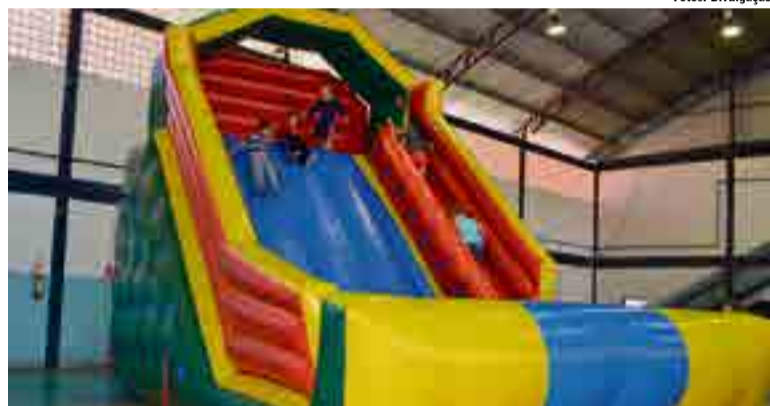
Brinquedos infláveis fizeram a alegria das crianças