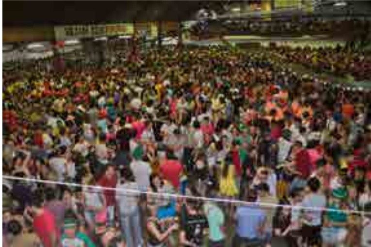
Público expressivo superou as expectativas dos organizadores

No último dia 10 quem chegava ao município de Cunha Porã já sentia o clima de festa. Durante a manhã os organizadores da 19ª edição do Kerbfest, acompanhados das soberanas e demais autoridades, realizaram as sangrias dos primeiros barris de chope para dar início a uma tradicional festa, que é esperada durante todo o ano. A festividade, que é realizada em três dias, reúne milhares de pessoas e a cada edição supera o número de participantes. Quem esteve no município pôde saborear os pratos típicos e o chope gelado e ainda curtir as famosas músicas da cultura alemã.