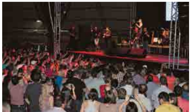
Público cantou junto com Amado Batista seus clássicos