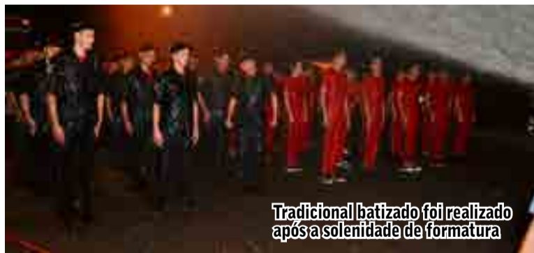
Tradicional batizado foi realizado após a solenidade de formatura