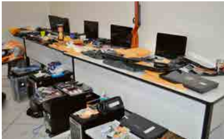
Drogas, armas, computadores, celulares e dinheiro foram apreendidos