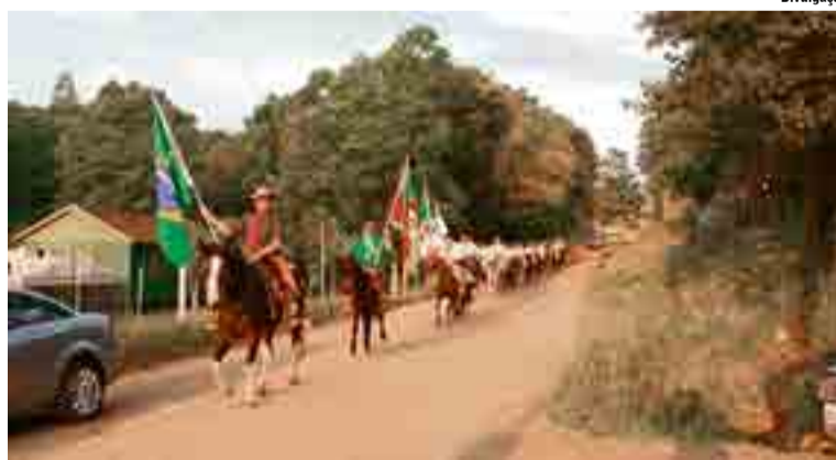
Grupo de cavaleiros saiu de Charrua (RS) no dia 6 e chegou em Maravilha no final da tarde de sábado (11)

outras, resolveram fazer o trajeto como prova de amor aos seus antepassados, que muito contribuíram para o desenvolvimento de Maravilha e municípios ao redor.