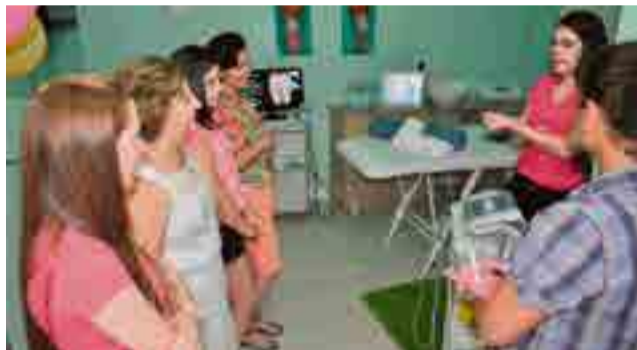
Inovações em aparelhos foram apresentadas pelas profissionais