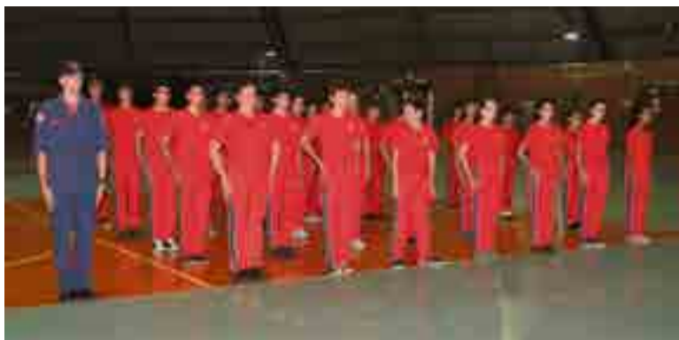
31 Bombeiros Mirins prestaram juramento perante as autoridades

Conforme o comandante da 3ª Companhia de Bombeiros Militar de Maravilha, João Emiliano de Moura Silva Miranda, o Bombeiro Mirim é um programa de apoio pedagógico e complementação educacional, promovido pelo Corpo de Bombeiros Militar de Santa Catarina. "O curso aborda temas como noções de prevenção contra incêndio, primeiros socorros e acidentes de trânsito, cuidados com o meio ambiente e a prevenção ao uso de drogas lícitas e ilícitas", destacou. Ainda, conforme Moura, as instruções têm como ênfase a busca pela valorização da cidadania e do respeito ao ser humano.