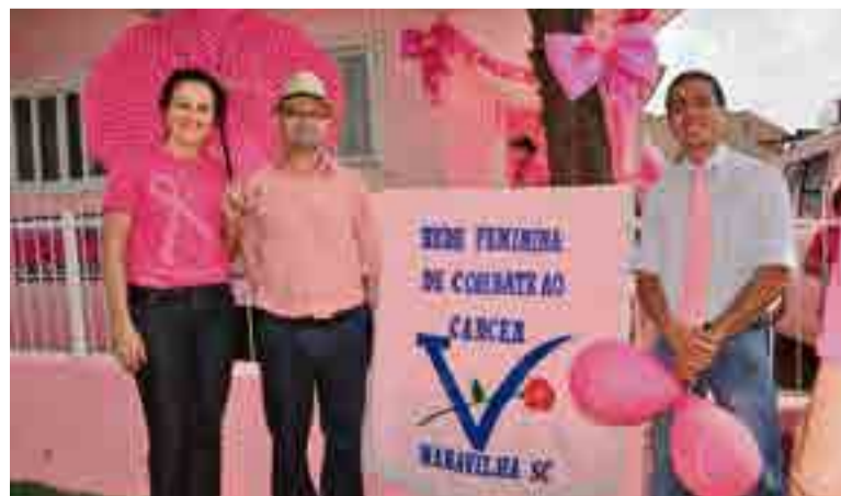
Vereadores prestigiaram a caminhada