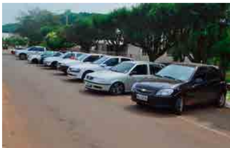
Cerca de 13 veículos foram apreendidos

e região os entorpecentes de elite, como são conhecidos o ecstasy e a cocaína. O público-alvo desses traficantes eram, principalmente, jovens que frequentavam festas, baladas, boates e casas de shows, além de bares locais, e que consumiam este tipo de entorpecentes", destacou.