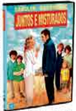
(Classificação: 10 anos)

Jim é um viúvo que tem um encontro às cegas desastroso com Lauren, que se separou há pouco tempo devido à traição do marido. Depois do ocorrido, a última coisa que desejam é se reencontrar. Estrelando, quando Jen, a sócia de Lauren, desiste de uma viagem à África com o namorado e seus cinco filhos, surge a oportunidade para que Lauren desfrute do passeio ao lado de Brendan e Tyler, seus filhos. O que ela não esperava era que o namorado de Jen também negociasse o pacote com Jim, em de seus funcionários. Ou seja, Jim e suas três filhas encontram Lauren e seus dois filhos em um resort de luxo na África, sendo que dividir as mesmas dependências durante uma semana.