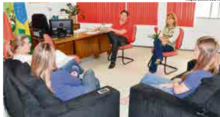
Reunião para definir a programação e apoio da administração municipal foi realizada nesta semana