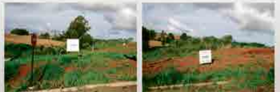
Loteamento Klement - Maravilha