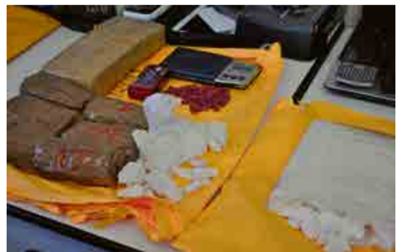
Drogas de elite foram apreendidas com os envolvidos