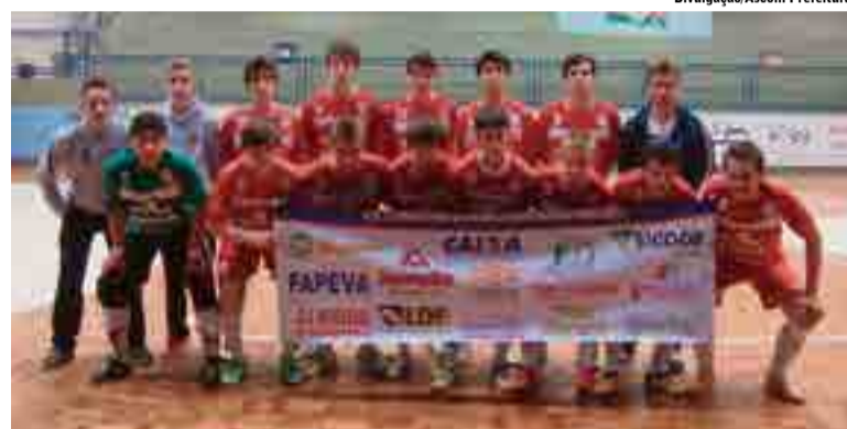
Atletas seguem empenhados para confrontos da próxima fase da competição