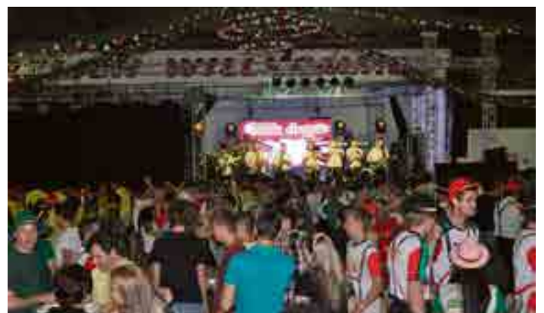
Bandas animaram o primeiro dia de festa

A animação musical da noite de sábado ficou a cargo da Banda Choppão e Banda Fritz 4.