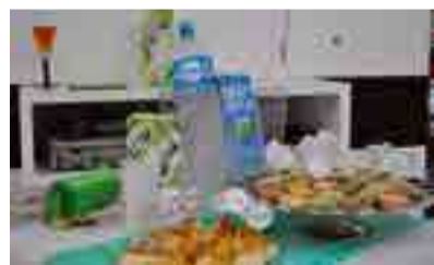
Coquetel foi servido aos amigos e clientes presentes