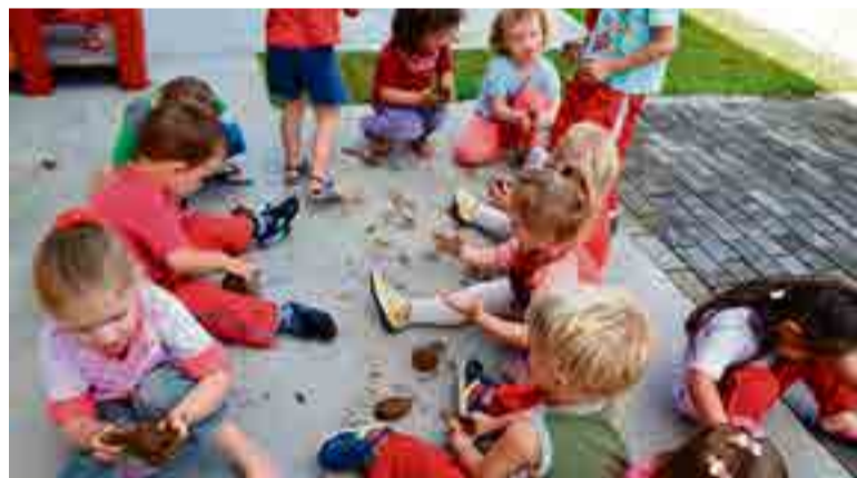
Crianças se divertiram brincando com barro