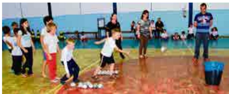
Gincana também foi realizada com os alunos do ensino fundamental