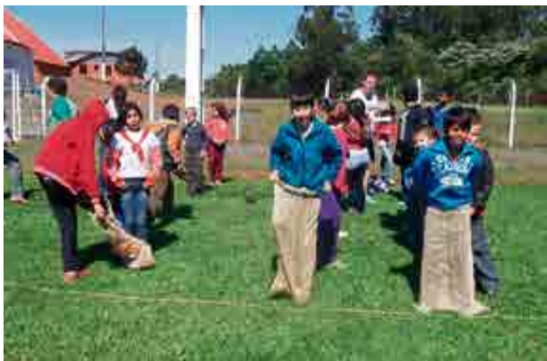
Crianças que frequentam o Serviço realizaram apresentações de teatro para clubes de idosos e de mães e para outras entidades