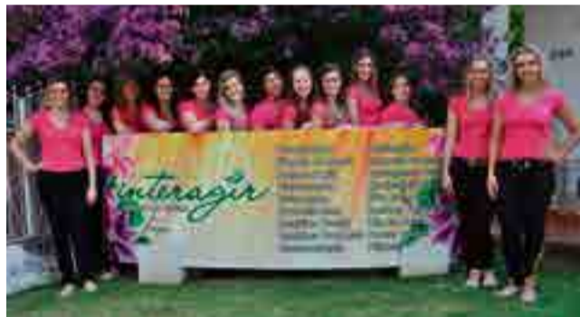
Equipe da Clínica Interagir conta com profissionais qualificadas para as suas áreas de atuação