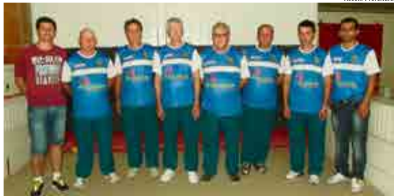
Equipe participou pela segunda vez dos JASC