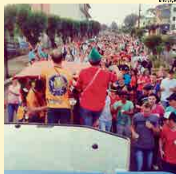
Multidão acompanhou a alvorada festiva, às 6h de domingo (12)

À tarde foi realizada matinê com animação das bandas Happy Brass e Hopus. E por fim, às 23h30 foi realizado o encerramento oficial do 19º Kerbfest de Cunha Porã. "Agradecemos a todos que estiveram conosco nesses três dias de festa. Encerrando esta edição, já iniciamos a preparação da nossa 20ª edição. Obrigado a todos os apoiadores, que auxiliaram para que a nossa 19ª edição fosse um verdadeiro sucesso, reunindo milhares de apaixonados pela cultura alemã", finalizaram os organizadores.