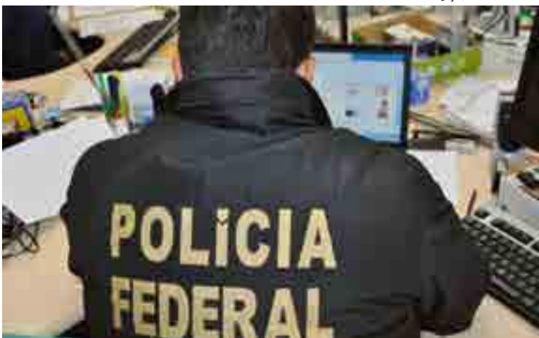
Santa Catarina foi um dos estados investigados através do Deep Web em operações de combate à pornografia infantil

Outros casos comuns que acontecem na internet são os de pedofilia. Nesta semana a Polícia Federal cumpriu cerca de 93 mandados de busca, de prisão e de condução coercitiva em 18 estados e no Distrito Federal. A Operação Darknet tem como objetivo confirmar a identidade dos suspeitos e buscar elementos que comprovem os crimes de armazenamento e divulgação de imagens e abuso sexual de crianças e adolescentes.