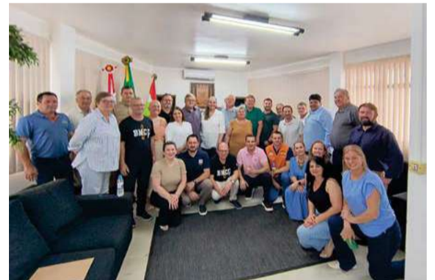
A deputada destinou mais de 3 milhões para o município