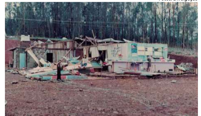
Episódio provocou destelhamentos e destruição na maior parte da cidade