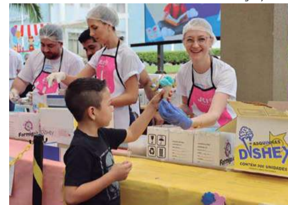
Festival do Sorvete foi uma das atrações do Dia das Crianças