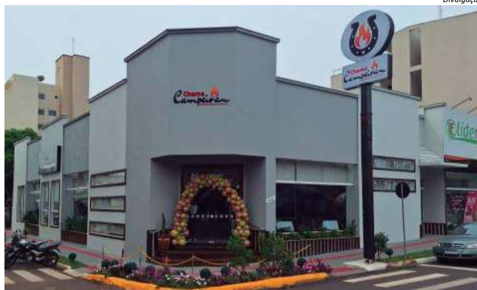
Chama Campeira conta com ambiente amplo e confortável