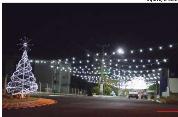
Acendimento das luzes será no dia 14 de novembro

Encerrando a programação natalina, no dia 15 de dezembro, tem Show com Simão Wolf, às 20h, no Espaço Criança Sorriso.