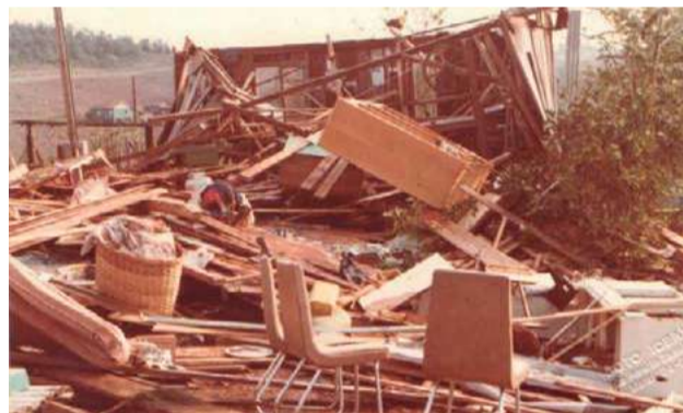
Mais de 100 casas foram totalmente destruídas