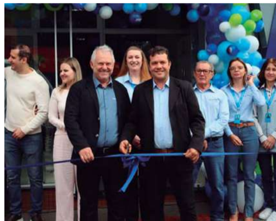
Evento marcou os 18 anos de história da cooperativa