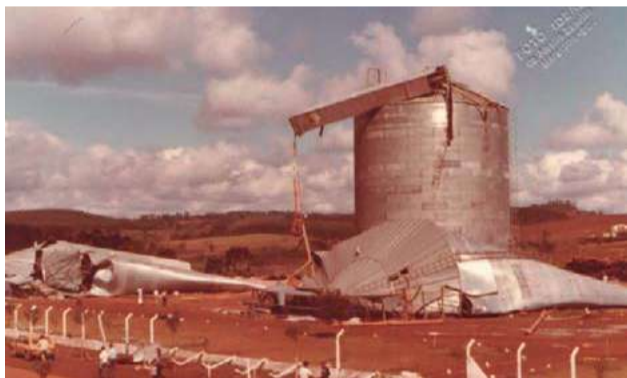
Força do vento destruiu silos metálicos

No outro dia, Maravilha ganhou destaque em programas de grande audiência a nível nacional, que anunciavam o cenário de mortes e destruição no local. Após a tragédia, contando com a ajuda e solidariedade de muitos, o município iniciou a reconstrução.