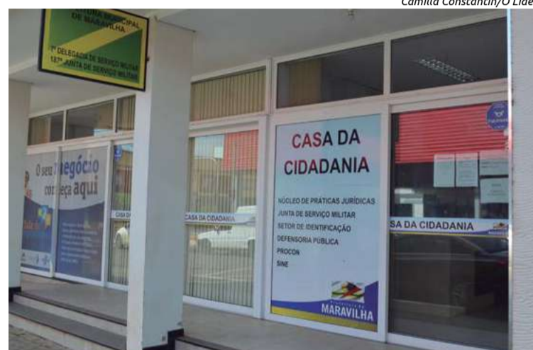
Camilla Constantin/O Líder