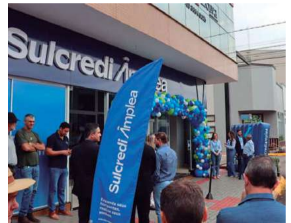
Agência fica localizada na Avenida Sete de Setembro