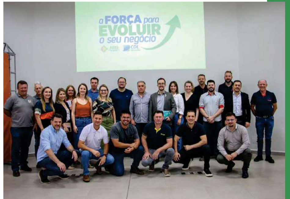
Reunião foi promovida na CDL e Associação Empresarial