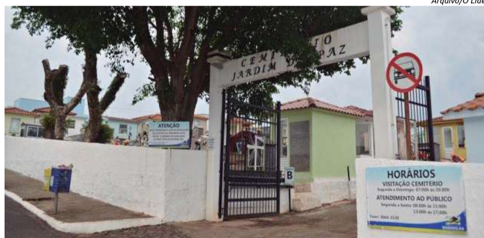
Cemitério Municipal Jardim da Paz funciona em horário comercial