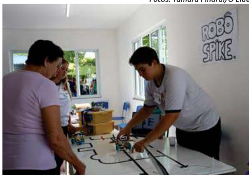
Neste ano ainda ocorreu a 1ª Feira de Ciências e Tecnologia