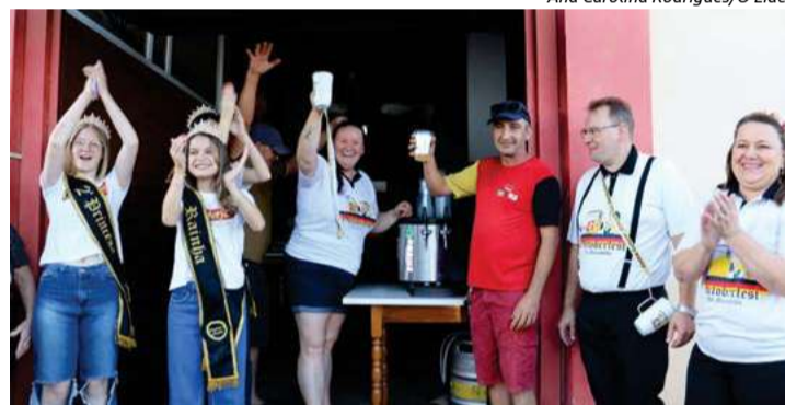
Sangria do primeiro barril de chopp aconteceu no Centro 25 de Julho