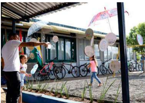
Fez parte da programação a exposição de trabalhos feitos pelos alunos