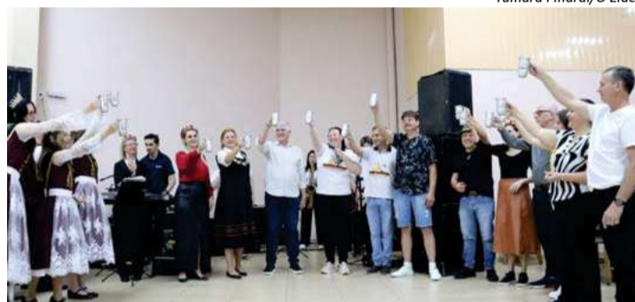
Representantes das autoridades, patrocinadores, soberanas e diretoria da entidade participaram do primeiro brinde