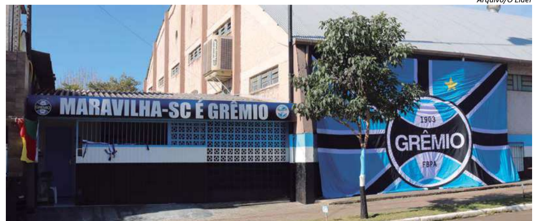
Entrega será feita na sede do Grêmio