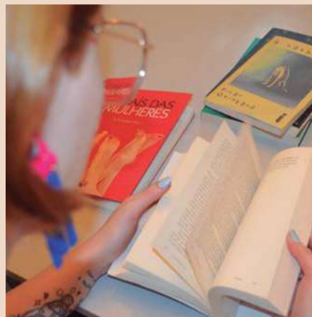
Lista de livros é organizada com antecedência