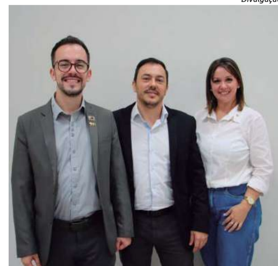
Anúncio foi feito na manhã de terça-feira (22)