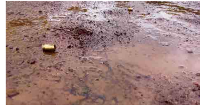
Em entrevista, a vítima disse que foram três disparos que atingiram o carro