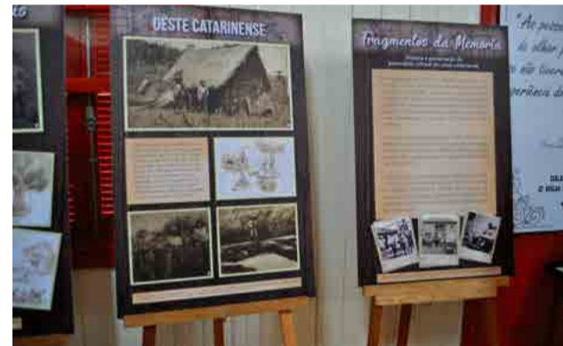
Imagens contam a história da economia, cultura e religião e detalhes do desenvolvimento