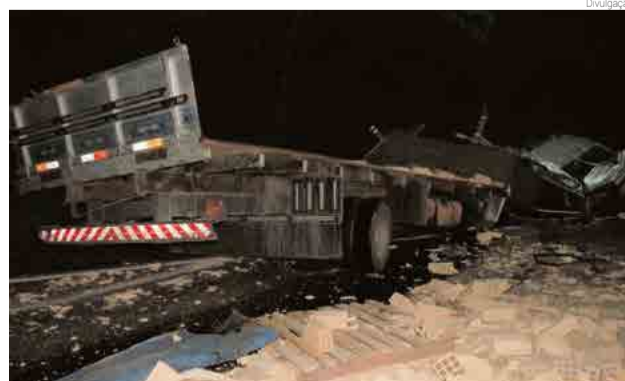
Caminhão ficou destruído com impacto e pista foi bloqueada durante a noite

O acidente mobilizou Bombeiros, Samu, Polícia Militar e Polícia Rodoviária Federal. A via ficou interditada durante o trabalho das equipes, causando congestionamento.