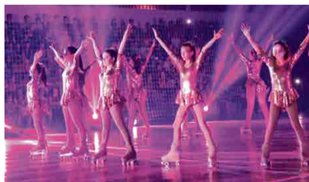
Apresentações encantaram o público

estilo. A quantidade de pessoas que manifestaram contentamento após o evento comprova o sucesso do show, que atraiu quase um terço da população do município”, afirma.