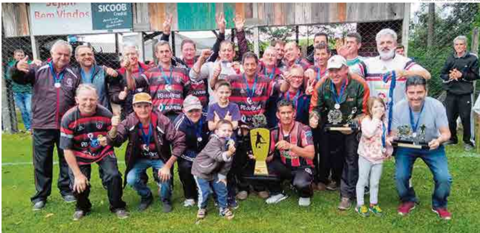
Na categoria B Maravilha ergueu o troféu principal

Na categoria A quem ergueu o caneco principal foi Cunha Porã, depois de ganhar a primeira partida em Maravilha pelo placar de um tento a zero, Cunha Porã confirmou a superioridade e fez, na manhã de domingo (30), 2 x 0. Os gols