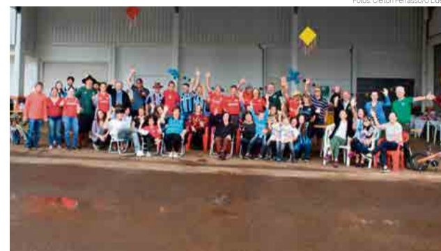
Mau tempo obrigou a vizinhança a procurar abrigo para fazer a confraternização