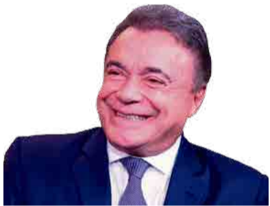
ALVARO DIAS (PODEMOS) – 19

lei. Para concorrer ao cargo é preciso cumprir alguns requisitos, como ser brasileiro nato e ter a idade mínima de 35 anos. A seguir, confira a trajetória política dos 13 candidatos.