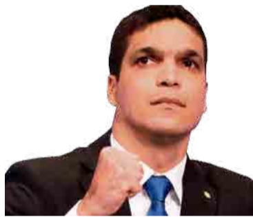
CABO DACIOLO (PATRIOTA) – 51

Ex-governador do Paraná e senador por quatro mandatos, Alvaro Dias (Podemos), de 73 anos, concorre à presidência pela primeira vez. A coligação inclui PRP e PTC. Foi vereador, deputado estadual, deputado federal e governador do Paraná. Começou a carreira política no então PMDB, depois passou por PST e PP, até se filiar ao PSDB, em 1994. Em 2001, foi expulso por agir contra orientações do partido, mas retornou em 2003 e voltou a sair em janeiro de 2016, para entrar no PV. No ano seguinte foi para o Podemos. O vice é o ex-presidente do Banco Nacional de Desenvolvimento Econômico e Social Paulo Rabello de Castro (PSC).