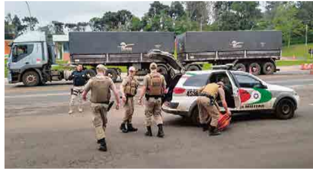
Um dos suspeitos foi preso enquanto fugia pela BR-282, nas proximidades da PRF

Após as prisões, os homens foram encaminhados pela PM para a Delegacia da Polícia Civil de Maravilha. O caso será investigado e os dois podem ser indiciados por tentativa de homicídio.