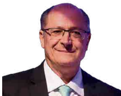
GERALDO ALCKMIN (PSDB) – 45

Fernando Haddad (PT), de 55 anos, foi o escolhido para substituir o ex-presidente Luiz Inácio Lula da Silva, que teve o registro de candidatura negado. Ex-prefeito de São Paulo e ex-ministro da Educação, Haddad concorre à presidência pela primeira vez. Formado em direito pela Universidade de São Paulo (USP), é mestre em economia política e doutor em filosofia pela mesma universidade, onde foi professor. Foi chefe de gabinete da Secretaria Municipal de Finanças, assessor do ministro da Fazenda Guido Mantega, secretário-executivo do Ministério da Educação e assumiu a pasta em 2005. Deixou o cargo para concorrer à prefeitura de São Paulo em 2012, sendo eleito no 2º turno. Em 2016 tentou a reeleição, mas foi derrotado. O PCdoB terá a deputada estadual Manuela D'Ávila como vice.