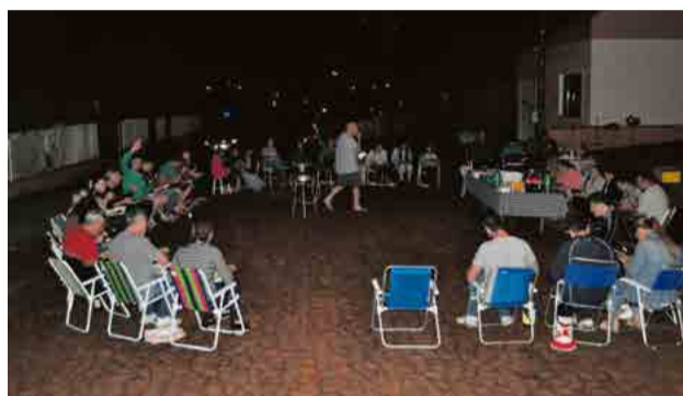
Algumas ruas realizaram o evento na parte da noite

lizaram o evento na parte da noite. Aproximadamente 450 pessoas participaram e teve o envolvimento de nove ruas.