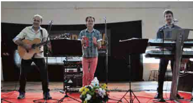
Trio Maravilha animou mais uma festa de idosos