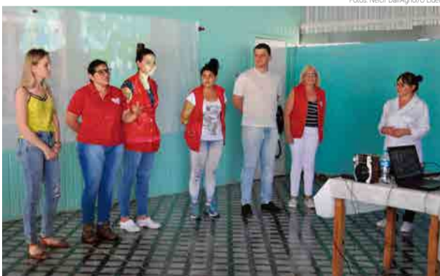
Funcionários foram apresentados aos familiares e apoiadores

Na tarde de sábado (29), nas dependências do Lar Coração de Maria, foi realizada reunião familiar em comemoração ao Dia do Idoso. A data é comemorada em 1º de outubro. De acordo com a direção do Lar, houve a participação de familiares, apoiadores da instituição e demais funcionários. Foram abordados diversos assuntos ligados ao Dia do Idoso, como direitos e deveres da família e os direitos e deveres da instituição. Após a reunião foi servido lanche. “A insti-