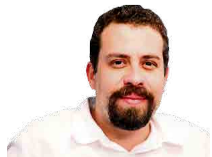
GUILHERME BOULOS (PSOL) – 50

Governador de São Paulo por quatro vezes, Geraldo Alckmin (PSDB), de 65 anos, disputa o cargo de presidente pela segunda vez. Alckmin recebeu o apoio do PP, DEM, PRB, PR, Solidariedade, PTB, PPS e PSD. Médico de formação, começou a carreira pública em 1973, quando se elegeu vereador. Depois, foi prefeito, deputado estadual e deputado federal por São Paulo. Em 1988, deixou o então PMDB para fundar o PSDB e em 2001 assumiu o governo de São Paulo, após a morte do então governador Mário Covas. Reelegeu-se em 2002 e em 2006 disputou a presidência. Em 2010, elegeu-se novamente para o governo de São Paulo e foi reeleito em 2014. Sua vice é a senadora Ana Amélia (PP).