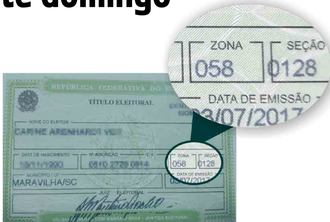
Número da seção está impresso no título

Conforme os números do Tribunal Regional Eleitoral (TRE), o local com a menor contagem de eleitores é na Linha Tope da Serra, no interior de Maravilha, que conta com apenas uma seção e 188 eleitores cadastrados. Confira a seguir todos os locais de votação.