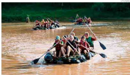
Evento contou com a participação de 13 maravilhenses

versas atividades envolvendo bússolas e jangadas, entre outros. Os jovens também conheceram a empresa de água mineral do município. De acordo com os participantes, as atividades oportunizaram momentos de aprendizagem, troca de experiências, além de alegrias e aventuras. A diretoria parabeniza os jovens que representaram o grupo.