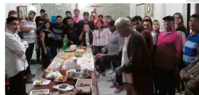
Confraternização foi promovida terça-feira (2)

O tema foi proposto a partir das reflexões feitas com o filme "A corrente do bem". De acordo com as responsáveis, a ideia central é passar adiante um gesto que faça diferença na vida de outra pessoa. O grupo promoveu