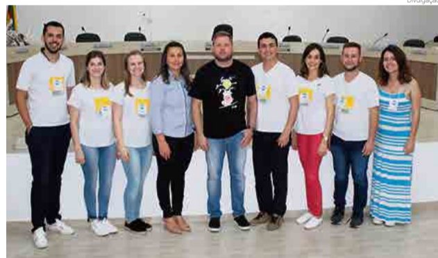
Nucleados realizaram visitas técnicas e passeios turísticos