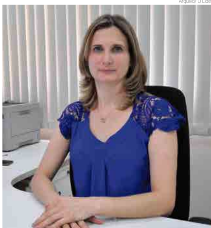
“Votos brancos e nulos não anulam eleição, isso é mentira”, diz a promotora

Hoje (5) é o último dia para divulgação de propaganda paga nos jornais (imprensa escrita). Amanhã (6) é o último dia para propaganda mediante alto-falantes ou amplificadores de som, isso entre 8h e 22h. Também é o último dia para distribuição de material gráfico, até às 22h, e promoção de carreatas e caminhadas”, explica.