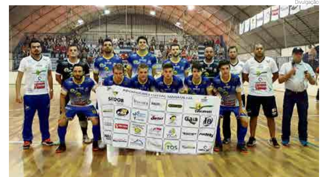
Agora equipe vai a Lages tentar a classificação

melhor jogo até aqui na competição. Apesar da bela apresentação, os maravilhenses perderam a primeira partida de uma série de duas. O próximo jogo contra Lages é amanhã (6), na noite catarinense. O placar do jogo foi de 6 x 4. Com o resultado, os maravilhenses precisam ganhar no tempo normal para levar a decisão da vaga para a prorrogação. Já os lajenses precisam apenas de um empate no tempo normal para passar de fase.