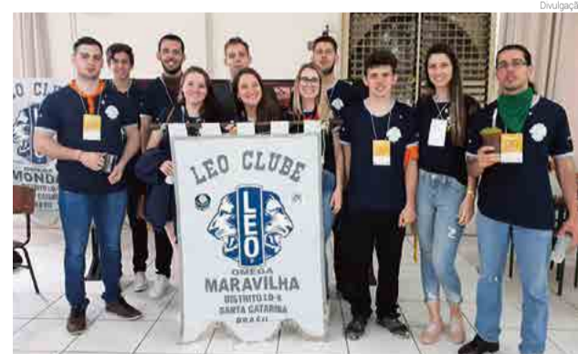
Evento é anual e serve para desenvolver os integrantes