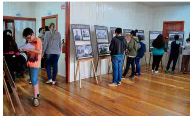
Estudantes do Centro Educacional Monteiro Lobato, durante visita