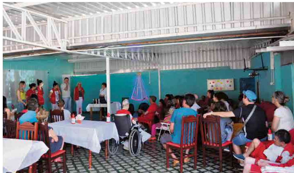
Reunião familiar foi em comemoração ao Dia do Idoso

liares e apoiadores, que não mediram esforços para estar aqui, juntamente com os idosos”, finaliza a direção.