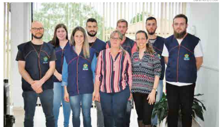
Equipe do cartório e técnicos de apoio que vão trabalhar no domingo

No domingo a urna é entregue então ao presidente da seção, que liga o equipamento, monta a cabine de vota-