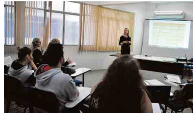
Capacitação foi realizada na terça-feira (2)