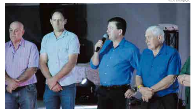
Lideranças acompanharam o evento