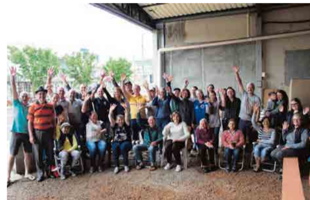
Aproximadamente 450 pessoas participaram do Dia do Vizinho