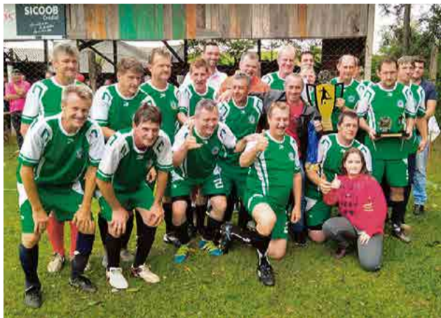
Na categoria A Cunha Porã ganhou duas vezes e levou o troféu maior