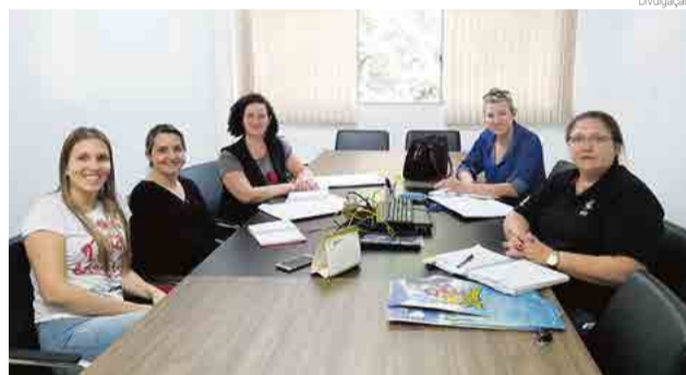
Projeto é desenvolvido pela CDL, em parceria com a Secretaria Municipal de Educação

O projeto é desenvolvido há sete anos no Estado, pela Federação das Câmaras de Dirigentes Lojistas de Santa Catarina (FCDL/SC) e apoio do Sicoob, Leo&Leo e SBT. Esta é a terceira vez que a CDL de Maravilha está participando, em parceria com a Secretaria Municipal de Educação.