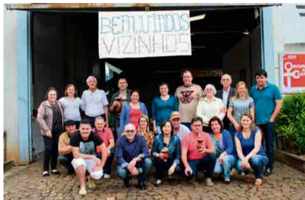
Todos foram recebidos de braços abertos