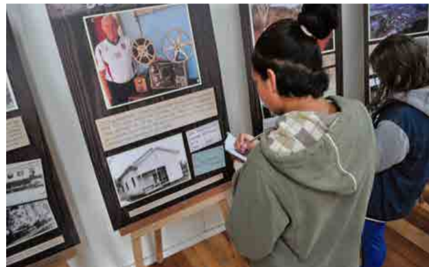
Mostra ficará no local até quinta-feira (11)