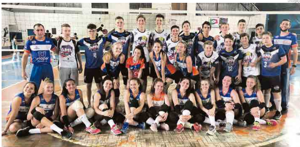
Meninas ganharam de Chapecó na final da competição e os rapazes ganharam de Sul Brasil e Iraceminha

Os professores e técnicos parabenizam os atletas pelo de-