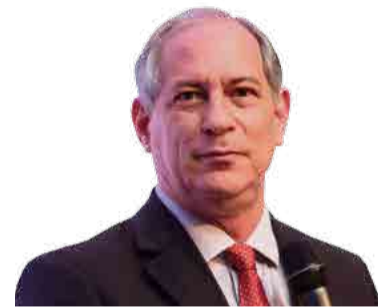
CIRO GOMES (PDT) – 12