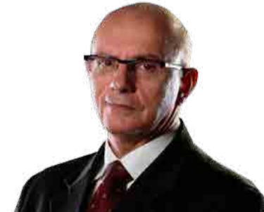
ROGÉRIO PORTANOVA (REDE) – 18

Com formação em Gestão Pública, Mauro Mariani (MDB), de 54 anos, será candidato a governador pela primeira vez. Iniciou a carreira política em 1996 como prefeito de Rio Negrinho e foi reeleito no pleito seguinte. Foi deputado estadual, secretário de Estado de Infraestrutura e deputado federal. Atualmente está em seu terceiro mandato na Câmara dos Deputados, em Brasília. O vice é Napoleão Bernardes (PSDB).