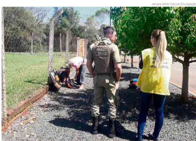
Policial militar e fiscal tributária participaram da ação

que os vendedores ambulantes devem obrigatoriamente ir até o Setor para obter a regularização. “Reforçamos que é proibida a venda de produtos sem portar o alvará”, afirmam. Os munícipes podem colaborar e denunciar possíveis irregularidades pelo número 3363 0200.