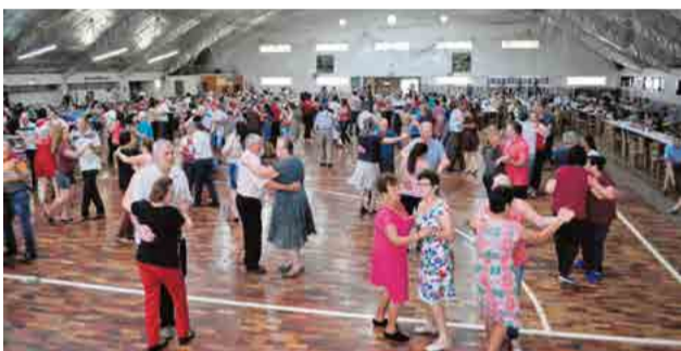
Participantes se divertiram e lotaram as dependências do salão paroquial