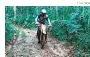
Meca disse que foi a prova mais difícil da temporada

A próxima prova é pelo Campeonato Catarinense, em Benedito Novo, no litoral de Santa Catarina, nos dias 20 e 21 deste mês.