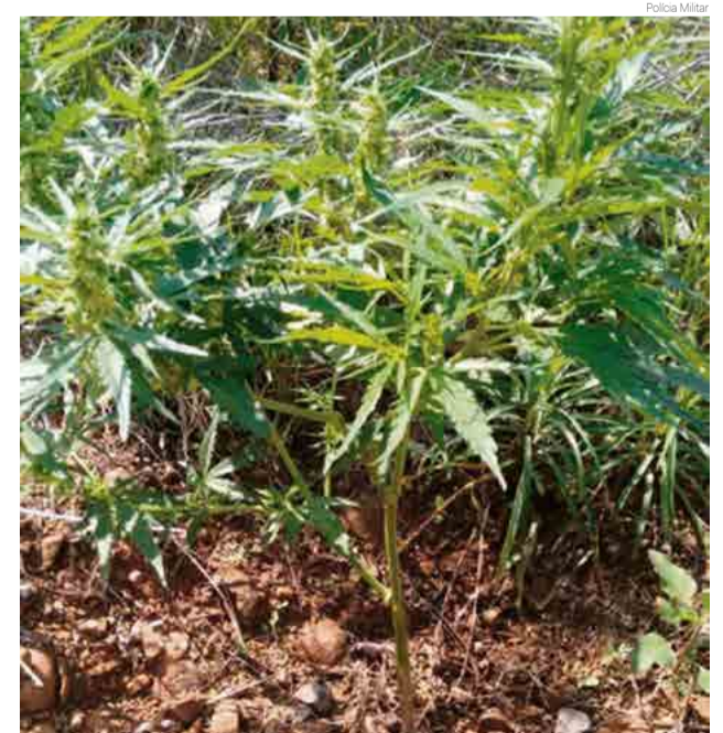
Policiais localizaram a plantação após informações anônimas

plantação. A droga estava plantada no meio da mata e os pés variavam de tamanho, entre dois centímetros e 40 centímetros. A Polícia Civil foi acionada e as plantas foram apreendidas.