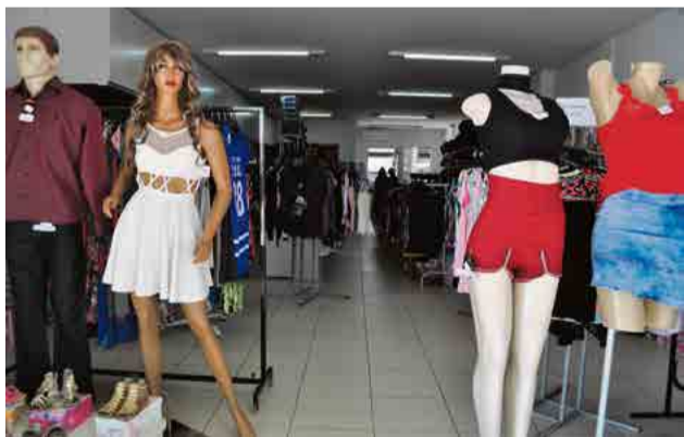
Top 20 foca na venda de confecções