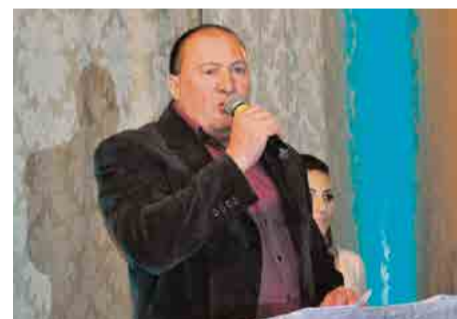
Prefeito de Tigrinhos destacou organização e evolução do concurso das soberanas