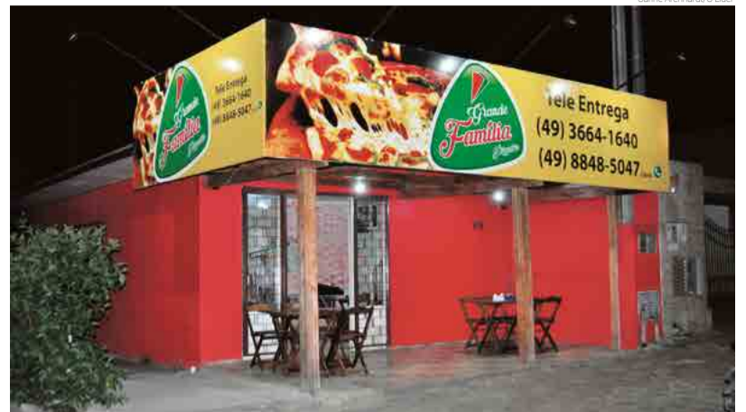
Filial da Pizzeria em Maravilha