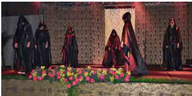
Desfile começou com mistério na passarela