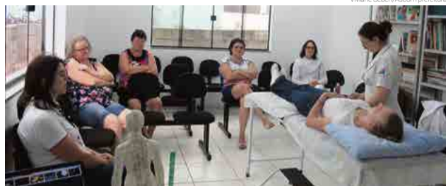
Profissional explicou técnicas de auriculoterapia, acupuntura e reiki

Com relação ao reiki, a profissional conta que é uma terapia que ajuda a clarear a mente, relaxar, resolver problemas mais sutis da natureza humana, além de contribuir para que as pessoas encontrem o equilíbrio físico, mental e espiritual.