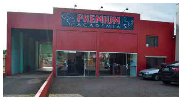
Academia Premium atende na Avenida Maravilha

cidou levar um pouco deste mundo para seus clientes. A academia atende das 6h às 10h de segunda a sexta-feira, das 14h às 24h até a quinta-feira, até às 22h na sexta-feira e aos sábados, das 14h às 17h.