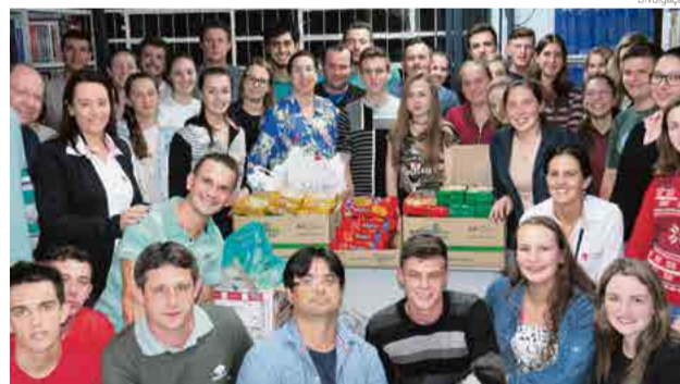
Acadêmicos realizaram levantamento das necessidades da instituição

A coordenadora acredita que desenvolver proje-