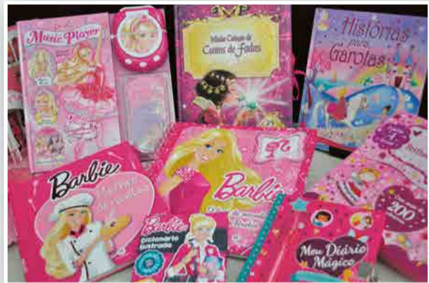
Exemplares contam com ilustrações e sons

Presentear as crianças com livros é uma forma de incentivar o hábito e ao mesmo tempo contribuir para o conhecimento e lazer. A Millennium oferece diversas opções, com exemplares voltados para todas as faixas etárias.