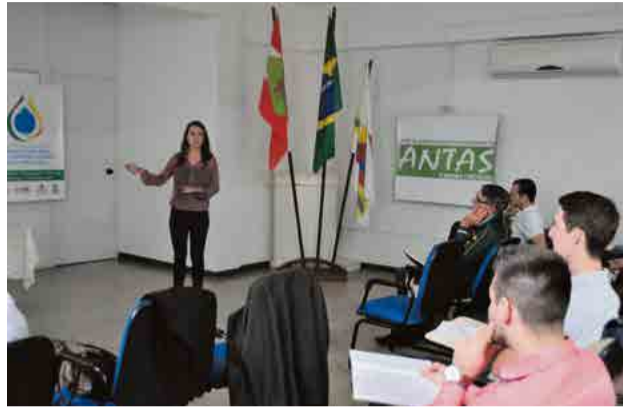
Evento também foi realizado em São Miguel do Oeste, Itapiranga e Palma Sola

O coordenador explica que na etapa E será apresentado o enquadramento dos corpos hídricos, ou seja,