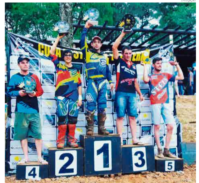
Disputa foi pela Copa Oeste de Velcross

Oeste de Velcross. Ele conquistou o ponto mais alto do pódio. A próxima prova será neste fim de semana em Toledo (PR), pela copa MW de Velcross.