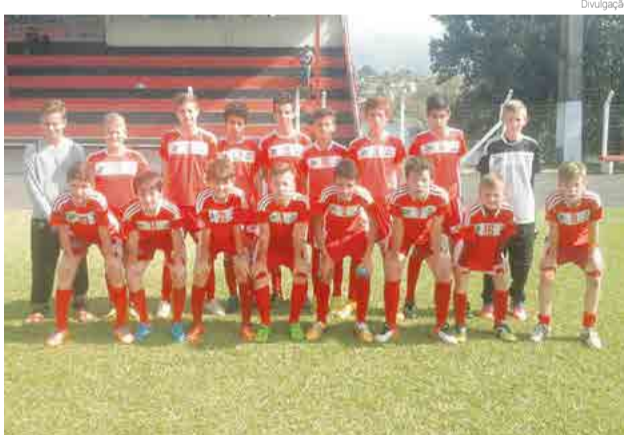
Meninos da Cidade das Crianças disputam o troféu Megazan Moda Sport

gos em Xaxim, a rodada tem jogos hoje (7), em Palmitos. As disputas são pelas categorias sub-11 e sub-13. Ao todo, haverá oito jogos, quatro em Xaxim e quatro em Palmitos.