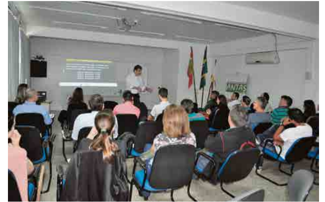
Uma das audiências públicas foi realizada na Agência de Desenvolvimento Regional de Maravilha