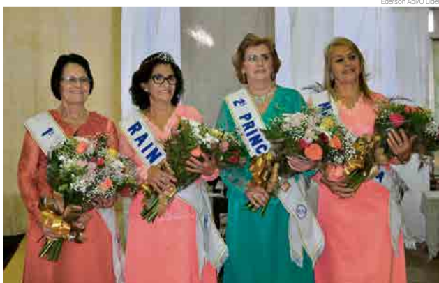
Quatro candidatas foram eleitas após desfile individual