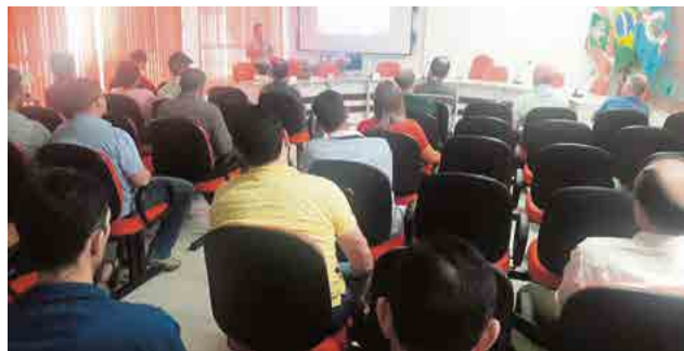
Reunião foi realizada na Câmara de Vereadores

Resultados 2014-2017 Atendimentos: 1.218 Visitas: 722 Oficinas: 171 Cursos: 3 Reuniões: 64 Encontros: 39 Palestras: 4 Excursões: 2 Seminário: 2 Treinamentos: 3