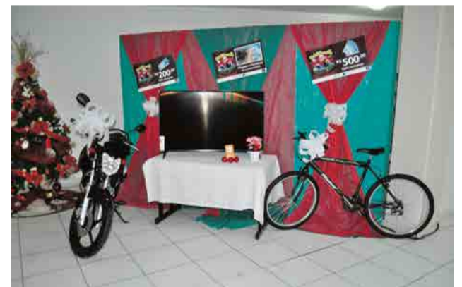
Prêmios foram expostos durante o evento