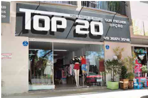
Top 20 fica na Avenida Maravilha