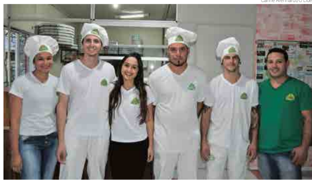
Equipe da Pizzeria Grande Família, filial de Maravilha

Outro diferencial é a borda vulcão, que vem com um formato diferenciado, além de conservar o sabor inconfundível da pizzeria. O cliente também pode optar pela borda normal, em sabor doce ou salgado. Conforme Jonatan, a empresa está sempre focada na qualidade dos produtos usados e mantém sua meta de fidelizar os clientes pelo sabor dos produtos.