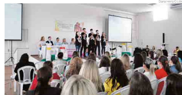
Evento teve o apoio do Fundo da Infância e Adolescente (FIA)

Mais de 500 pessoas participaram da palestra, que destacou a importância do sentimento de afeto. "Chamamos de filhos biológicos