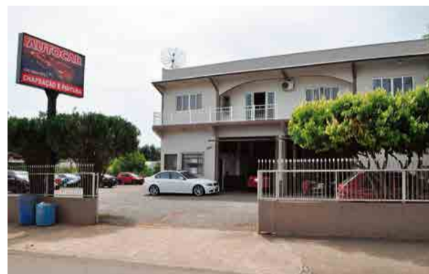
Chapeação Autocar está na Avenida Sul Brasil

vidros e espelhos. A Chapeação atende 10 seguradoras e presta serviços para Maravilha e toda região. O atendimento é de segunda-feira a sexta-feira e sábados até às 10h.