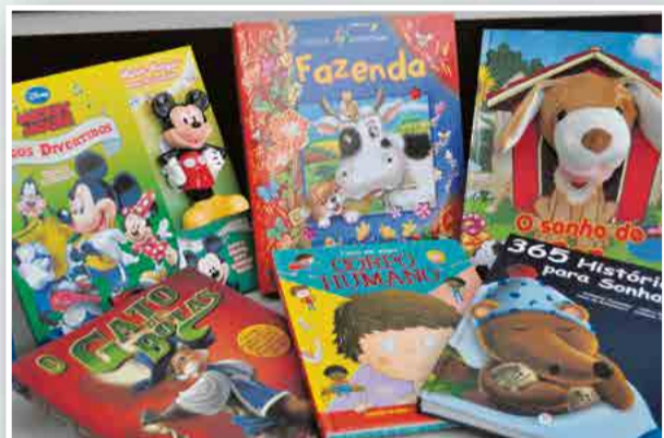
Millennium oferece opções para todas as idades