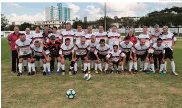
Primeira partida é hoje (7), em Palmitos, e a volta ocorre em São Carlos

Agora, em partidas de ida e volta, o CRM decide o título com Iporã do Oeste. O primeiro jogo ocorre hoje (7), em Palmitos, e a decisão em São Carlos, dia 21.