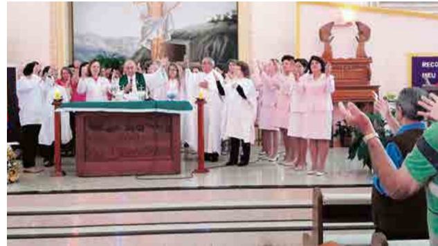
Celebração na Igreja Matriz marcou início das ações de outubro

O tradicional Chá Rosa da Rede Feminina de Combate ao Câncer será realizado a partir das