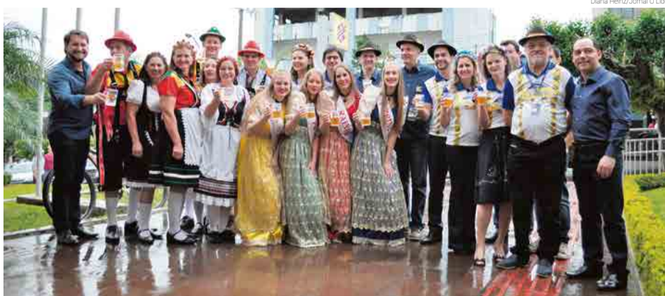
Primeira sangria do barril de chope foi realizada no Banco do Brasil

Na manhã de ontem (6) o cronograma iniciou com a abertura oficial da primeira sangria do barril de chope no Banco do Brasil. Estiveram presentes representantes da instituição financeira, organizadores do evento, líderes do Executivo e Legislativo, bem com a comunidade. Em ritmo de Kerbfest, as lideranças destacaram a importância de valorizar eventos que preservem a cultura alemã e reúnam o público para momentos de alegria e descontração.