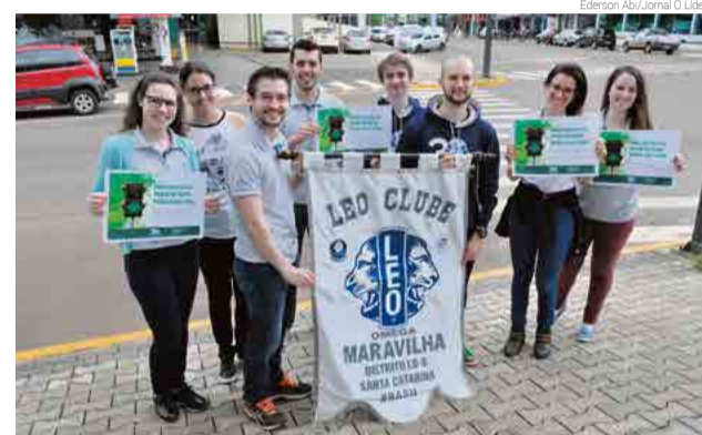
Grupo desenvolveu atividade durante a manhã no Centro de Maravilha

Algumas pessoas que foram flagradas passando no sinal vermelho relataram que estavam erradas e disseram sentir vergonha do erro, mas a maioria disse que a atitude era resultado da pressa. Para o grupo, as infrações foram registradas em 90% dos casos.