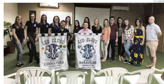
Leo Clube Maravilha participou da palestra "Você vale a pena", realizada em Cunha Porã

tros municípios é incentivar e aprender com outros clubes. "A palestra destacou a conscientização acerca dos sintomas manifestados pelas pessoas quando enfrentam problemas como a depressão. Falar sobre assuntos como este mudam a sociedade. Parabéns ao LEO Clube Cunha-Porã pela belíssima campanha. As melhores coisas acontecem para quem levanta e faz", pontuam.