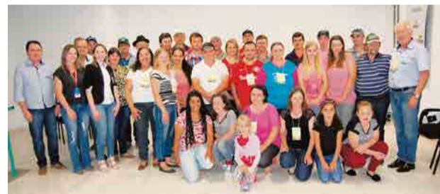
Famílias se formaram em Erval Seco

lidade Total Rural é realizado pelo Sebrae e promovido por meio da parceria entre as cooperativas Aurora, Cooper A1 e Sicredi Alto Uruguai RS/SC. "A Sicredi Alto Uruguai RS/SC tem sido parceira na disponibilização deste programa e de tantas outras iniciativas, com olhar para a capacitação e desenvolvimento dos seus associados e para a região onde está presente", salienta o presidente, Eugenio Poltronieri.