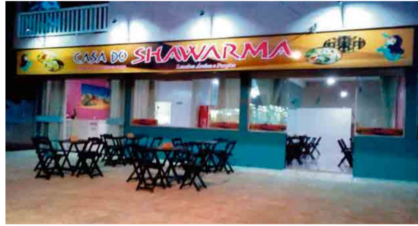
Casa do Shawarma está na Avenida Sul Brasil