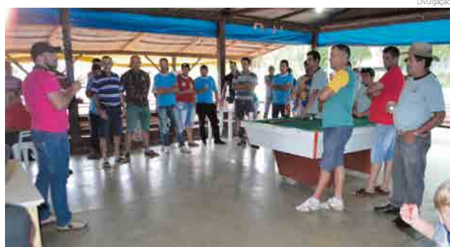
Jogos iniciaram no Bar do Si

A próxima rodada será hoje (7), no Bar e Lavacar Ponto Bom, com os jogos Bar do Vardo x Bar do Gri-lo, Bar e Lavacar Ponto Bom x Bar do Juce e Bar do Si x Comunidade de Trindade.