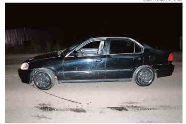
Homens estavam fugindo em um Honda Civic e já tinham sido vistos na região

Conforme a PM, um dos presos estava em prisão albergue em Chapecó, o segundo possui antecedentes por crime de receptação, e o terceiro não possui informações penais. Após a prisão, uma mulher, vítima do furto, que estava chegando em casa no momento da ação dos criminosos, reconheceu um dos suspeitos.