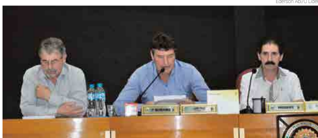
Vereadores apresentaram investigação, leram e votaram relatório em plenário