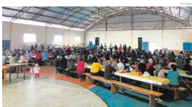
Evento reuniu grande público

rio do município e ao Dia do Idoso, contou com número expressivo de participantes. A programação contou com almoço, dança e diversas atividades.