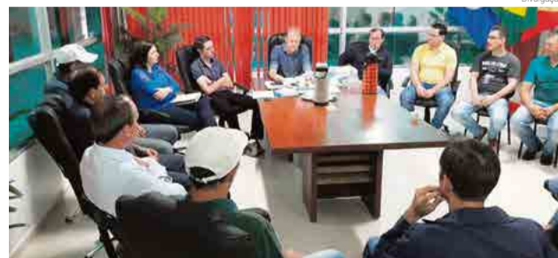
Prefeito pediu foco no Plano de Governo

vo foi acompanhar o andamento dos trabalhos das secretarias, discutir metas de planejamento, avaliar as ações e apresentar os próximos projetos a serem executados. Na ocasião o prefeito destacou a importância de cumprir o Plano de Governo.