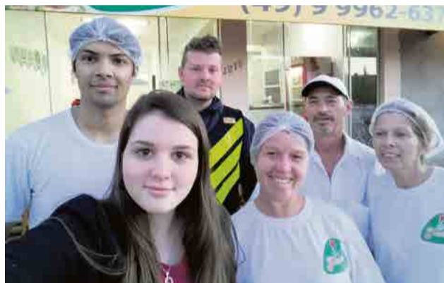
Equipe da filial de Pinhalzinho