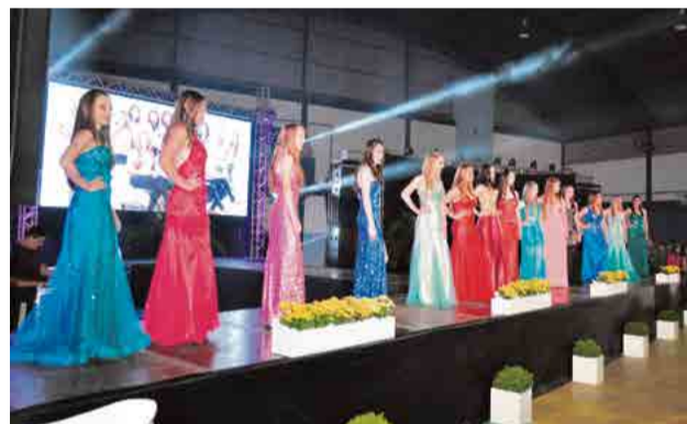
Candidatas desfilaram com trajés esportivo e de gala, de forma coletiva e individual

edição o número foi de apenas cinco jovens, o prefeito comemorou a evolução.