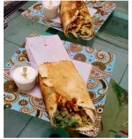
Estabelecimento trabalha com culinária diferenciada