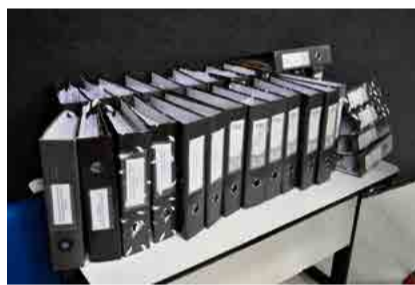
Processo de investigação tem mais de 12 mil páginas e 30 volumes

tação de empresas de pessoas que são familiares de integrantes do quadro de servidores do município, também pelo uso da AMF do espaço público do Ginásio Municipal de Esportes Gelson Tadeu Lara, prática de cobrança de parte de remuneração de servidor para trabalho particular. Além disso, o relatório pede extinção da Ace-