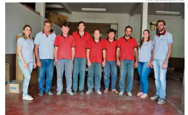
Equipe da Chapeação Autocar