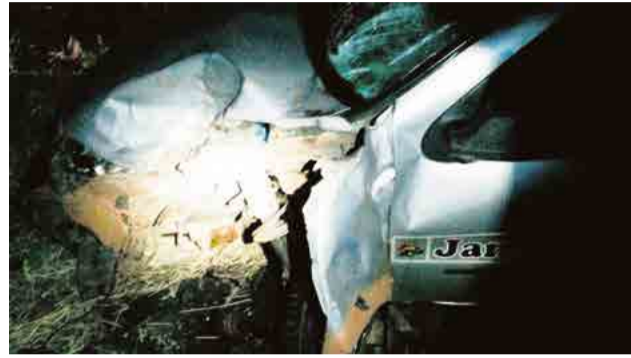
Acidente, segundo a PRF, foi provocado pelo Fiat Strada durante ultrapassagem