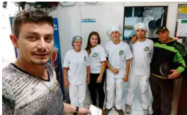
Equipe da Pizzeria em Chapecó