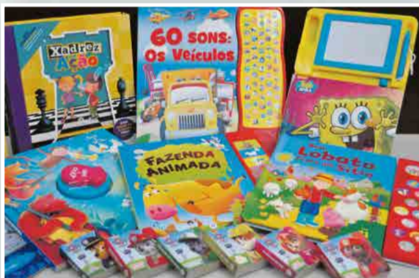
Hábito da leitura faz com que as crianças aprendam de forma mais divertida