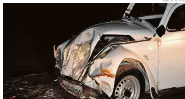
Colisão aconteceu na interseção para Bom Jesus do Oeste

Samu. No Fusca havia um casal de idosos, de 65 e 66 anos, que foi conduzido pelos bombeiros para o hospital para avaliação. Segundo o relato da caroneira do Gol, o casal reside no interior e estava seguindo para o Centro de Maravilha, pela estrada de acesso a Bom Jesus do Oeste. O veículo parou para acessar a rodovia e foi atingido pelo Fusca, que seguia de Maravilha para Tigrinhos.