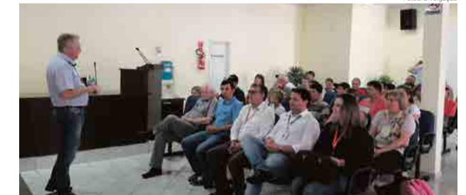
Setembro contou com início de turma em Planalto