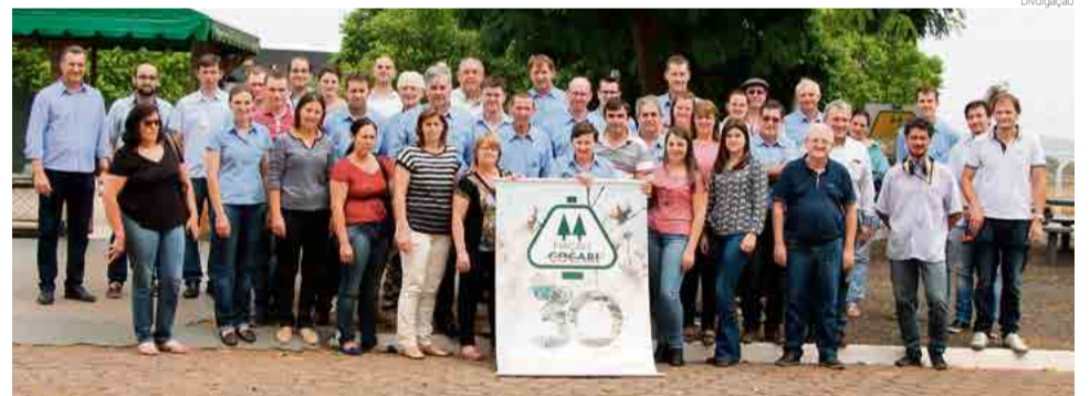
Grupo visitou cooperativas do Paraná e Goiás

O primeiro local visitado foi a Cooperativa Agropecuária e Industrial, com sede em Mandaguari (PR), em que as principais atividades estão ligadas à produção de grãos, fabricação de ração para cães, gatos e peixes, além de uma tecelagem para produção de fios de algodão. A comitiva visitou também a Cooperativa Mista de Produtores de Leite, localizada em Morrinhos (GO), em que a principal atividade é a industrialização de laticínios