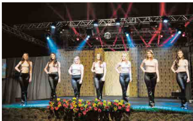
Segundo momento foi de revelar a identidade de cada menina