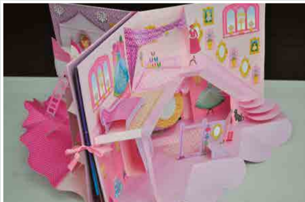
Livros lúdicos estimulam a criatividade