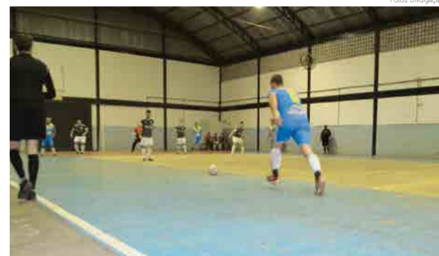
Jogos das semifinais ocorrem hoje

Os confrontos das semifinais, entre Boca Juniors x Poca Lenha e River Plate x Sertãozinho, foram definidos por sorteio. Os finalistas serão conhecidos hoje (7), às 19h30.