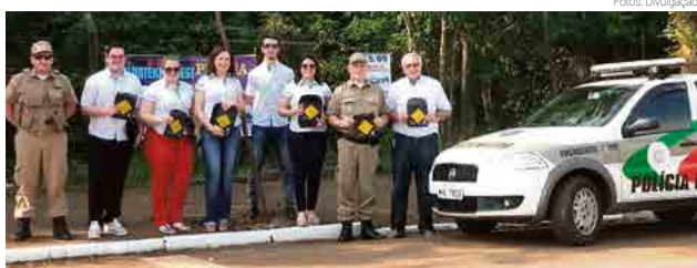
Campanha contou com o apoio da Polícia Militar

Diretores e gerentes dos postos de atendimento (PA) do Si-