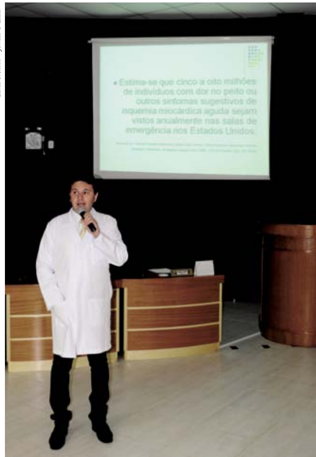
Palestrante abordou tema referente a dor torácica

Junho: 21/06/2012 - Gestação de alto risco, assistência a gestante e ao trabalho de parto e urgência em ginecologia.