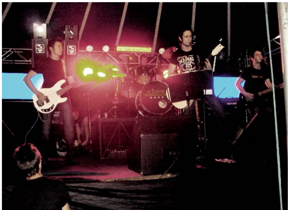
Os shows normalmente acontecem em encontros de motociclistas, bares, boates e festas particulares