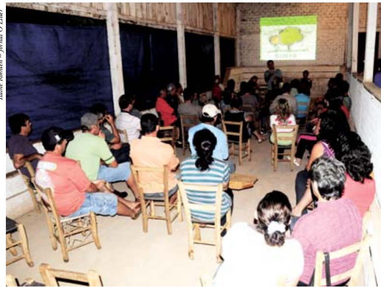
Comunidade, alunos e interessados participaram da reunião