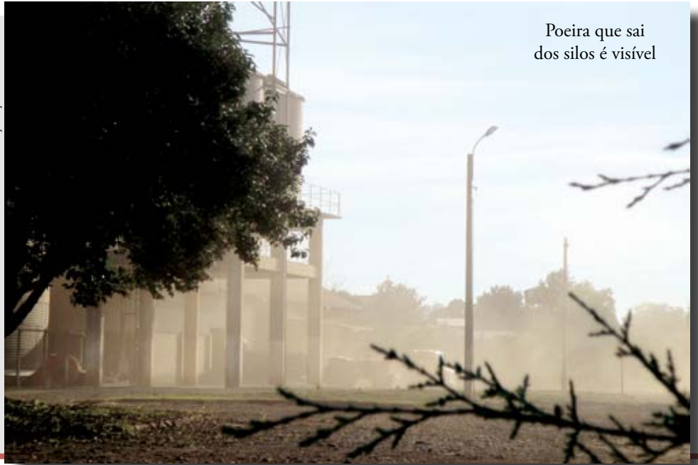
Poeira que sai dos silos é visível