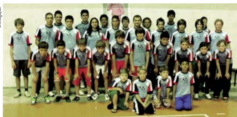
Atletas que participam das atividades de tênis de mesa