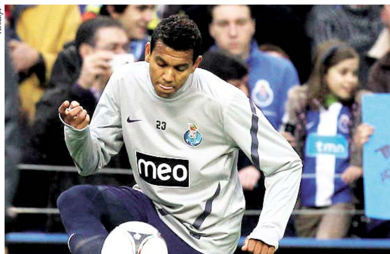
Souza deve ser anunciado como mais um reforço do Grêmio

A imprensa portuguesa divulgou que Souza, ex-Vasco, pode ser um novo reforço para o Grêmio. Volante, o jogador destacou-se pelo Vasco em 2010, ano em que foi negociado com o Porto, de Portugal. Outro jogador na mira gremista é o argentino Facundo