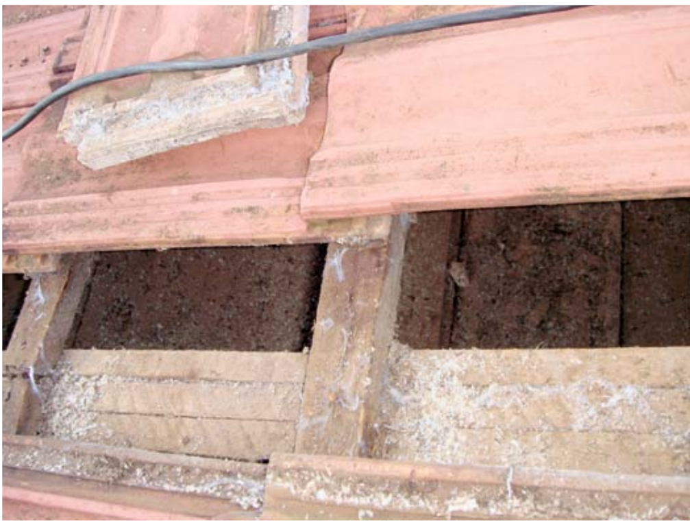
O telhado também fica sujo

Pó de milho e outras substâncias são acumuladas em pouco tempo, de acordo com moradores