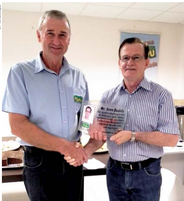
Placa traz mensagem de orgulho por parte dos colegas e amigos