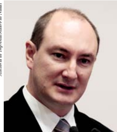
Deputado estadual Mauro de Nadal (PMDB)

De Nadal explica que é necessário ampliar a capacidade nestas subestações em virtude das frequentes quedas de energia elétrica registradas nos últimos anos na região. Entre os principais fatores apontados pelo deputado estão o aumento significativo no uso do sistema elétrico de refrigeração,