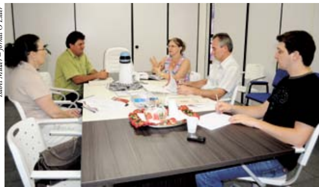
Conselho pautou os assuntos interligados ao início de 2012

O encontro teve como pauta a apresentação do orçamento de 2012 da Secretaria Municipal de Indústria, Comércio e Turismo; o andamento da licitação para o orçamento de seção de uso das empresas; a deliberação sobre as formas de incentivo econômico para as empresas; as atividades