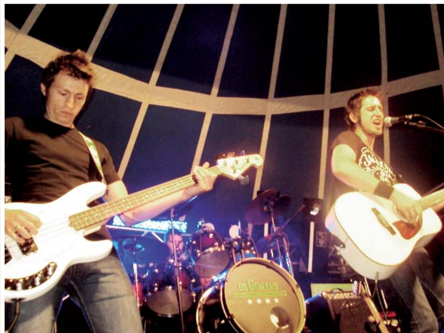
Banda teve início em dezembro de 2011