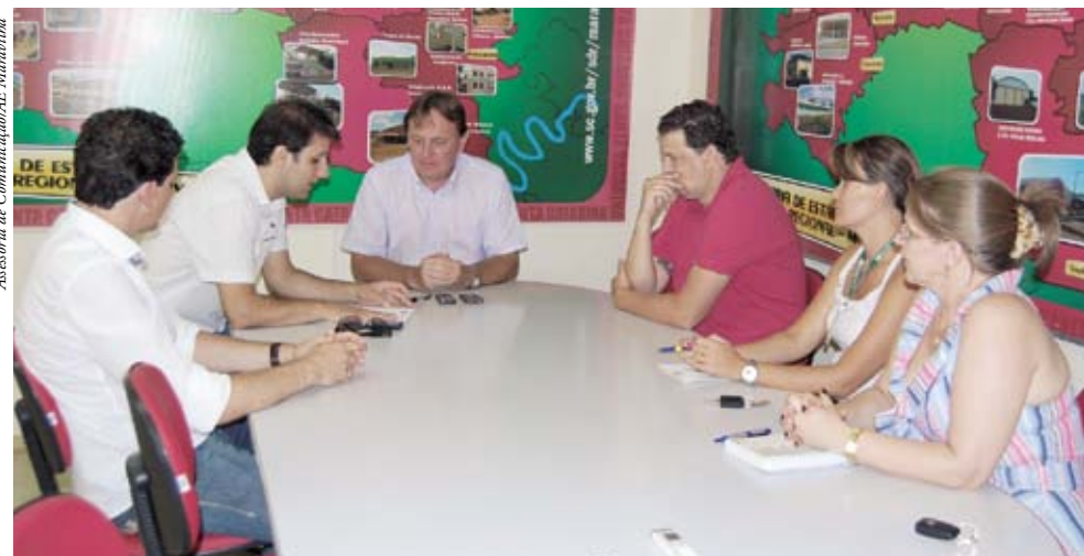
A nova diretoria leva a preocupação da entidade em relação ao desenvolvimento do município

Donati destacou que as perimetrais são um projeto do Governo Federal e a SDR cobrará urgência na realização do projeto. Segundo a diretoria da Associação Empresarial, esta será uma das reivindicações da atual gestão e o assunto deve ser discutido de forma permanente nos próximos meses.