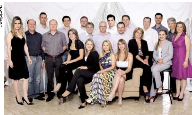
Nova diretoria da CDL/Associação Empresarial