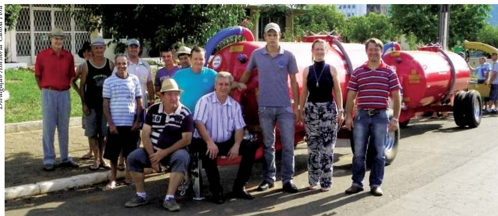
A entrega foi realizada na segunda-feira (06), em frente à prefeitura municipal

O outro espalhador de esterco ficará para uso do município para o transporte de água, enquanto persistir a estiagem, após, será destinado às comunidades indicadas pelo Comitê Agropecuário.