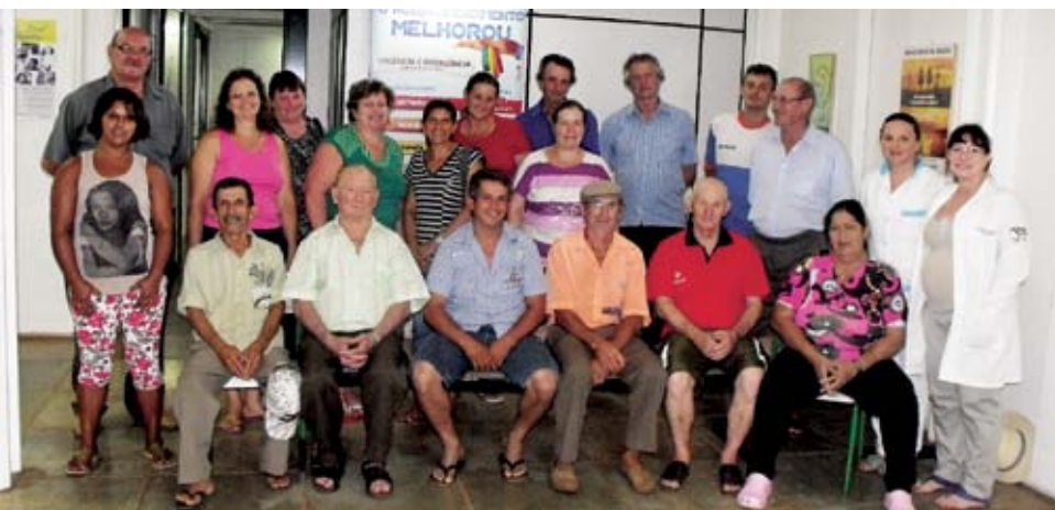
48 próteses dentárias foram entregues

A secretária lembrou que as próteses representam qualidade de vida para os pacientes e é o principal desafio da equipe de governo.