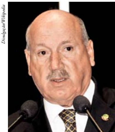
Senador Luiz Henrique da Silveira