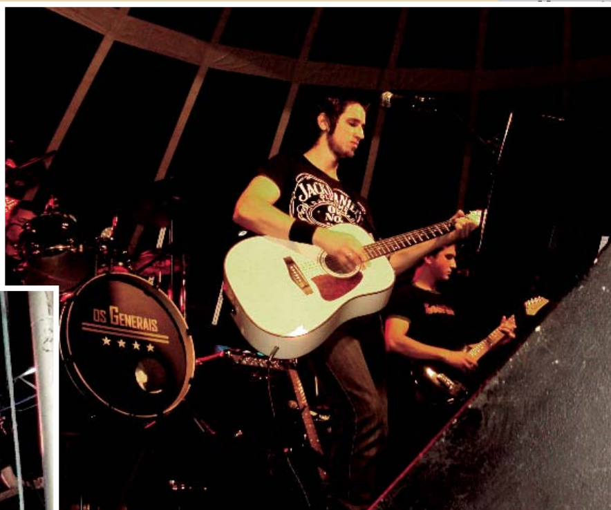
Inicialmente o trabalho da banda Perseu é focado em covers de bandas nacionais e internacionais