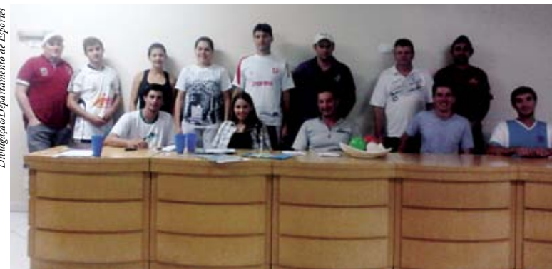
Congresso técnico foi realizado na última terça-feira (07)

Já o sistema de disputa feminino consiste em todos contra todos, sendo que classifica as quatro melhores equipes para as semi-finais.