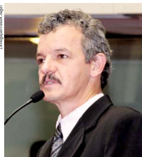
Deputado Dirceu Dresch

Complementar 50/2011, que reduz de dez para cinco anos o prazo máximo para a análise e julgamento de processos pelo Tribunal de Contas do Estado. O PT apresentou emendas ao PLC visando suspender o efeito retroativo e evitar que processos em curso sejam automaticamente arquivados, sem serem julgados.