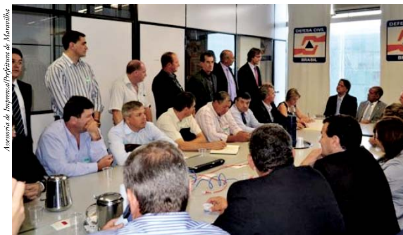
Seiffert participou da audiência

O deputado federal Pedro Uczai (PT/SC) destacou que a grande mobilização dos prefeitos presentes na reunião decorre devido a gravidade da situação que os municípios estão passando. “Precisamos de uma ação emergencial da Defesa Civil, e uma delas é a compra de caminhões pipas para atender os municípios