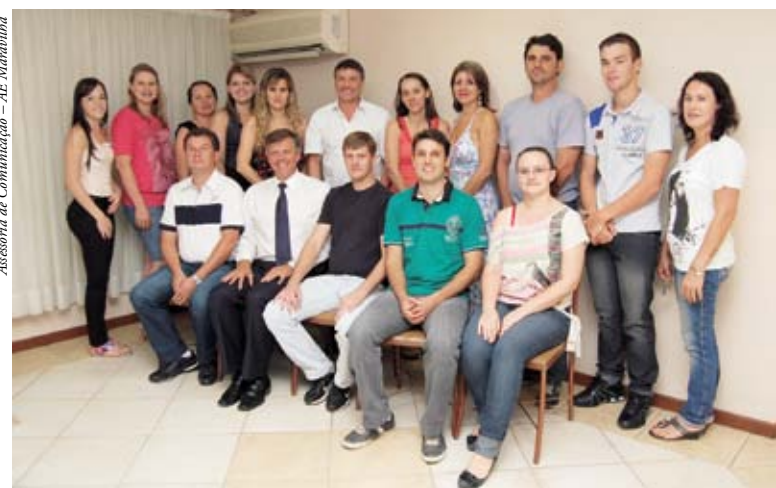
Assessoria de Comunicação - AE Maravilha

O presidente da federação comentou que devem ter continuidade, em 2012, ações como o Pedágio do Brinquedo, o Recicla