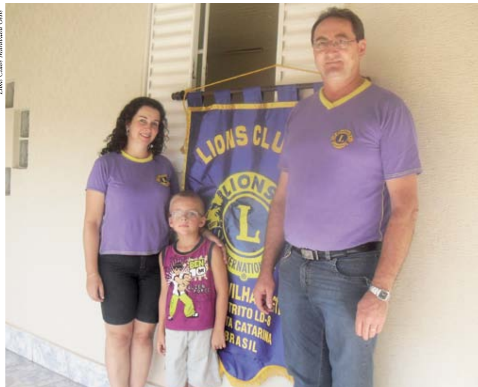
Campanha de Visão teve início em 2012 com entrega de óculos

“Ainda procuramos incentivar os associados a participar de eventos do distrito como convenções, que em 2012 aconteceu nos dias 21 e 22 de abril em Videira, nestes encontros é que são aprovados o que o Lions ajuda, pois não tem cor partidária nem religião. Buscamos num comum sempre ajudar as pessoas a buscar conhecimentos, sendo que nessas convenções sempre acontecem palestras que acrescentam conhecimento aos companheiros”, define o presidente.