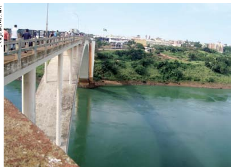
Comerciantes podem importar mercadorias pela Ponte da Amizade

As importações deverão respeitar o limite máximo anual de R$ 110 mil, com limites trimestrais de R$ 18 mil para o primeiro e o segundo trimestres, e de R$ 37 mil para os dois últimos trimestres. Esse sistema não vale para as importações de armas, munições,