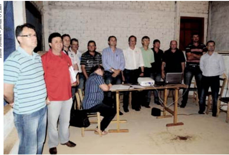
Autoridades e lideranças reforçaram o comprometimento com a Casa Familiar Rural

Na ocasião foi feito um encaminhamento onde todas as autoridades que estavam presentes se comprometeram. O presidente do Sindicato dos Trabalhadores Rurais de Maravilha e extensões de base (Tigrinhos, Flor do Sertão e São Miguel da Boa Vista) explica que "agora, é só fazer um processo para o Estado reconhecer e começarem as aulas. Quem sabe comece as aulas nos próximos dias, mas ainda precisamos do aval do Governo do Estado para dar início".