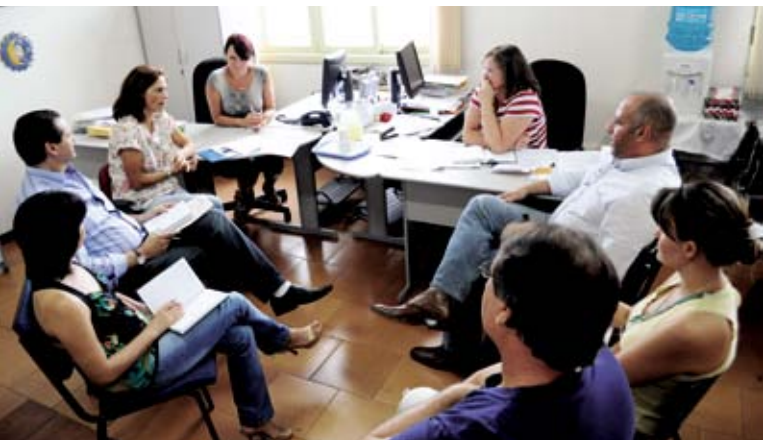
Senac apresentou os cursos e confirmou parceria com a Gered