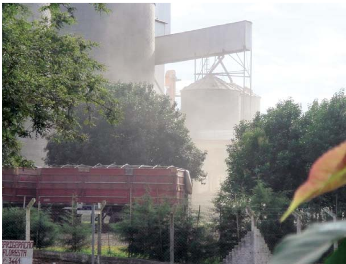
Poeira no Posto 13 é visível