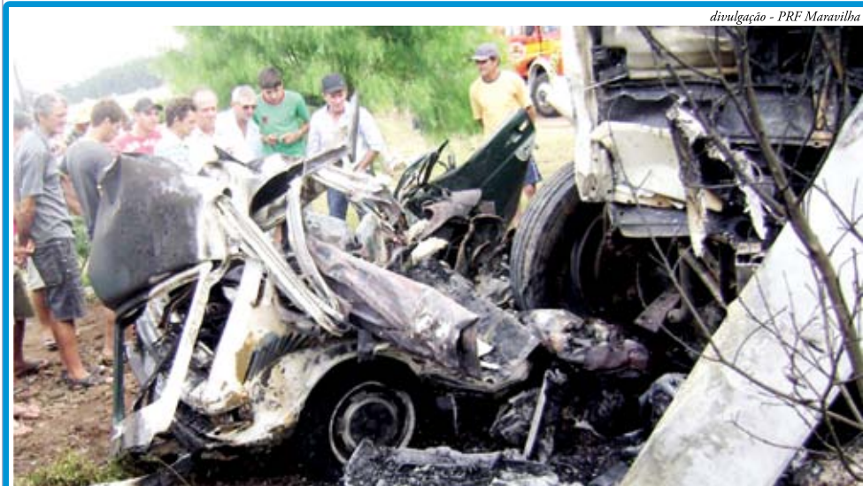
Após colisão, veículos pegam fogo e motorista morre no local

Ano 1 - Nº 71 - Sábado, 11 de fevereiro de 2012 - R$1,00