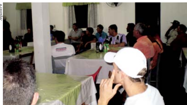
Encontro reuniu filiados e simpatizantes