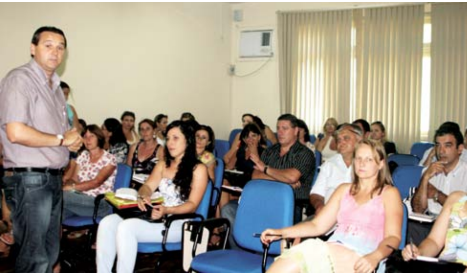
Em encontro professores planejam o ano letivo de 2012

No calendário escolar, as aulas devem seguir até o dia 23 de dezembro, com recesso de 15 dias para os alunos e sete para os professores.