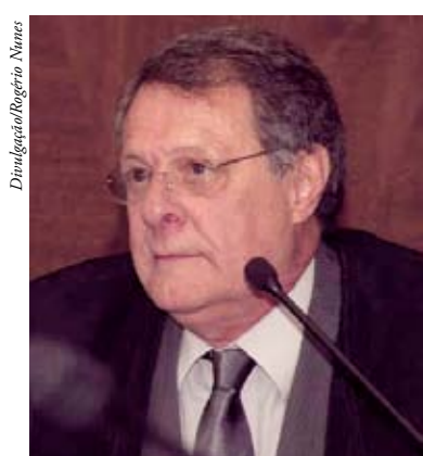
Desembargador d’Eça Neves

Natural de Tubarão, d’Eça Neves ingressou na magistratura de