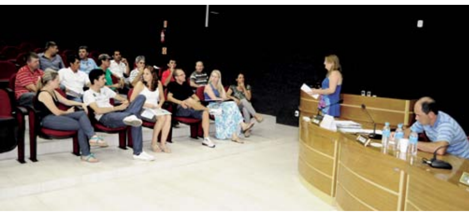
Municípios participaram de reunião na terça-feira em Maravilha

Além disso, definiu-se a data da assembleia para a escolha da nova diretoria da Acaverios: 27 de março, na Câmara de Vereadores de Maravilha.