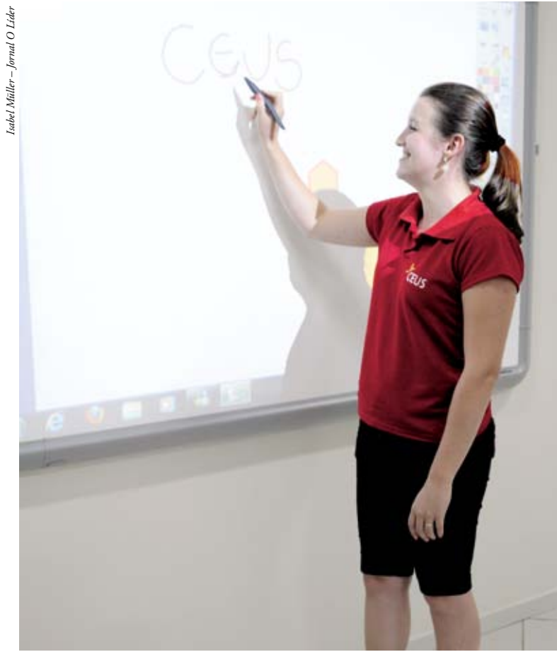
Lousa digital é a última tecnologia em sala de aula

"Continuamos a única escola de Maravilha com o sistema Posi-