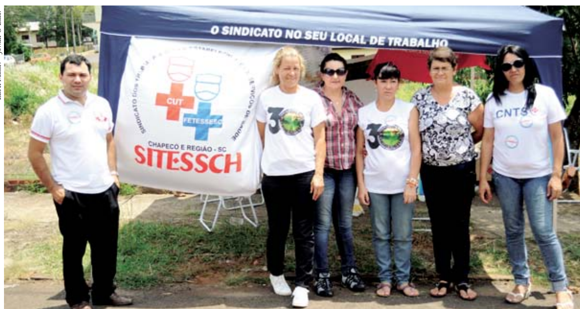
Diretores do Sitessch conversam com profissionais da saúde com o intuito de mobilizar a área para a campanha salarial

A campanha salarial visa à luta pelo reajuste salarial conforme inflação, que trata-se da corre-