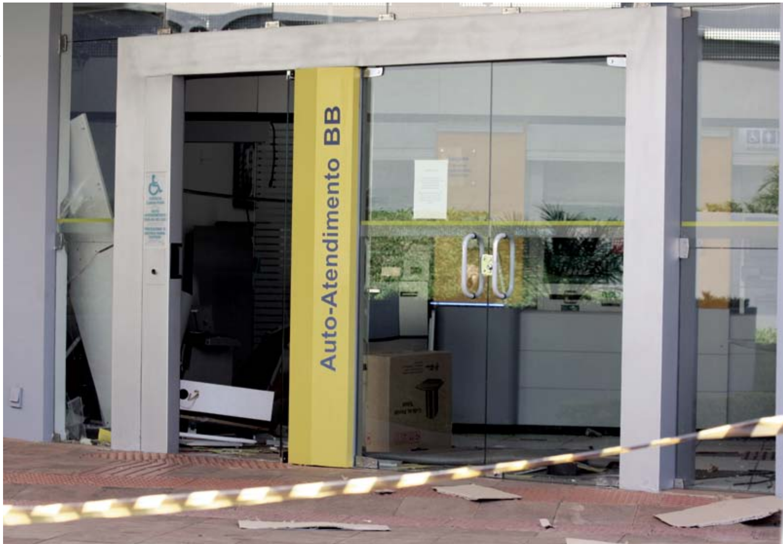
Ilaine Rohden - Jornal O Líder

Assaltantes arrombaram a porta e explodiram o caixa eletrônico. Após, empreenderam fuga em direção ao Rio Grande do Sul. Placa do veículo foi retirada para ocultar informações e dificultar a identificação