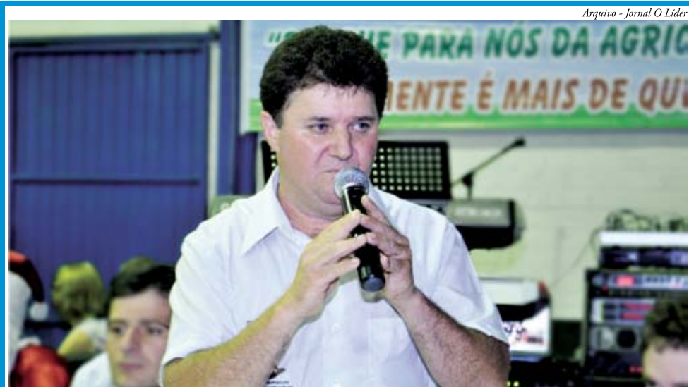
Eleição do Sindicato dos Trabalhadores Rurais acontece na próxima semana