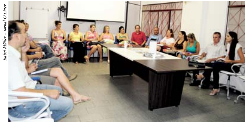
Senac apresentou a proposta de implantação dos cursos no município