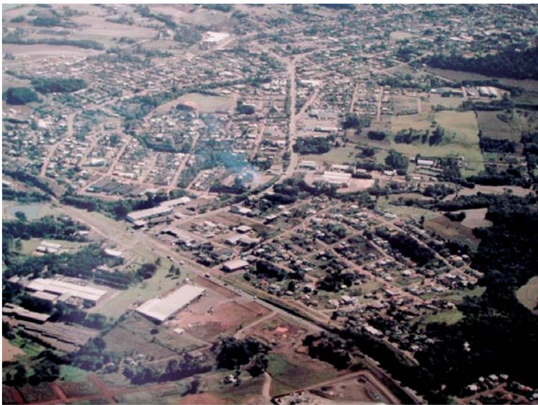
Foto área mostra à fumaça saindo dos silos