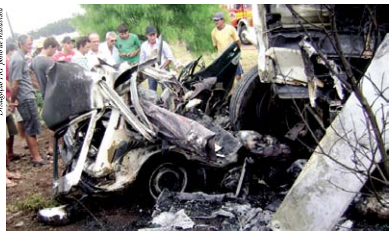
Veículos pegaram fogo após a colisão

Com a batida, a Brasília acabou entrando em baixo do caminhão e chegou a ser arrastada por alguns metros. Após a colisão, os veículos pegaram fogo. O motorista da Brasília ficou preso nas ferragens e morreu no local. Ele foi parcialmente carbonizado. O condutor do caminhão saiu ileso.