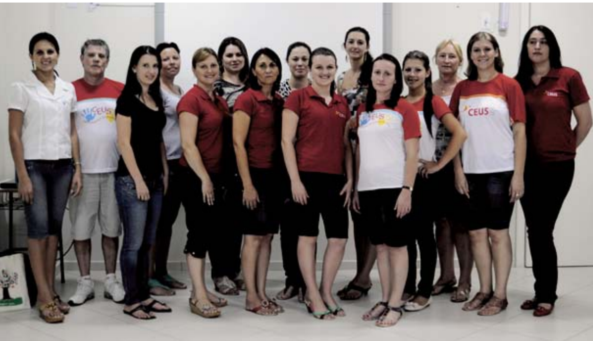
Corpo docente da escola Ceus prepara ano letivo de 2012

As matrículas ainda estão abertas, inclusive para o cursinho pré-vestibular. O horário das aulas é das 07h30 às 11h45 e das 13h15 às 17h15, também proporciona o período especial das 07h às 19h.