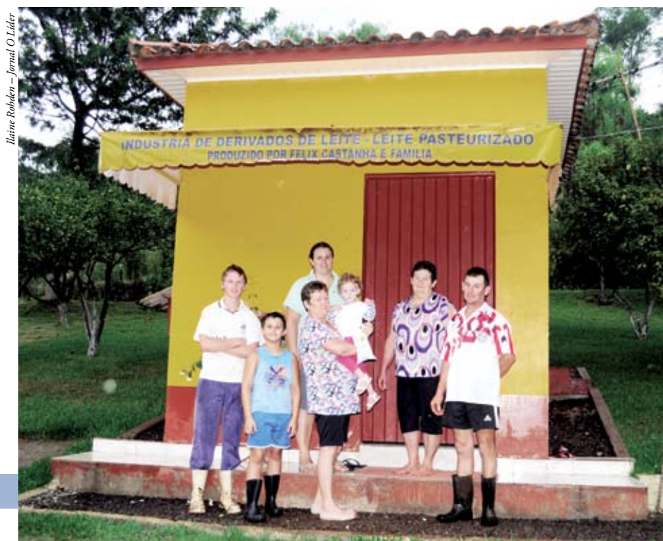
Família Castanha trabalha em equipe e harmonia