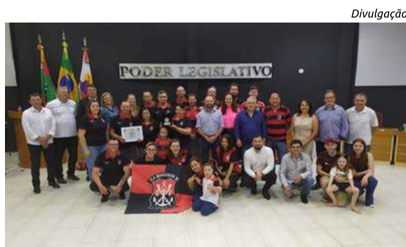
Divulgação Cônsul do Fla Maravilha foi homenageado em sessão especial realizada na segunda-feira (20)

- Projeto de Lei nº 38/2023, que dispõe sobre homologação de termo de doação com encargos – empresa Mercedes Bens – Sperandio.