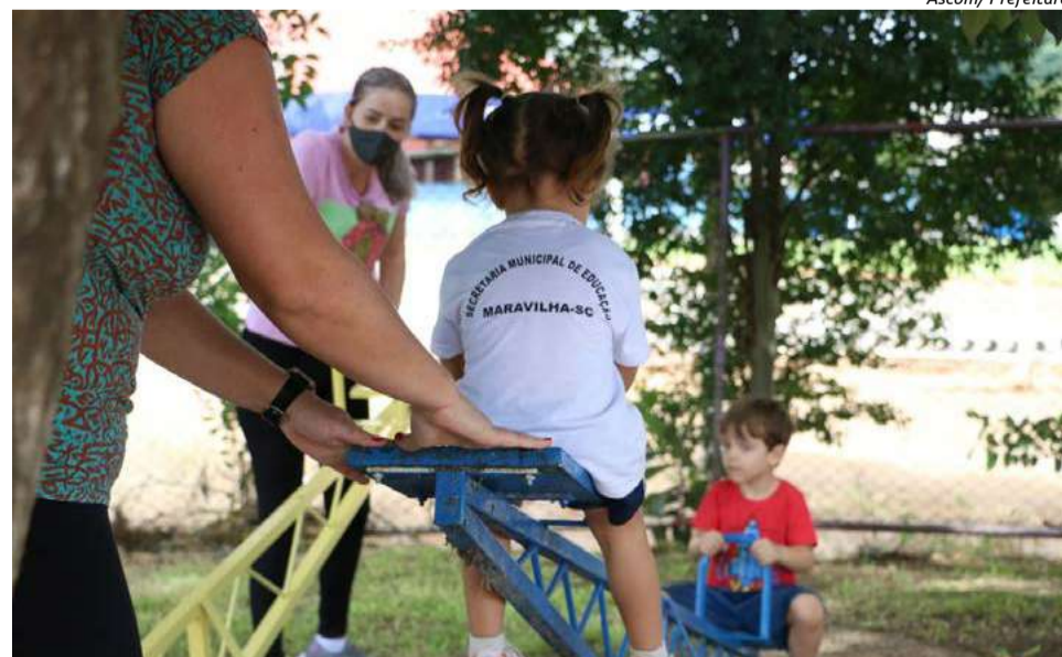
Matrículas vão ser feitas nos dias 27, 28 e 29