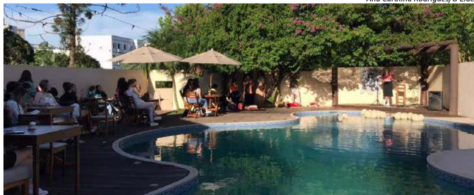
Evento aconteceu no Café Relicário, que foi o apoiador da ação