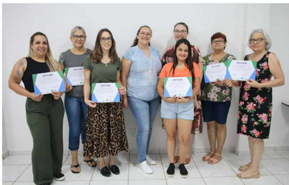
Seis mulheres realizaram o curso

município e capacitar novas profissionais. O curso de costura básica teve duração de 54 horas e aconteceu na sala do ateliê corte e costura do Núcleo do Vestuário, localizado no antigo Seminário. Nesta turma, 6 mulheres concluíram o curso e receberam o certificado para atuar na área.