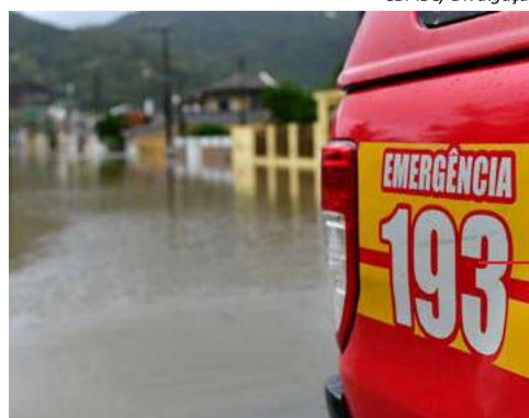
O telefone 193 é o número do Corpo de Bombeiros para emergências