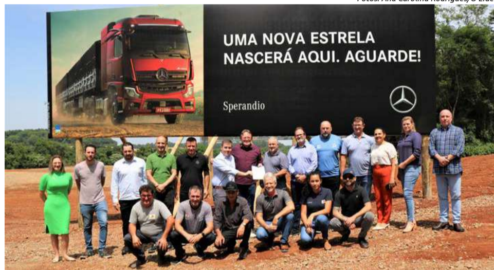
Termo foi encaminhado a Câmara de Vereadores para análise