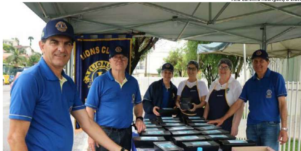
Entrega foi feita na sede, localizada na Avenida Presidente Kennedy