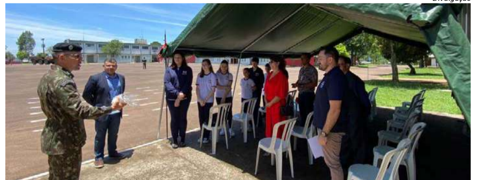
Ritual foi realizado em todos os quartéis do Brasil

da apresentação das novas viaturas operacionais.