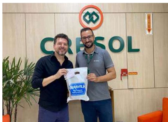
Visita ao associado Cresol Aliança