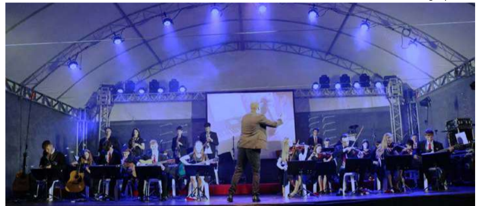
Orquestra de Itapiranga finalizou a noite com um lindo espetáculo