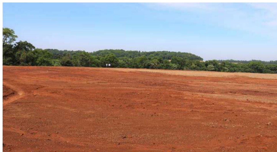
Cerca de 8 mil cargas de materiais foram retiradas