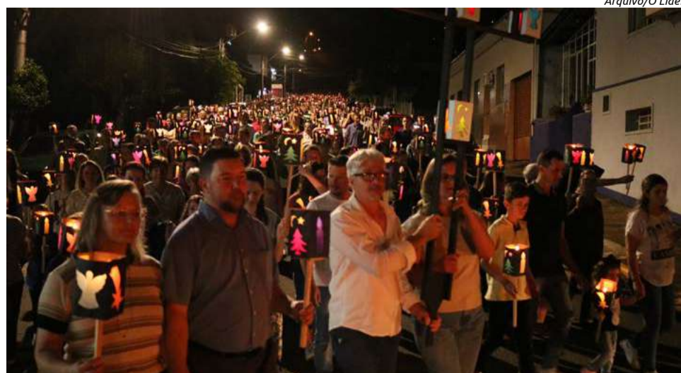
Caminhada segue até a praça central