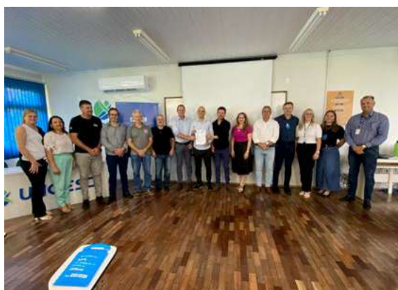
Presidente da CDL e AE participa da inauguração do SENAI