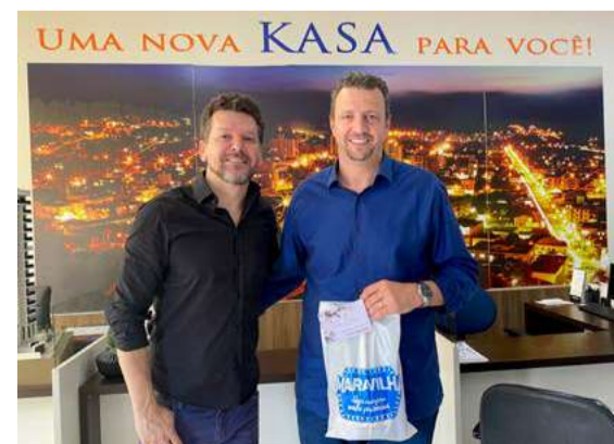
Visita ao associado Kasa Empreendimentos