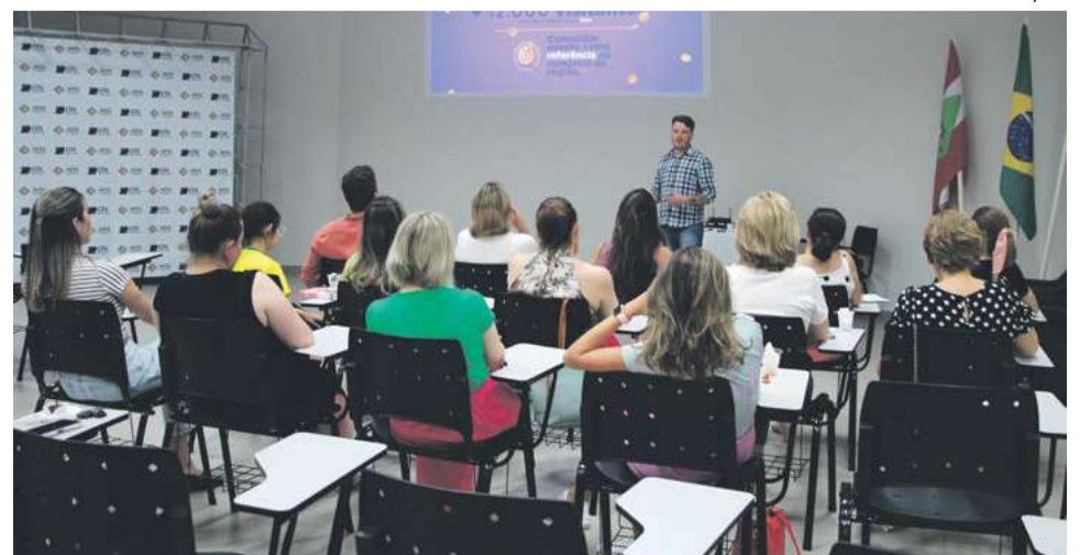
Evento foi promovido na CDL e Associação Empresarial