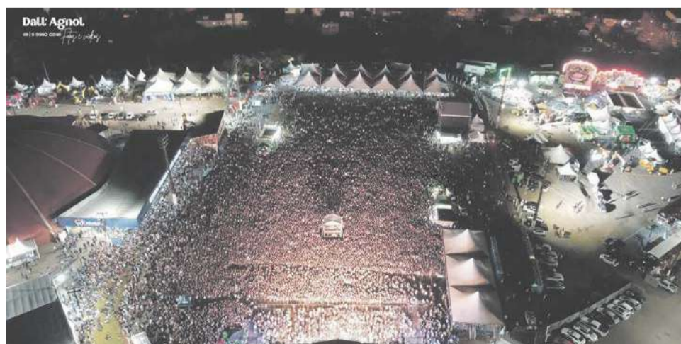
Shows reuniram milhares de pessoas

A Fecimar ocorreu entre 11 a 15 de novembro e contou com a apresentação de cantores renomados, como Marcos e Belutti, Israel e Rodolfo, Hugo e Guilherme, Leonardo e Régis Danése.