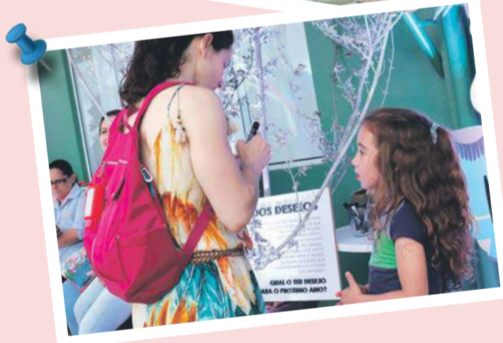
Participantes escreveram seus desejos para 2023