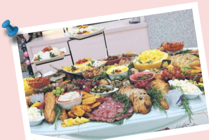
Lançamento contou com coquetel recheado de delícias