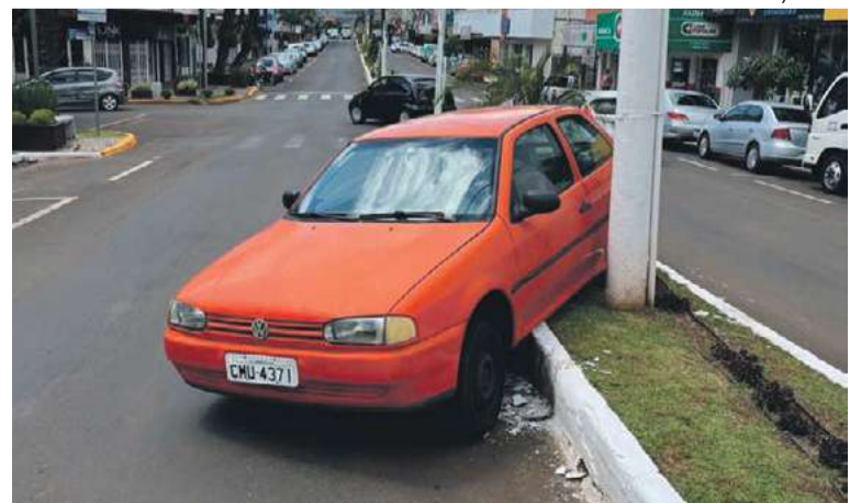
Carro ficou parado em cima do canteiro principal da Avenida Araucária