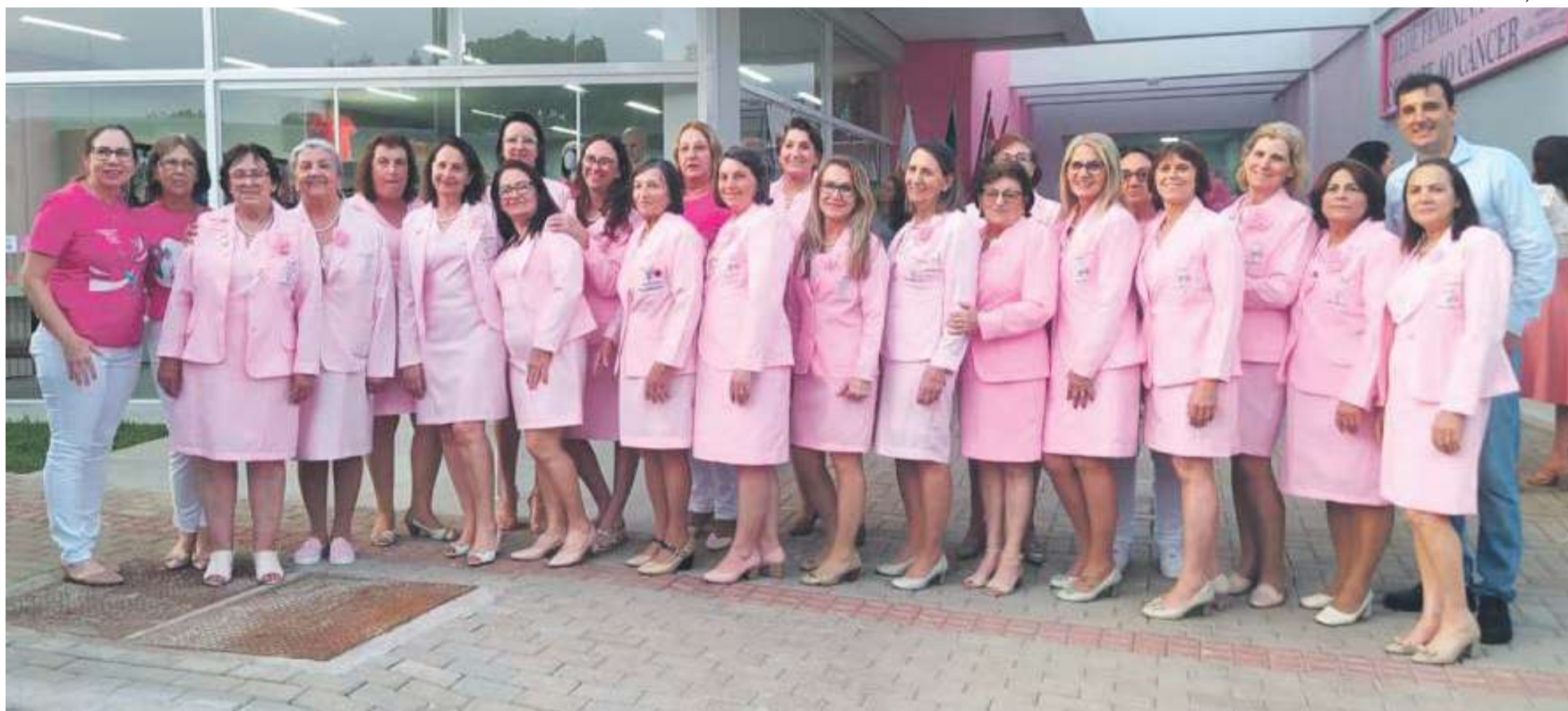
Voluntárias comemoraram a conquista da nova sede