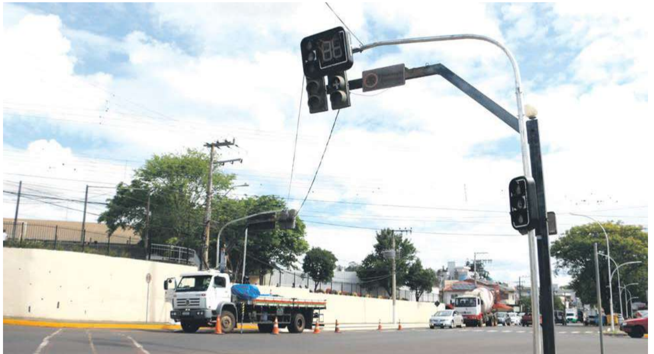
Objetivo da mudança é melhorar o fluxo do trânsito