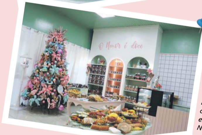
Espaço conta com decoração especial de Natal