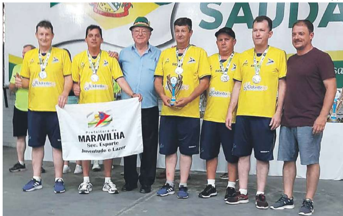
Bocha masculina conquistou o segundo lugar