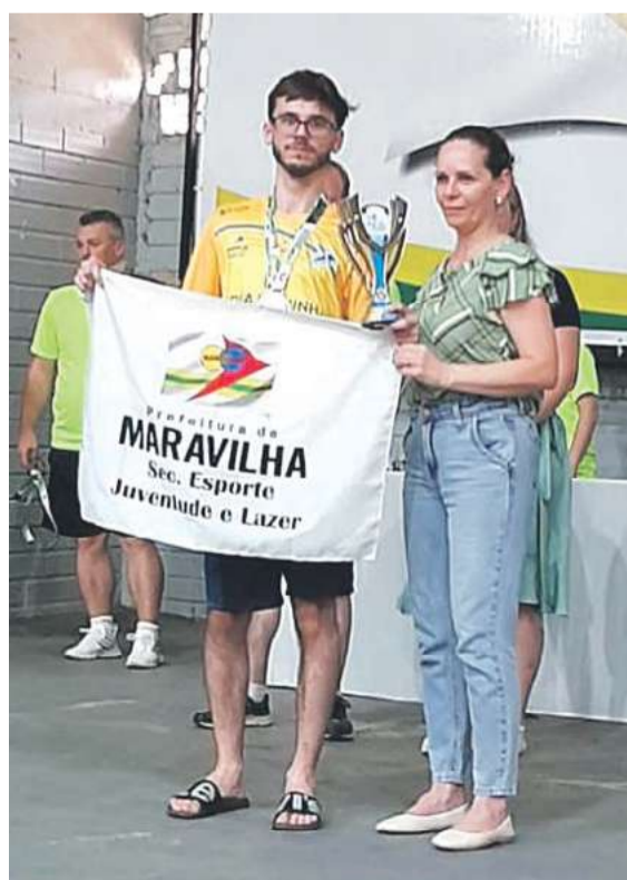
Tênis masculino e feminino ficaram com o segundo lugar