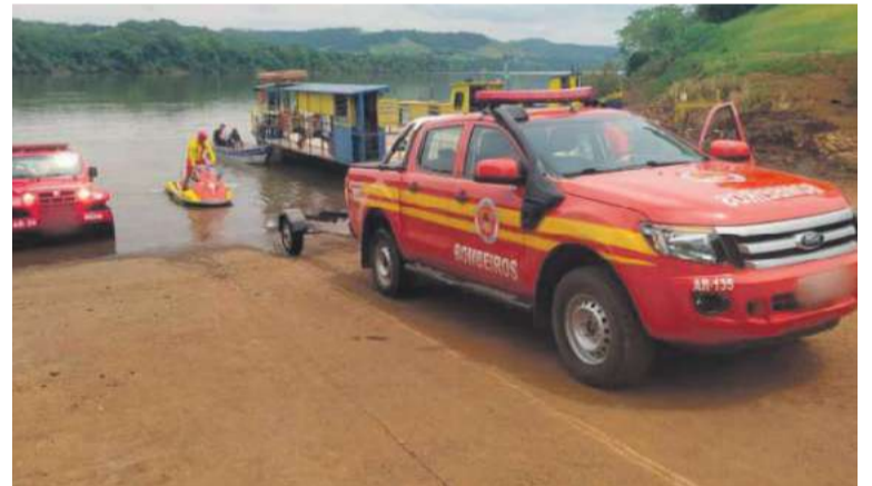
Homem desapareceu em Mondaí e foi localizado em Itapiranga