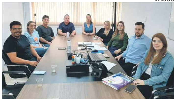
Reunião entre o Núcleo de Engenheiros e Arquitetos e representantes da prefeitura e Amerios