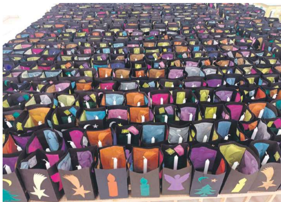
Evento irá contar com mais de 800 lanternas

Bunse. O local será palco de pronunciamentos. Para esta edição do evento, os Casais Reencontristas confeccionaram mais de 800 lanternas.