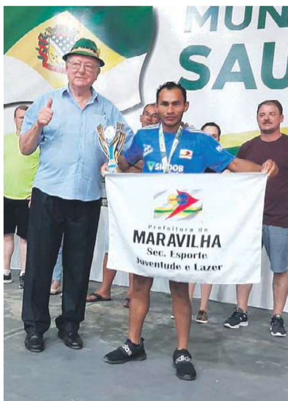
Maratona garantiu a segunda colocação