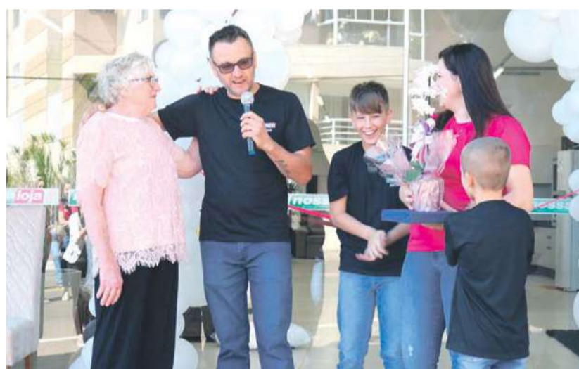
Família comemorou a conquista