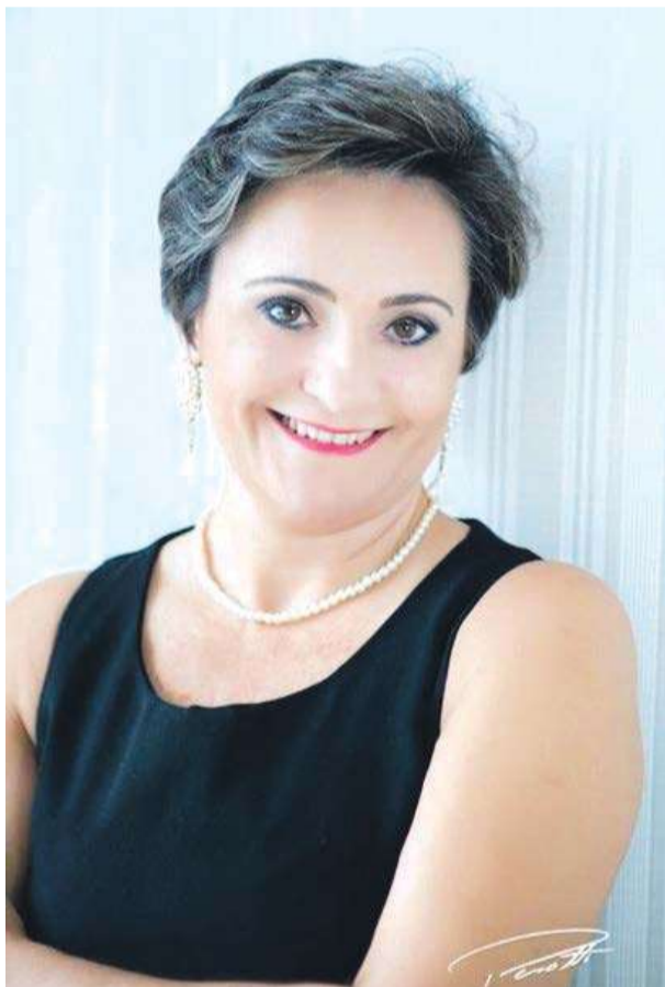
Regina, que a alegria, a saúde e o amor sejam sempre abundantes na sua vida. Parabéns!