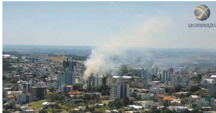
Fumaça tomou conta do local e foi percebida há quilômetros de distância