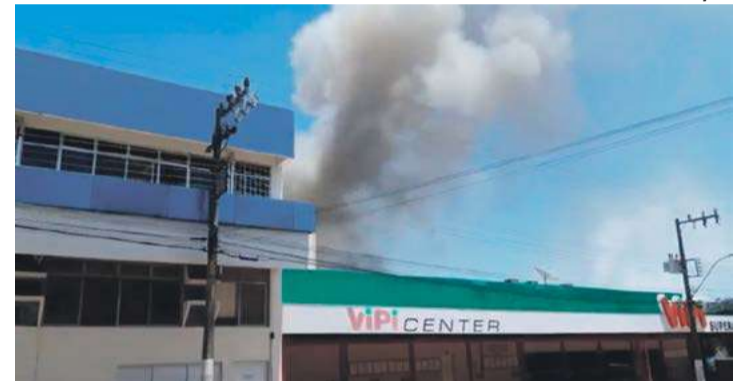
Fogo começou no depósito e rapidamente se alastrou no estabelecimento