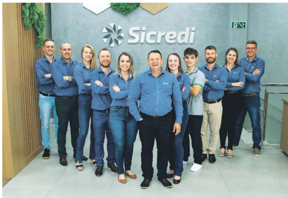
Equipe da agência de Cunha Porã