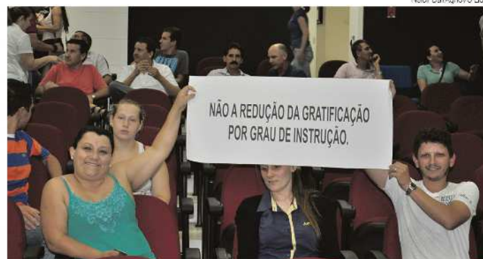
Sessão contou com manifesto contrário à iniciativa do governo municipal

Após a reunião a secretária explicou do que trata um dos