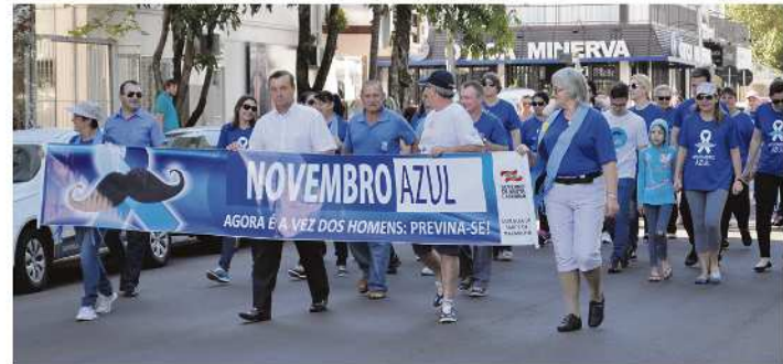
Pessoas desfilaram em prol da saúde masculina

a secretaria vai realizar palestra na Câmara de Vereadores com a temática "Saúde do ho-