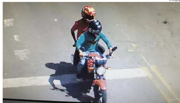
Câmeras flagraram ação dos assaltantes no município

O homem trabalha na Lotérica Banca da Sorte de Maravilha e estava levando o