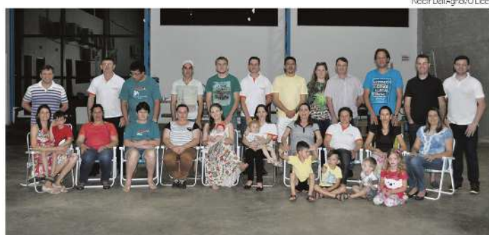
Turma 2016 contou com 16 participantes que estiveram nos sete encontros

dente da escola de Maravilha, os debates são sobre assuntos relevantes à vida em família. "Escola de Pais é uma associação de voluntários que está presente em todo o Brasil. Ela visa melhorar o relacionamento familiar entre pais e filhos, trata da educação em várias etapas. Nos encontros discutimos as fases da educação desde a primeira infância, pré-adolescência, adolescência, e