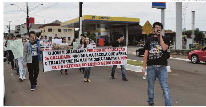
Passeata foi pela Avenida Araucária, até a Câmara de Vereadores

Além dos alunos em Maravilha, outro grupo da Cidade das Crianças se deslocou até Pinhalzinho, onde