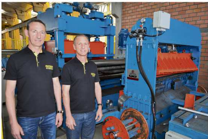
Irmãos mostram com orgulho a fábrica no Bairro Floresta

Sagrada Família, 351, Bairro Floresta, a Multi-Aço In-