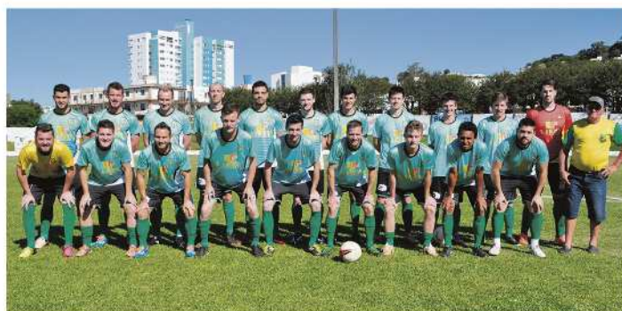
Na principal, o Canarinho da Primavera Alta também está na final e enfrenta o Esportivo

tórias, um empate e três derrotas. Classificou-se para as semifinais eliminando o 4S Amizade pelo placar de 3 a 2. Nas semifinais enfrentou o Internacional da Consoladora, foram duas vitórias pelo mesmo placar: 3 a 1 na ida e na volta.