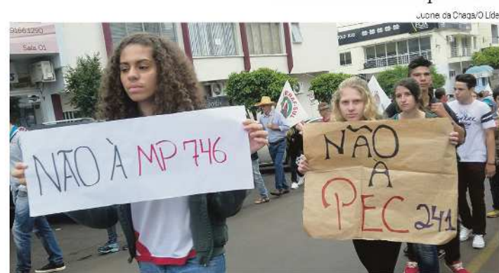
Dia de greve nacional teve movimentação em São Miguel do Oeste