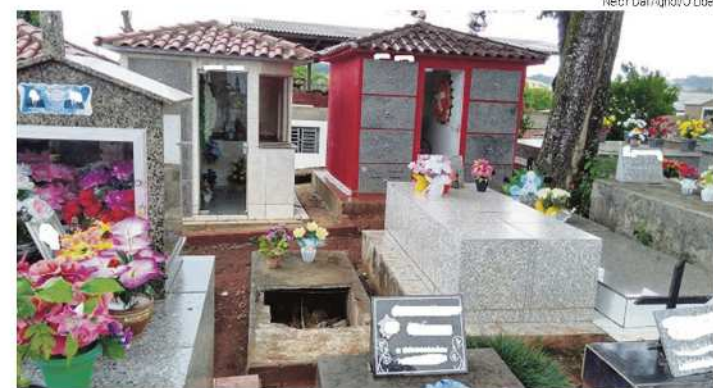
Túmulo está aberto e sem identificação