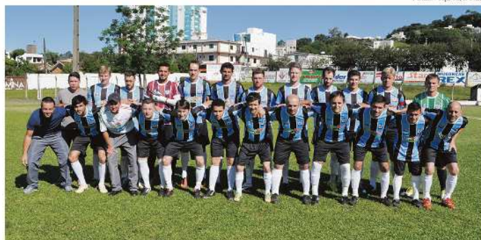
Na principal, o Esportivo se classificou depois de uma vitória e um empate na semifinal

O Canarinho da Primavera Alta, na fase de classificação, somou sete pontos, ficando em 3º lugar da chave A. Foram duas vi-