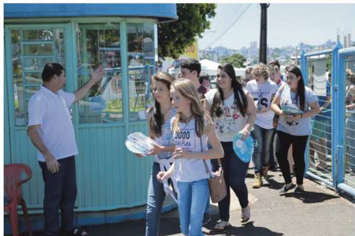
Além do campus da Unoesc, campus do IFSC e o Colégio Jesus Maria José foram os locais de prova

No sábado (5) foram aplicadas as provas de ciências humanas e ciências da natureza. Cada uma teve 45 questões. No domingo (6) os candidatos realizaram as provas de linguagens, códigos e Matemática, com 45 questões, e também prepararam uma redação com o tema "Caminhos para combater a intolerância religiosa no Brasil". Em São Miguel do Oeste, nas três instituições onde ocorreu a prova, Unoesc, IFSC e Colégio Jesus Maria José, a maioria chegou mais cedo. Ao meio-dia foram abertos os portões, momento em que os alunos começaram a chegar. Às 13h os portões foram fechados e, meia hora depois, as provas iniciaram. Os gabaritos foram divulgados no dia 9 de novembro. Já o resultado individual de cada candidato ficará disponível posteriormente, em data a ser comunicada pelo Inep.