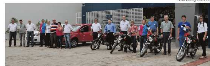
Ganhadores retiraram premiação na quarta-feira (9), na agência bairro

Conforme Barbieri, a cooperativa chega aos 31 anos com mais de 31 mil associados, o que significa mais de mil novos sócios por ano. "A nossa atribuição é acreditar nas pessoas e principalmente no cooperativismo. Nosso diferencial é poder atender melhor o quadro de associado e devolver em sobras. Tudo isso que nós fizemos é retribuir para o associado, pois é ele quem investe, ele quem acredita e recebe o retorno", ressalta.