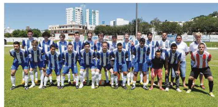
Esportivo Bela Vista classificado na aspirante para a final do municipal