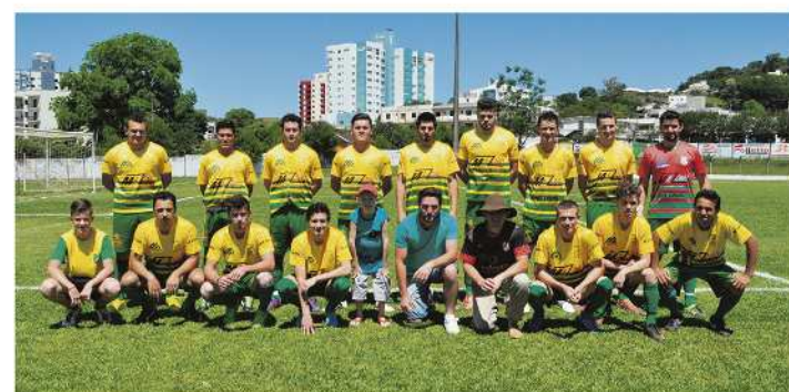
Aspirante do Canarinho da Primavera Alta eliminou o Internacional da Consoladora, atual campeão