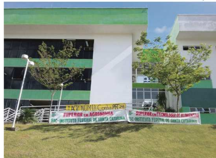
Portões estão fechados e diversas faixas e cartazes identificam a manifestação

A decisão pela ocupação foi ainda na semana passada, em assembleia. "Os alunos fizeram votação, quando optaram por fazer essa ocupação do campus. As principais pautas desse movimento dos estudantes são a PEC 241 e MP 746. Em alguns campi do IFSC está acontecendo o cancelamento das aulas, a princípio aqui em São Miguel do Oeste o mo-