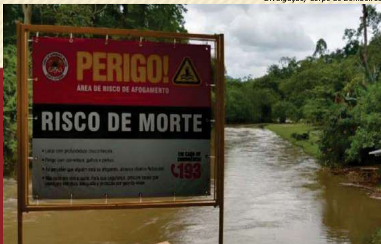
Diversos locais da região contam com placas de alerta