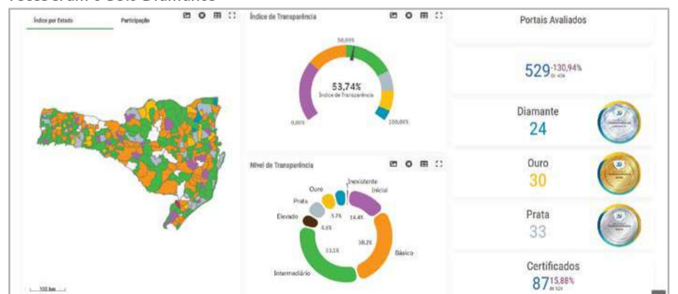
Entre todas as entidades avaliadas no Estado, que somam 529, o Legislativo maravilhense está entre as 24 com nível Diamante