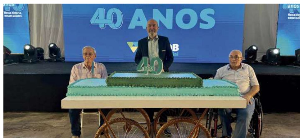
Corte do bolo foi efetuado pelos três presidentes eleitos ao longo da história do Sicoob Credial