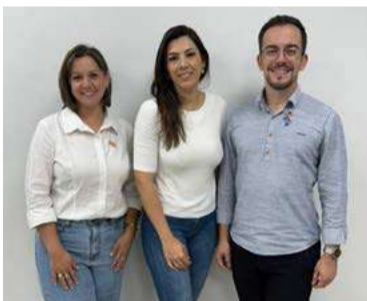
Secretária de Indústria, Comércio e Turismo, Layana Miotto