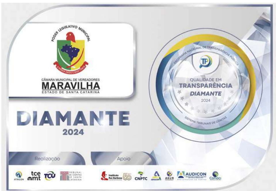
Selo Diamante para a Câmara de Vereadores de Maravilha