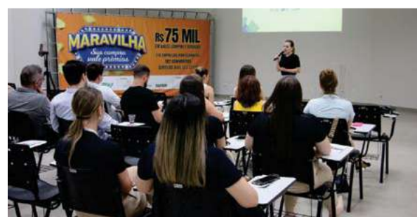
Assembleia foi realizada na noite de quarta-feira