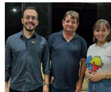
Secretário de Transportes, Obras e Urbanismo, Paulo Gottardi