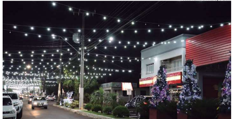
No dia do show e da cerimônia também aconteceu o acendimento das luzes