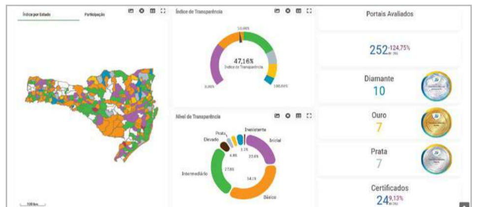
Entre as 252 câmaras municipais avaliadas no estado, Maravilha está entre as 10 que receberam o Selo Diamante

Conforme o programa, na avaliação são considerados um total de 124 critérios definidos e 230 itens específicos. Os sites que atendem a um nível de transparência entre 75% e 84% recebem o Selo Prata; entre 85% e 94%, o Selo Ouro; e entre 95% e 100% dos critérios avaliados, o Selo Diamante.