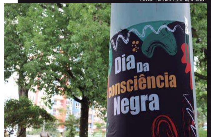
Data mobiliza reflexões e atividades sobre a contribuição da cultura Africana e Afro-brasileira