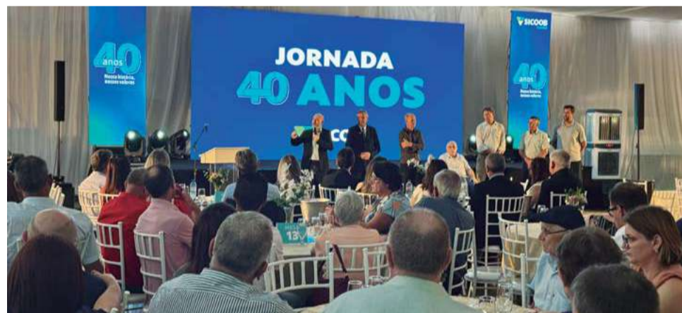
Com valorização, emoção e homenagens, tema do evento foi “Jornada 40 Anos”