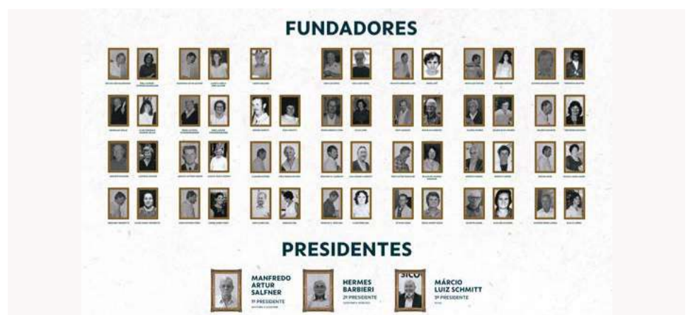
Painel teve inserção da imagem das esposas dos sócios-fundadores, valorizando a mulher fundadora