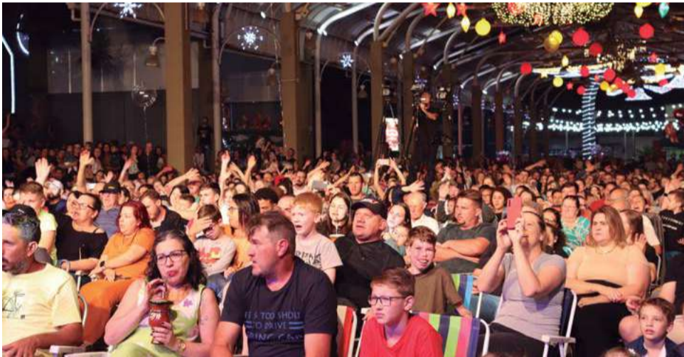
Programação natalina terá Show com Simão Wolf, totalmente gratuito

Na próxima quarta-feira (4), tem a programação Maravilhas em Movimentos, com apresentação de ballet, dança, patinação e zumba, no Ginásio Municipal, às 20h. Já no dia 8, tem Amostra Cultural, com apresentações culturais locais, às 17h30, no Espaço Criança Sorriso. A promoção é do Conselho Municipal de Políticas Culturais e Departamento de Cultura. E para encerrar a programação natalina, no dia 15 de dezembro, tem Show com Simão Wolf, às 20h, no Espaço Criança Sorriso.