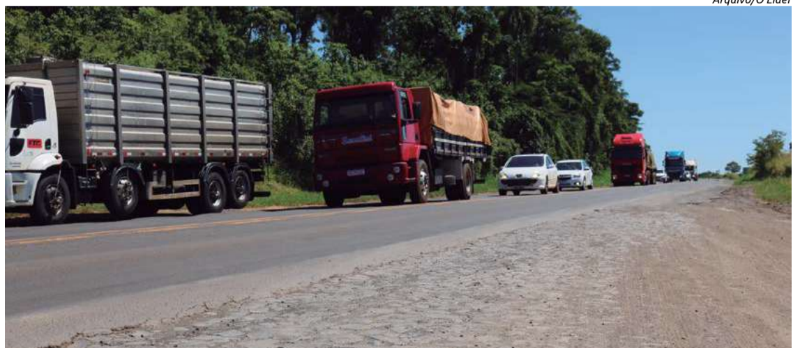
A BR-282 é um dos principais corredores logísticos de Santa Catarina