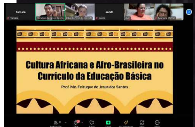
A Secretaria de Educação e Cultura de Maravilha promoveu palestra para educadores