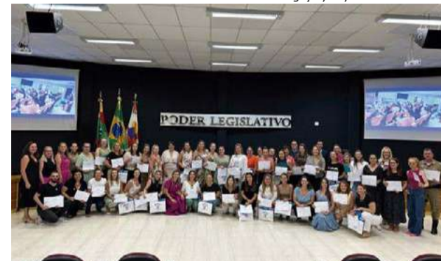
No dia 16 de fevereiro deste ano, 85 pessoas que passaram por capacitação foram nomeadas como profissionais de referência