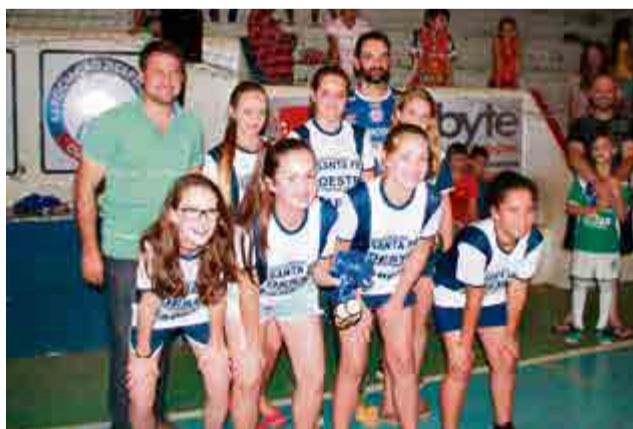
3º lugar sub-13 feminino: Azul