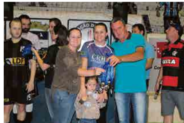
3º lugar feminino: Crh Automoveis