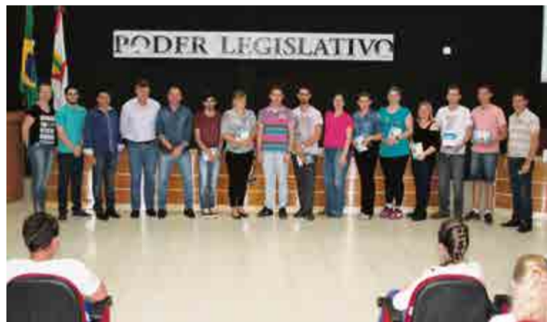
Professores receberam livro sobre a Câmara