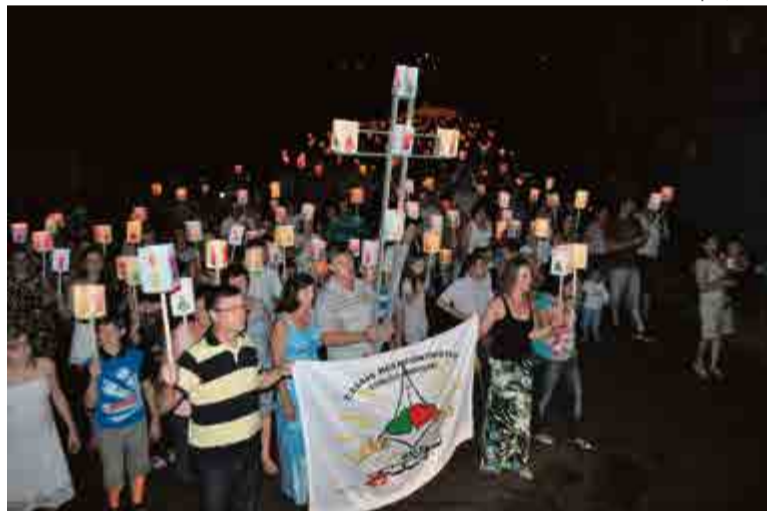
Caminhada é realizada no município há 19 anos