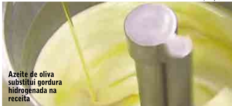
Azeite de oliva substitui gordura hidrogenada na receita