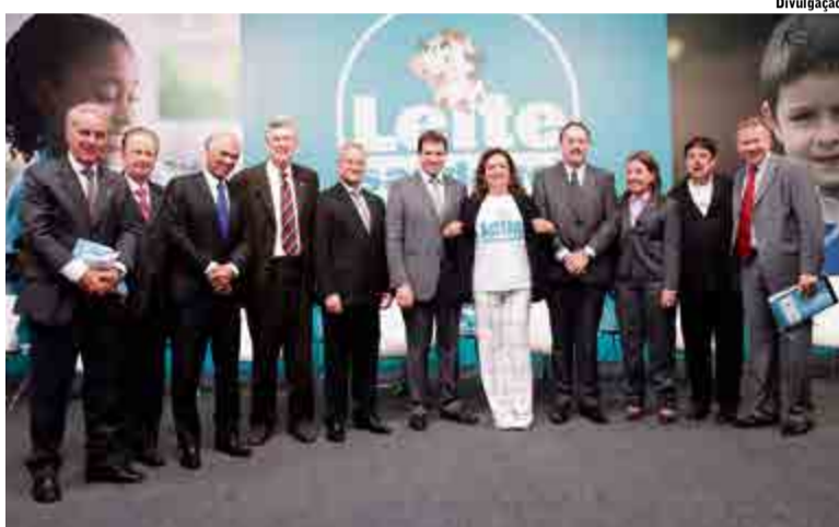
Frente Parlamentar em Defesa da Bovinocultura de Leite da Câmara dos Deputados