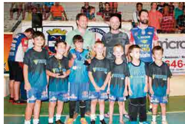
2º lugar sub-9: Sicoob Credial