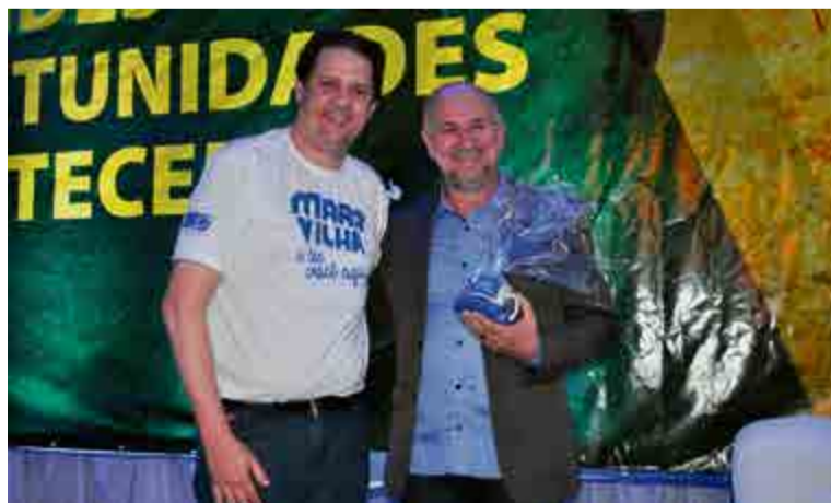
Presidente da CDL/AE entrega mimo ao palestrante