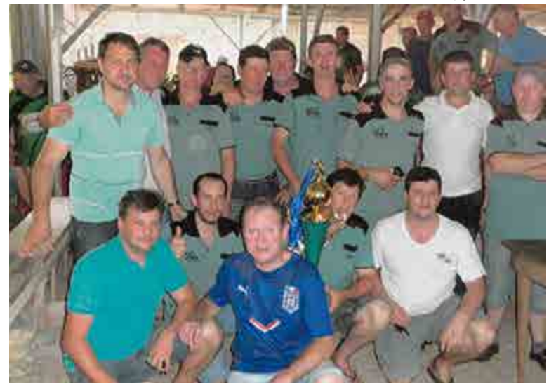
Levou o título de campeão o Tarcianos Bar B