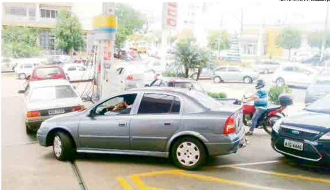
Motoristas lotaram postos de combustíveis de São Miguel na sexta-feira (6)

Ainda na semana passada, com a sinalização de nova greve, filas se formaram nos postos de combustíveis. Os motoristas correram para garantir o produto para os próximos dias. Com a demanda, muitos estabelecimentos ficaram sem combustíveis. Para o líder dos caminhoneiros, a atitude revela que é preciso pensar mais no coletivo, do que no individual. "Todo mundo está ciente que nosso país está um caos. Mas,