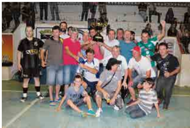
2º lugar veteranos: Porções