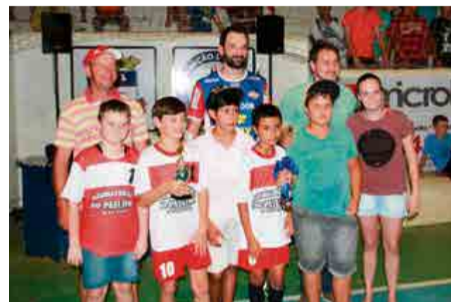
3º lugar sub-11: Instaladora Paulinho