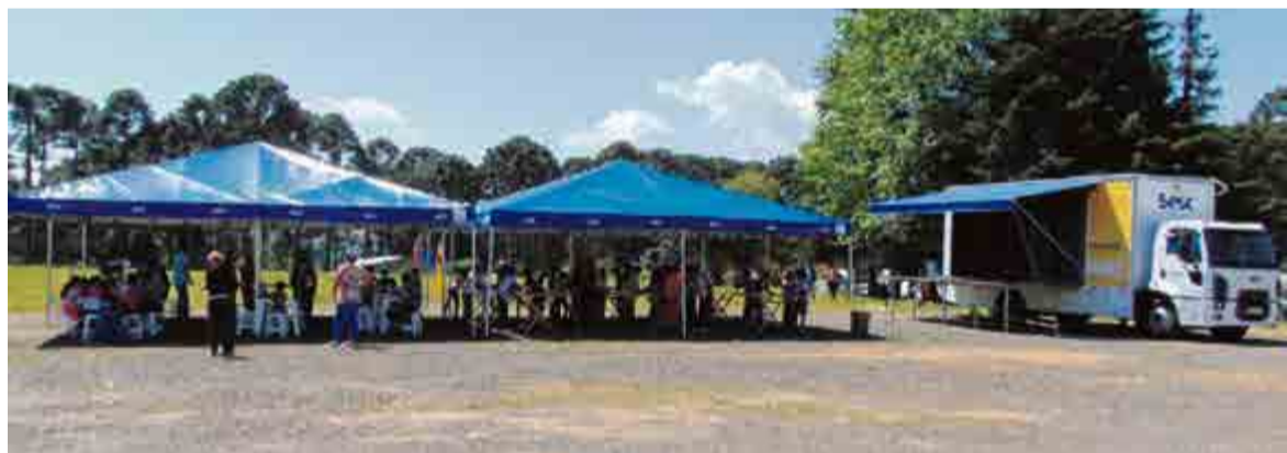
Estrutura é disponibilizada e instalada pelo Sesc

Sexta-feira (20): Colégio Geração das 8h30 às 9h30 e das 14h às 15h; e C.E. Raymundo Veit das 15h30 às 16h30.