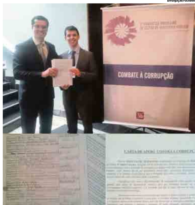
Promotor de Justiça entregou ao procurador da República a segunda etapa de assinaturas colhidas em Maravilha

"As 10 medidas contra a corrupção foi uma ideia dos procuradores que trabalham no caso da Operação Lava Jato. Um pacote de 22 ou 23 alterações legislativas que o MP propõe, porque a corrupção é um crime de baixo risco, é isso que o MP diagnosticou com relação ao atual estado legislativo de combate à