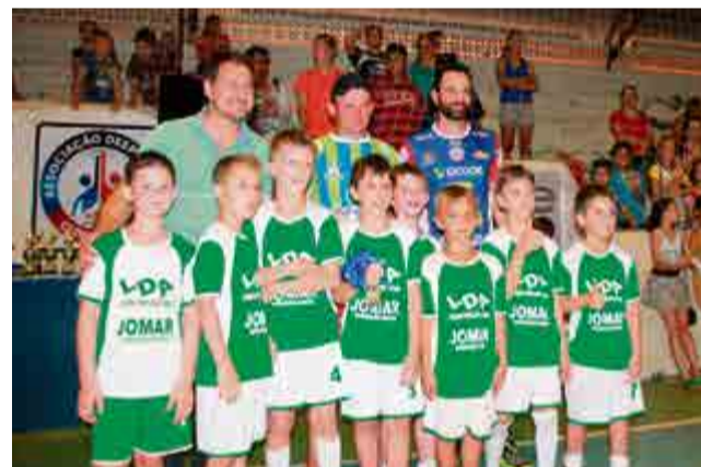
1º lugar sub-9: Chapecoense