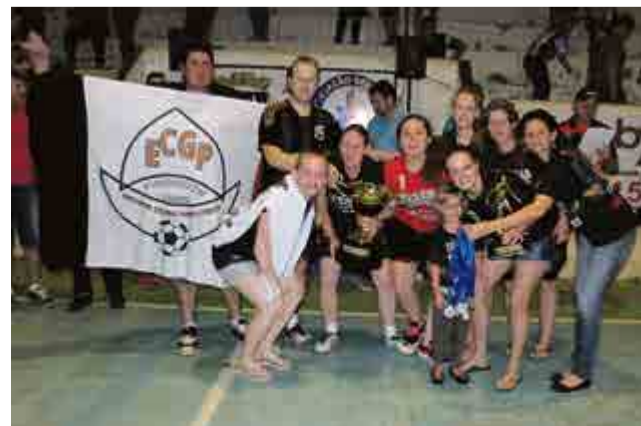
2º lugar feminino: Gato Preto-Maxxima