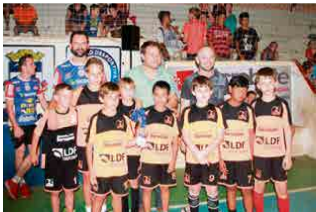
2º lugar sub-11: Sorvetone