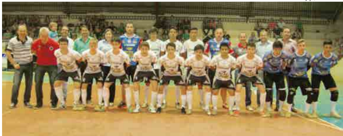
Equipe fez bonito no retorno, mas não conseguiu a classificação para a próxima fase