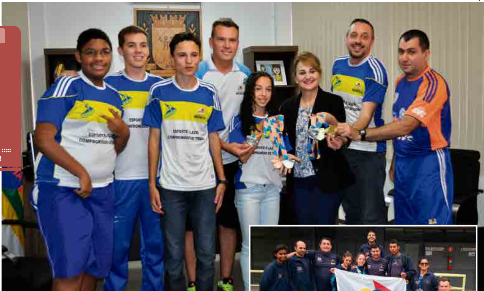
Atletas receberam o reconhecimento do Poder Público de Maravilha