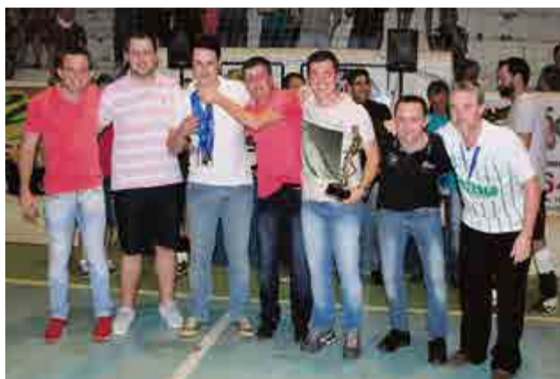
3º lugar principal: Oesteseg