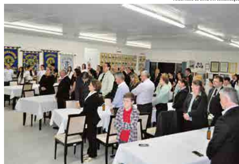
Integrantes dos clubes participaram da confraternização

bes que fazem a diferença. Toda vez que precisamos as entidades são as primeiras que estendem a mão para colaborar. Desta forma nós somos gratos ao trabalho