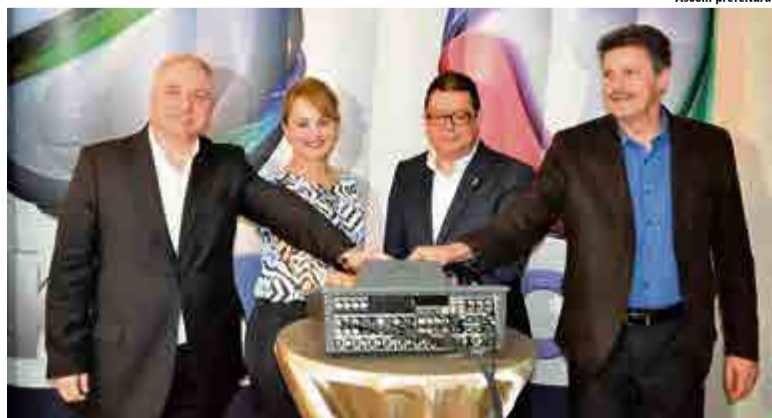
Apresentação oficial foi realizada na terça-feira (10)