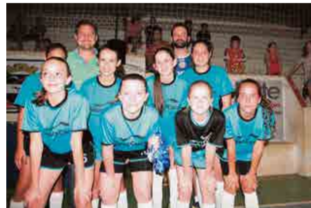
2º lugar sub-13 feminino: Nova Casa