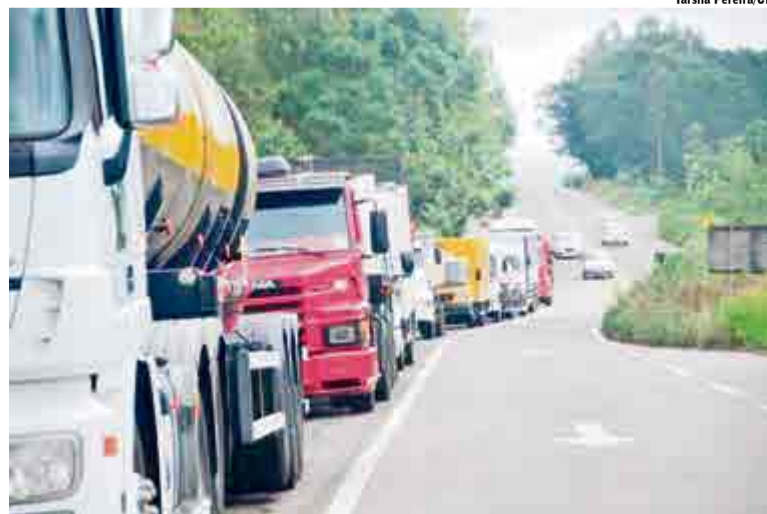
Caminhoneiros independentes fazem bloqueios pela derrubada da presidente, Dilma Rousseff