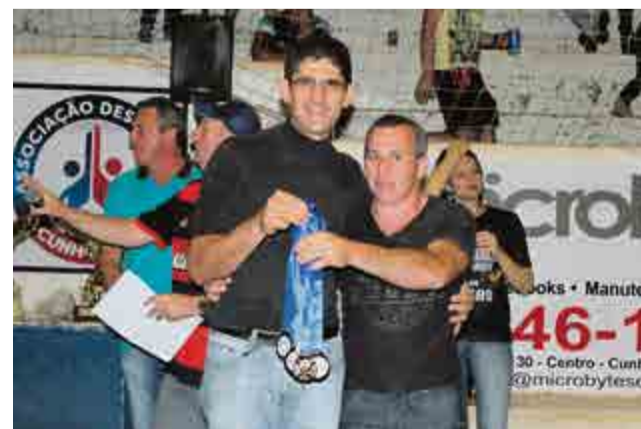
3º lugar veteranos: Rz Oras-Secchi