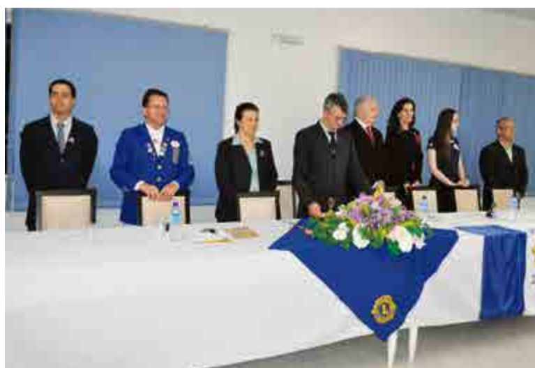
Lideranças dos clubes e do município prestigiaram a assembleia festiva