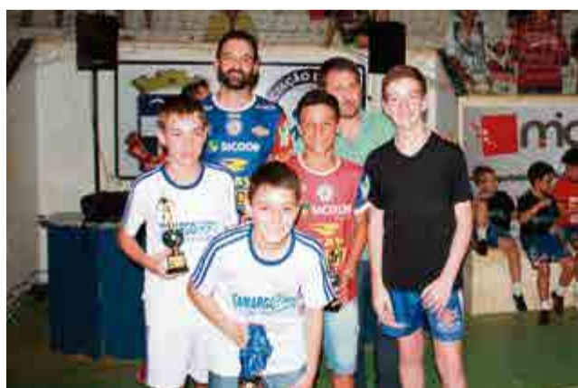
3º lugar sub-13: Camargo Sports