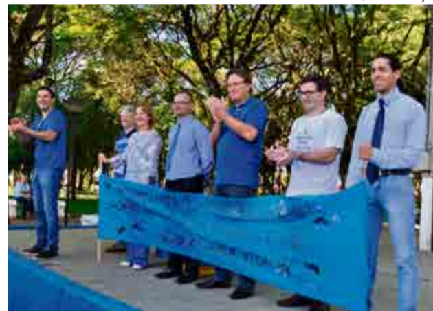
Autoridades participaram da caminhada azul