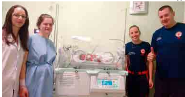
Mãe e filho passam bem