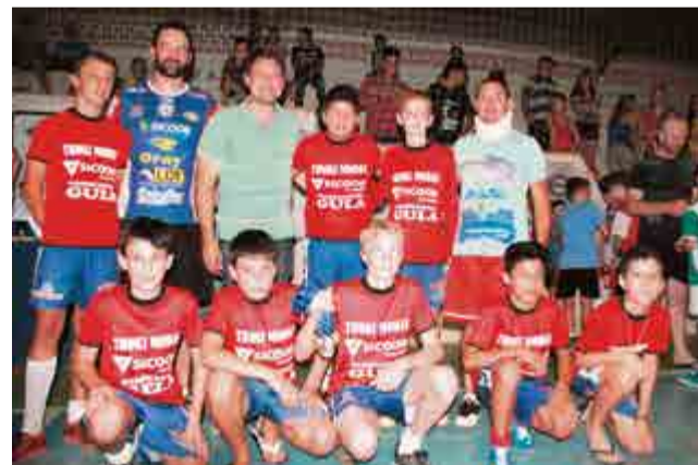
1º lugar sub-13: Toke Modas Papelaria