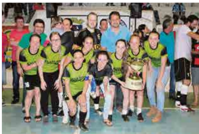
1º lugar feminino: Casa da Boa Troca