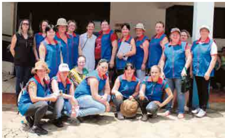
Equipe II deu prosseguimento às ações no período da tarde