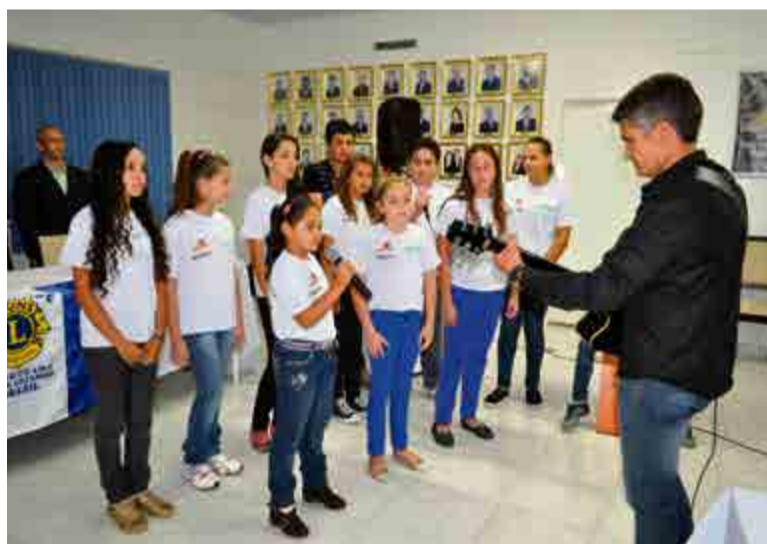
Durante a assembleia festiva os alunos do SCFV realizaram uma apresentação

raes ressaltou o trabalho desenvolvido pelos clubes, que sempre visam melhorar e colaborar para o bem-estar e comodidade dos maravilhenses. "Com certeza são clu-