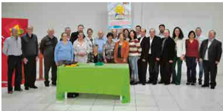
População participou da inauguração do Centro de Formação São José Operário