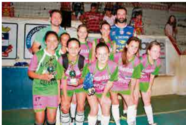
1º lugar sub-13 feminino: Sicoob Credial