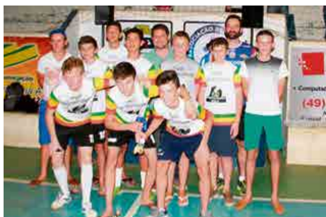
1º lugar sub-15: P&G Construtora