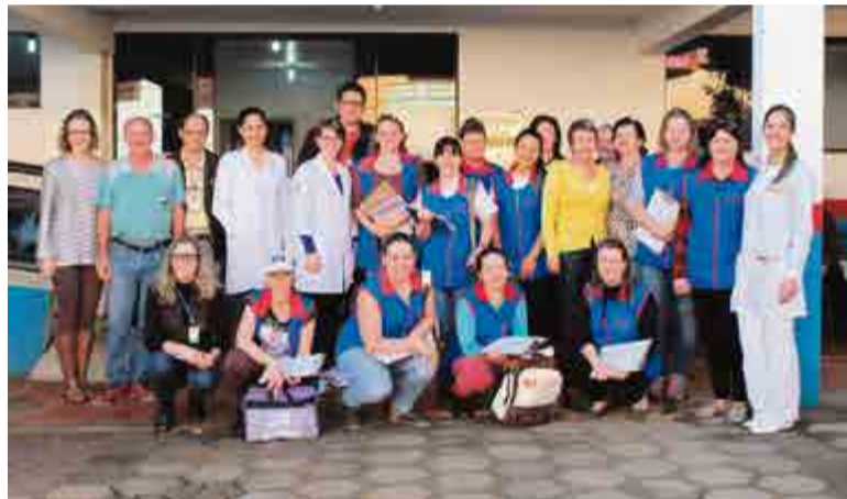
Equipe I deu início aos trabalhos no último dia 9, pela manhã