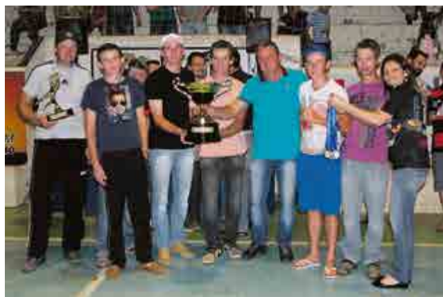
2º lugar interiorano: E.C. Glória