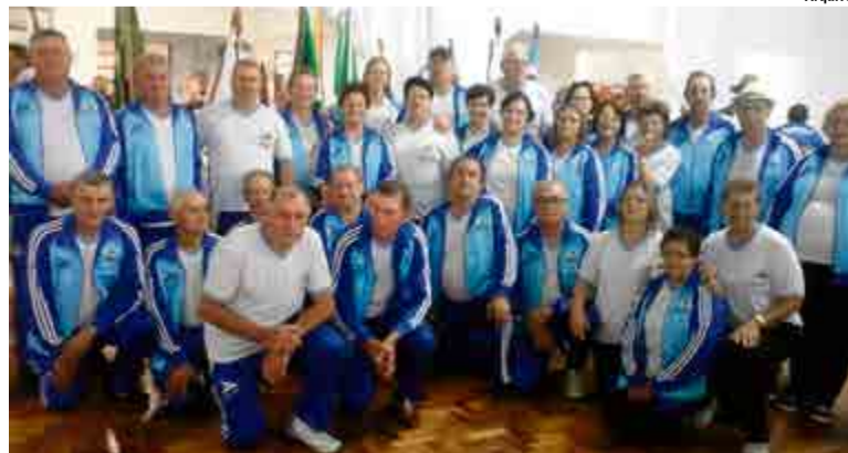
Jogos já são tradicionais no município