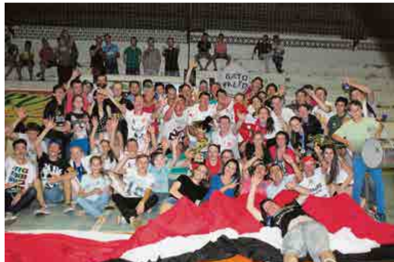
1º lugar principal: Gato Preto