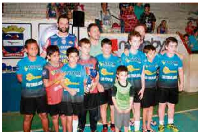
1º lugar sub-11: Sicoob Credial