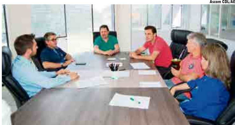
Conselho Deliberativo esteve reunido na quinta-feira (12) para validação da chapa