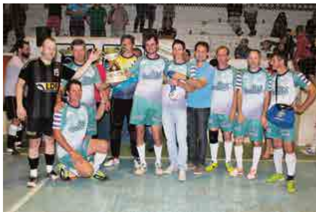
1º lugar: Veteranos das Quintas