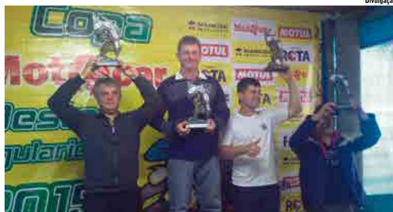
Meca conquistou o primeiro lugar na final da Copa Motocar