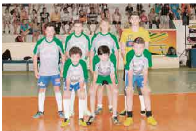
2º lugar sub-15: Posto Auriverde