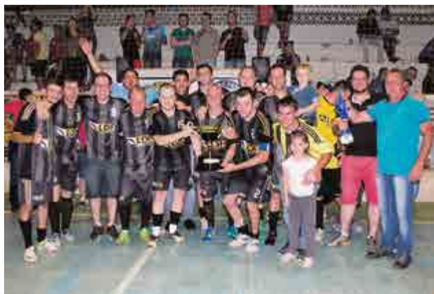
2º lugar principal: LDF Terraplanagens