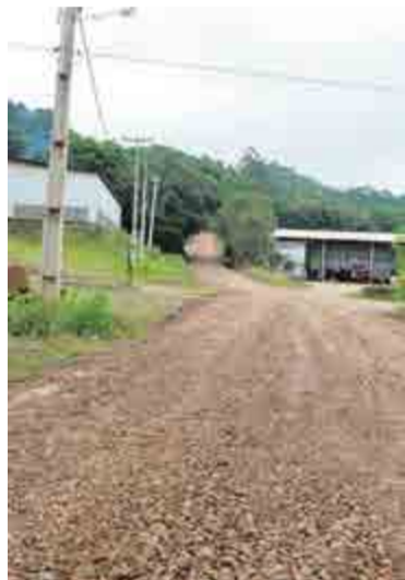
Ações visam colaborar com o tráfego dos veículos

A Secretaria de Obras e Infraestrutura de Cunha Porã está efetuando trabalhos em diversas estradas do interior do município, com o propósito de atender as demandas mais urgentes, levando em conta os altos índices de chuvas que vêm