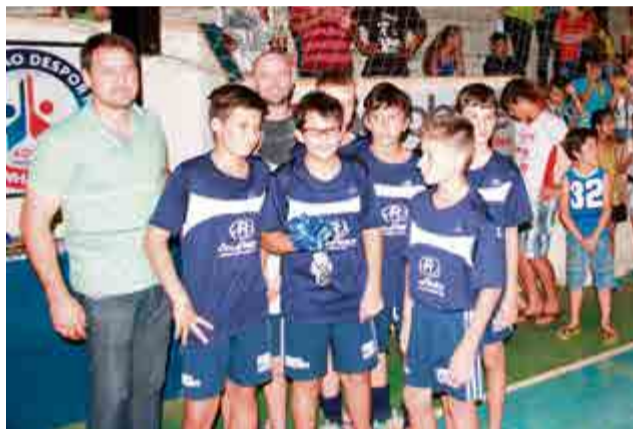
2º lugar sub-13: E.C. Dray