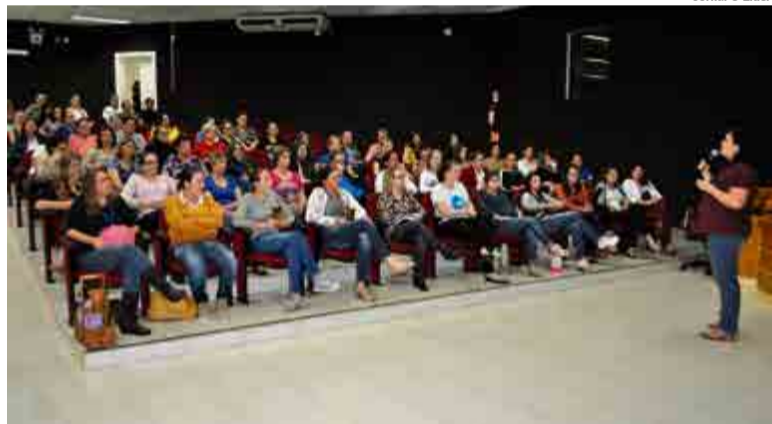
Capacitação foi promovida nesta semana na Câmara de Vereadores