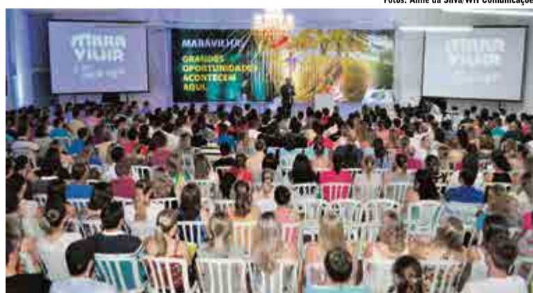
Evento lotou o Lar de Convivência