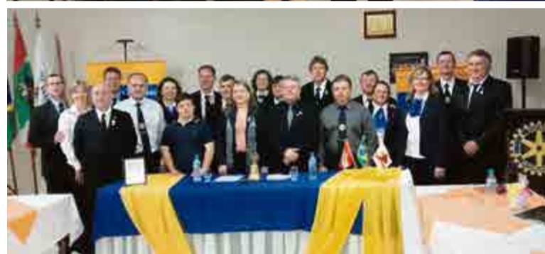
Governador do Distrito 4740 visitou Rotary maravilhense