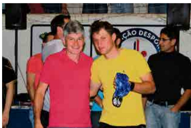
3º lugar interiorano: Sertão