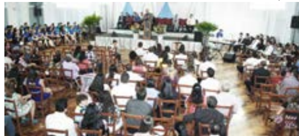
Encontro reuniu centenas de jovens no XXVII Congresso da UMADEM