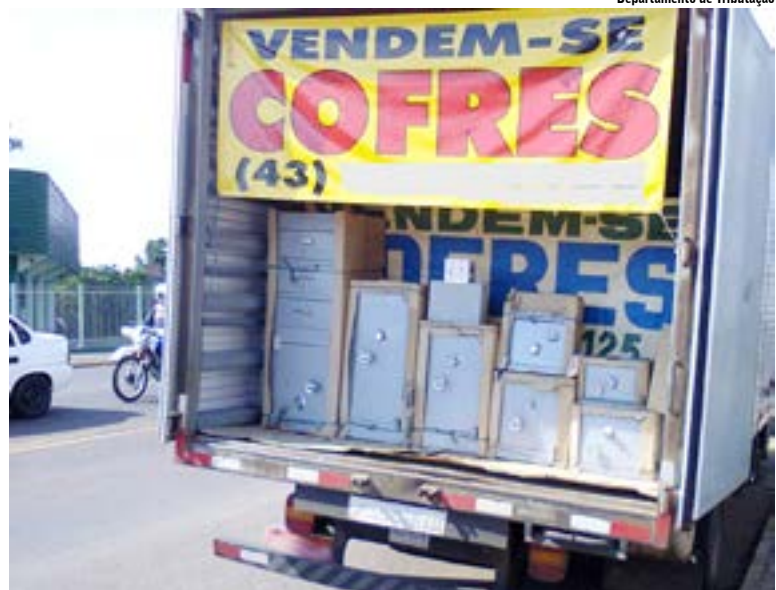
Conforme o departamento no caso dos vendedores de cofres, as vendas foram suspensas