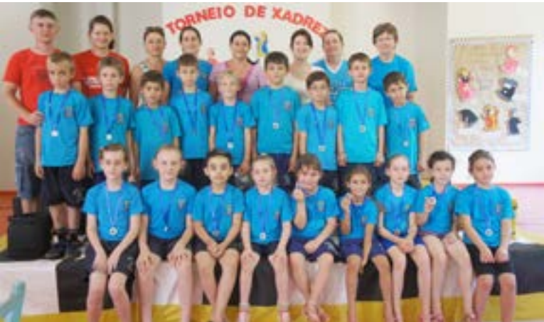
Alunos premiados do 1, 2 e 3º anos