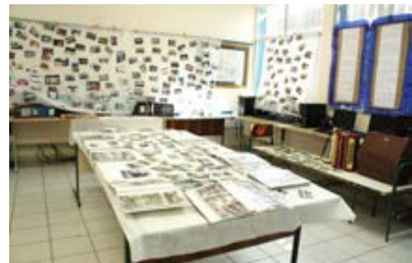
Para recordar, fotos do educandário, dos alunos e instrumentos antigos também foram expostos