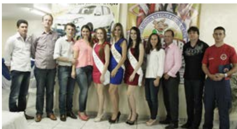
Autoridades reforçaram o convite para a festa que acontece nos dias 06, 07 e 08 de dezembro