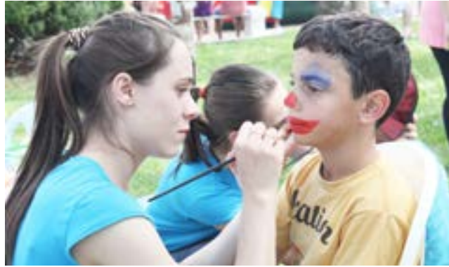
Pintura facial também foi uma das atrações