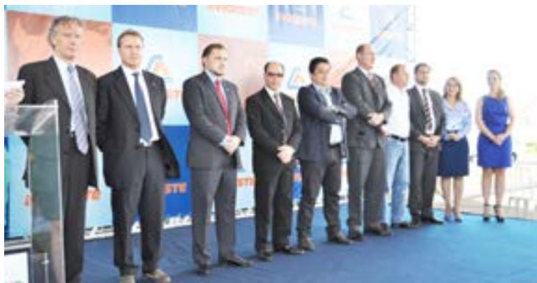
Presidente, diretor da América Latina, diretor executivo da empresa e autoridades políticas destacaram a importância da nova empresa

Maiores e mais modernas empresas da América Latina no segmento do agronegócio, é uma das principais fornecedoras de equipamentos do Brasil e atua com produtos para avicultura, suinocultura, pecuária leiteira, postura comercial e estrutura metálica