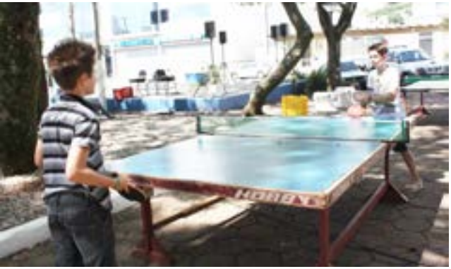
Quem esteve no evento também pode jogar tênis de mesa