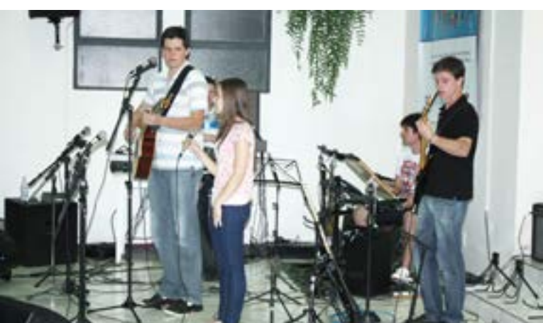
Grupo de louvor de Saudades prestigiou o evento