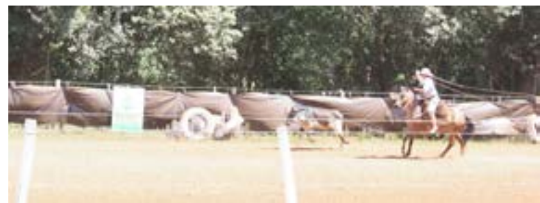
Provas de tiro de laço encantaram a todos