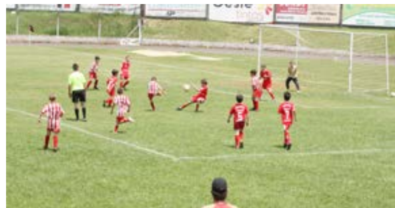
Jogos finais das categorias Subs 10, 12, 14 e 16 aconteceram na tarde do último sábado (09)