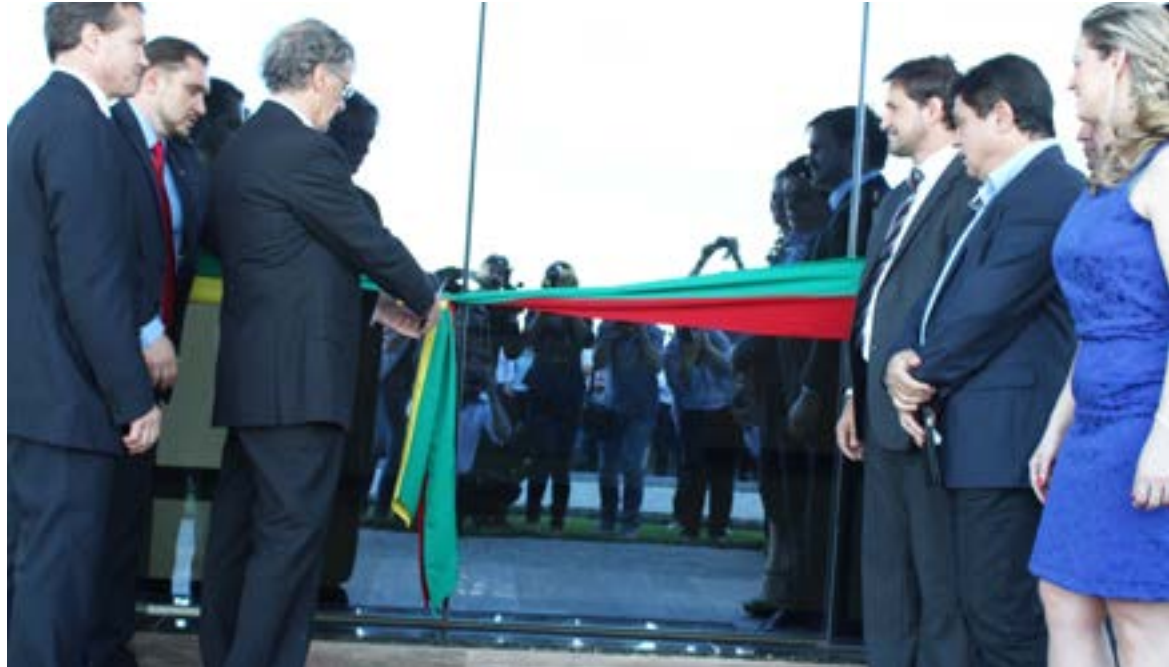
Corte da fita marcou a abertura e inauguração oficial da nova área fabril