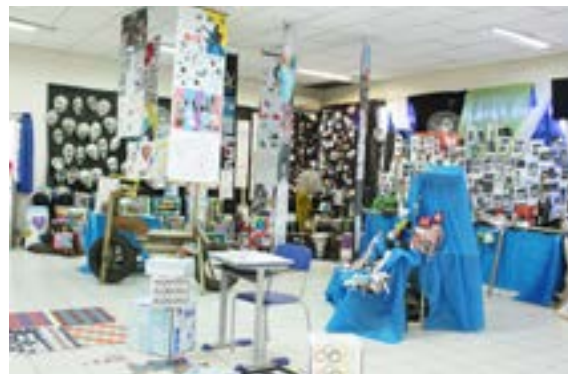
Trabalhos ficaram expostos em dois dias de feira