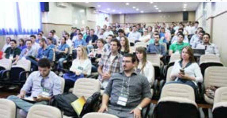
AGO aconteceu nos dias 07 e 08 em Xanxerê