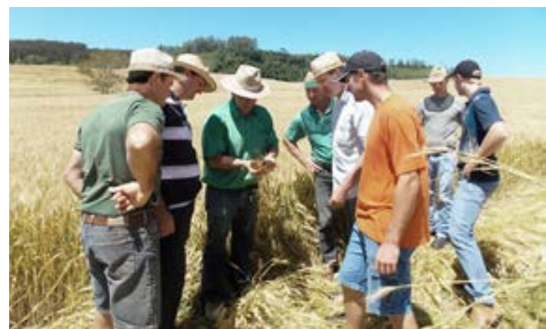
Ação do redutor de crescimento Moddus foi analisada