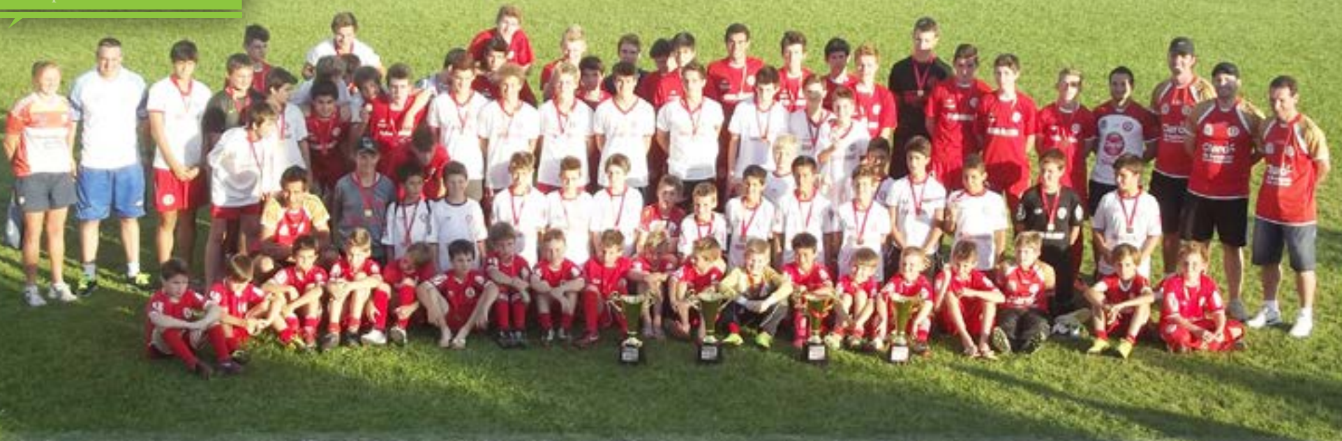
Equipes de Maravilha consagraram-se campeãs Catarinense de Genomas Colorados 2013

Os jogos finais do Campeonato Estadual aconteceram no sábado (09), no Estádio Dr. José Leal Filho, em Maravilha