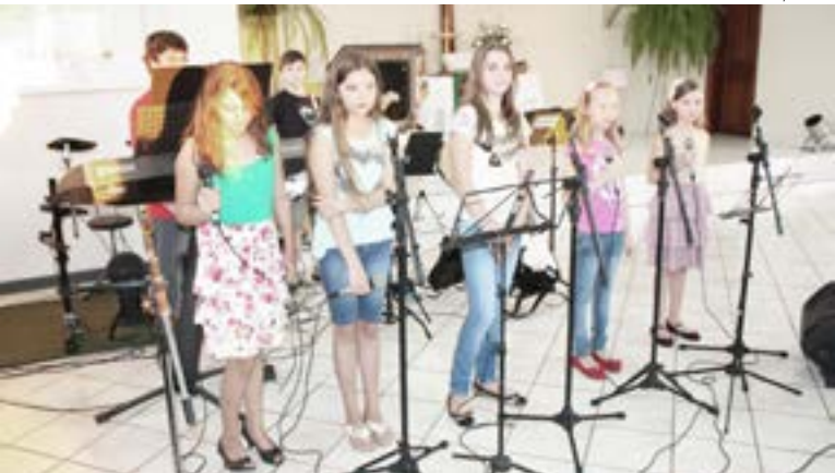
Aliança Ministério Infantil encantou a todos