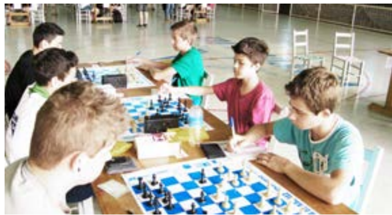
Enxadristas de Cunha Porã participaram pela primeira vez de um campeonato

Já os seus alunos conseguiram resultado razoável. "Aqui na região de Itá, o xadrez é muito mais forte