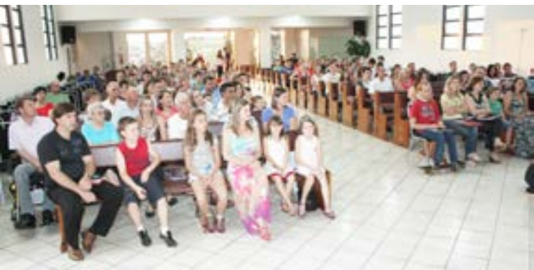
Grande público compareceu no Louvorzão