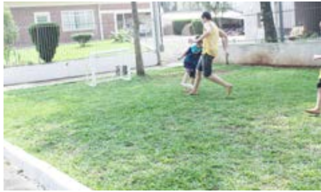
Rua do Lazer contou com atividades esportivas como futebol e voleibol