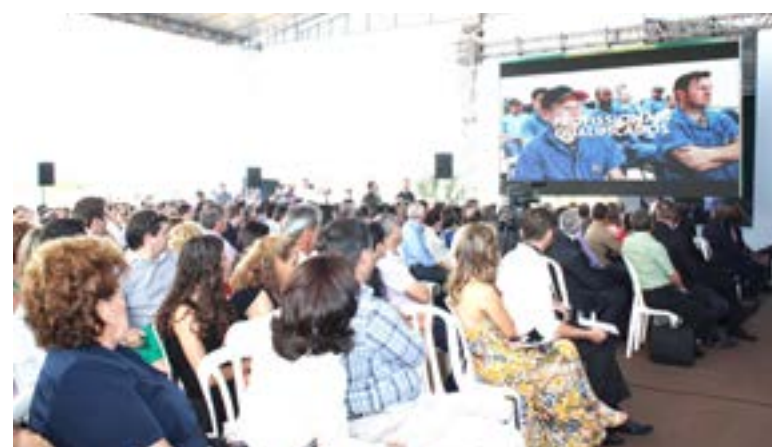
Vídeo institucional da empresa foi apresentado a todos os presentes

volvendo produtos de excelência, auxiliando a evolução rural e transformando tecnologia em resultado no produto final.