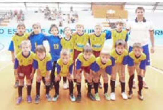
Categoria sub-8 enfrentará a Aduc de Chapecó