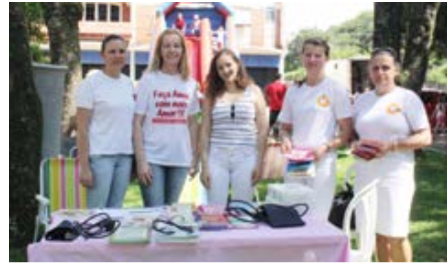
Secretaria de Saúde em parceria com o Iceu distribuiu panfletos e realizou aferição de pressão