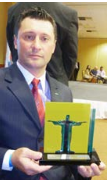
JCI Maravilha foi premiada com o título de Melhor Projeto 2012 dos Objetivos do Milênio com o projeto JCI Cultivando a Vida

"Durante o Congresso Mundial tivemos a oportunidade de participar de dois importantes grupos de estudos e cursos, com assuntos pertinentes da nossa organização. O primeiro deles foi o JCI Impact - que nos ensina a analisar os projetos, para que realmente estejam alinhados com os princípios