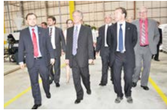
Após as alocações todos acompanharam as novas instalações da empresa