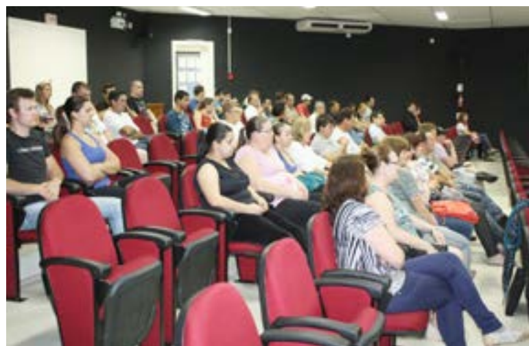
Alunos do Centro de Educação de Jovens e Adultos estiveram prestigiando os trabalhos dos vereadores