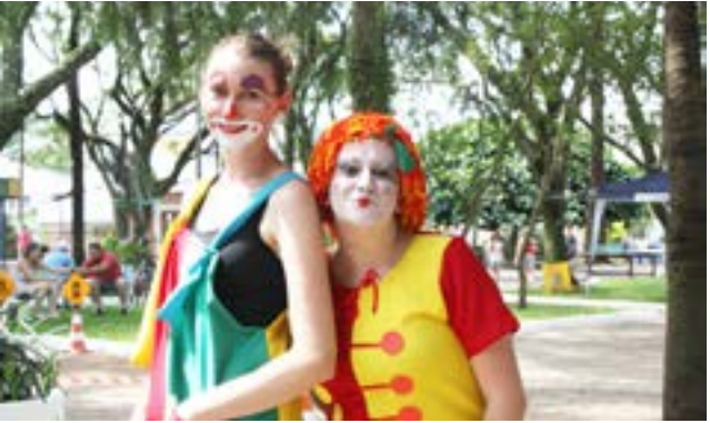
Palhaços e personagem Emília animaram as crianças