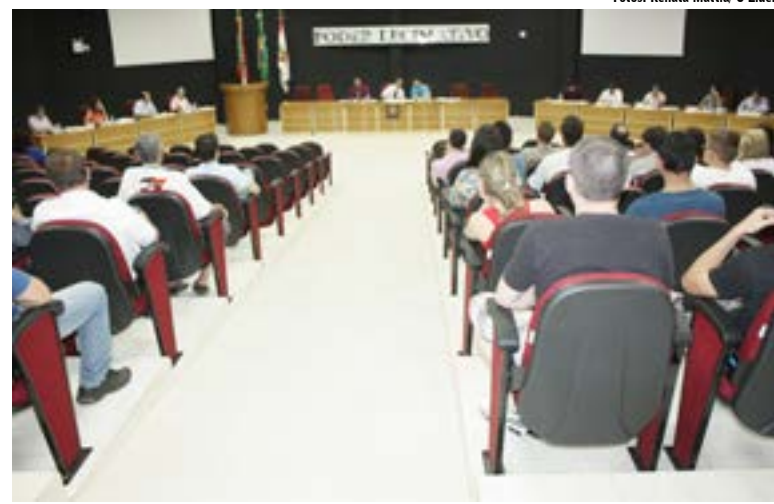
Plenário esteve lotado na quarta sessão do Legislativo

Projeto de Lei (PL) 065/2013 que dispõe sobre repasse financeiro para a CDL/ Associação Empresarial de Maravilha no valor de R$10 mil. Este valor será