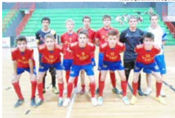
Categoria sub-14 enfrentará o São Carlos