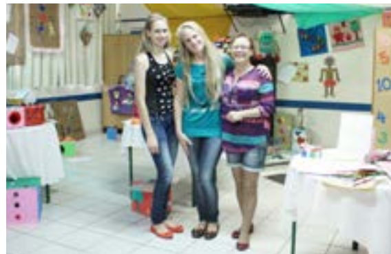
Turma do magistérios também apresentou seus trabalhos