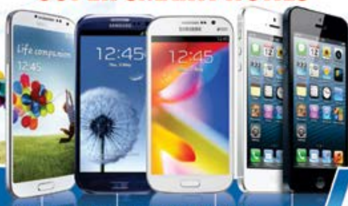
SAMSUNG GALAXY S4 SAMSUNG GALAXY SIII SAMSUNG GALAXY GRAN DUOS IPHONE 5