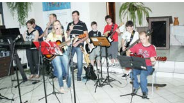
Louvres estiveram levando a palavra de Deus através das músicas