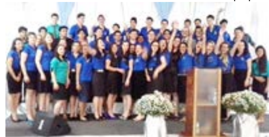
Jovens da UMADEM organizaram o evento que foi sucesso