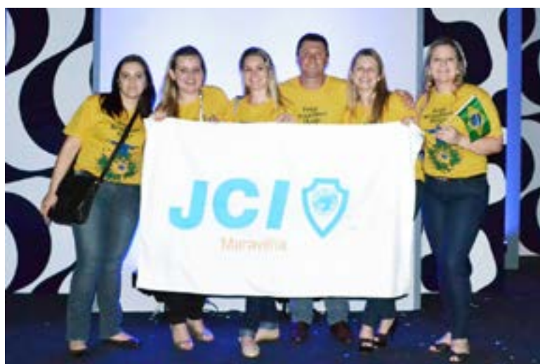
Maravilhenses na abertura do Congresso Mundial da JCI