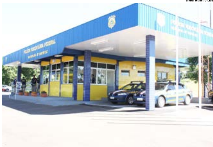
Isabel Müller/O LIDER

A turma da Polícia Rodoviária Federal (PRF) de Maravilha merecia. Um posto novinho, bonito, moderno. Aliás, pelo que vi, obedecendo ao padrão do que serão os novos postos da PRF. Inclusive, dá para ver que o mesmo padrão arquitetônico será utilizado no posto de Linha Caravaggio, em Guaraciaba. Para melhorar ainda mais, só falta abrir este posto de Guaraciaba, além do que melhorar mais o efetivo aqui na região. É uma força a mais para a turma de Maravilha, que tem 117 quilômetros de BR's para dar conta aqui no Oeste catarinense.