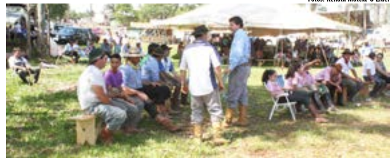
Mais de 60 equipes participaram do 4º Rodeio Crioulo Interestadual