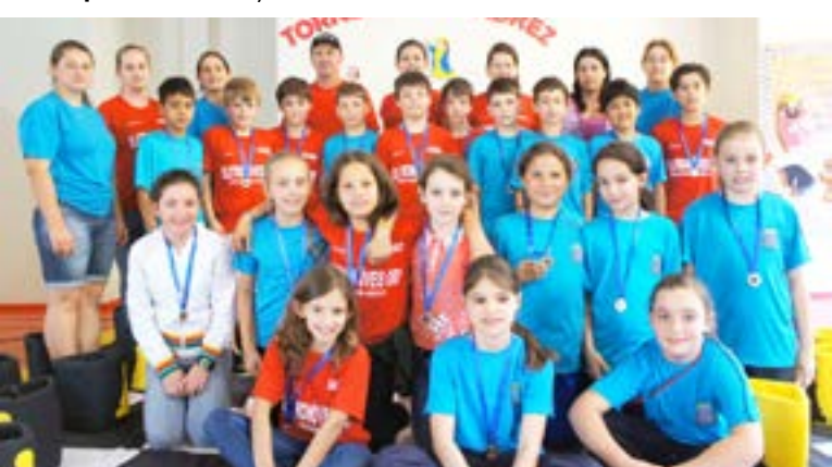
Alunos premiados do 4º e 5º anos