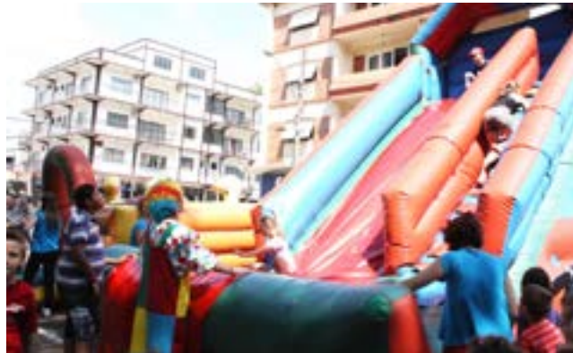
Brinquedos infláveis fizeram a diversão das crianças