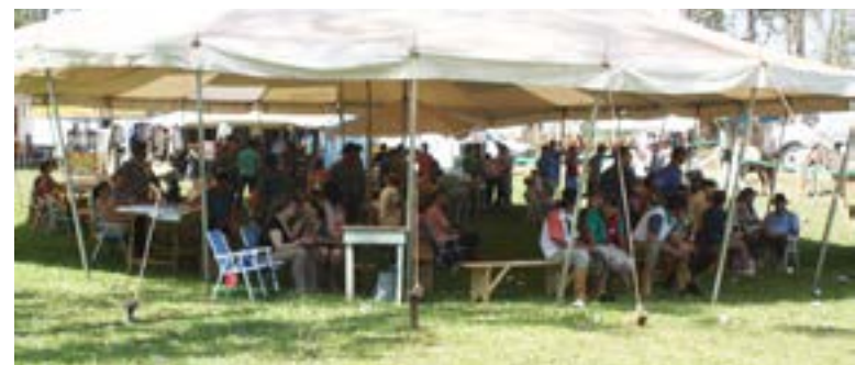
Almoço foi servido às dezenas de pessoas que prestigiaram o evento