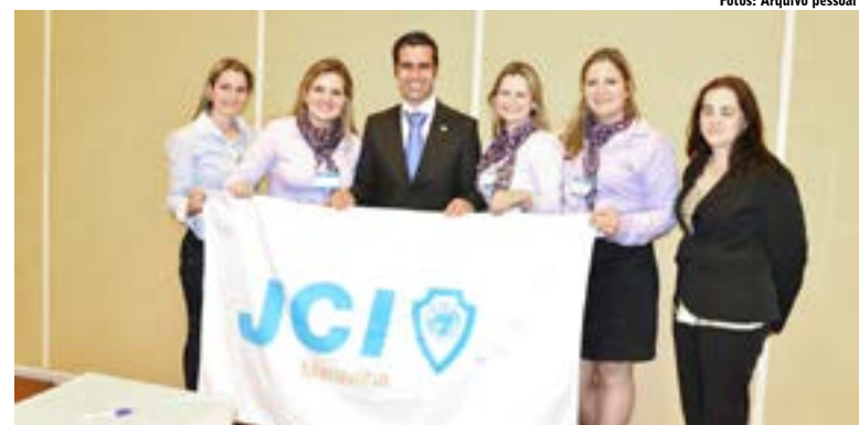
Maravilhenses com o presidente nacional da JCI Portugal

"Com certeza, a nossa participação do Congresso Mundial foi de grande va-