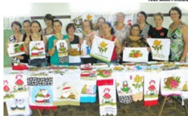
Grupo da Linha Humaitá