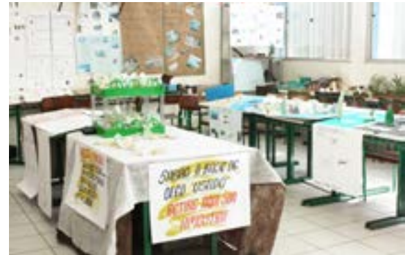
Alunos produziram e entregaram sabão aos visitantes