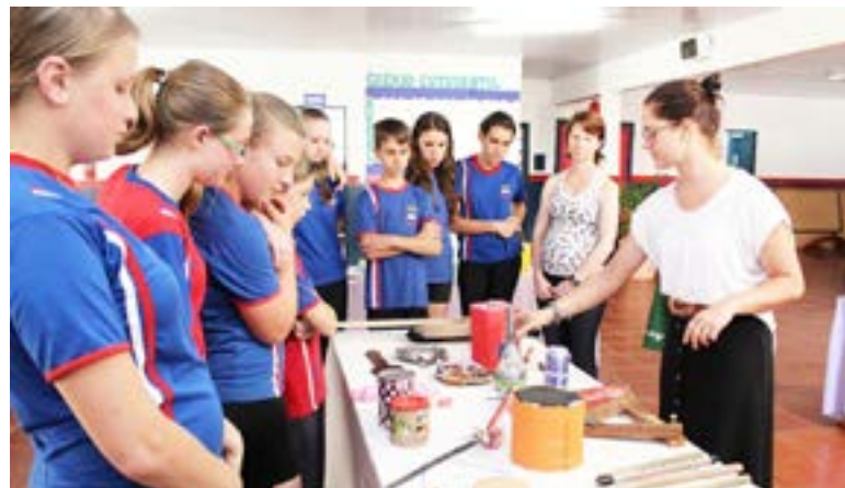
De acordo com a professora, há várias formas de se trabalhar a música na escola, por exemplo, de forma lúdica e coletiva, utilizando jogos, brincadeiras de roda e confecção de instrumentos

sicas de música, dos cantos cívicos nacionais e dos sons de instrumentos de orquestra, os alunos aprendam cantos,