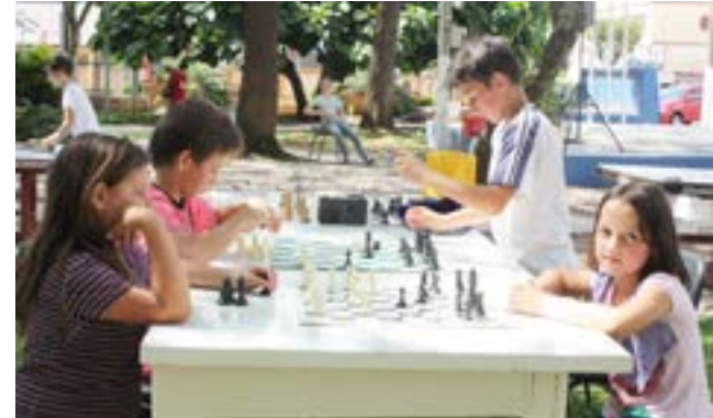
Tabuleiro de xadrez estavam à disposição das crianças