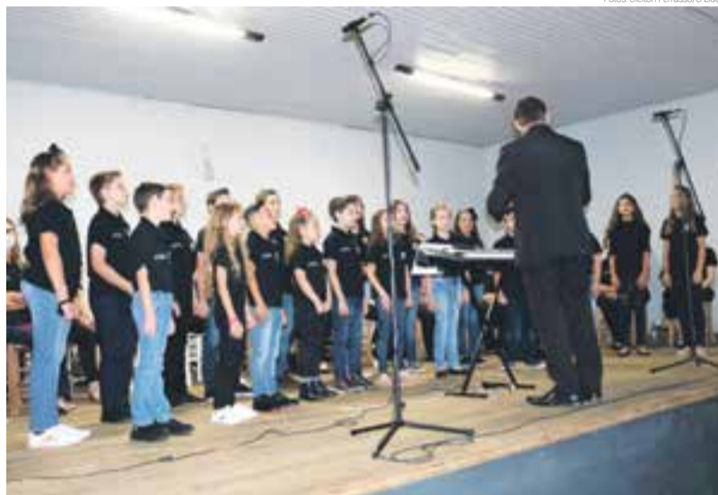
Coral encantou os fiéis