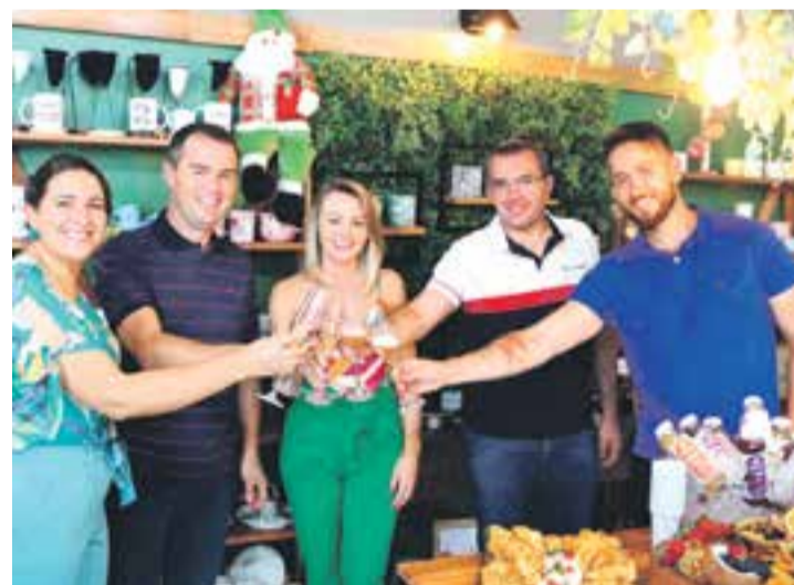
Brinde marcou dia especial de reinauguração com clientes e amigos