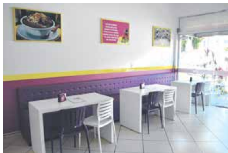
O atendimento de hoje (4) segue até às 20h