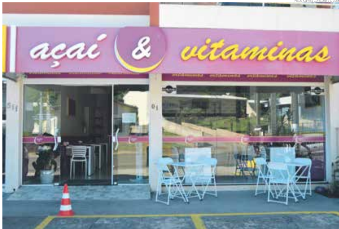
Açaí e Vitaminas iniciou os trabalhos no município em 2016