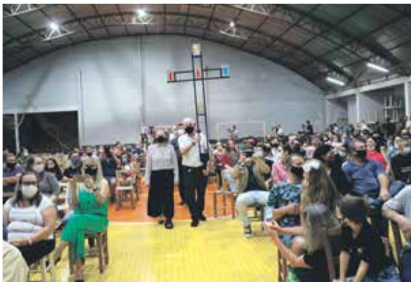
Cerimônia religiosa foi realizada no ginásio da comunidade

A Igreja Evangélica de Confissão Luterana no Brasil (IECLB) e o grupo de Casais Reencontristas realizaram a tradicional Caminhada das Lanternas na noite de domingo (28), em Maravilha. Inicialmente foi realizado um culto, por volta das 19h, no ginásio da comunidade com a participação do Coral Municipal e em seguida iniciou a caminhada. Com som automotivo em três carros, o grupo seguiu a pé segurando velas acesas até a Praça Padre José Bunse.