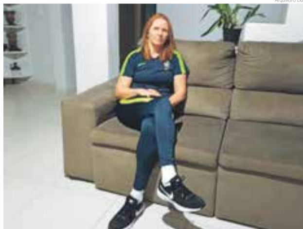
Maravilha vai entregar a premiação para os melhores do Campeonato Brasileiro

E neste ano em especial a cidade de Maravilha, de certa forma, estará presente. A