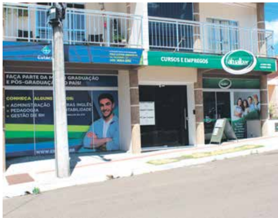
Polo atende em anexo à empresa Atualizar Cursos