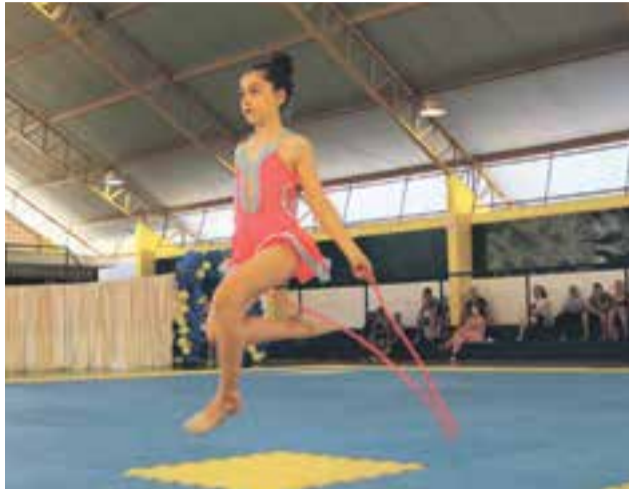
Ginastas fizeram manobras com equipamentos

zadores, foram premiadas as três melhores ginastas de cada aparelho e o individual geral.