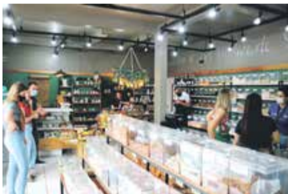
Com reinauguração, loja ampliou opções para itens fracionados