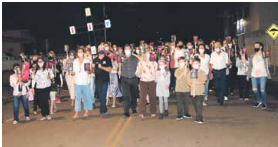
Fiéis caminharam com velas acesas