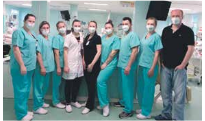
Equipe 1 de plantão diurno da UTI