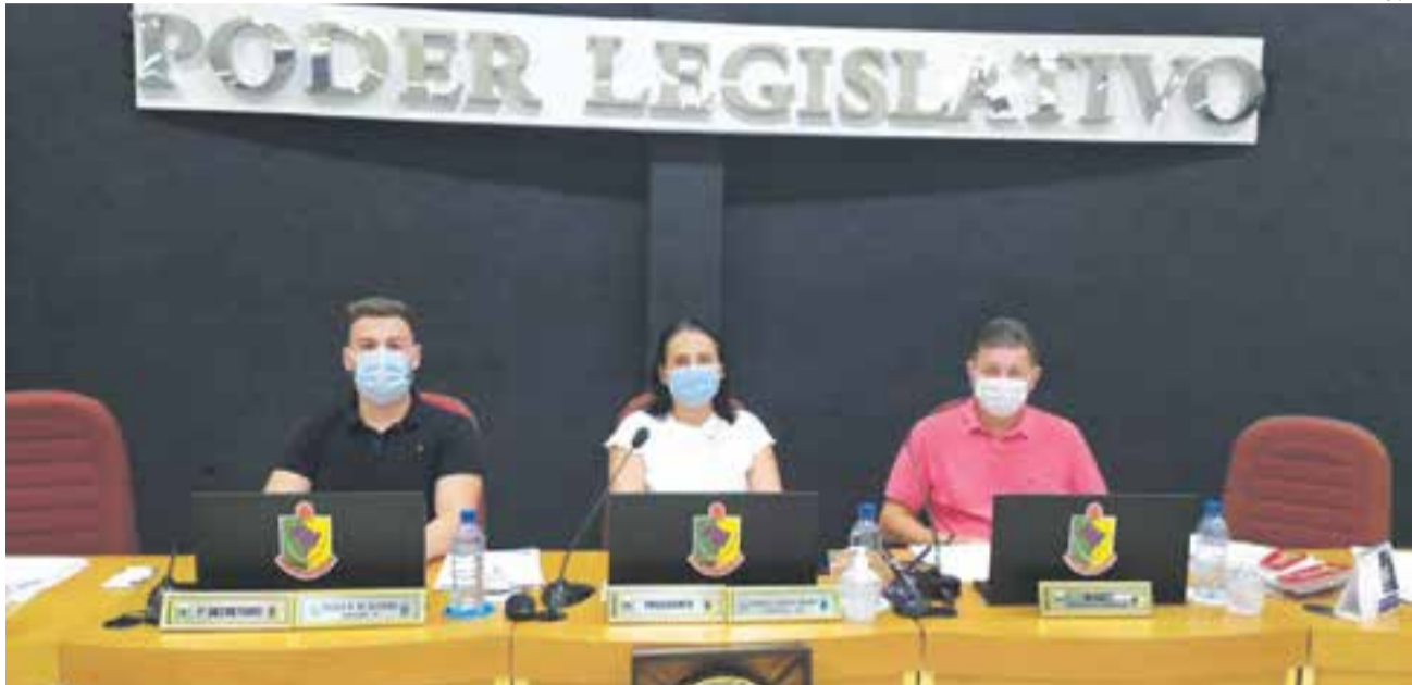
Esta foi a última sessão do mês de novembro

Um dos destaques foi a aprovação do PL 27/2021, que autoriza o Poder Executivo a conceder reposição anual aos servidores públicos e agentes políticos na ordem de 5,26%. Os salários com a recomposição começam a ser