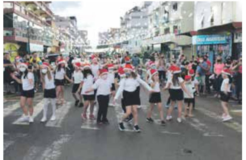
Apresentação da oficina de dança