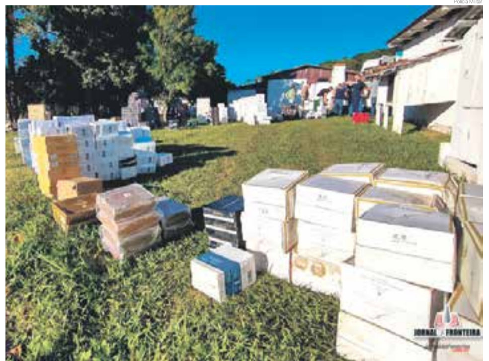
Galpão armazenava mais de 600 caixas do vinho contrabandeado

Dentro do barracão os policiais encontraram mais de 600 caixas de vinho totalizando mais de 3.300 garrafas, todos da Argentina e sem nota fiscal.