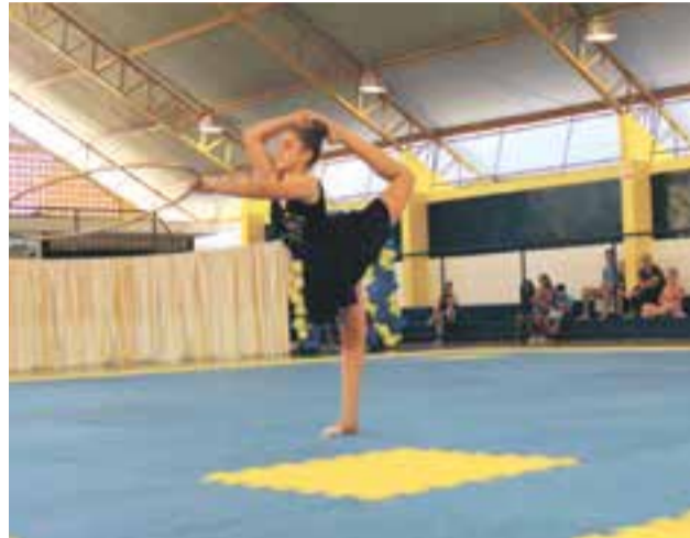
Dançarina demonstrou equilíbrio e técnica no festival