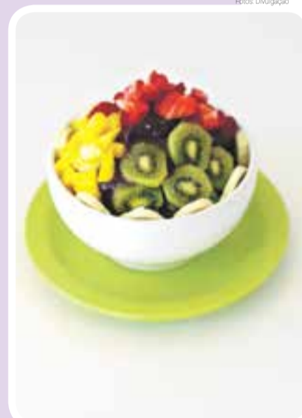
Estabelecimento também conta com opção de açaí na tigela