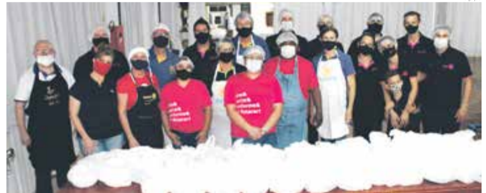
Evento gastronômico foi realizado no Lar de Convivência dos Idosos

os organizadores, foram servidas 337 marmitas. O valor arrecadado será usado para custear as ações realizadas pelo Clube na comunidade.