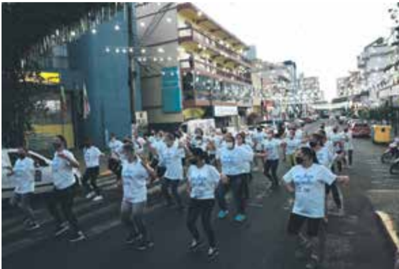
Apresentação da oficina de zumba