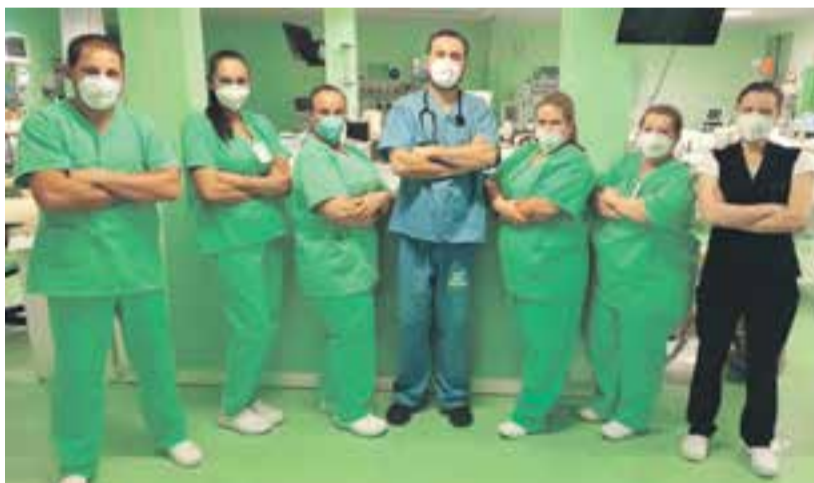
Equipe 1 de plantão noturno da UTI

Aproximadamente o mesmo valor é investido anualmente pelo hospital para manter a estrutura em funcionamento. "R$ 2 milhões para implantar a UTI foi a parte mais simples, mas R$ 2 milhões por ano para manter é doloroso, no sentido de recursos. Nós temos pacientes que passam com facilidade de um custo de R$ 3 mil por dia, sendo que o SUS não repassa para o hospital toda essa quantia. Então é um desafio diário, saúde é muito caro", afirma. O médico cita ainda os constantes investimentos em equipamentos que precisam ser substituídos, e agregação de novas tecnologias.