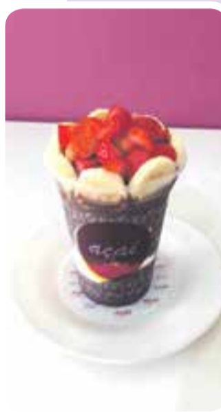
Açaí com frutas é um dos mais pedidos