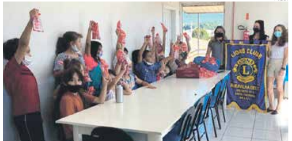
Entrega dos kits para o Serviço de Convivência

O Clube destinou 50 kits para o Hospital São José para atender pacientes e os outros 150 kits de higiene foram entre-