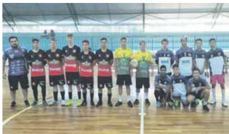
Previsão é de que a competição dura pelo menos duas semanas

A forma de disputa vai ser todos contra todos e os dois melhores fazem a final. Disputam o título Amigos do Tchemy, Bela Vista, Boleiros FC e Canarinhos Futsal. A primeira rodada foi de muitos gols. Amigos do Tchemy 3 x 0 Bela Vista e Boleiros FC 4 x 6 Canarinhos Futsal.