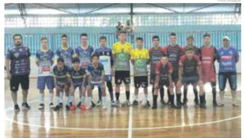
São quatro equipes participantes da competição interna