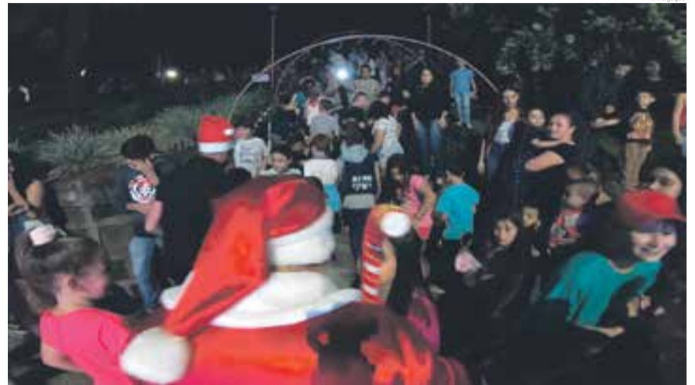
Crianças puderam tirar foto com o Papai Noel e também ganharam doces