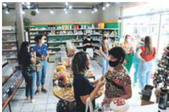
Convidados foram recepcionados com coquetel e muito carinho