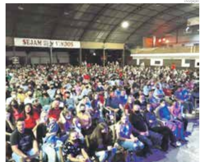
Público lotou o salão evangélico para assistir o show do Badin

Hoje (4), será realizado o show de patinação no ginásio municipal a partir das 19h30. E amanhã ocorre o desfile natalino a partir das 19 horas nas principais ruas e avenidas do município.