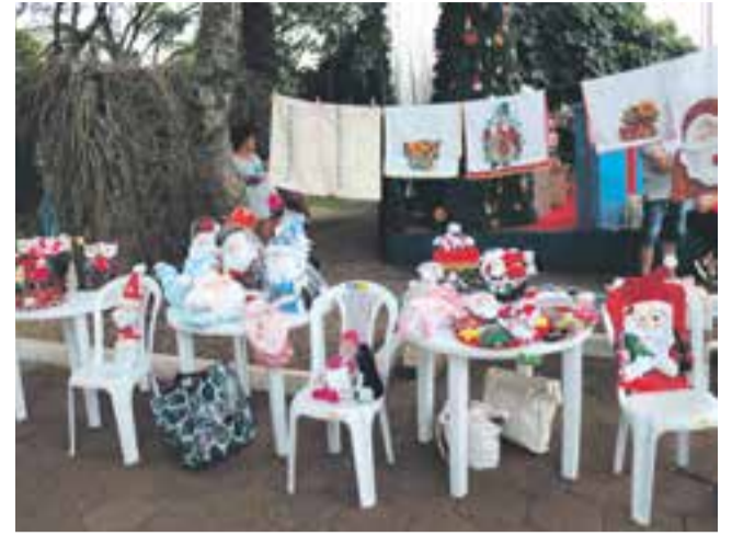
Exposição dos trabalhos de artesanato e pintura em tecido

apresentação da oficina de dança, também na área central da cidade.