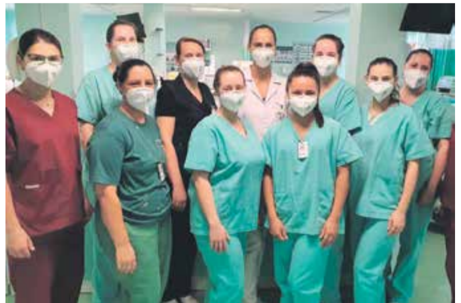
Segunda equipe de plantão diurno da UTI