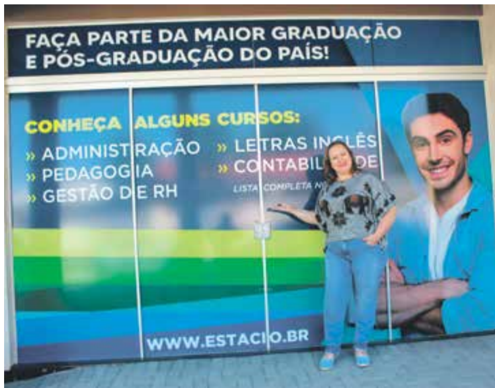
Inauguração ocorre quarta (8)