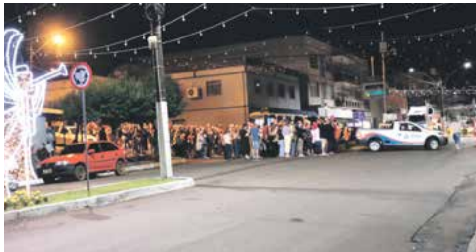
Grupo caminhou pelas ruas da cidade até a Praça Padre José Bunse