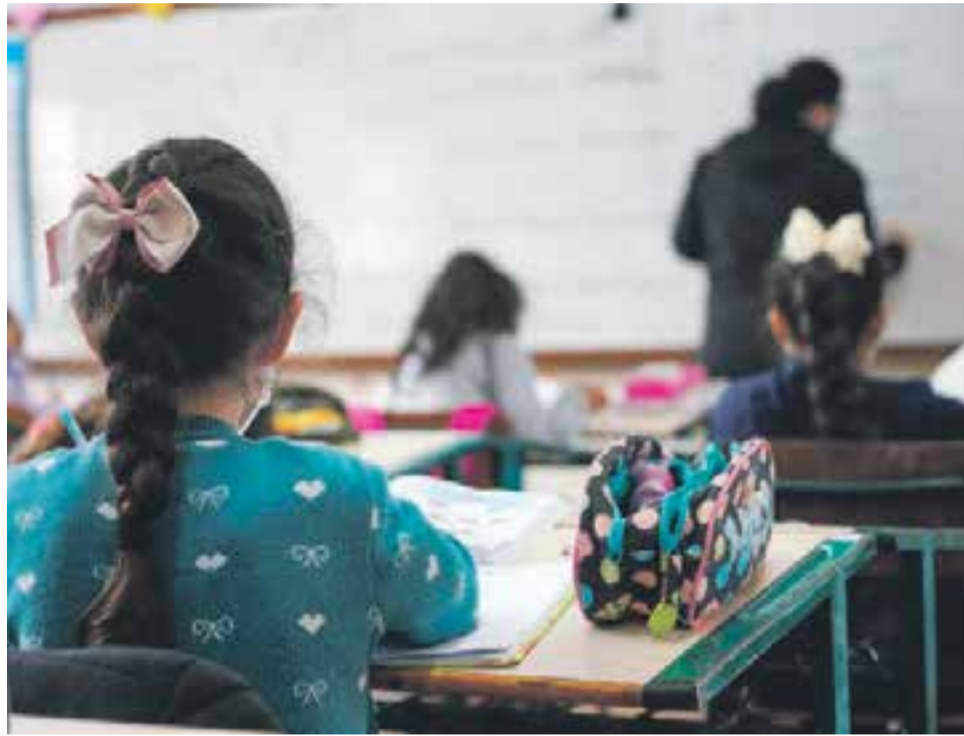
Com exceção das creches, alunos começam o ano letivo no dia 7 de fevereiro

As crianças que já estão inscritas, mas não constam na lista divulgada no site da prefeitura devem aguardar nova chamada. Conforme levantamento do município, cerca de 100 crianças ainda vão aguardar vaga para o berçário, 70 para o