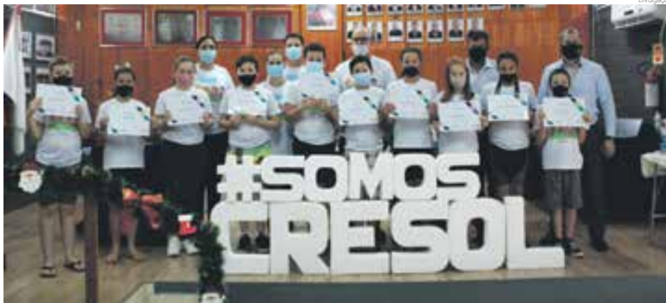
O ato ocorreu na Câmara de Vereadores e alunos receberam um certificado de participação