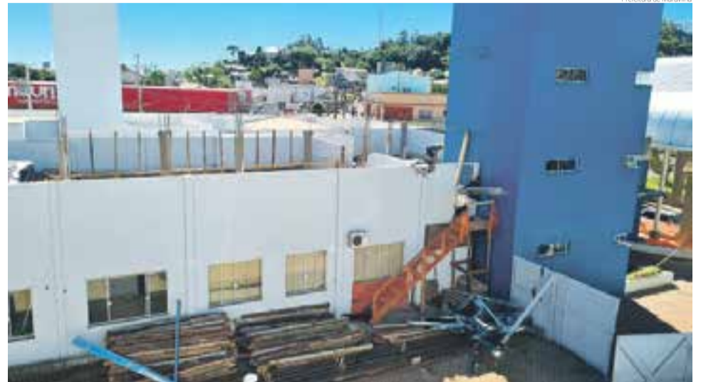
Segundo a secretária, segundo pavimento será finalizado e terceiro receberá telhado

Já os serviços de ortopedia, fonoaudiologia, infectologia e o setor administrativo atende-