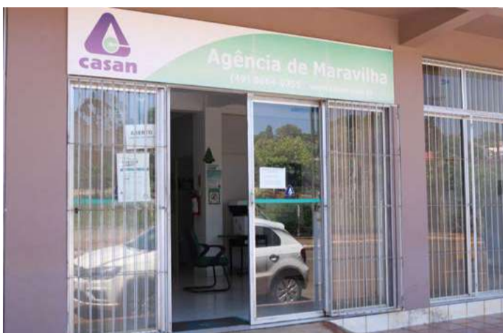
Casan terá atendimento normal durante as festividades