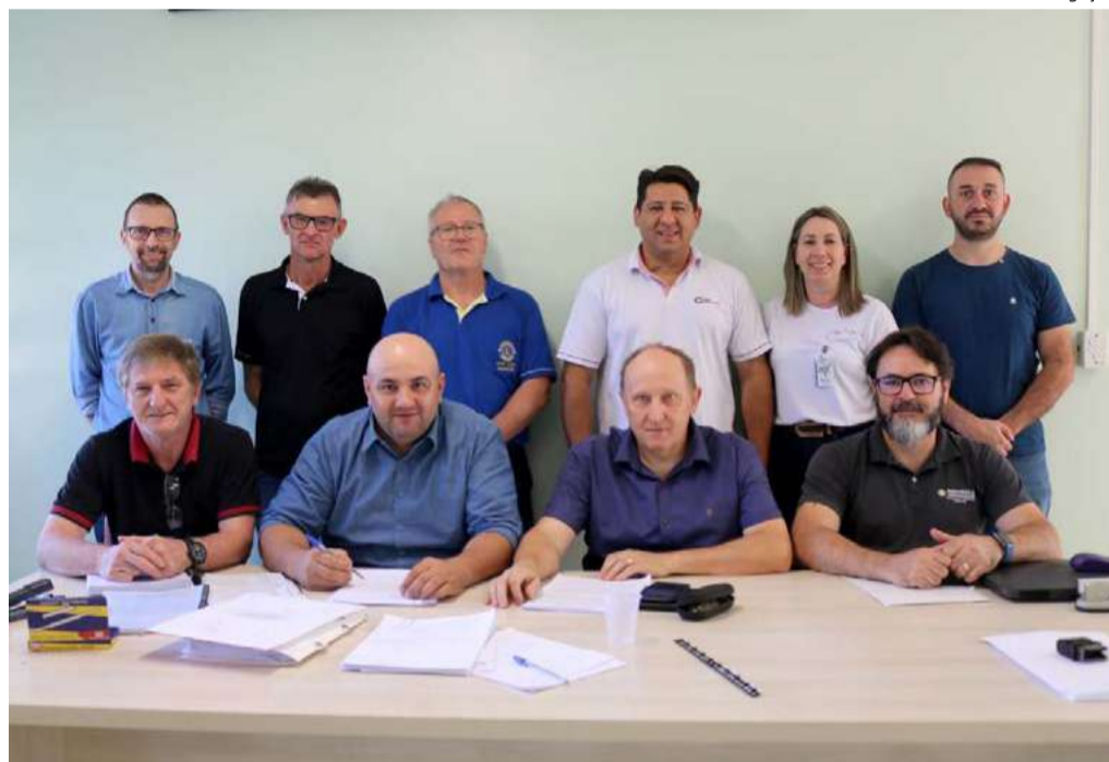
Primeira etapa foi licitada nesta semana