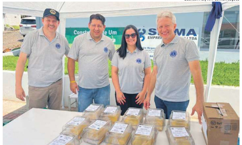
Entrega dos combos foi feita em frente à sede