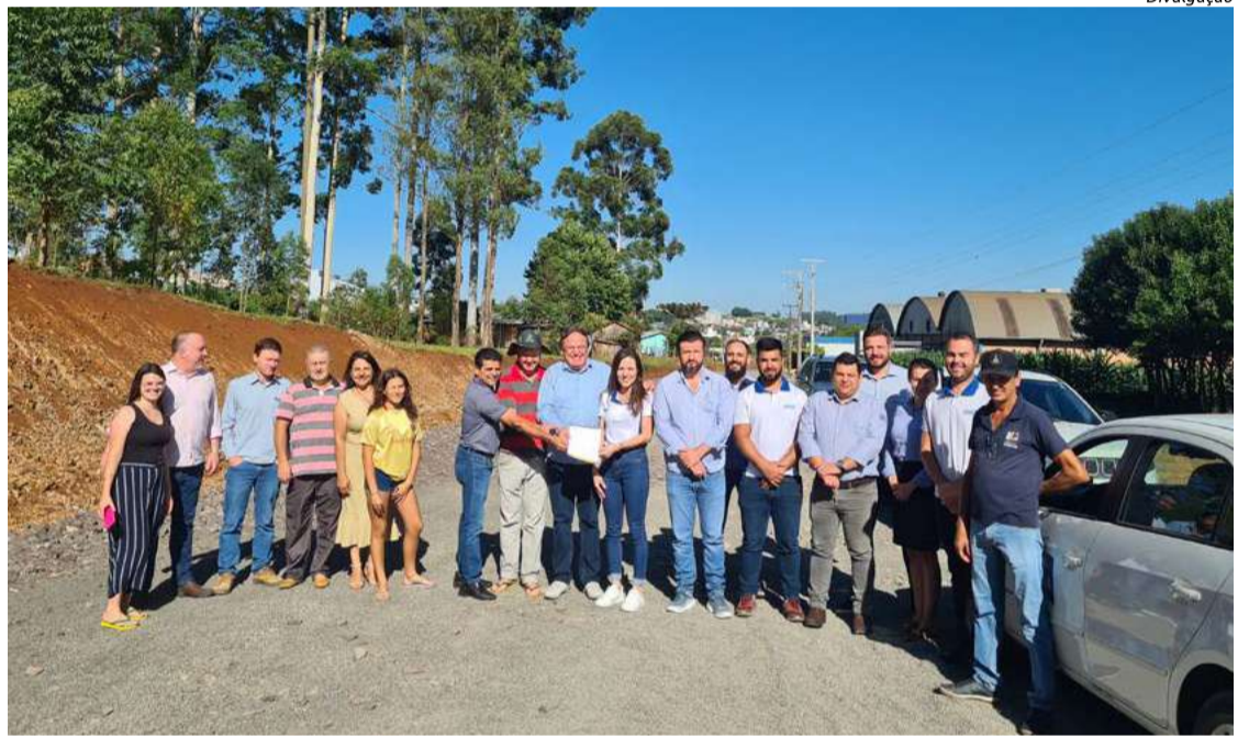
Ato contou com a participação de lideranças e moradores