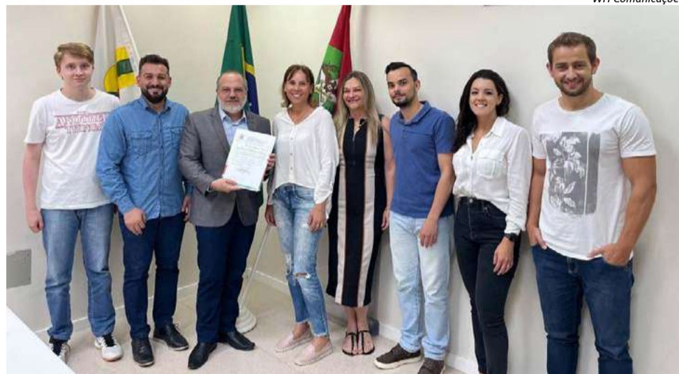
Projeto foi apresentado pelo presidente da Câmara de Vereadores