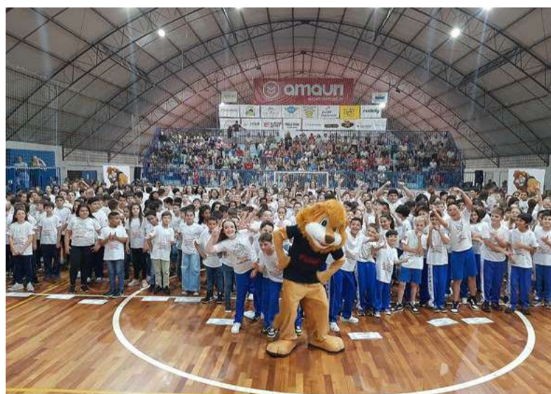
Mascote do Proerd animou as crianças

Na ocasião, 361 alunos do 5º ano se formaram. O programa tem por objetivo capacitar os estudantes com informações e habilidades necessárias para viver de maneira saudável, sem drogas e violência.