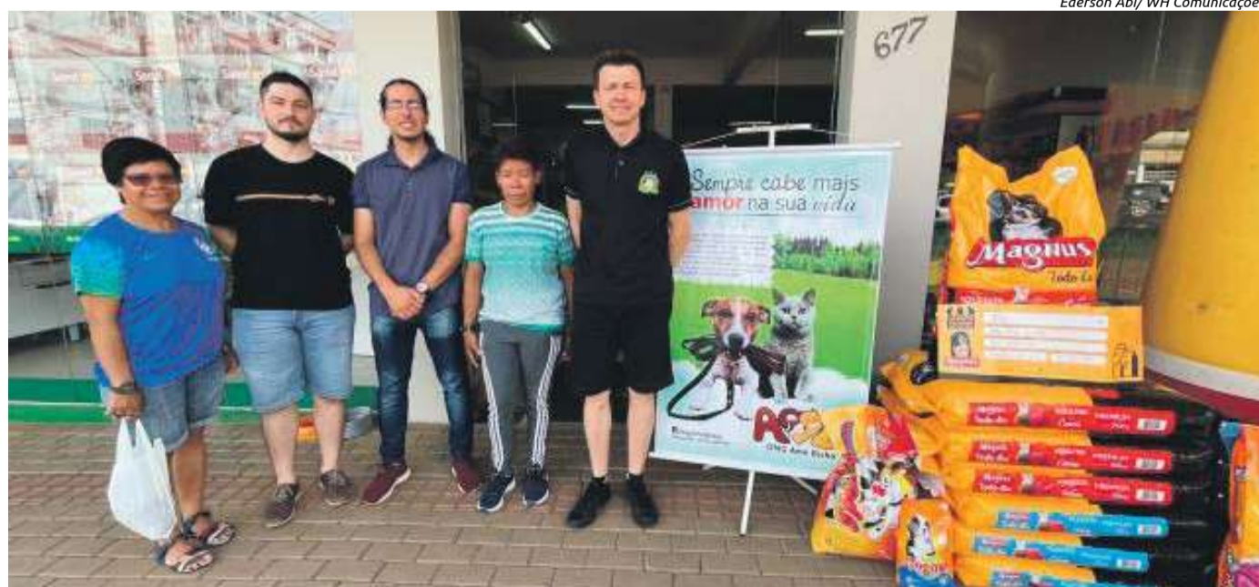
Entrega ocorreu no último dia 10

As rações foram arrecadadas na loja após a campanha Lojista Solitário. De acordo com o proprietário da Pet Maravilha, Edinásio Muller, a ação foi um sucesso e as doações ainda podem ser realizadas.