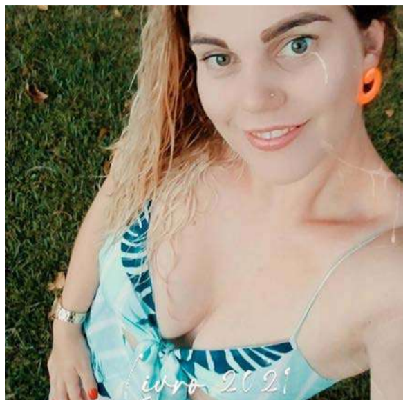
Liege, parabéns pelos seu aniversário, votos de felicidades sempre, que você continue sendo essa pessoa maravilhosa e querida. Homenagem de toda a sua família!