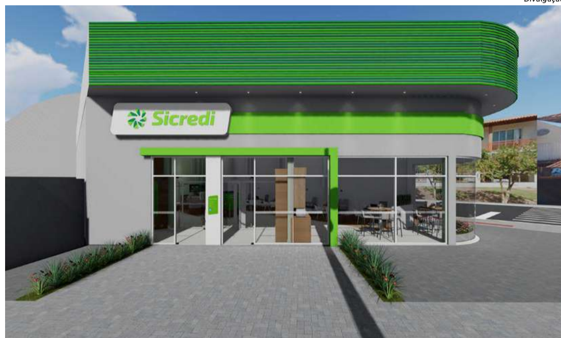
Estrutura fica localizada na Avenida Maravilha