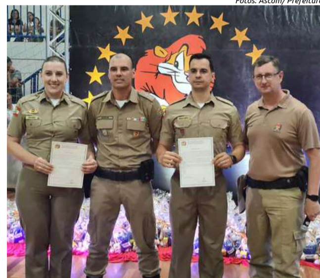
Reconhecimento aos policiais