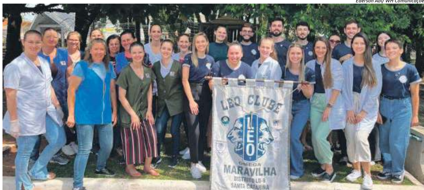
Campanha foi desenvolvida na Praça Padre José Bunse

O objetivo da ação foi conscientizar e divulgar a possibilidade de fazer os testes, que podem ser encontrados durante o ano todo nas unidades básicas de saúde. A campanha preventiva também contou com outras atividades, entre elas avaliação nutricional.