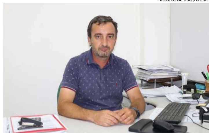
Tonello destaca a importância de haver o consumo consciente durante todo o ano