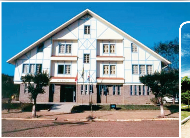
Município preserva a cultura dos prédios