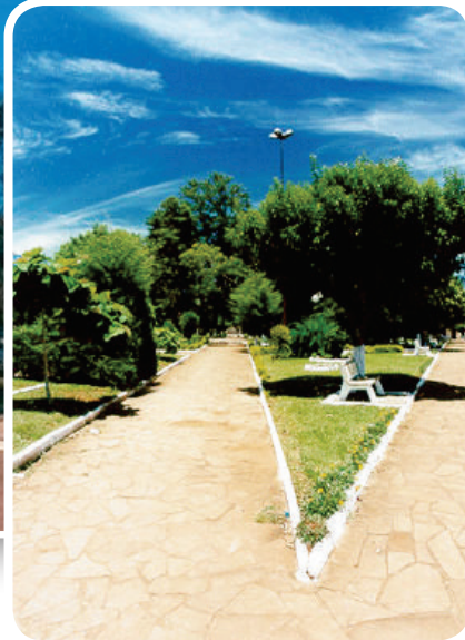
Locais para lazer são vistos no município