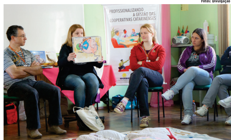
Diversas ferramentas foram utilizadas para ministrar o curso

Um novo parque infantil foi instalado na última semana pela Secretaria de Educação, Cultura, Esporte e Lazer. O objetivo é possibilitar um espaço adequado para os alunos da Rede Municipal de Educação desenvolverem ações de lazer e dinâmicas.