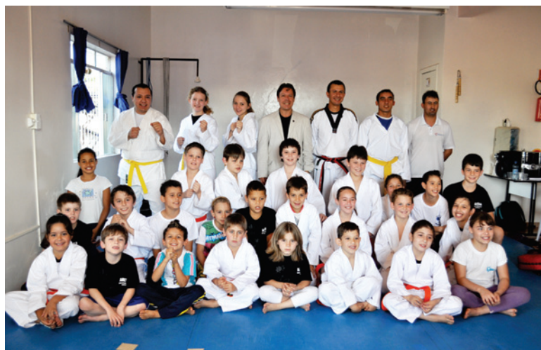
A escola conta com aproximadamente 100 alunos

O Projeto Criança no Tãtame desenvolvido pela Escola de Artes Marciais Arena de Maravilha, graduou no sábado (11) uma nova turma, além de realizar o exame de troca de faixa. O examinador foi o mestre 6º DAN