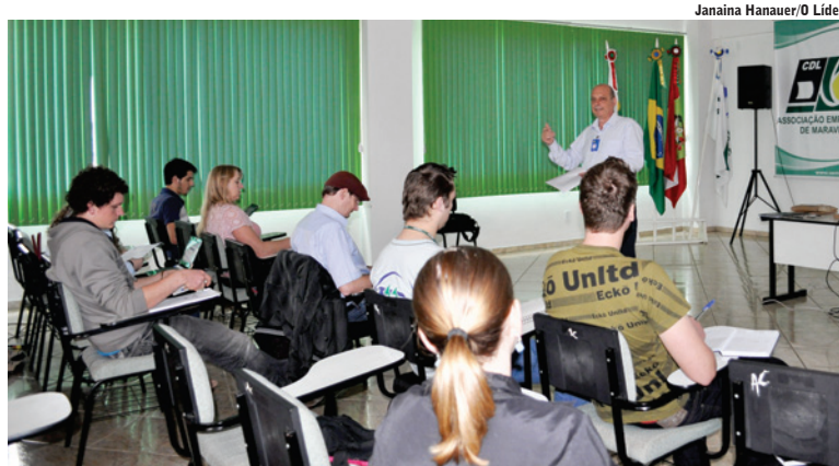
Janaina Hanauer/O Líder

O CFC é um programa que o BB está implantando para fazer todas as ações de custeio e investimento, principalmente sobre as últimas alterações. “É um treinamento para operacionalização de aplicativos que vão possibilitar o acolhimento de propos-