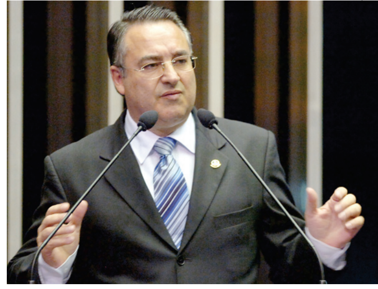
Governador de SC, Raimundo Colombo

A terceira lei sancionada (15.881/12) se refere à autorização para renegociação do resíduo da dívida do Estado com a União no valor de R$ 1,58 bilhão. Com a operação autorizada, o desembolso mensal com o pagamento da dívida cairá de 13% para 8% e os juros serão reduzidos de 13,32% (IGP-DI + 6% ao ano) para aproximadamente 4,5% ao ano. "Com essa modificação vantajosa para o Estado, teríamos condições de investir mais de R$ 1 bilhão em aproximadamente três anos", ressalta o secretário Serpa.