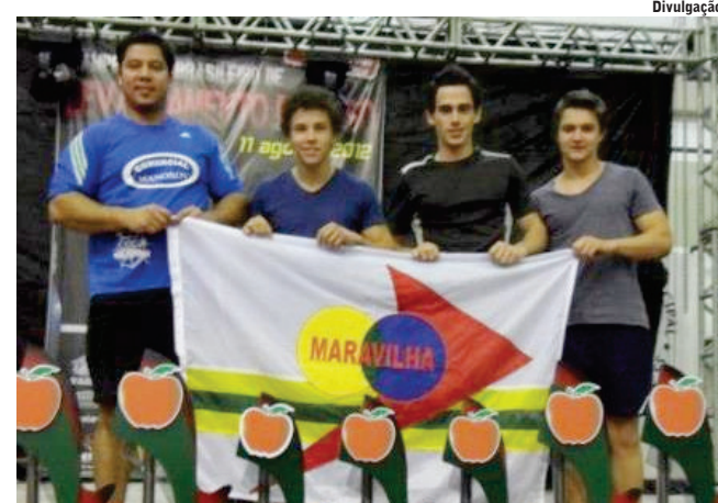
Equipe maravilhense foi destaque na competição

A próxima competição dos atletas será o Sul Americano, que vai ser realizado no dia 22 de setembro, na cidade de Três Coroas/RS.