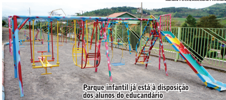
Parque infantil já está à disposição dos alunos do educandário