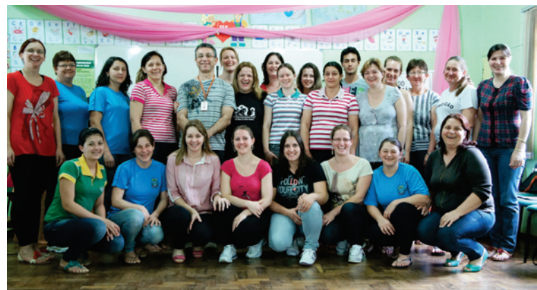
Cerca de 30 pessoas puderam ampliar seus conhecimentos participando do curso