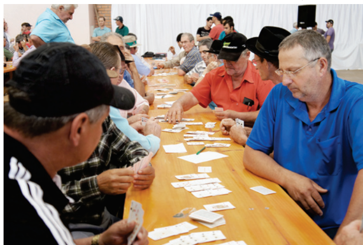
Truco, três sets e canastra foram as modalidades disputadas durante o dia