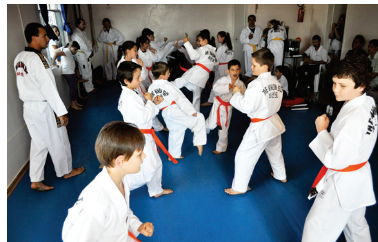
Um dos testes foi a luta e técnicas de defesa