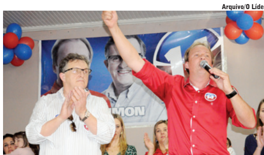
Coligação está se movimentando em Maravilha

Na segunda-feira (13), as visitas tiveram