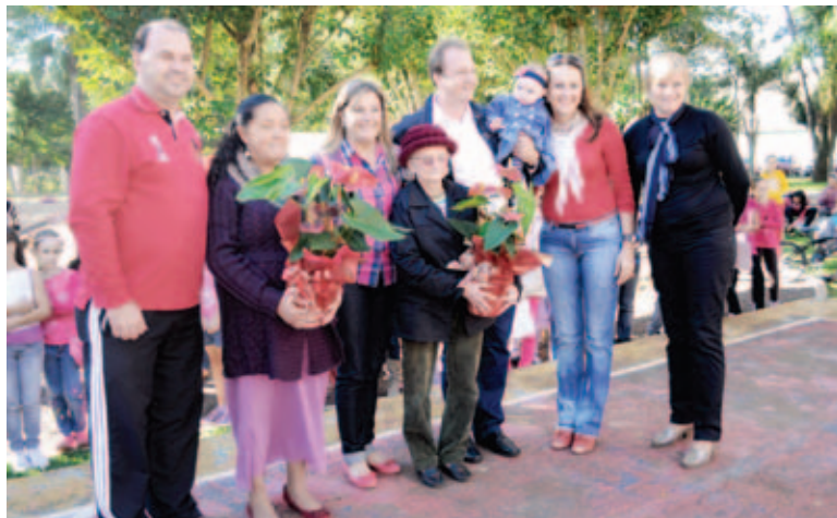
Mãe com 15 filhos e a mãe mais velha presente de 82 anos receberam homenagem especial