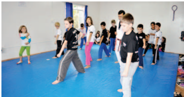
A escola conta com aproximadamente 100 alunos

Anchieta, nº 140, próximo ao Nep, contatos escola_arena@hotmail.com ou pelo número 8815-9626.