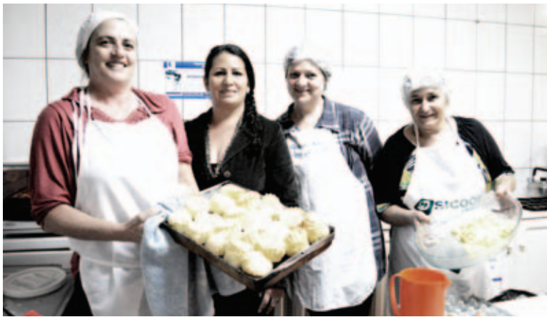
Equipe do Deonubem produziu o cardápio