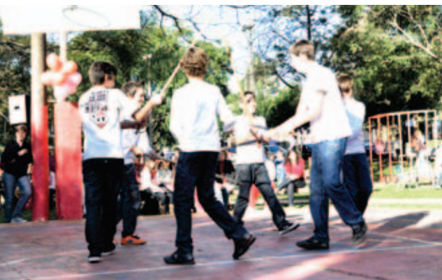
Grupo Italiano Pertuti apresentou várias danças