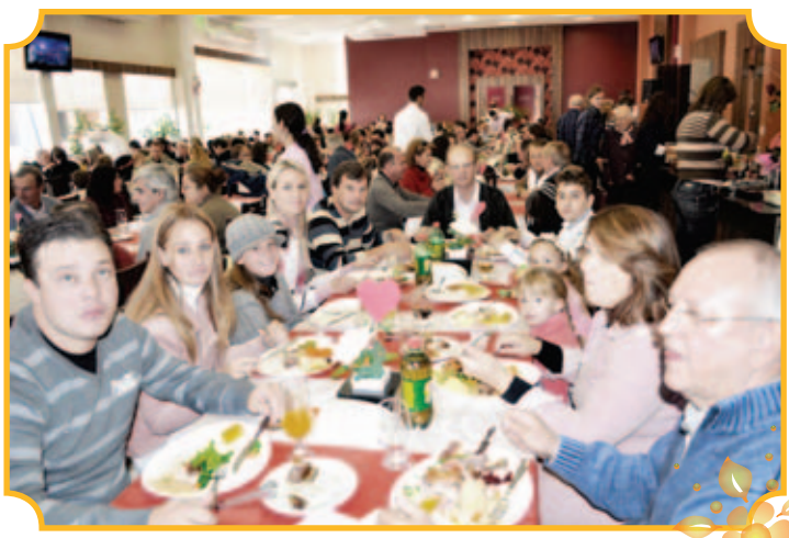
Famílias comemoraram o Dia das Mães