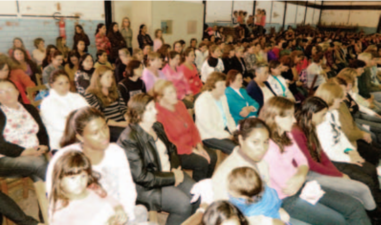
Mães do município foram homenageadas