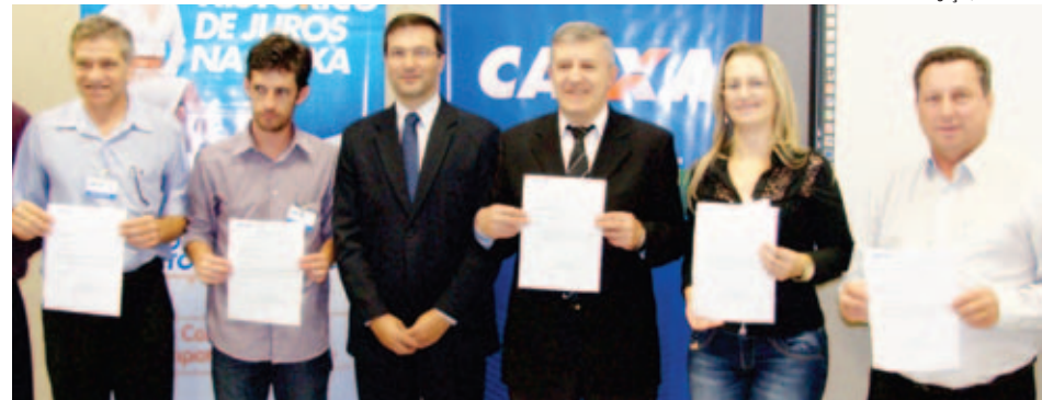
Caixa Econômica abrirá cinco novas agências na região Oeste