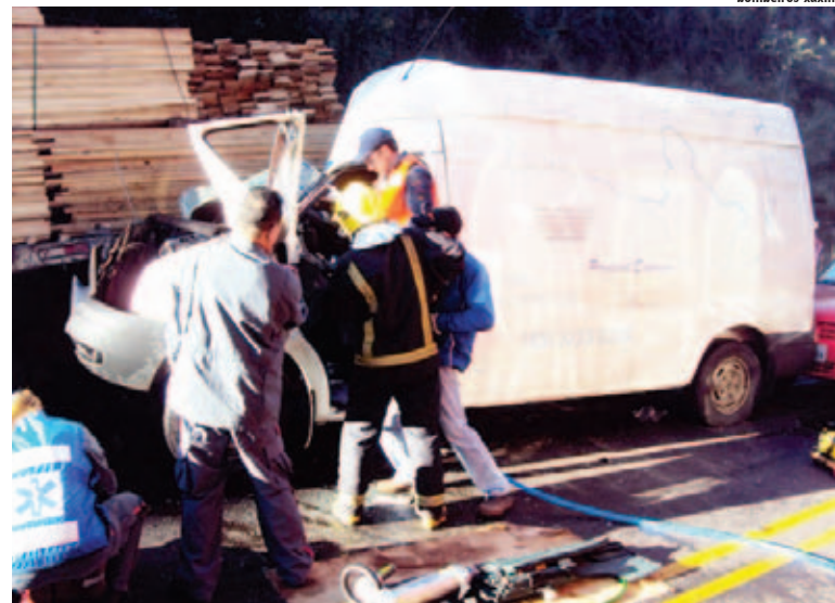
Condutor da van ficou preso nas ferragens e foi socorrido pelos Bombeiros

O motorista do caminhão placas de Caibi/SC e o condutor do gol, placas de Chapecó/SC, que colidiu atrás da van, saíram ilesos.