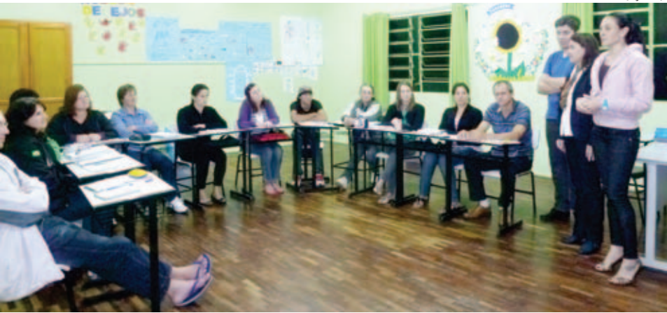
São Miguel da Boa Vista recebeu visita do Ceja