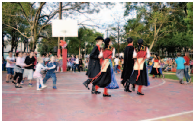
Grupo de danças alemãs trouxe a sua turma recém formada para a realizar a primeira apresentação