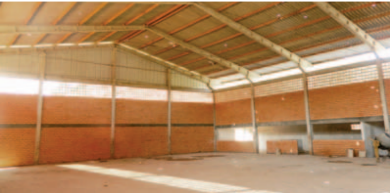
Ginásio deve ser concluído em breve