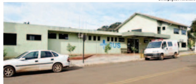
Unidade Básica de Saúde passará por reformas