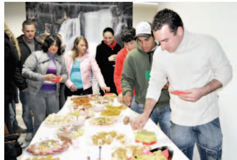
Após a sessão, coquetel com produtos Aurora foi servido