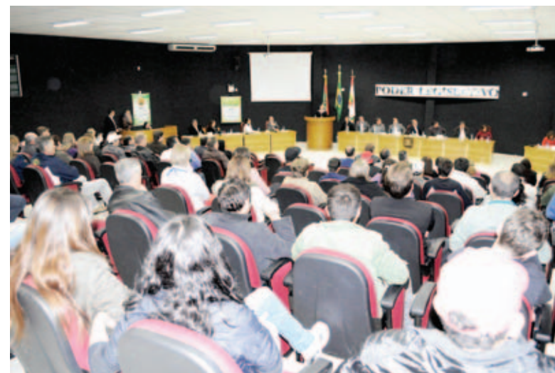
População prestigiou sessão

a fiscalização bem como o cumprimento da Lei Municipal nº 2.389/98, que dispõe sobre o tempo mínimo para o atendimento do cliente às agências bancárias de Maravilha.