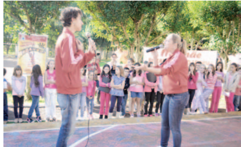
Mãe e filho iniciaram as apresentações cantando músicas que falam das mães