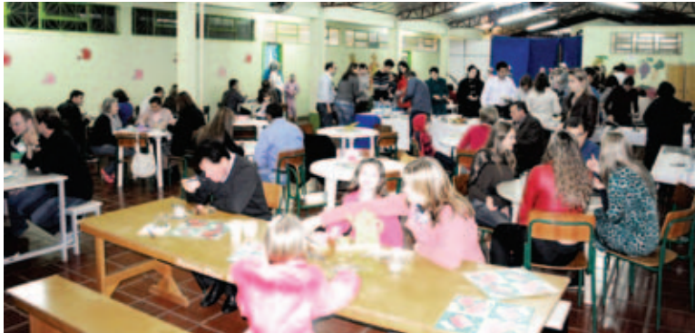
Muitas pessoas prestigiaram o tradicional Café Colonial

A Associação de Pais e Professores (APP), Clube de Mães, professores e direção agradecem a presença de todos no Café Colonial. "O brilho no evento se deve a participação e empenho das pessoas que acreditam que com o trabalho em equipe as coisas acontecem", ressalta a direção.