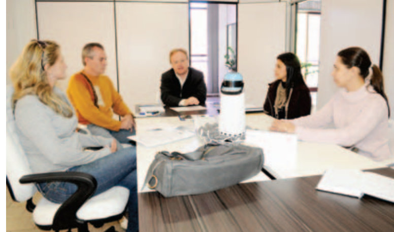
Reunião enalteceu a importância do projeto para as empresas