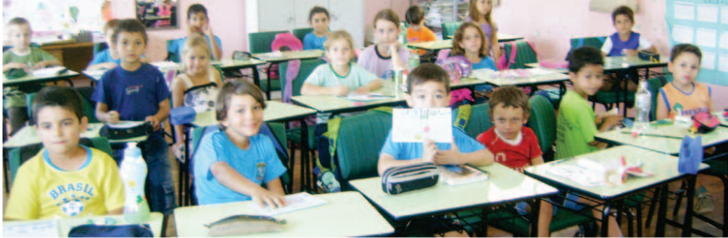
Duas salas de aula contam com carteiras e cadeiras estofadas