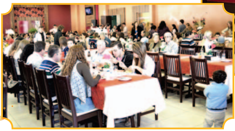
Grande presença do público na comemoração do Dia das Mães