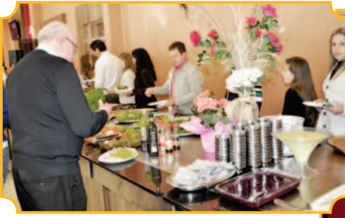
Buffet com muitas variedades saborosas