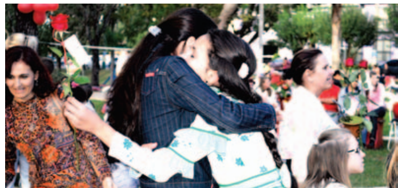
Mães foram homenageadas com rosas