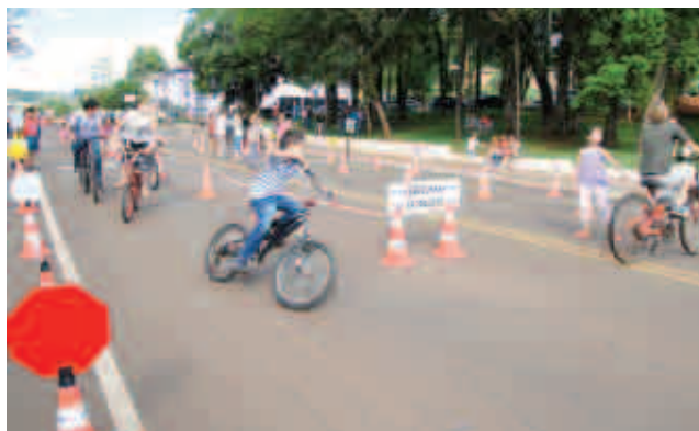
5º Passeio Ciclístico também teve a participação de várias crianças