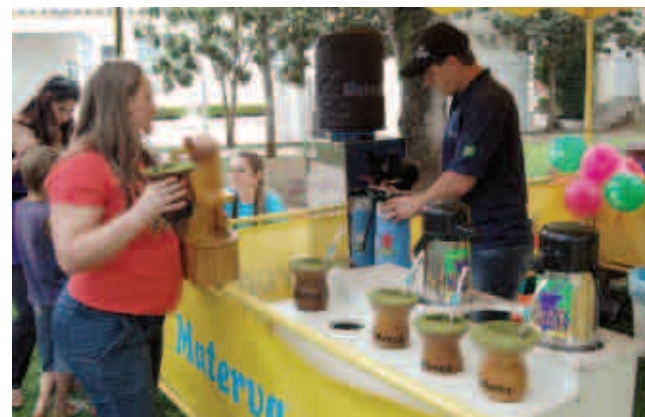
Tarde também teve mateada