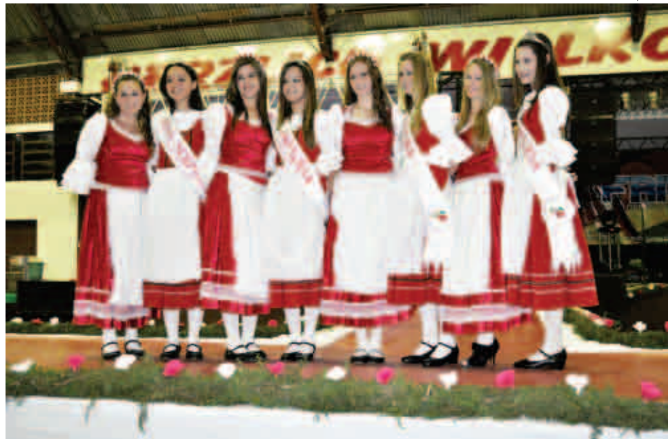
Candidatas concorreram ao título e quatro delas foram escolhidas