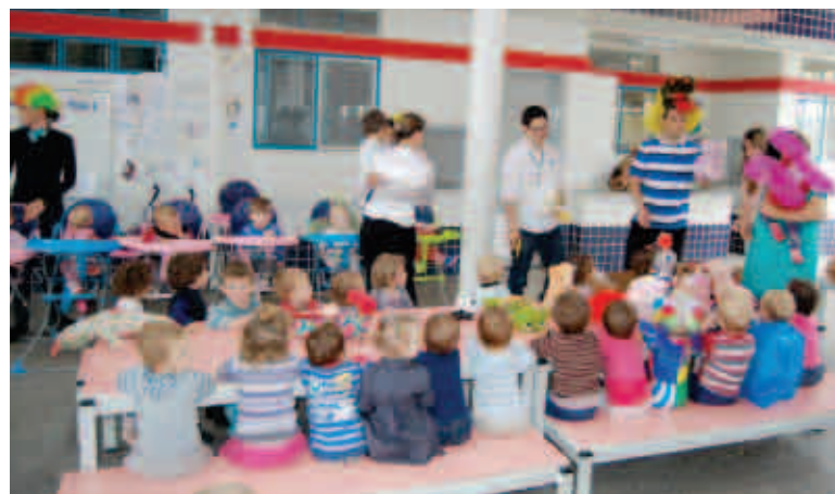
Mais de 250 crianças do Centro de Educação Infantil Pró-Infância foram atendidas

Na quinta-feira (11) foram distribuídos brinquedos na Escola Especial Marisol (Apae), no Centro Educacional Monteiro Lobato, no Hospital São José e nos Centros de Educação Infantil Eri-