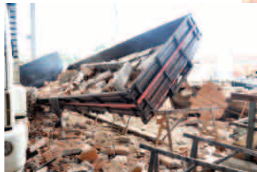
Além da carroceria também danificou partes do caminhão que estava ao lado