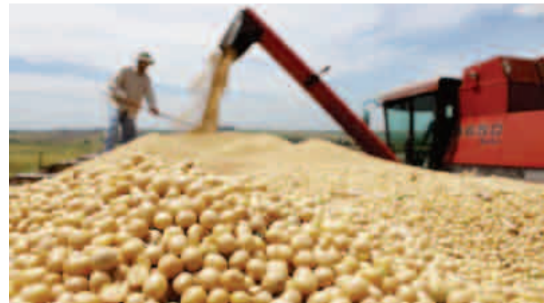
O maior crescimento deve acontecer nas lavouras de soja