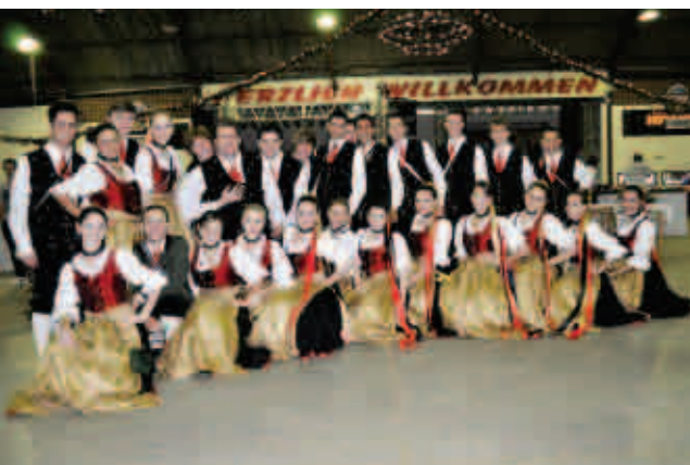
Grupo folclórico Lichtenschein de Guaraciaba fizeram as apresentações

vencedoras agradeceram o apoio e confiança do público. "Agradecemos as nossas famílias, amigos e pessoas que acreditaram em nós", comentam. Após, o público festejou com as bandas Fritz 4 e Banda Chopão.