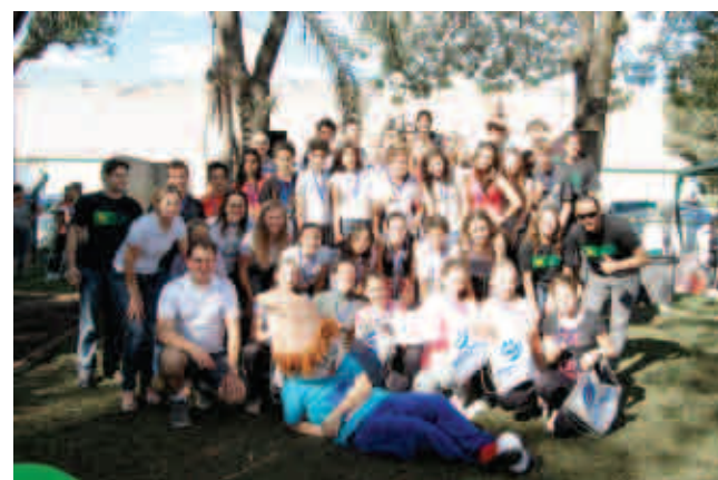
A primeira colocada foi a EEB Nossa Senhora da Salette, com 240 pontos