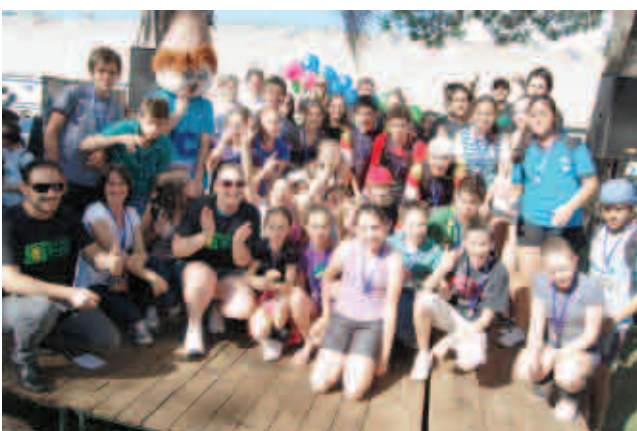
Em segundo lugar ficou a EEB Santa Terezinha, com 234 pontos