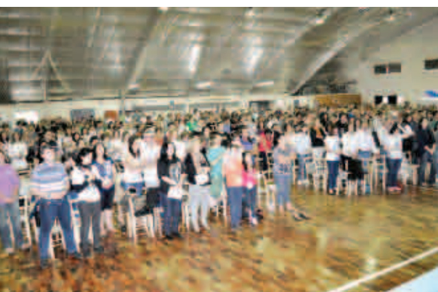
Mais de 500 pessoas participaram da Santa Missa em honra à Virgem Maria

Para encerrar o evento, ocorreu o sorteio da rifa da Paróquia São José Operário, para a construção do Centro Pastoral.