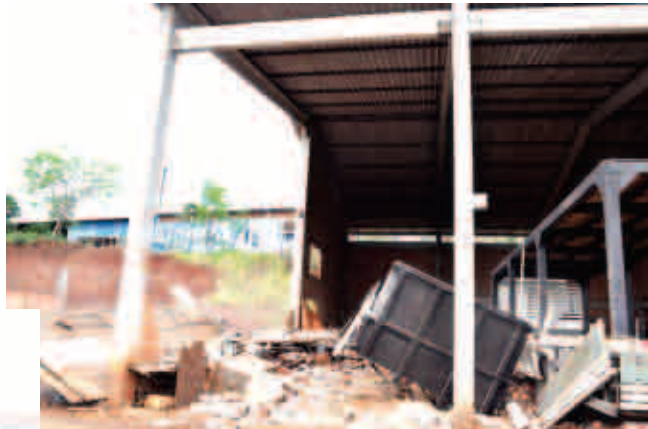
Na Carroceria Renascer, a parede lateral caiu danificando o que estava próximo

Os fortes ventos que ocorreram na noite de segunda-feira (15) e madrugada de terça-feira (16), causaram alguns estragos em Maravilha. Na BR 282, na Carroceria Renascer uma parede caiu, danificando uma carroceria que estava no barracão da empresa. O Corpo de Bombeiros de Maravilha também atendeu a um destelhamento parcial, por volta da 01h30, no Loteamento Estrela. Demais estragos ainda não foram registrados.