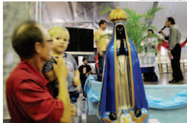
Comunidade em geral e crianças pediram bênção a Nossa Senhora