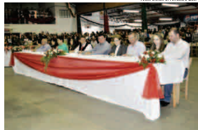
Jurados julgaram e escolheram as soberanas do Kerbfest 2012