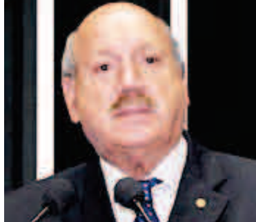
Senador Luiz Henrique (PMDB/SC)