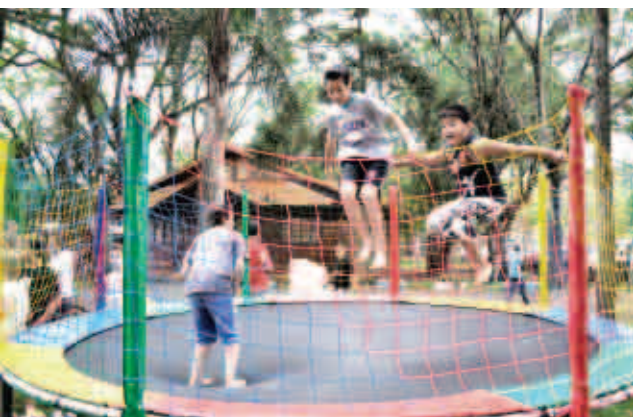
Brincadeiras divertiram as crianças