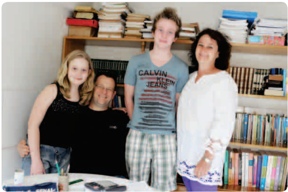
O casal de professor não incentiva os filhos a seguirem a carreira