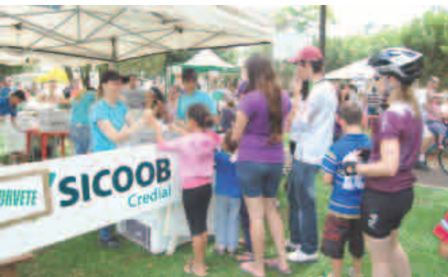
8º Festival do Sorvete atraiu a criançada