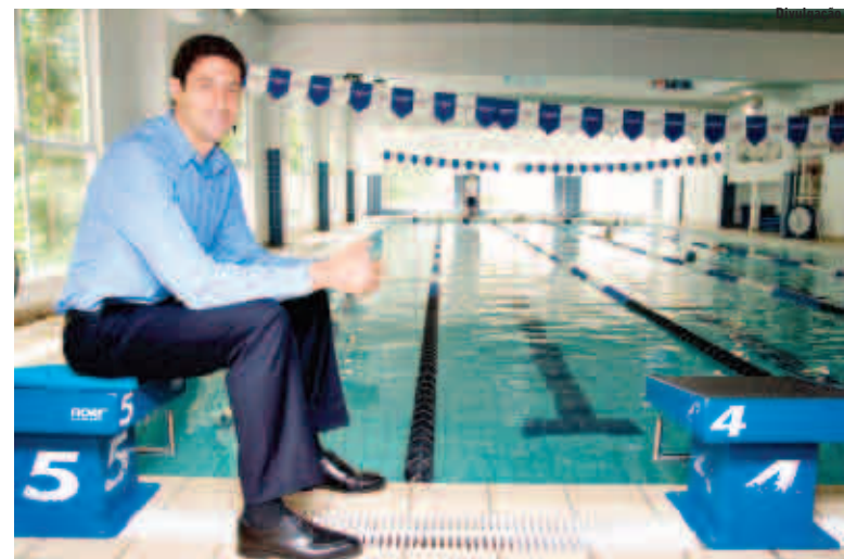
Além de ex-nadador, Gustavo Borges também é economista

Associados à CDL/Associação Empresarial, estudantes e nucleados pagam o valor de R$ 25. Para outros interessados, o ingresso do evento tem o custo de R$ 40. Mais informações podem ser obtidas pelo telefone (49) 3664-0414.