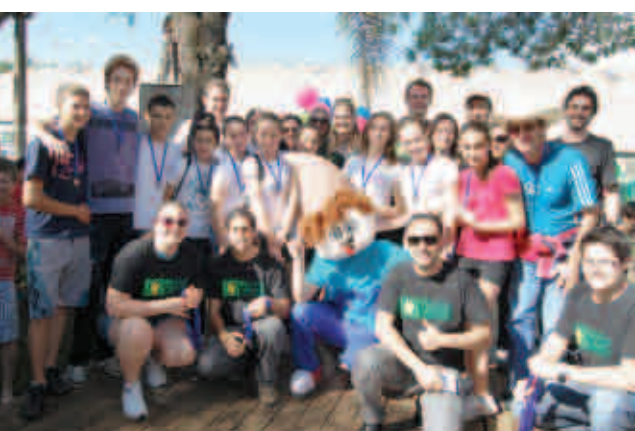
A EEB João XXIII, que somou 217 pontos, ficou em 3º lugar