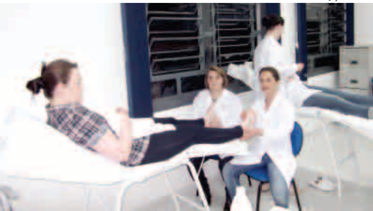
Dois disciplinas práticas estão sendo cursadas no momento