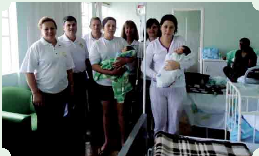
Integrantes do Rotary em visita ao Hospital

Este trabalho é realizado todos os anos pelo Rotary, um dos projetos que fazem parte da comunidade de Maravilha.