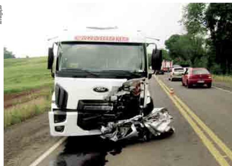
Caminhão tanque de Cunha Porã também teve danos materiais