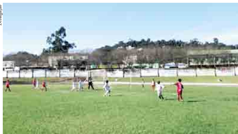
Genoma de Maravilha se destaca nas finais da região do Grande Oeste

Já as disputas do Campeonato Brasileiro de Genomas das categorias sub 10 e 12 acontecem no mês de dezembro, em Pântano Grande, no Rio Grande do Sul. Para este ano ainda está previsto a realização de mais um torneio interno das escolinhas e o jantar de encerramento com datas ainda a serem confirmadas.