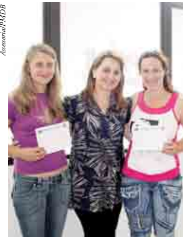
Novas filiações foram feitas durante a convenção