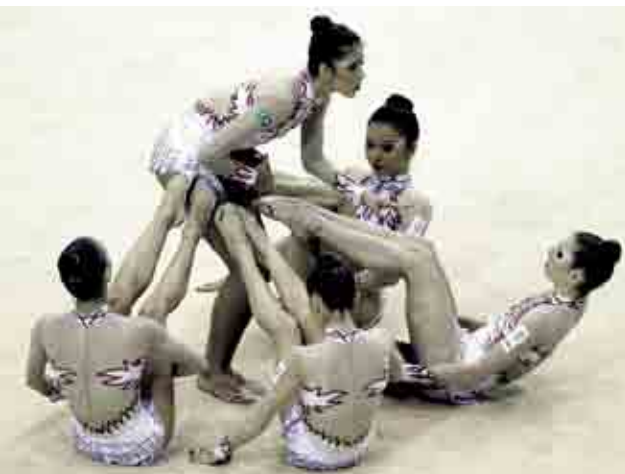
Equipe de Ginástica rítmica conquistou dois ouros