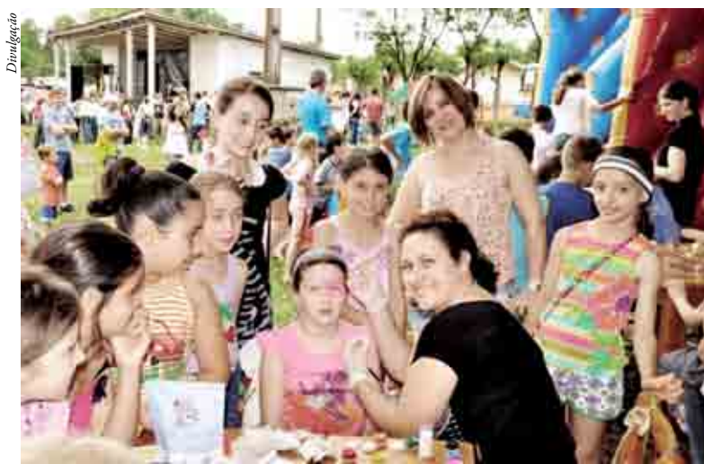
Gincana cultural reuniu crianças e adultos