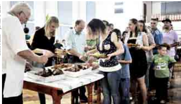
Jantar foi realizado pelo grupo de idosos Lar de Convivência

a todos que colaboram, comprando números nessa ação em prol da escola, que tem como objetivo melhorar a sua estrutura física.