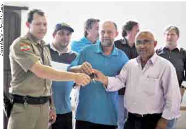
Entrega da chave do ônibus escolar novo para o motorista