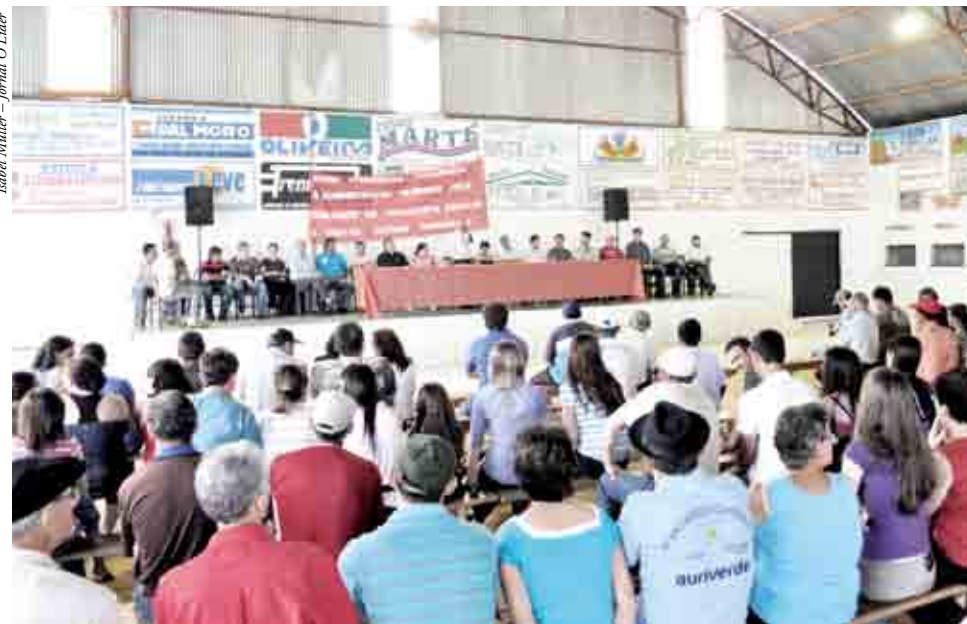
Pronunciamentos foram seguidos de entrega de veículos

ônibus novos. Um veículo de 69 lugares que totalizou R$ 212.000, destes R$ 209.880 de convênio e R$ 2.120,00 de recursos próprios. O outro ônibus de 44 lugares so-