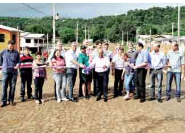
Inauguração do calçamento no Bairro Mombach