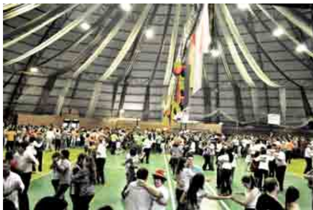
2.400 pessoas curtiram a 3º Oktoberfest