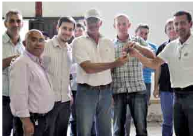
Entrega do caminhão caçamba para Secretaria de Obras, Transporte e Urbanismo