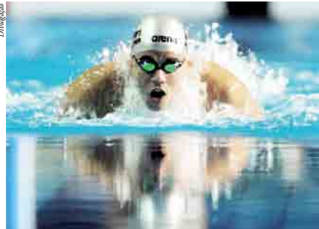
Thiago Pereira está mais próximo de bater Hugo Oyama como o dono do maior número de ouros do Brasil em Pans