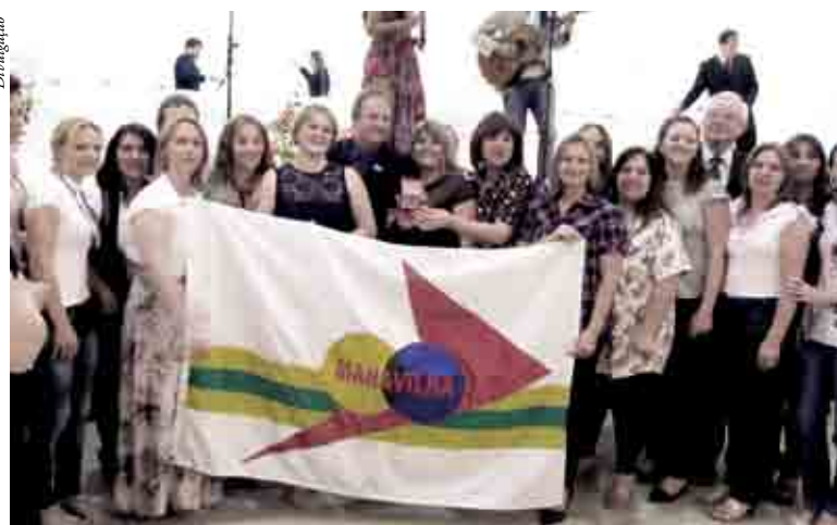
Maravilha foi homenageada

Municípios homenageados pelos baixos índices de analfabetismo: