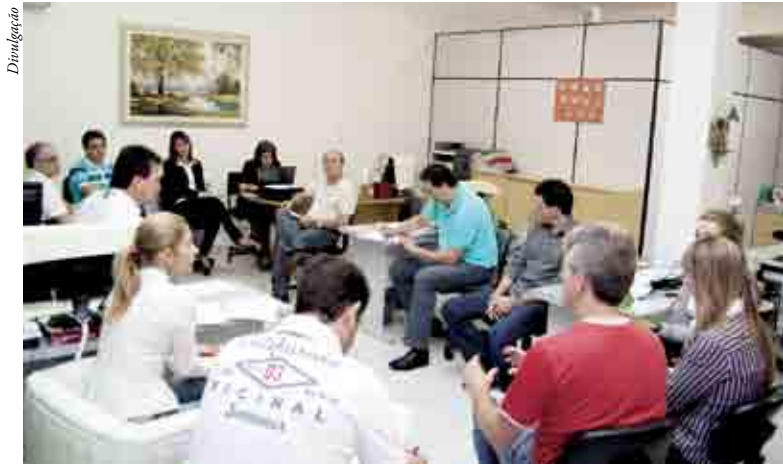
Diretores da Associação Empresarial se reuniram com contabilistas

“Estamos passando por uma época de grandes transfor-