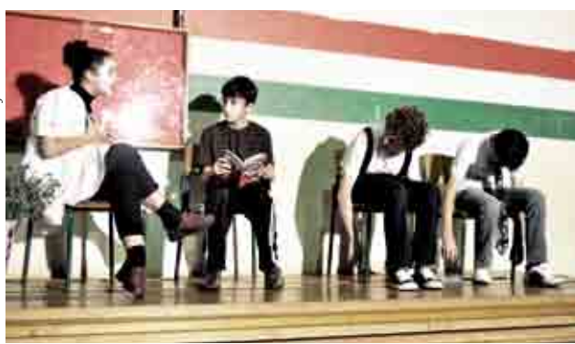
Teatro apresentado pelos alunos deu início às atividades no turno da noite

Das turmas do vespertino foram destaques: Em 1º lugar “A Doença da Terra”, produzido pelos alunos do 4º ano; e em 2º lugar “O último julgamento” produzido pelos