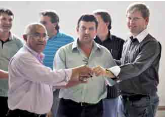
Prefeito e secretário da Educação entregam chave de ônibus escolar