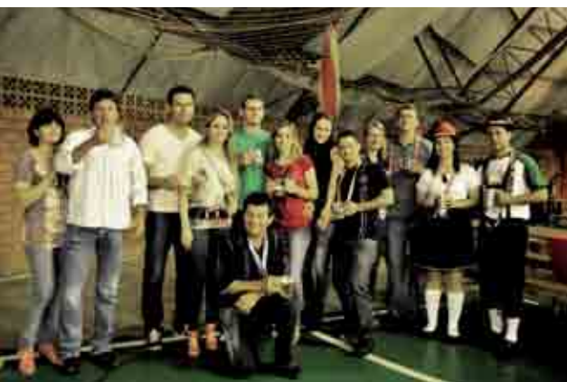
Grupo da Montamar de Leri esteve fazendo a festa na Oktoberfest