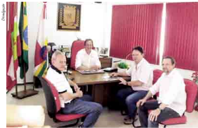
Representantes da celesc se reuniram com prefeito e secretário

A subestação deverá suportar o crescimento da carga elétrica e ga-