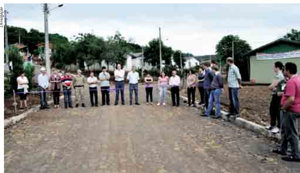
Inauguração do calçamento no Bairro Cohab

Também foram repassados ao município dois