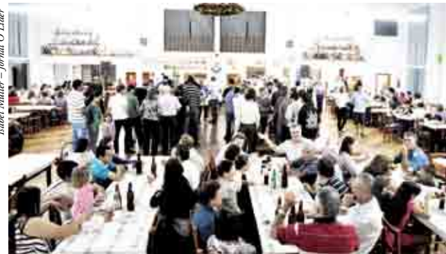
230 fichas de jantar foram comercializadas