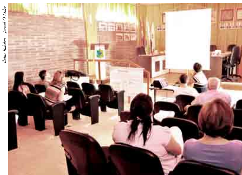
Grupo de Iraceminha se reuniu na Câmara de Vereadores

O Grupo Executivo de Saneamento (GES) se reunirá nos próximos dias para proceder com os dados e realização dos itens a serem incluídos no plano.