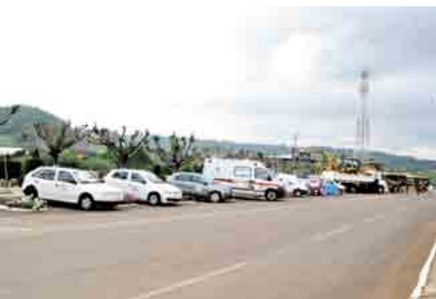
Veículos da Administração foram expostos na Praça Jorge Lacerda