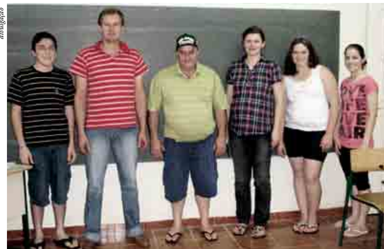
Núcleo do Comércio de Santa Terezinha do Progresso esteve reunido para definir últimos detalhes da promoção

A promoção inicia na próxima semana e a segue até 23 de dezembro, data do sorteio que acontecerá na praça central do município.