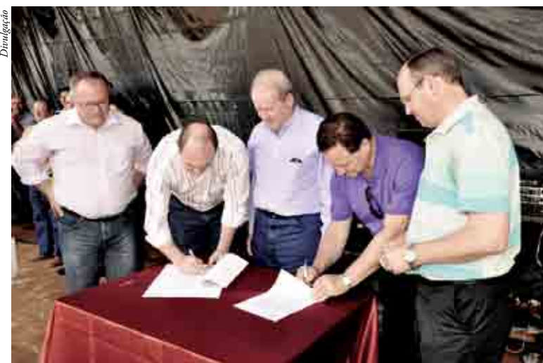
Serra Alta -Dois convênios foram assinados na ocasião

O momento foi marcado pela assinatura de dois convênios celebrados entre Prefeitura e Estado