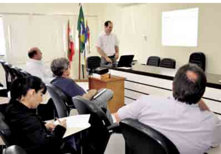
Audiência foi realizada no auditório da Prefeitura