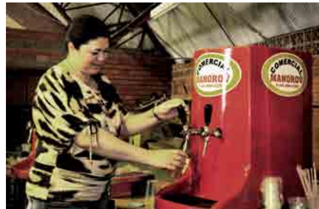
Aproximadamente 4.600 litros de chopp foram comercializados