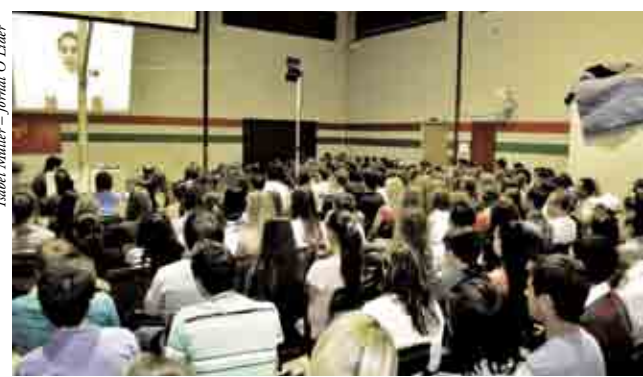
Curtas metragens foram desenvolvidos pelos alunos para edição 2011 do Projeto Arte em Foco

No encerramento das atividades, a escola pres-