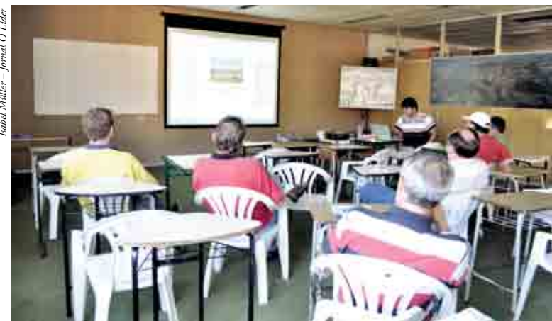
Plano foi debatido com a comissão de Saneamento Básico de Cunha Porã

O colaborador da Prosul explica que cada município tem suas particularidades, mas tem problemas em