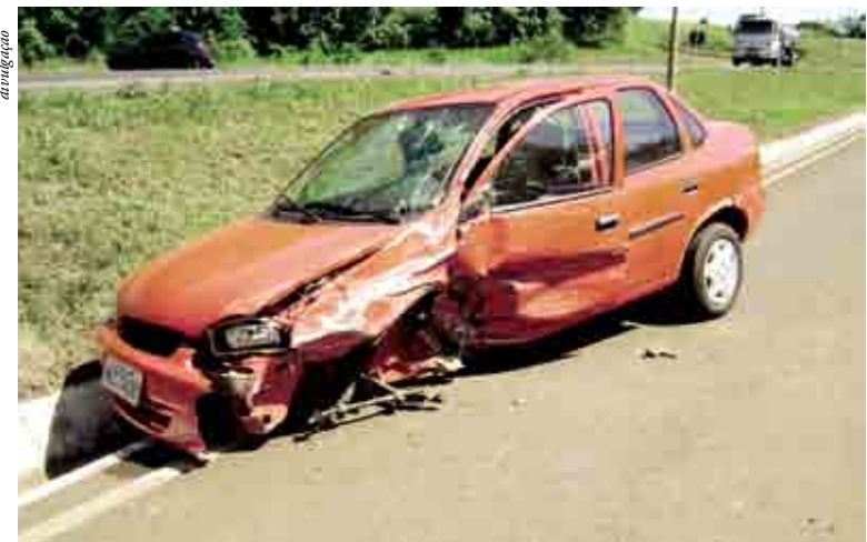
Veículos registraram danos de grande monta