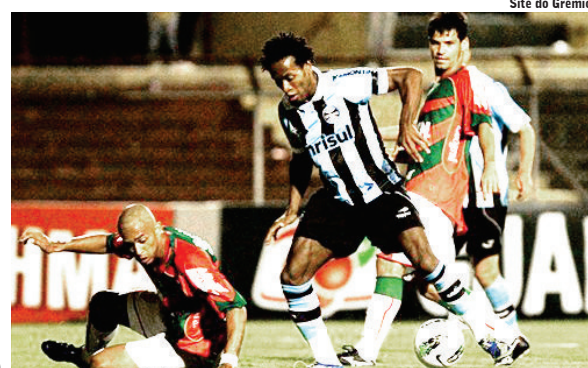
Site do Grêmio

Após empate com a Portuguesa, tricolor gaúcho encara o Figueira no domingo