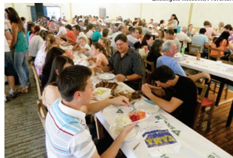
Ao meio dia foi servido almoço