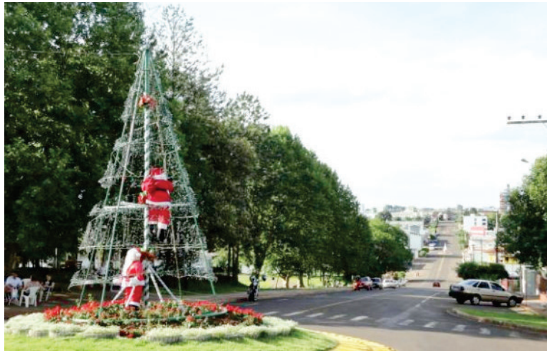
Decoração na rótula da Rua XV de Novembro

De acordo com a secretária de cultura, a Praça Walnir Bottaro Daniel, que vai receber a Vila do Papai Noel, a Gruta Nossa Senhora de Lourdes, o calçadão da Rua Almirante Tamandaré e rótulas da cidade serão decoradas.