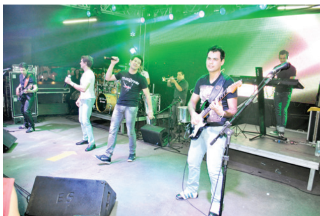
Musical San Francisco animou a noite dos participantes