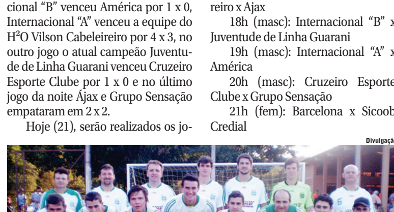
Equipe Juventude de Linha Guarani