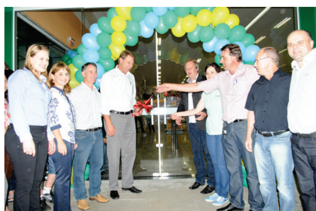
Corte simbólico da fita formalizou a inauguração