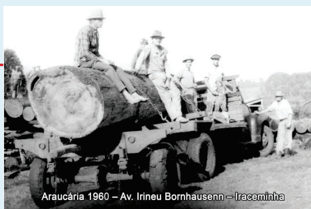
Araucária 1960 - Av. Irineu Bornhausenn - Iraceminha

Moradores da cidade de Iraceminha exibindo um tronco da árvore araucária em meados dos anos 1960.