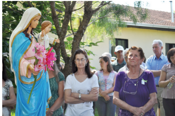
Festa em honra a Nossa Senhora da Saúde