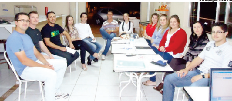
Jovens empreendedores se encontraram na pista de kart