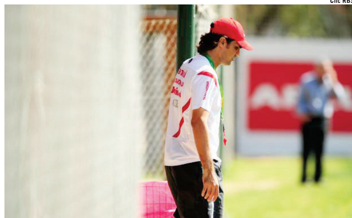
Presidente afirma que o grupo não responde mais ao técnico