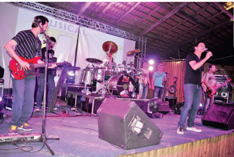
Musical JM animou a plateia

Mais de 800 pessoas participaram do baile dos comunicadores da Rádio Líder FM, realizado no sábado (17), no CTG Juca Ruivo. A festa ficou por conta do Gaúcho da Fronteira e Musical JM. Confira as fotos do evento: