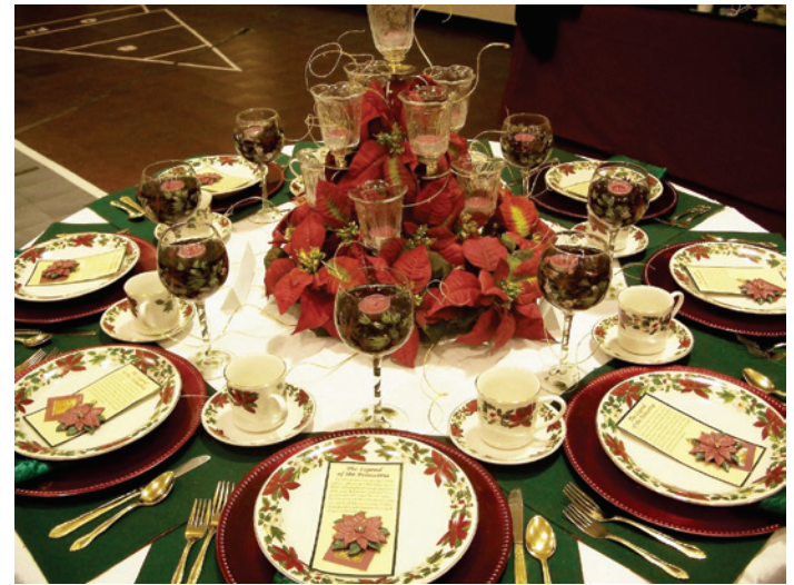
A mesa decorada deixa o jantar na harmonia natalina