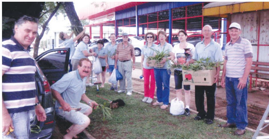
O grupo realizou a reposição de mudas de orquídeas nas árvores que margeiam o acesso ao município de Maravilha

SUA EMPRESA E SEU PÚBLICO JUNTOS NO MESMO AMBIENTE