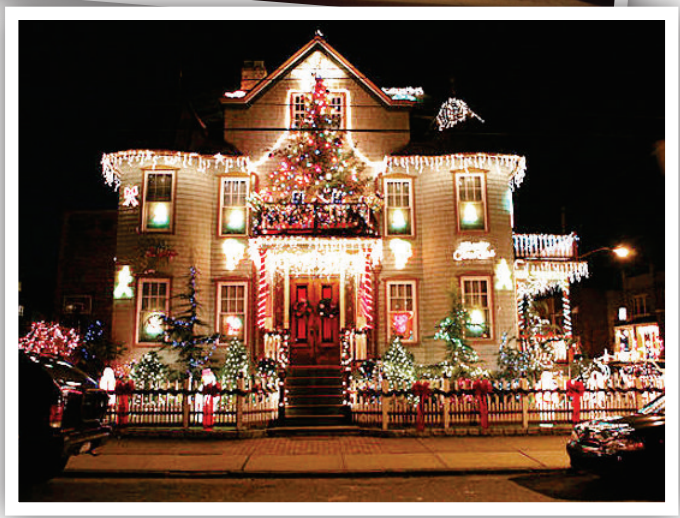
Confira o que a Tumelero Utilidades tem para lhe oferecer!