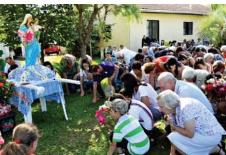
Diversas bênçãos foram feitas aos seguidores