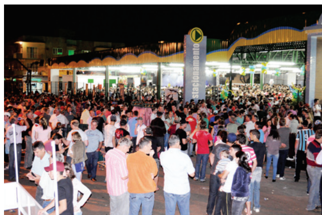
População de Maravilha e região prestigiou a inauguração