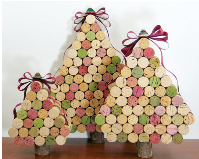
Decorações artesanais estão em alta neste natal

Outras novidades são as presenças de luzes e iluminarias, tapetes decorativos, ursos e tudo mais para decorar a sua casa. O tradicional vermelho, claro, não sai de moda para este Natal, mas deve trazer tons diferentes como novidade