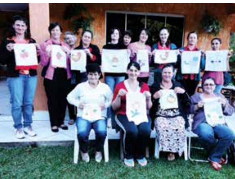
Clube de mães Hortência, da Linha Chinelos Queimado teve um curso de patwork