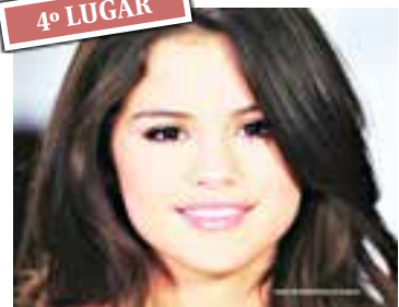
Come & Get It - Selena Gomez