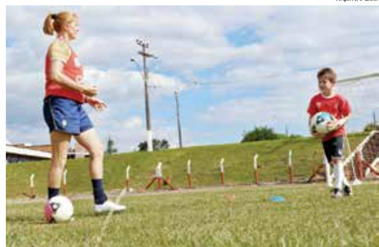
A Goleira Maravilha está realizando trabalhos com os alunos do projeto

muito ao projeto. Com certeza ela vai repassar a sua experiência para os alunos do Genoma Colorado", destacou Batistello. Essa é uma das principais novidades do projeto para 2013. "Além disso, está sendo desenvolvido um treinamento especial para os goleiros e esses treinos estão sendo coordenados pela