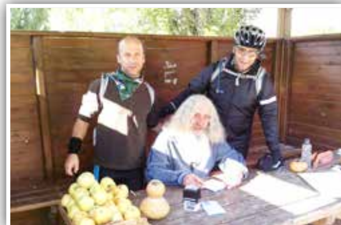
Em contato com os peregrinos