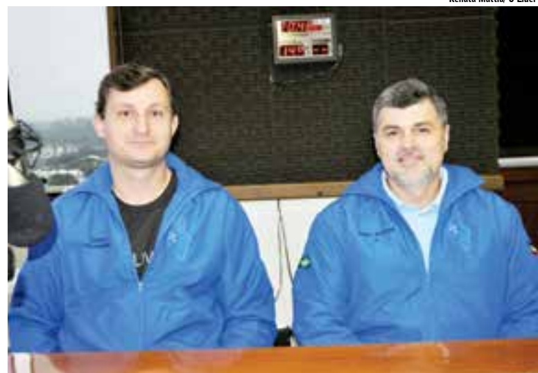
Ranzan e Bruxel divulgaram o evento no programa Atualidades

As pessoas que quiserem participar do evento estão convidadas, sendo que a abertura está marcada para às 10h de hoje.