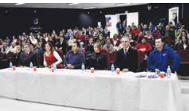
Cinco jurados avaliaram a desenvoltura e oratória dos alunos