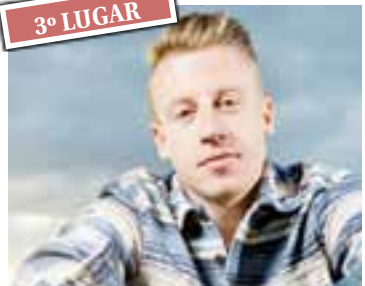
Thrift Shop - Macklemore