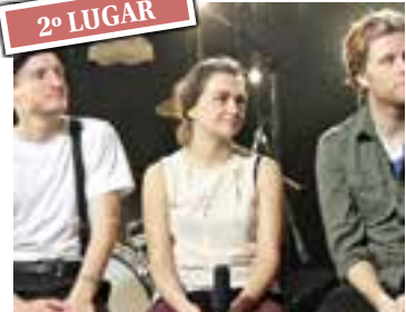
Ho Hey - The Lumineers