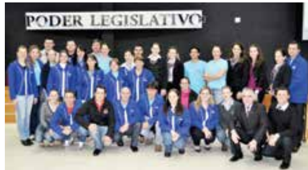
Companheiros da JCI organizaram o evento