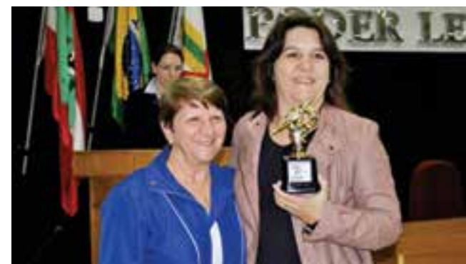
Escola campeã recebeu um troféu de reconhecimento