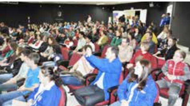
Grande público assistiu as apresentações