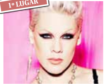
Just Give Me a Reason - Pink