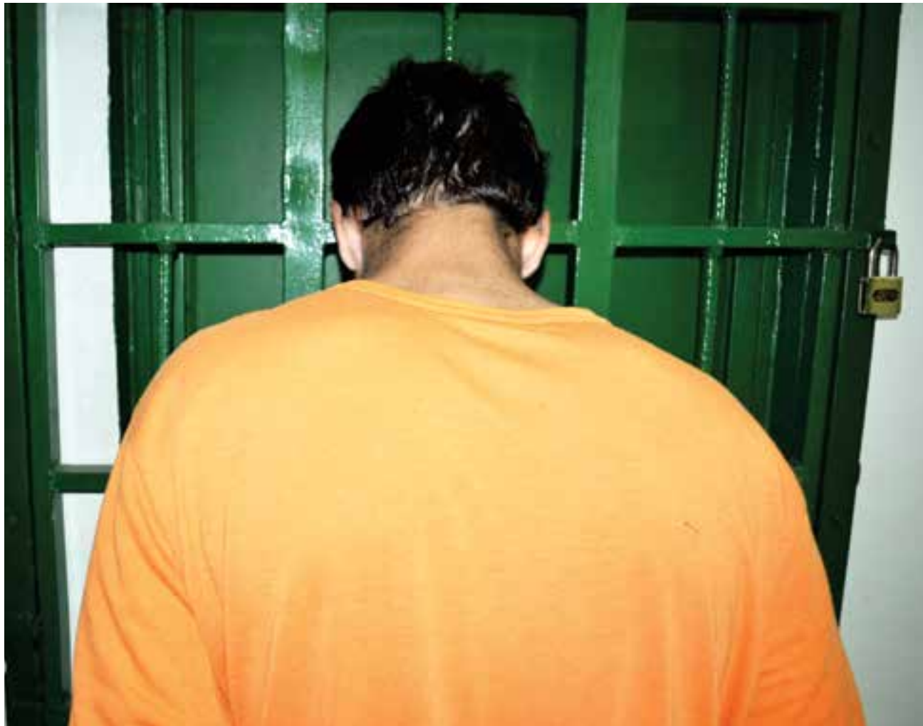
O jovem está preso por embriaguez ao volante

Para o jovem, a bebida alcoólica é o primeiro passo para a destruição das pessoas e conseqüentemente das suas famílias e das suas vidas. "Os jovens pensam que jamais vão usar drogas por decorrência da bebida alcoólica, mas quem faz uso dessas bebidas está muito mais vulnerável às drogas", ressaltou. Para o rapaz que está sofrendo as consequências das suas condutas inadequadas, quem tem a oportunidade de se afastar das bebidas e das drogas deve aproveitar essa chance. "Depois que você está preso é tarde demais e você deve aproveitar essa chance", complementou.