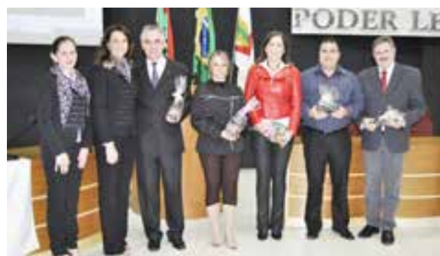
Jurados foram agraciados com uma lembrança de participação