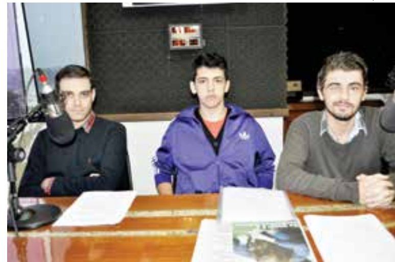
Jovens participaram do programa Atualidades da Rádio Líder FM na manhã de sexta-feira

A mobilização para o manifesto em Maravilha iniciou no decorrer da semana através das redes sociais, ao