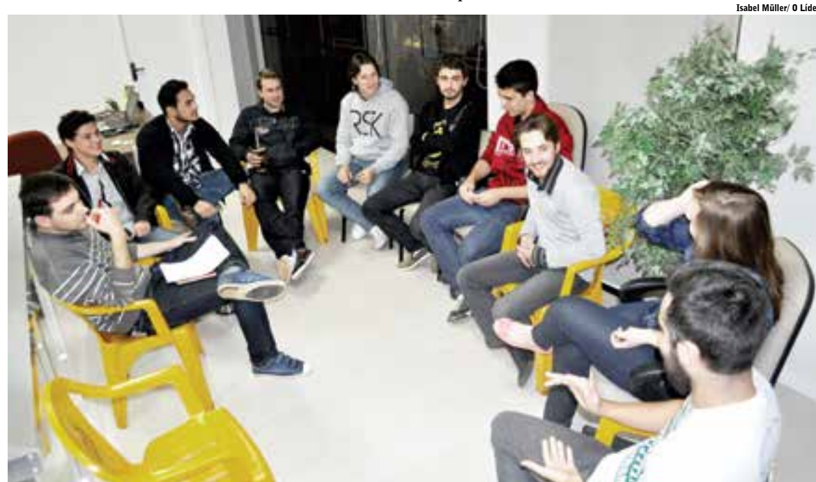
Reunião foi realizada durante a semana para mobilizar e organizar o manifesto

A manifestação inicia na Praça Matriz seguindo em direção a Avenida Sete de Setembro, que vem em encontro com a Avenida Araucária, onde segue até a Prefeitura, após irão se direcionar até a Avenida Albino Cerrutti Cella terminando em frente a Secretaria de Desenvolvimento Regional (SDR)