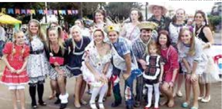
Evento ocorreu na Praça da Bandeira