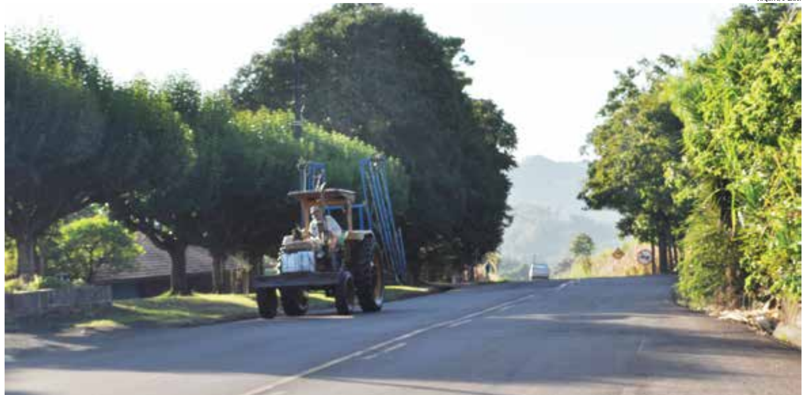
Resoluções previam obrigatoriedade do emplacamento, licenciamento e itens de segurança para máquinas agrícolas que circulam em via pública

Na região, diversas lideranças haviam se manifestado contrários a obrigatoriedade, entre prefeitos, ve-