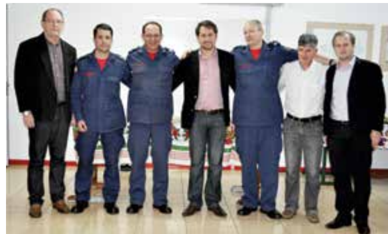
A visita ocorreu na última terça-feira (18)