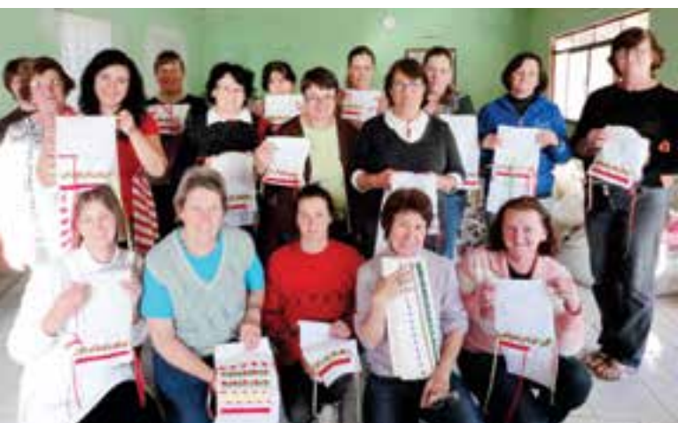
Clube de da Linha Sanga Silva participou de um curso de fita de seda