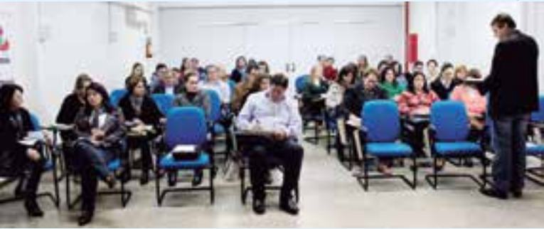
Reunião de trabalho foi realizada na quarta-feira (19)