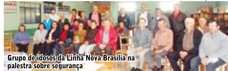
Grupo de idosos da Linha Nova Brasília na palestra sobre segurança