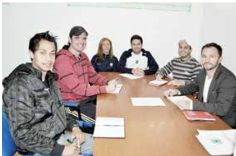
Reuniões são realizadas todas as sextas-feiras