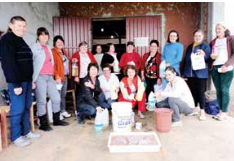
Cursos de limpeza foi realizado para as mães da Linha Primavera Alta