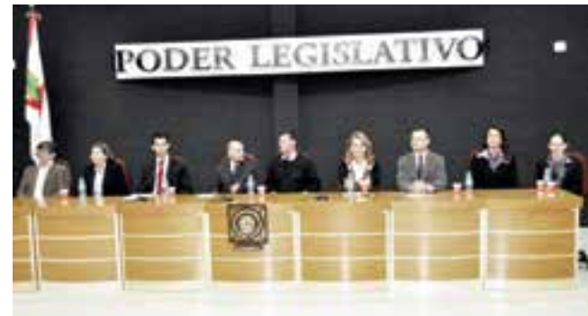
Autoridades prestigiaram a terceira edição do projeto