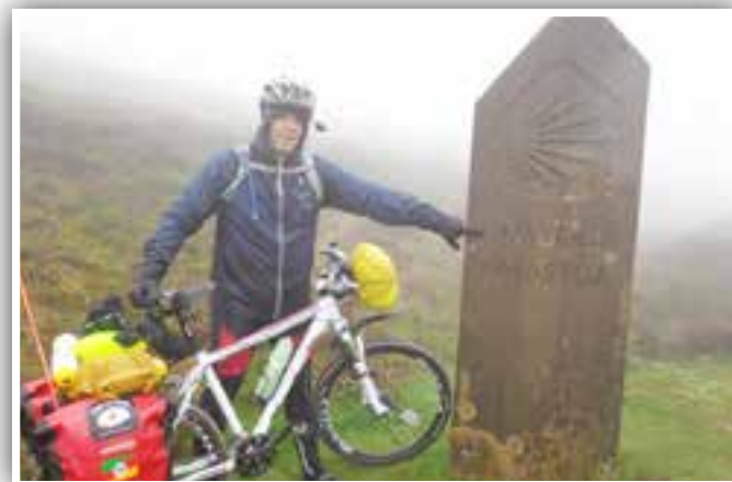
Divisa da França com a Espanha, nos Pirineus