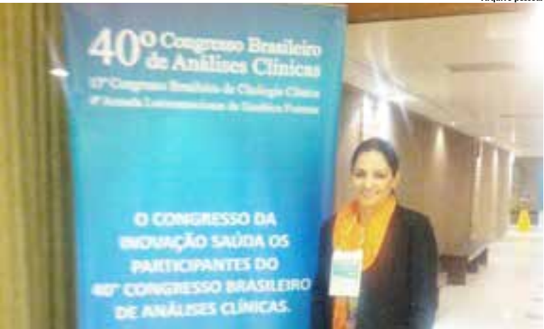
Karina buscou atualização durante o 40º Congresso Brasileiro de Análises Clínicas