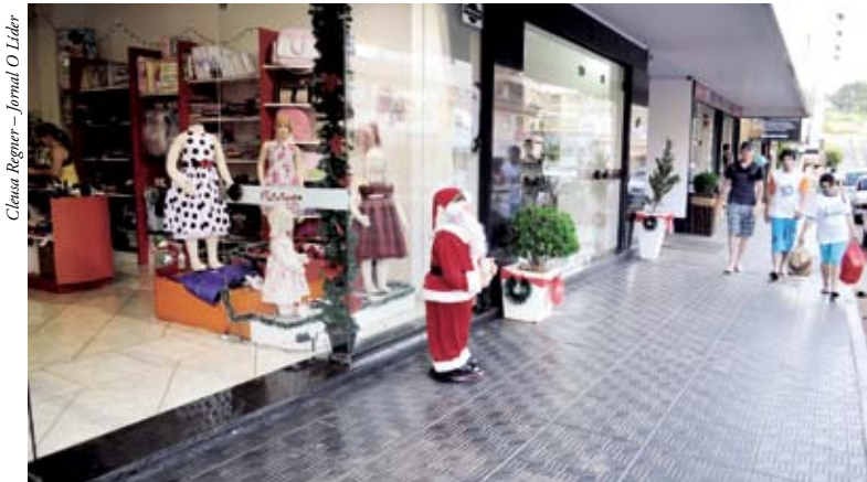
Comércio fica aberto até às 21h nesta semana

Na próxima semana, dias 26 a 31, o comércio atende em horário normal e, no dia 2 de janeiro, estará aberto somente no período vespertino, a partir das 13h30.