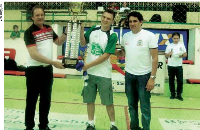
A equipe dos Amigos do Valgoi ficou com o vice na categoria força livre