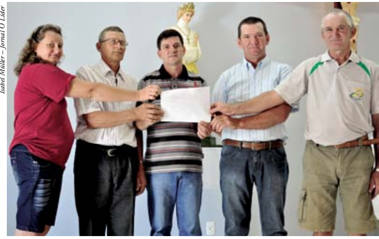
Comunidade recebeu das mãos do ex-vereador R$ 6 mil