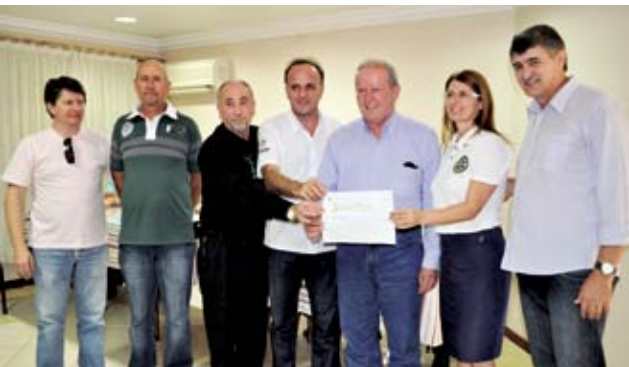
Associação de Rotarianos de Maravilha recebeu R$ 10 mil