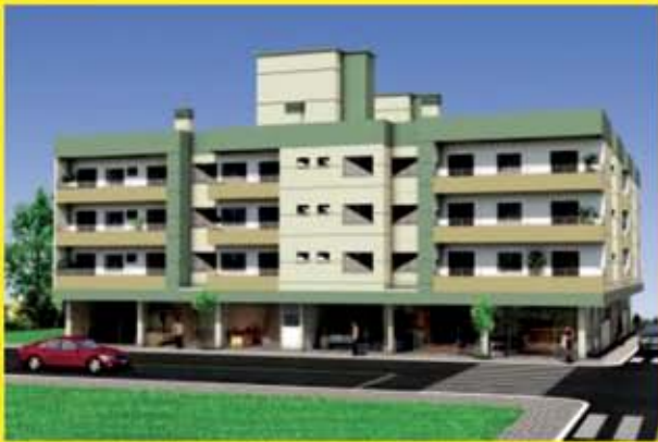
Apartamentos Edifício Mauá