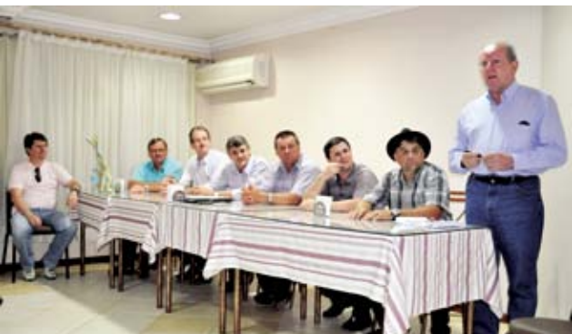
Deputado esteve reunido com entidades e companheiros políticos de Maravilha e região