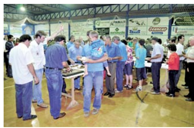
Após as assembleias todos confraternizaram no jantar

(PMDB) ressaltou sobre as suas ações como vice-presidente da Comissão da Agricultura da Câmara dos Deputados, defendendo e trabalhando em prol da classe.