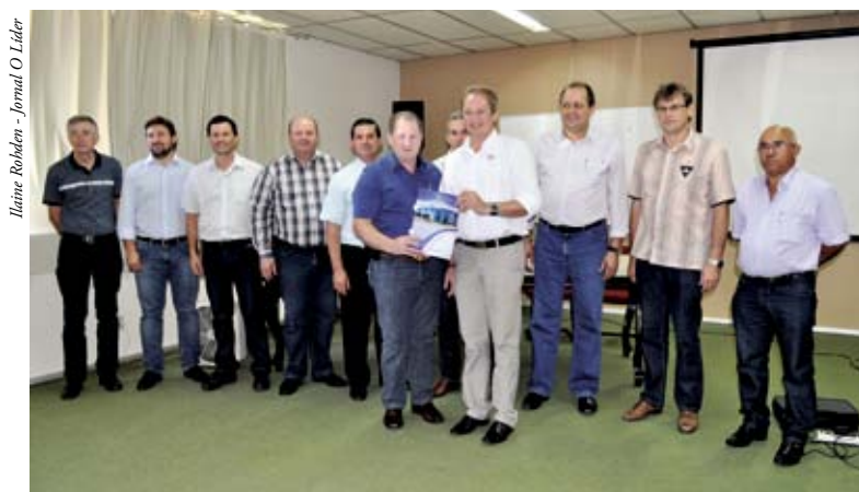
Nova diretoria tomará posse em janeiro