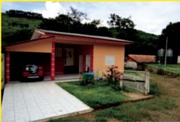
Área com 51 hect, com dois açudes e envernada toda fechada com mangueira.