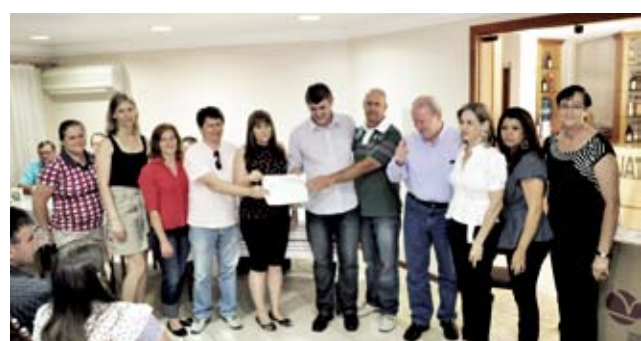
Associação Hospitalar de Maravilha recebeu R$ 6 mil