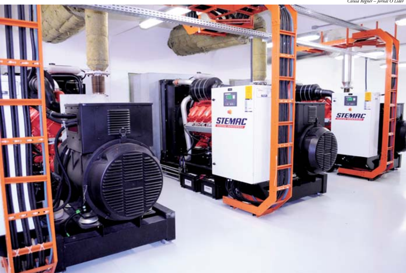
Conjunto de geradores no Laticínios Bela Vista permite que a indústria funcione sem energia