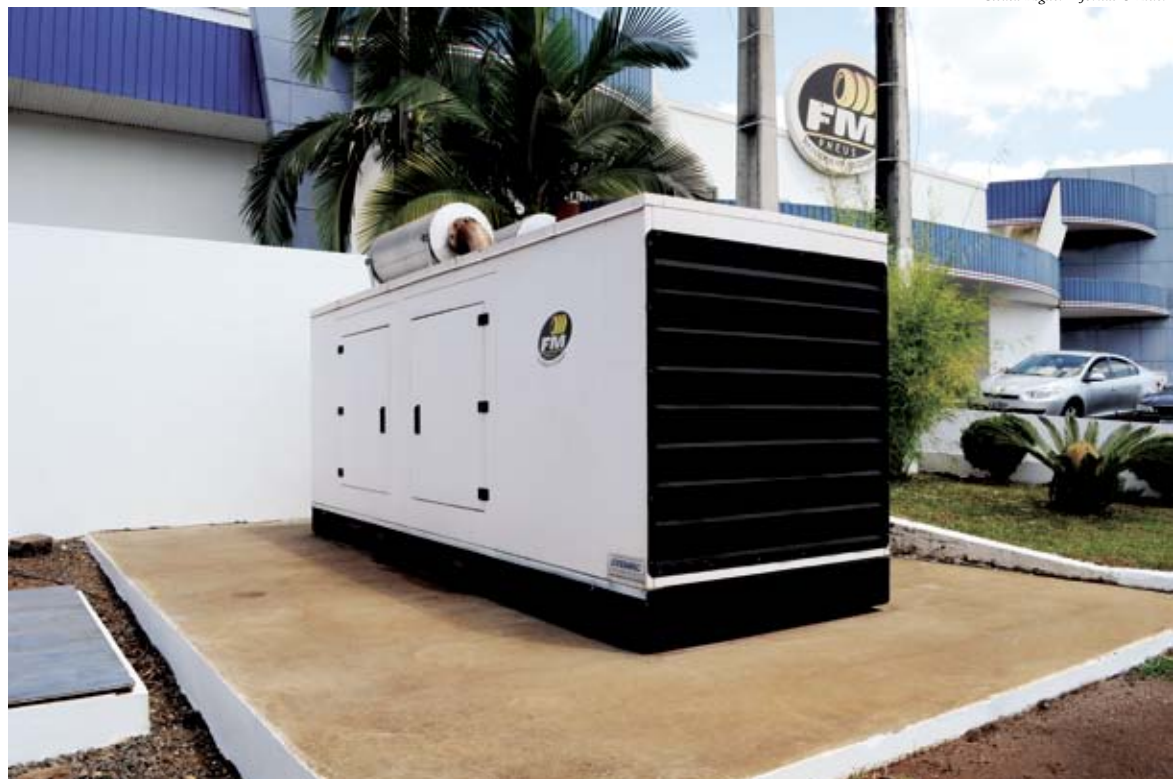
Gerador que abastece a FM Pneus