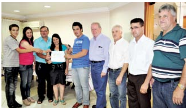
Associação Beneficente de Assistência Social e Educacional Unidos em Cristo de Flor do Sertão também foi beneficiada