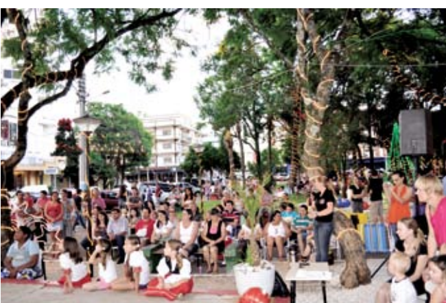
Apresentações reuniram grande público na praça