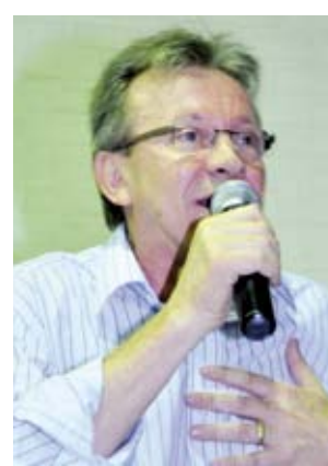
Deputado federal Celso Maldaner