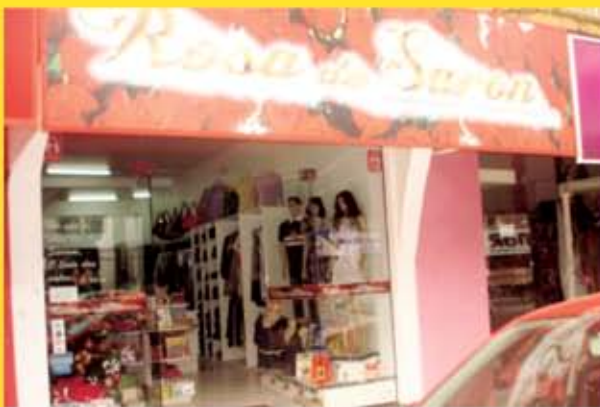
Loja de confecções, livraria e bazar.