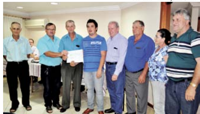
Flor do Sertão recebeu recursos para o Grupo de Idosos São Gotardo