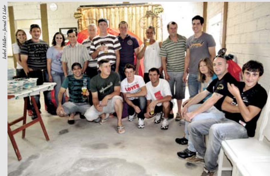
Colaborados da Roda Leizer

A Rodaleizer Mecânica Ltda realizou no sábado (17), um almoço de confraternização entre os fornecedores, colaboradores e familiares. A empresa deseja a todos que estavam presentes e para os que não puderam participar um feliz Natal e próspero ano novo!