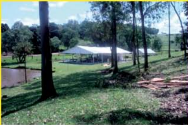
Pesque e pague em Bom Jesus do Oeste