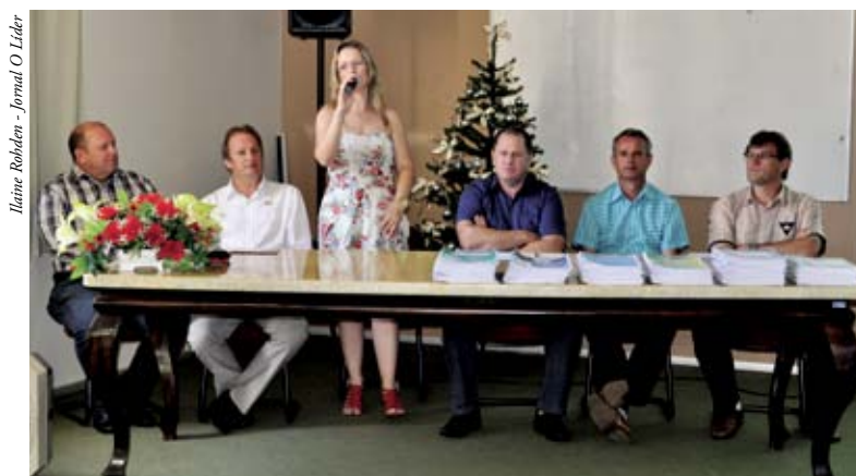
Mesa de honra foi composta na abertura do evento