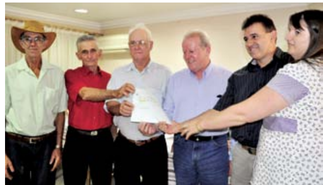
Grupo de Idosos de Santa Terezinha do Progresso recebeu subvenção