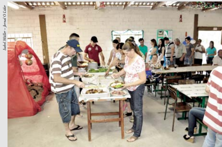
Almoço de encerramento do ano contou com a presença dos fornecedores da empresa

A equipe da Interagir Clínica de Saúde e Beleza esteve reunida no sábado (17), no Harmonia Campestre Clube, para um almoço de confraternização de encerramento do ano e revelação do amigo secreto. A Clínica deseja um excelente 2012 para todos, cheio de conquistas e felicidade!