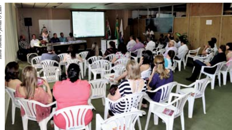
Primeiras damas participaram do evento