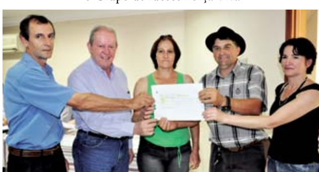
Clube de Mães Paz e Esperança de Saltinho também recebeu subvenção social