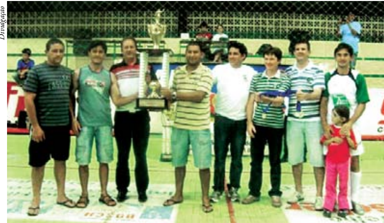
Equipe SER 4S Amizade "A" Loja Vama campeã na categoria veteranos