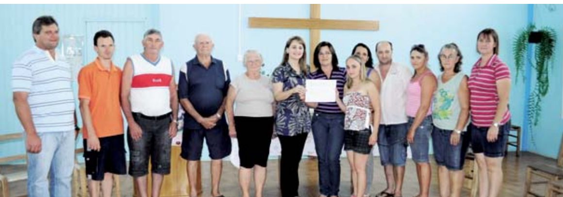
Valor auxiliará clube de mães na compra de agasalhos