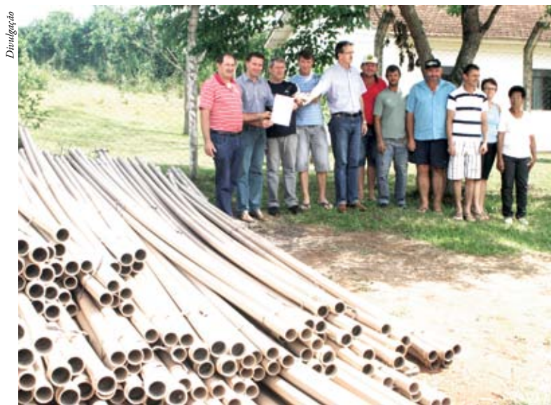
Comunidade recebeu canos para melhoria da distribuição de água

“O trabalho de melhorar a qualidade de água oferecida