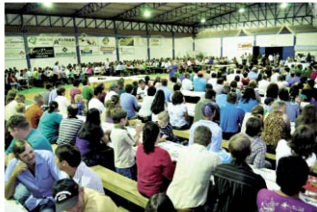
Aproximadamente 800 pessoas entre sócios e familiares participaram do evento

Para o deputado estadual Dirceu Dresch (PT), presente no evento, uma luta que está tomando a frente juntamente com os agricultores é a terceirização da merenda escolar para as agroindústrias familiares. Já o deputado federal Celso Maldaner