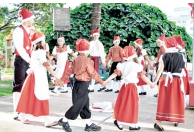
Grupo Per Tutti apresentou uma encenação natalina