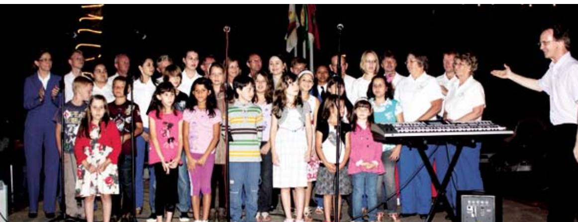
Crianças e adultos que integram o Coral Cidade das Crianças