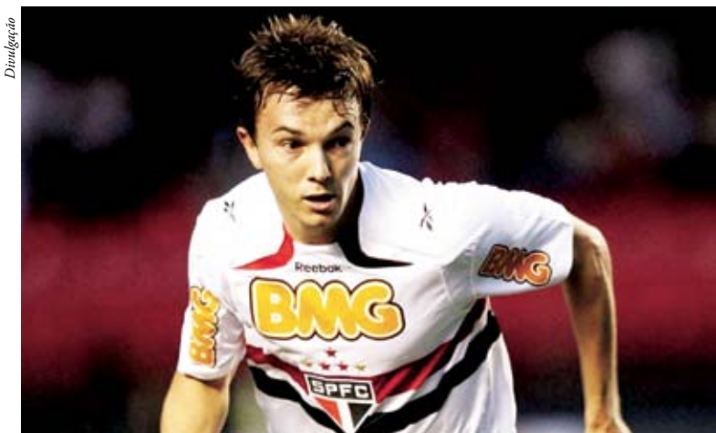
Inter parece estar próximo de um acerto com Dagoberto

Rodolfo é outro que está muito perto de ser anunciado pelo Vasco. Já existe um acordo entre o clube