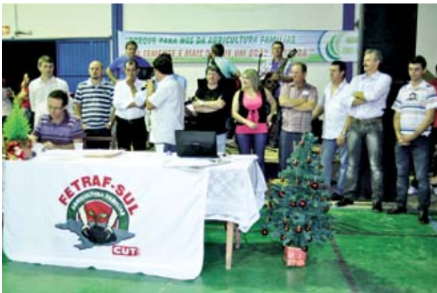
Autoridades acompanharam as assembleias

Uma das pautas mais importantes foi a alteração estatutária do Sindicato, que foi aprovada por unanimidade dos sócios. Após as alterações dos documentos e comprovação em cartório, o Sindicato dos Trabalhadores Rurais de Maravilha extensão de