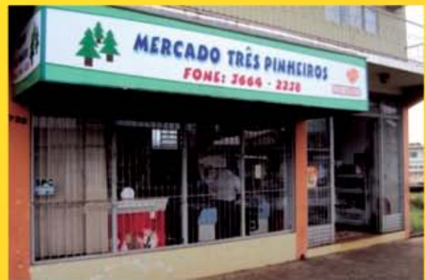
Mercado com ampla clientela, bem localizado no centro de Maravilha.