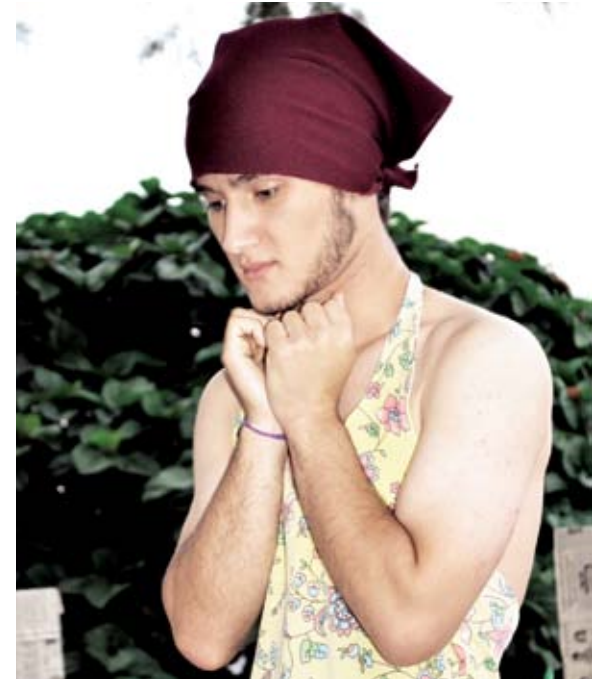
Mensagens positivas foram transmitidas com a peça