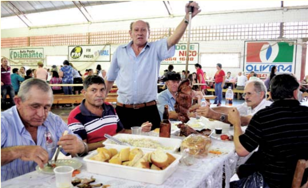
O tradicional churrasco de domingo foi o cardápio do almoço