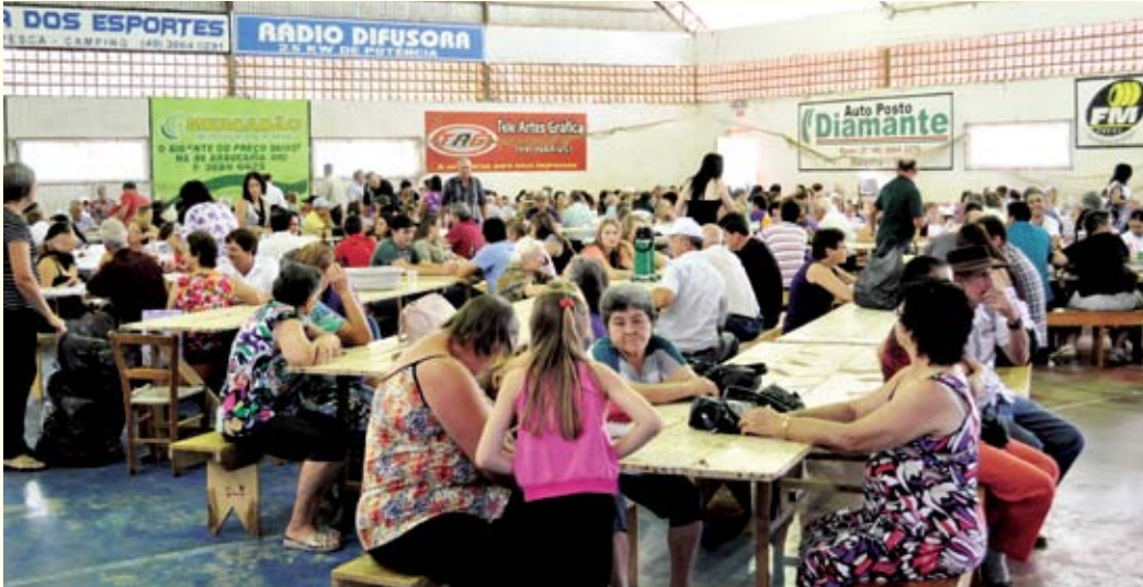
População em geral também participou da festa