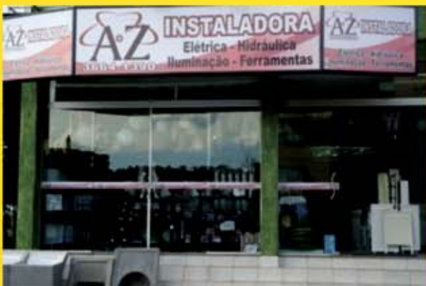
Loja de materias elétricos e hidráulicos