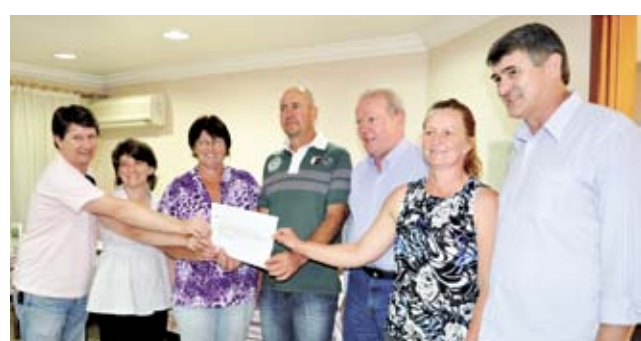
R$ 3 mil foram repassados para o Clube de Mães Hortência, da Linha Chinelo Queimado de Maravilha