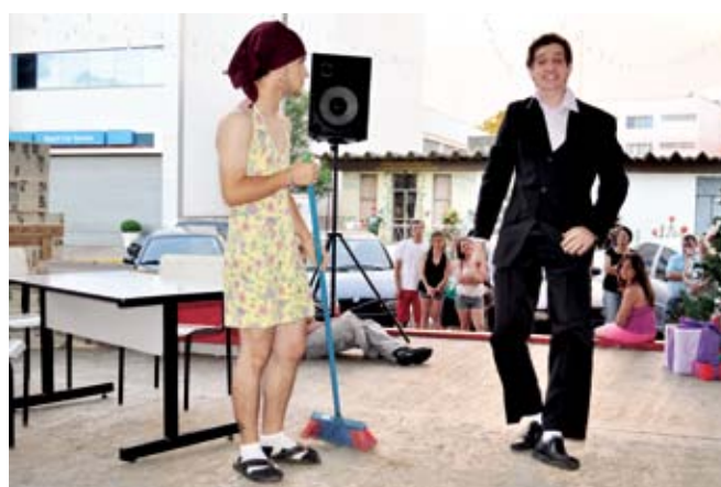
Grupo Ícaros apresentou uma esquete mostrando um Natal diferente