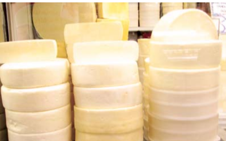
Nova regra permite comercialização do produto com menos de 60 dias de maturação

A propriedade produtora também deve estar em dia com as normas do Programa de Boas Práticas de Ordenha e de Fabricação, incluindo o controle dos operadores, controle de pragas e transporte adequado do produto até o entreposto. Por último, a norma indica que a propriedade deve realizar cloração e controle de potabilidade da água utilizada nas atividades.