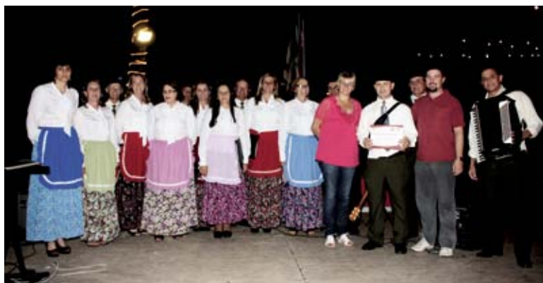
Grupo de Canto de São Lourenço do Oeste se apresentou no encontro de corais