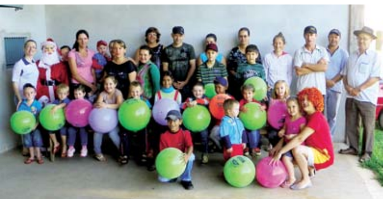
Pais acompanharam as crianças que receberam uma bola