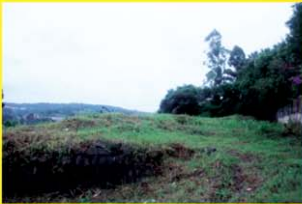
Terreno com 1136m 2 com vista privilegiada da cidade.