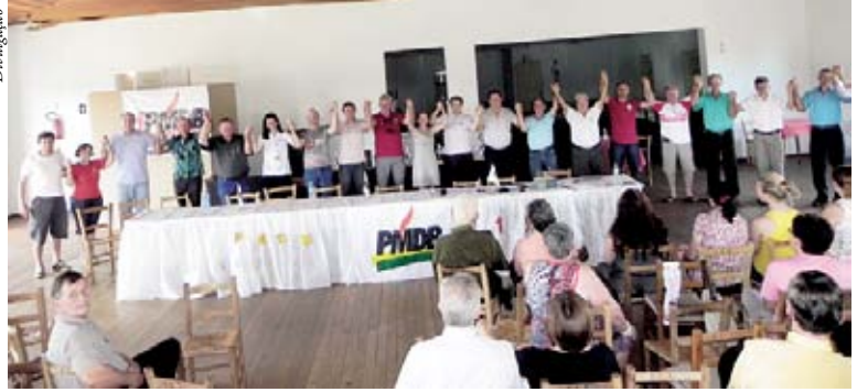
PMDB tem praticamente 800 filiados em Cunha Porá

De acordo com o presidente, o objetivo é trabalhar com transparência, zelando sempre pelos interesses do PMDB, o maior partido de Cunha Porá, com quase 800 filiados. “O PMDB de Cunha Porá está inovando, abriu as portas do