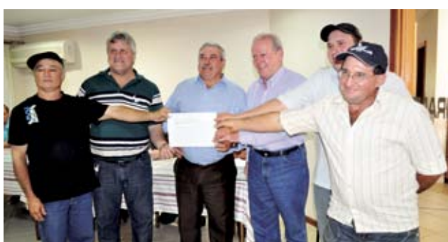
Também de Romelândia foi contemplado o Grupo de Idosos Força Viva