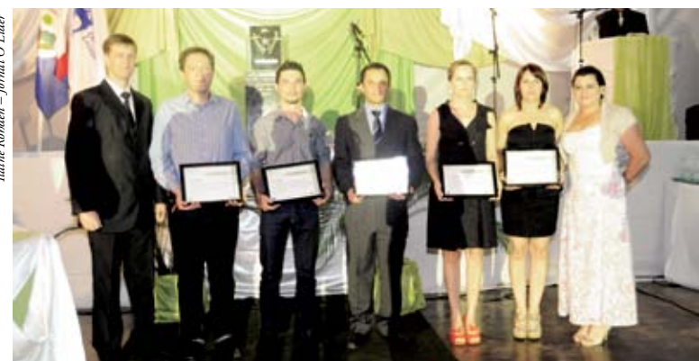
Finalistas receberam certificado de participação