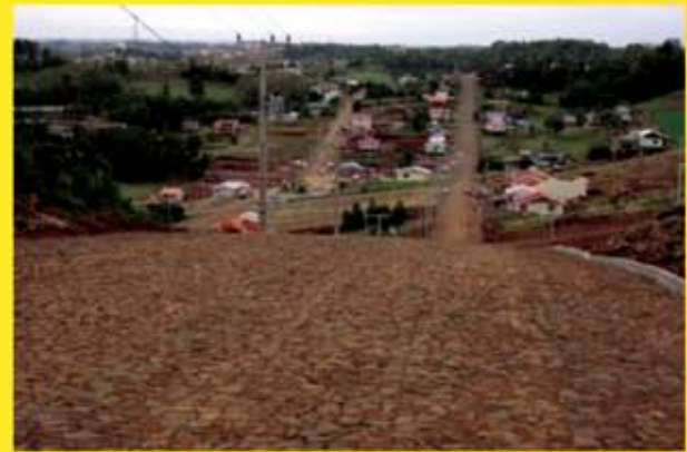
Terrenos no loteamento Jardim América II a partir de R$ 29.000,00