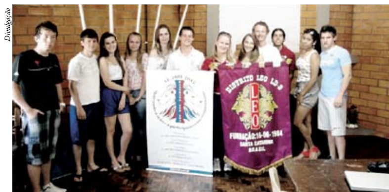
Integrantes da Região A visitaram Saudades para encaminhamentos na fundação de novo clube