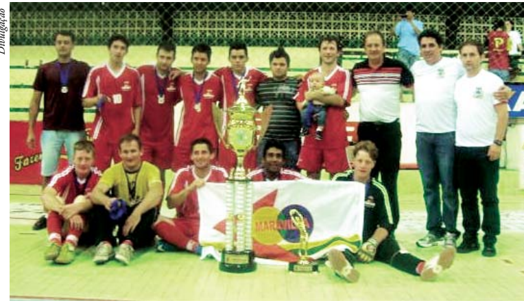
Equipe SER Aurora/Sintricadem campeã na categoria força livre