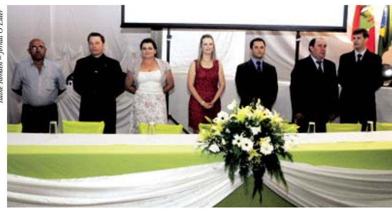
Mesa de honra auxiliou na entrega dos troféus