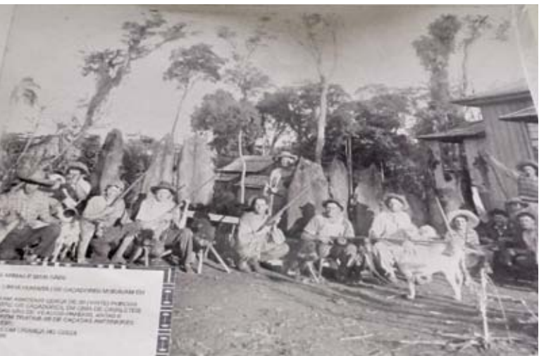
Museu Padre Fernando Nogueira

Caçadores, suas armas e seus cães entre os anos de 1955 a 1956. Local da caçada Linha Humaitá. Neste dia foram abatidos cerca de 20 porcos do mato, veados pardos e antas.