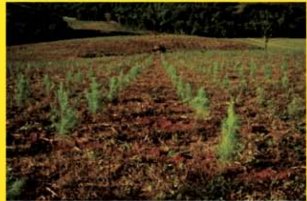
Área com 57 hectares sendo 46 hectares com pinos de 5 anos.