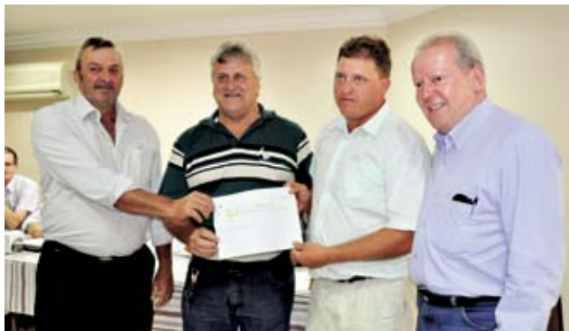
Associação Esportiva Coroados de Romelândia recebeu R$ 5 mil