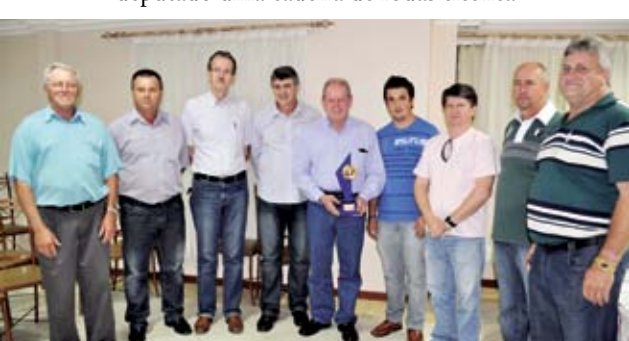
Diretório do PSDB entregou troféu de mérito ao deputado