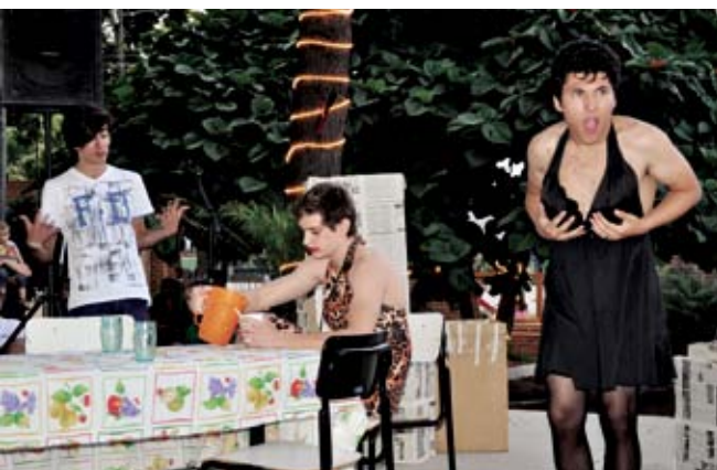
A encenação em forma de comédia fez todos rirem