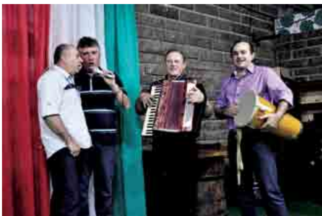
Músicas e piadas animaram a noite