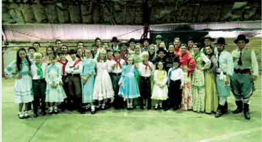
Grupo mirim, juvenil e adulto no rodeio em Chapecó