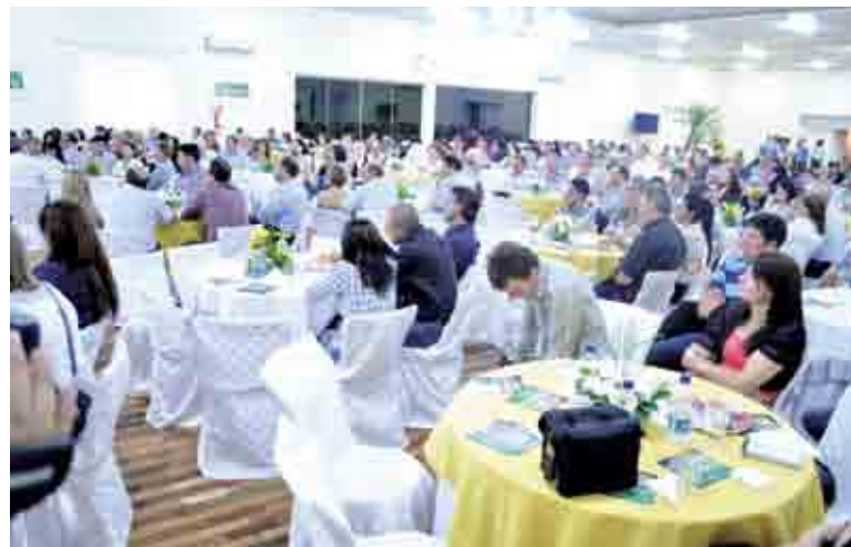
Cerca de 400 pessoas participaram da solenidade de lançamento do Itaipu Rural Show

O Itaipu Rural Show é o maior evento de difusão tecnológica do agronegócio do Sul do país voltado para a pequena e média propriedade rural. "A feira