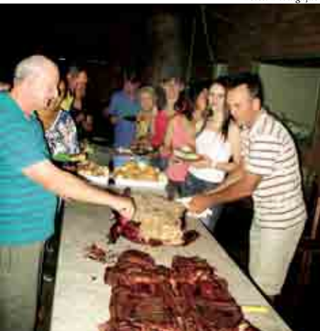
Linha Salette: Participantes degustaram com suas famílias os pratos a base de carne suína