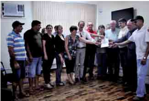
Associação Comunitária Novo Bairro conseguiu a liberação de R$ 60 mil