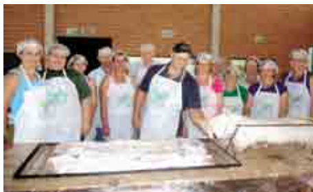
Linha Saudades: Os pratos foram preparados pelos participantes dos cursos