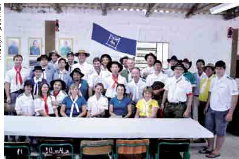
Grupo que participou da Cavalgada da Integração