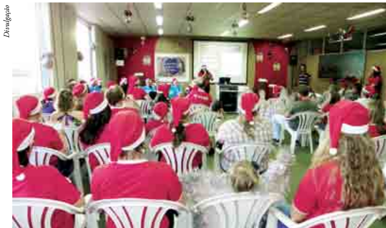
Público prestigiou o lançamento da programação do Natal

A abertura foi feita pelos alunos de violão da Casa da Cultura, que cantaram diversas músicas natalinas. Posteriormente a secretária de Assistência Social e coordenadora do Natal Mágico, Luciana Heidt, fez a apresentação da programação. Em seguida foi realizada a entrega de dois violões que foram doados a Casa da Cultura pelo deputado estadual Maurício Eskudlark.