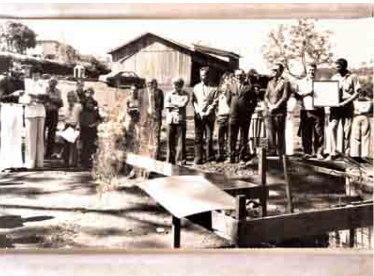
Museu Padre Fernando Nogueira