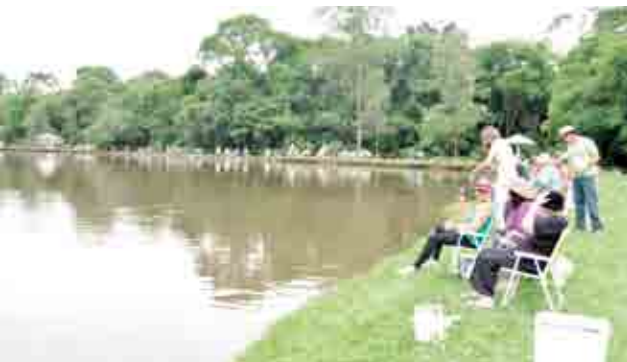
Muitas famílias se reuniram para pescar