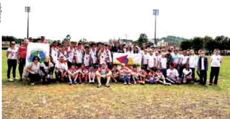
Os jogos aconteceram no Estádio Municipal Osvaldo Werner

No naipe feminino a equipe da escola Nossa Senhora da Salette sagrou-se campeã e no naipe masculino o Centro Educacional Raymundo Veit, as duas equipes representarão o município nos jogos do Moleque Bom de Bola.