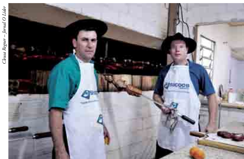
Churrasco foi servido aos cavaleiros