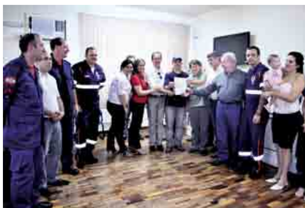
SAMU terá uma ambulância nova