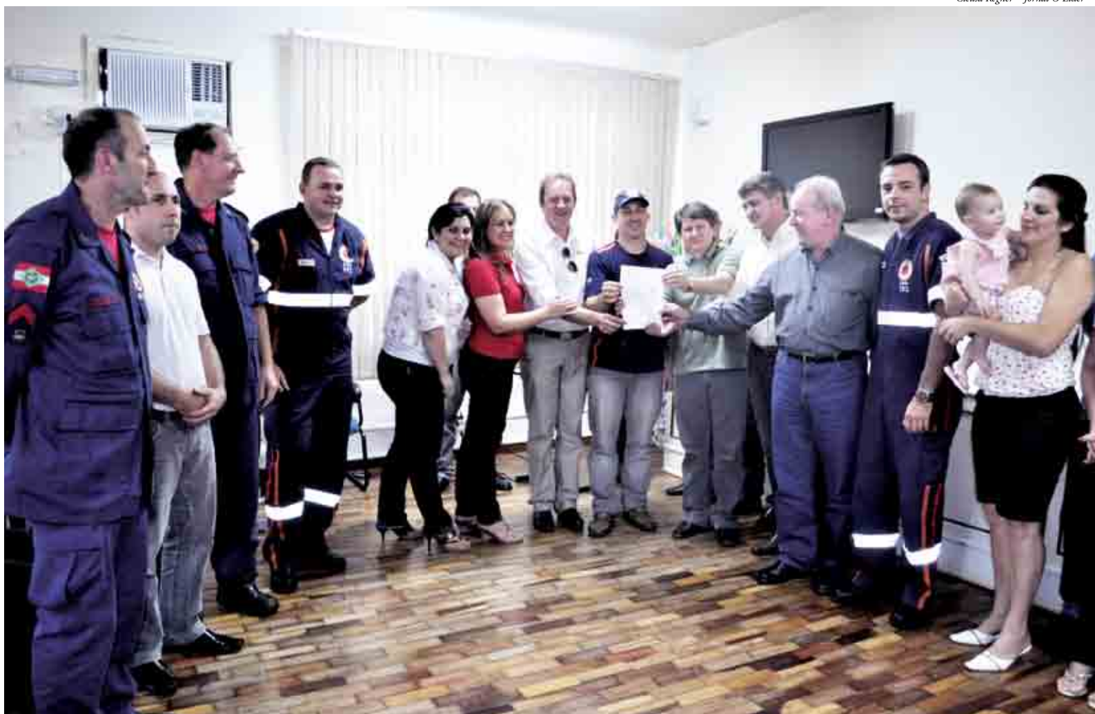
SAMU de Maravilha receberá uma ambulância nova para substituir o veículo de socorro que se encontra em péssimas condições