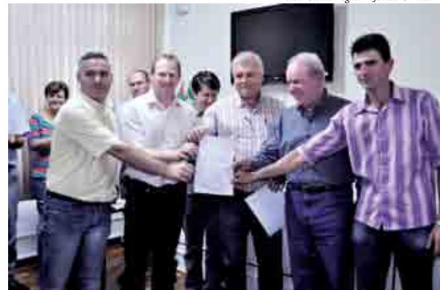
Bom Jesus do Oeste recebeu documentos para destinação de R$ 80 mil para o transporte escolar e outros R$ 80 mil para adquirir um veículo para o transporte de pacientes