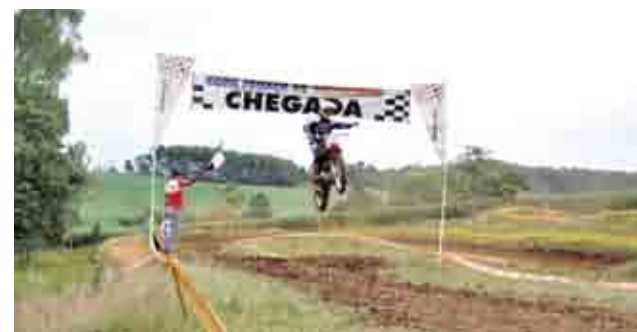
Primon fez várias manobras