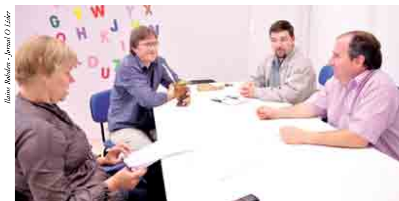
Comissão esteve reunida na manhã de terça-feira (22) para defenir últimos detalhes da Caminhada das Lanternas e Natal Maravilha

os colaboradores que ajudaram, e muito, neste evento”, frisaram os organizadores.