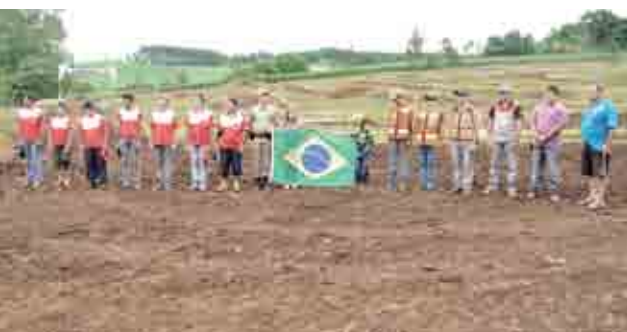
Abertura das competições, no domingo (20) à tarde