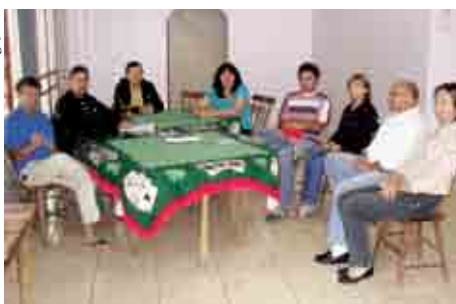
Comissão Central Organizadora definiu últimos detalhes do encontro organizadores. "É um dia para rever colegas e confraternizar com as famílias", destaca.