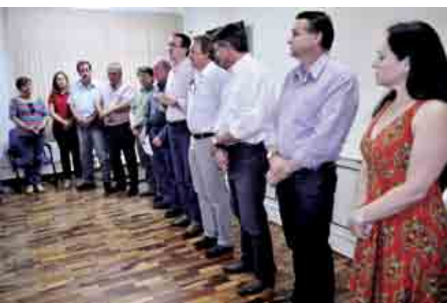
Autoridades presenciaram os convênios e subvenções assinados