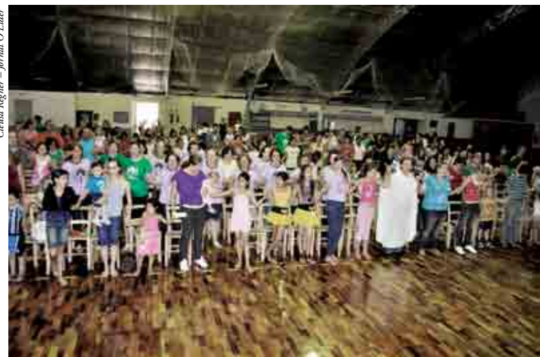
Vários bairros participaram da integração