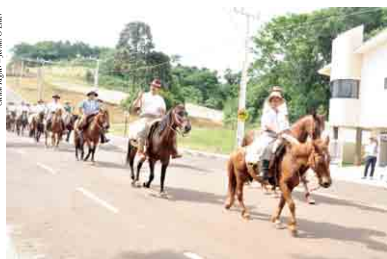
Tradição também é repassada às crianças