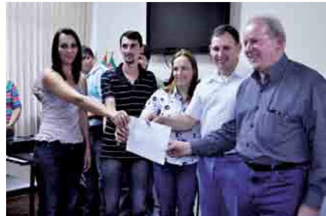
Sul Brasil teve liberação de R$ 12 mil para o Clube de Mães Uma Rosa em Forma de Amor