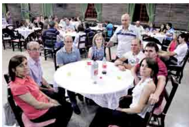
Empresários e representantes prestigiaram o jantar