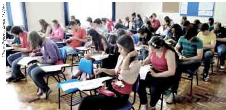
Salas lotadas para a realização do Vestibular Nacional