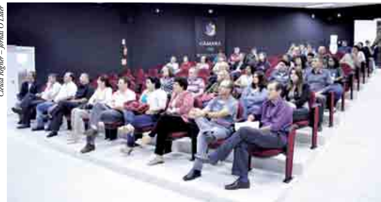
População e autoridades participaram da audiência

Agora, a emenda deverá ser enviada por sedex à Comissão de Orçamento, com data de postagem até o dia 10 de dezembro. Não há garantia de execução, pois elas se inscrevem entre as despesas discricionárias – que podem ou não ser executadas pelo Executivo.