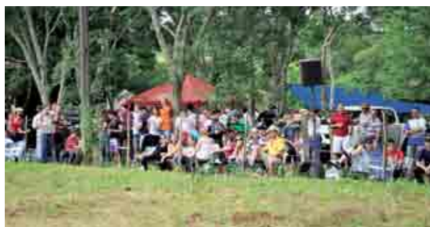
Evento contou com a presença de grande público