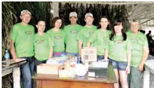
Parte dos organizadores do evento