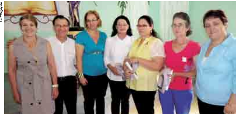
Voluntárias foram agraciadas com certificado e camiseta