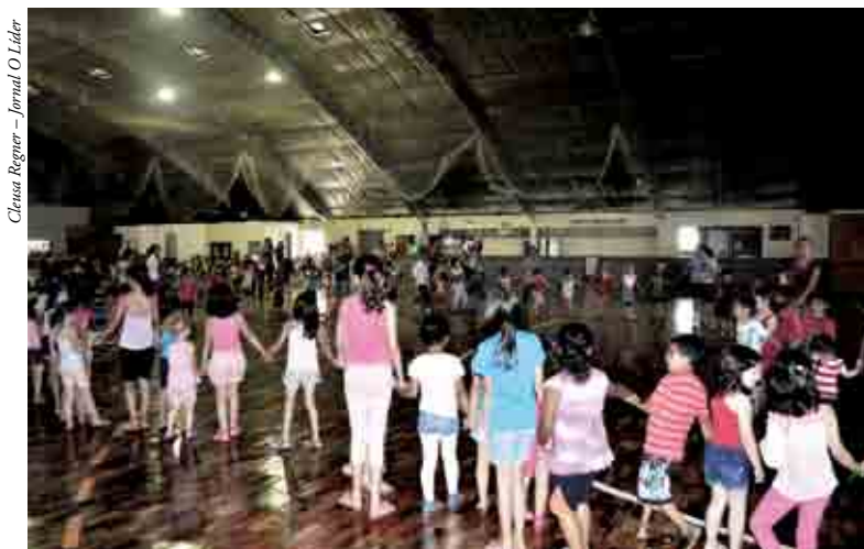
Atividades foram realizadas com as crianças