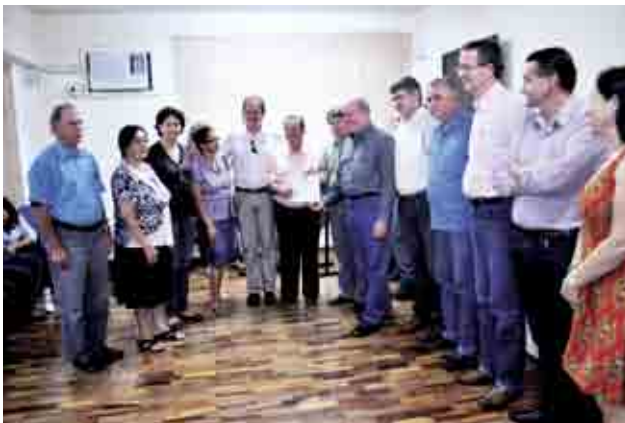
Grupo de Idosos Unidos para Maravilha Crescer recebeu R$ 13 mil