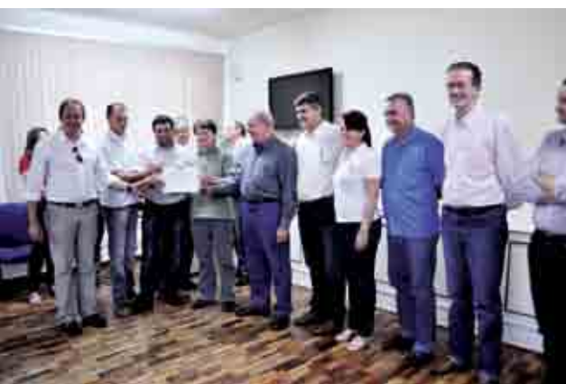
Para o CTG Juca Ruivo foram destinados R$ 4 mil