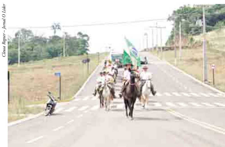
Cavalgada retornou a Maravilha pela Rua Duque de Caxias