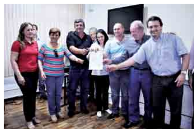
Serra Alta obteve a confirmação da liberação de ambulância para o transporte de pacientes