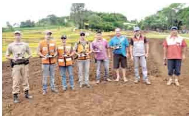
Bombeiros e Polícia Militar receberam homenagem pela colaboração no Motocross