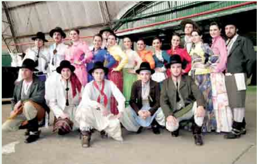
Invernada adulta obteve o 3º lugar