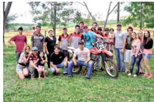
Equipe organizadora do evento