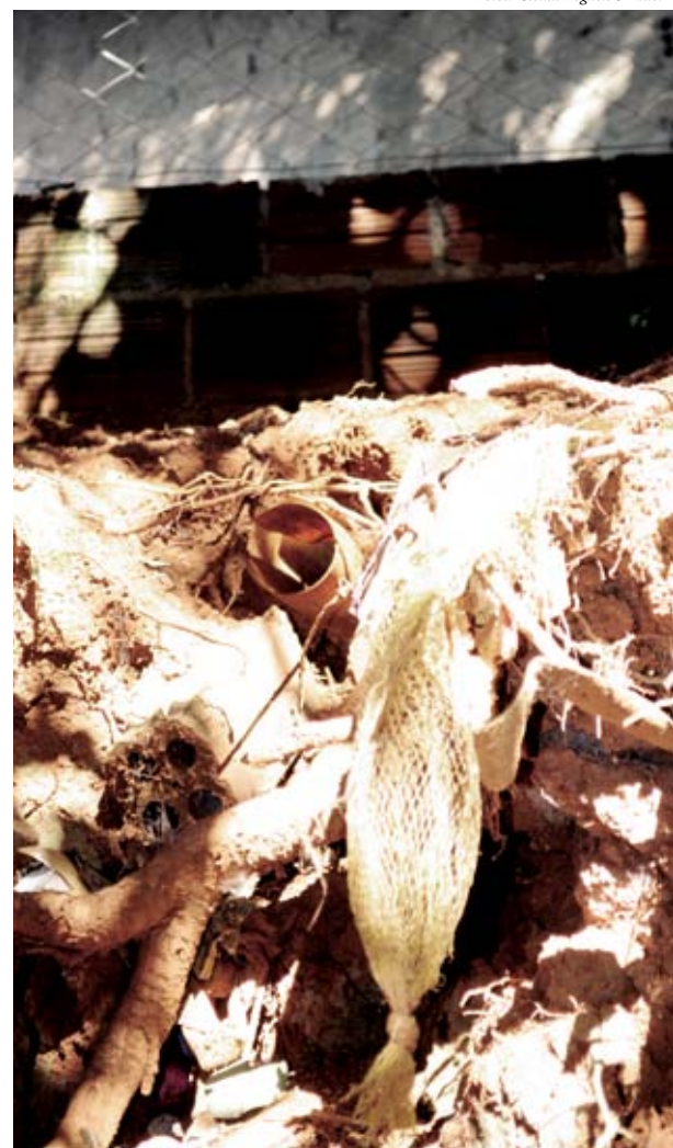
Canos que desembocam esgotos foram encontrados no rio