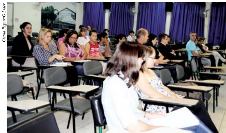
JCI e pessoas ligadas à educação de Maravilha participaram do lançamento