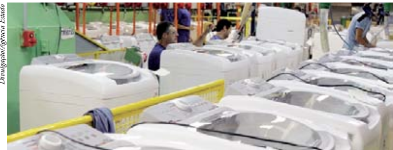
IPI menor da linha branca deverá ser prorrogado

Para fogões, a alíquota, que era de 4%, foi zerada. Para as geladeiras, o percentual foi reduzido de 15% para 5% e, para as máquinas de lavar, de 20% para 10%. A alíquota sobre tanquinhos também foi zerada (era de 10%). A desoneração da linha branca já havia sido feita em abril de 2009. Na época, a medida também foi prorrogada.