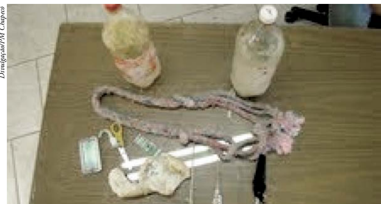
Produtos apreendidos em Operação no Presídio Regional de Chapecó

de um pão, um estilete feito de lâmina de barbear e palito de picolé, quatro litros de cachaça artesanal (conhecida como Maria louca), cinco matrizes para fazer cartas de baralho, uma lâmina feita com espelho de tomada e um espelho adaptado para monitorar os agentes penitenciários.