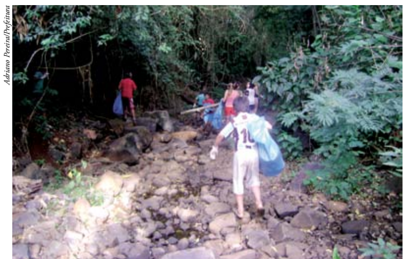
Crianças e jovens ajudaram a fazer a limpeza do rio em Flor do Sertão

Em Iraceminha, foi percorrido, aproximadamente, um quilômetro de extensão do rio no trajeto acima do ponto de captação da água