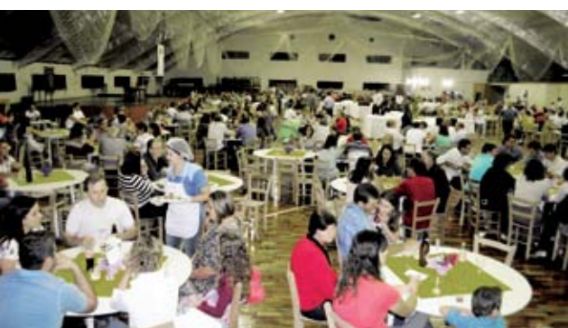
Grande número de pessoas participaram do jantar