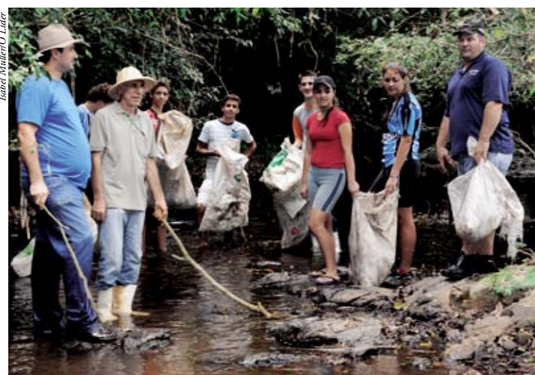
Grande foi o número de colaboradores na limpeza