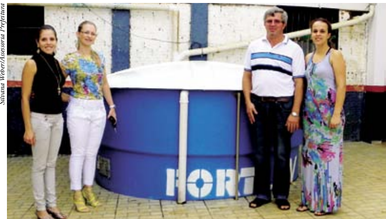
Caixas de água foram instaladas na escola

De acordo com a prefeita Luzia, mais melhorias estão previstas para o educandário oferecendo segurança e conforto. Recentemente foram climatizadas todas as salas de aula das escolas do município.