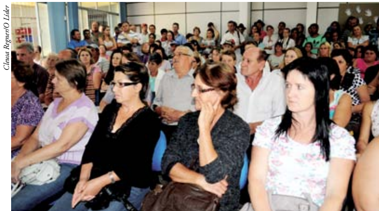
153 ressonâncias foram entregues