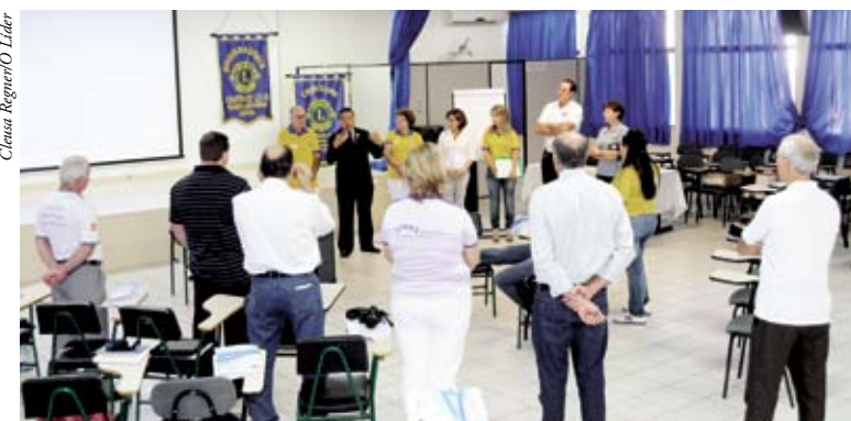
Leões da região do LD8 receberam capacitação

No Brasil, são 1800 clubes com 42 mil associados. “O Lions, desde 1917, tem os propósitos. Eles são generalistas, mas não podemos discutir dentro do clube duas coisas: