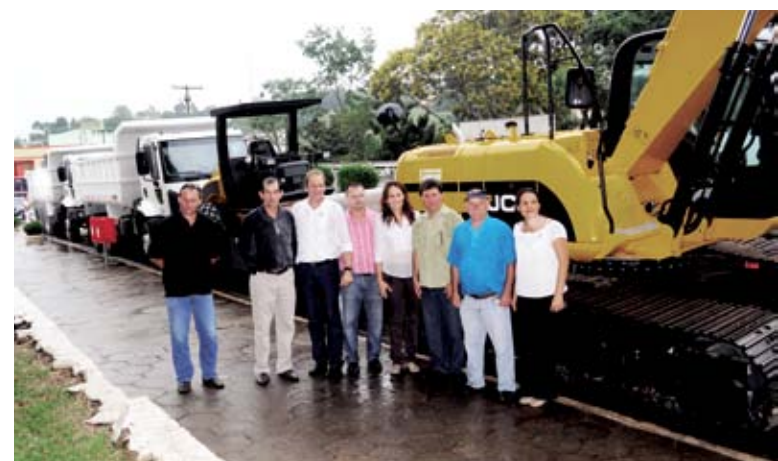
Equipamentos poderão contribuir com a melhoria das estradas

não foi conseguido antes porque a Administração passada havia deixado dívidas com o INSS. “E, o empréstimo foi conseguido agora. Claro que se sabe que a gestão que assumir no outro mandato vai assumir parte dessa