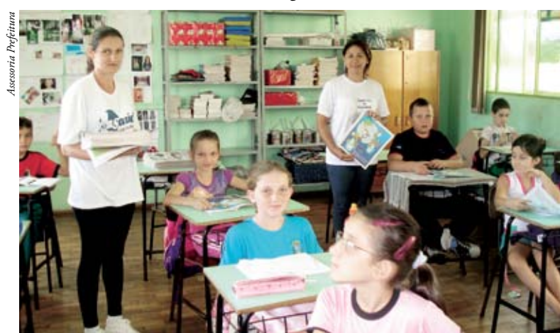
Materiais sócioeducativos foram entregues nas salas de aula

cerias tornaram possível a execução de uma atividade complexa. “Uma atividade dessas não poderia ser executada por apenas um grupo de pessoas. É necessário movimentar esse grande número de interessados em melhorar o meio em que vivemos. Cada um fazendo uma pequena contribuição resultou em um trabalho muito bem elaborado que providenciará o surgimento de ações positivas”, comenta.