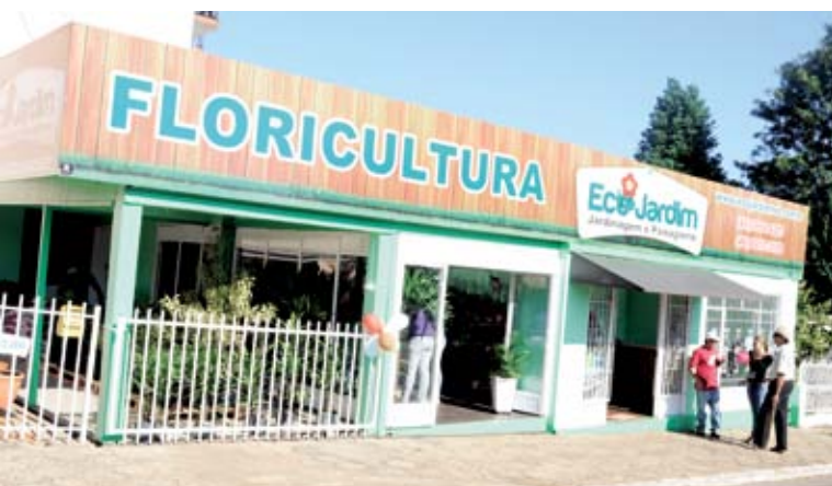
Empresa está localizada na Rua José Bonifácio