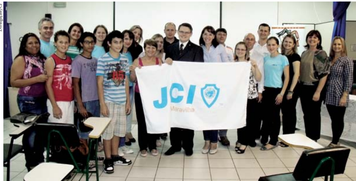
Companheiros da JCI Maravilha com professores e autoridades