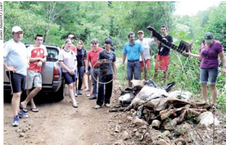
Materiais recolhidos por moradores