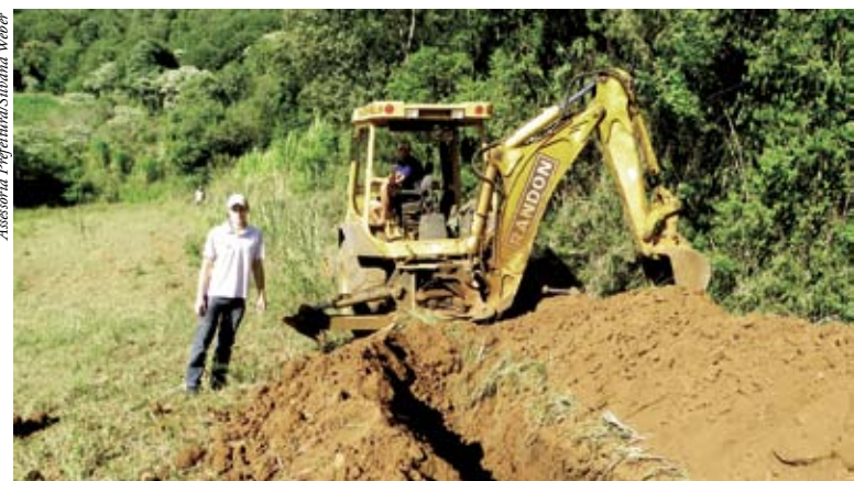
Valas foram abertas na Linha Araçazinho