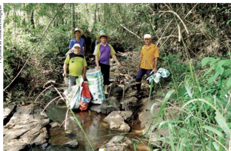
Em Modelo, ação também foi desenvolvida