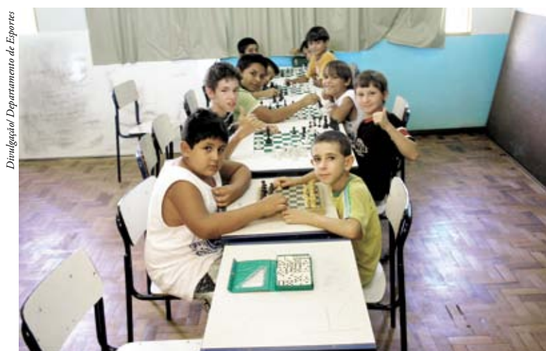
Aulas são realizadas sempre nas quartas-feiras