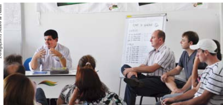
Roteiro também aconteceu em Maravilha