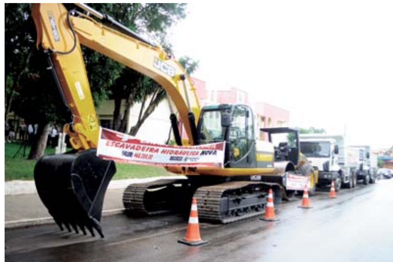
Quatro máquinas foram financiadas pelo Badesc

De acordo com ele, na atual gestão já foram investidos R$