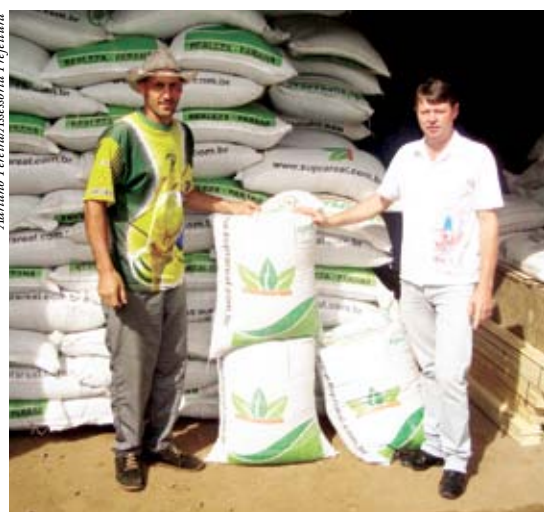
A entrega das sementes ocorre até o dia 20 de abril

A entrega das sementes ocorrerá até o dia 20 de abril e estima-se que serão beneficiados cerca de 250 produtores com bloco rural ativo.