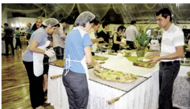
Cardápio variado foi servido aos presentes