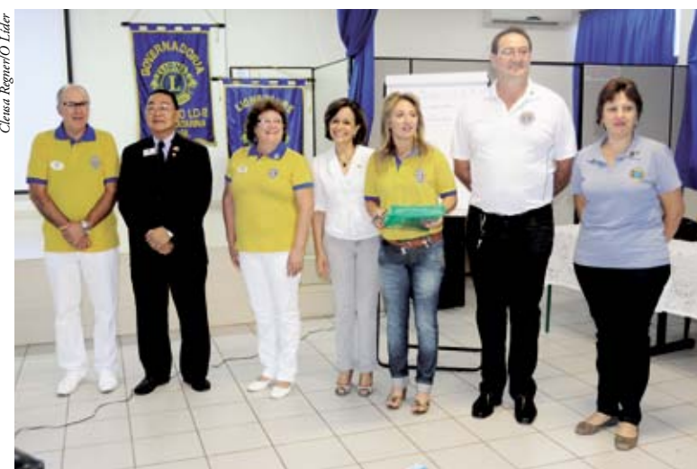
Representantes dos Lions e o governador Toshihiro Ida fizeram a abertura do evento

O Lions Clube Internacional funciona em 206 países, com 1,5 milhões de associados. “Nós pertencemos a Área 3. O mundo, para efeito de administração, está dividido em sete partes. No Brasil, somos em quatro consultores de extensão. Eu capacito os três Estados do Sul e resido em Curitiba”, comenta Toshihiro.