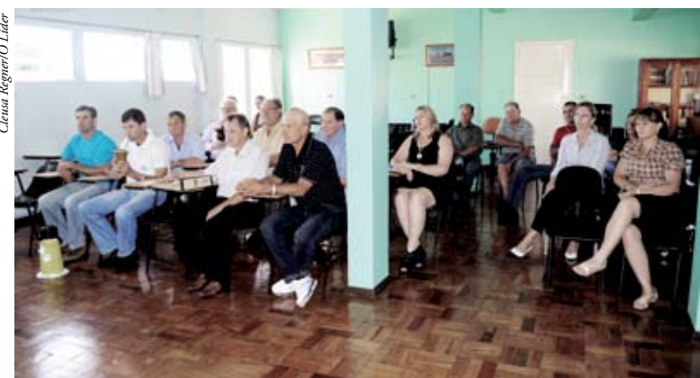
Assembleia reuniu sócios e convidados

ao exercício de 2011 e relatório de atividades. Também foram tratados assuntos de interesse geral. A Assembleia acontece todo ano, no mês de março.