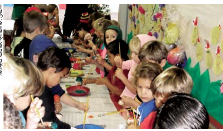
Crianças se divertirão pintando casquinhas

Com o objetivo de resgatar o encanto da Páscoa, as professoras do CEI Criança Sorriso desenvolveram a pintura das casquinhas com a participação dos alunos do turno matutino. Para as professoras, foi gratificante ver a atenção, concentração e alegria das crianças ao fazer a atividade. Durante a semana da Páscoa também será enfeitado cartuchos, máscaras de coelhos e trabalhado com vários cantos, painéis e livros.