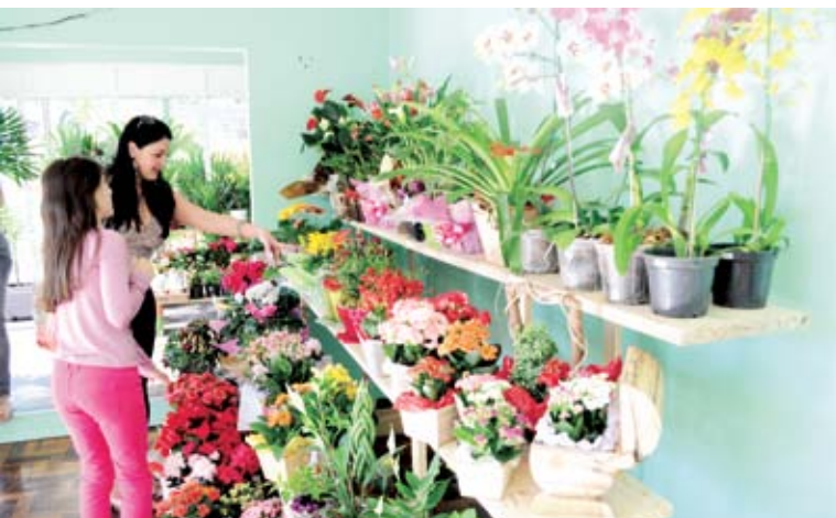
Clientes agora poderão escolher suas flores na empresa

A empresa está localizada na Rua José Bonifácio, 309, esquina com a Avenida Sete de Setembro, no Centro da cidade. “Já tínhamos os serviços de jardinagem. Mas agora com a empresa vamos oferecer mais seriedade e praticidade ao nosso cliente”, salientam os sócios.