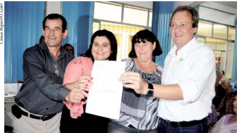
Equipe da Prefeitura fez a entrega das ressonâncias

ressaltou que recebeu um prêmio no 49º Simpósio Brasileiro dos Estados de Santa Catarina e Paraná, que aconteceu nos dias 23 e 24 em Florianópolis. A medalha Im-