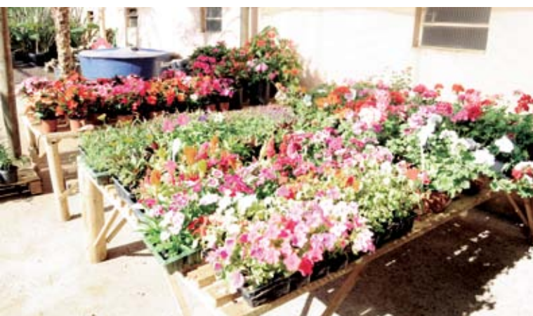
Flores para ambientes externos também podem ser encontradas na Eco Jardim