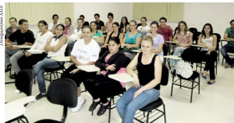
Estudantes juntam a teoria e a prática para obterem maior conhecimento

Na visão dos professores e da Coordenação, as atividades paralelas oferecidas aos alunos complementam a formação destes profissionais, para que possam exercer suas atividades da melhor forma e atender as necessidades do mercado de trabalho.