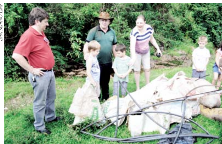
Em São Miguel da Boa Vista, população se mobilizou para fazer a limpeza