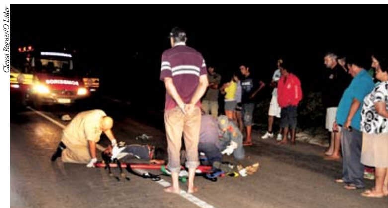
Pedestre atropelado na BR 282 ficou gravemente ferido

De acordo com a PRF, o condutor da moto foi ofuscado por outro veículo, o que dificultou a visão do pedestre sobre a pista.