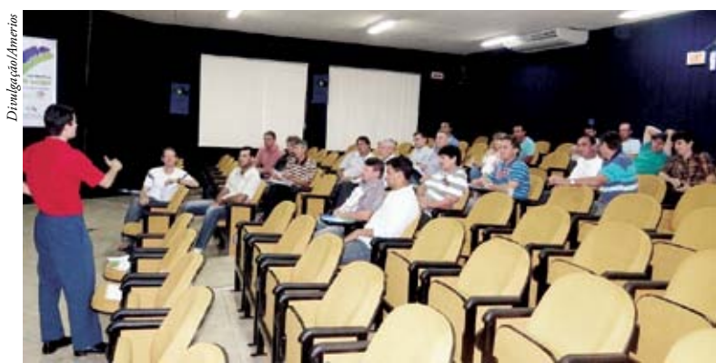
Secretários de Agricultura debateram sobre a estiagem