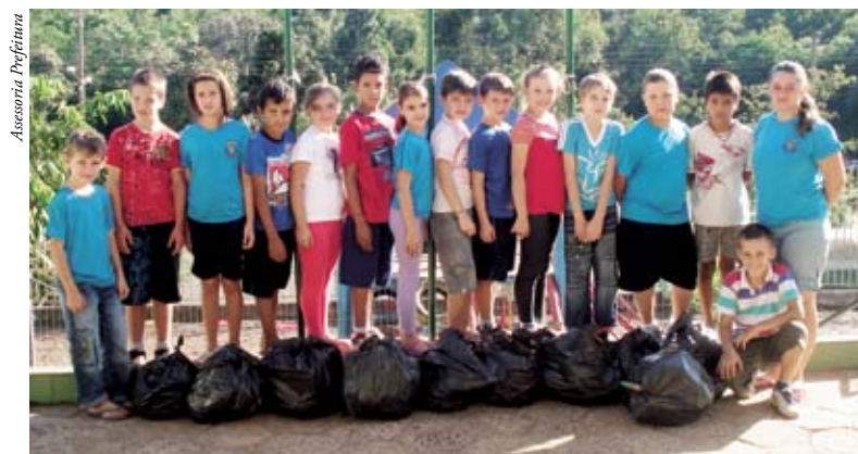
Crianças auxiliaram na coleta de lixo na cidade e nas margens do Rio Sarandi