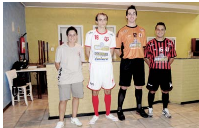
Novos uniformes já estão sendo usados