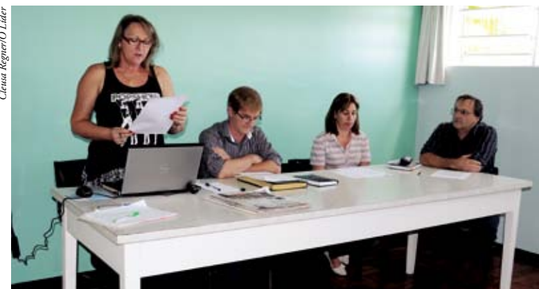
Prestação de contas do exercício 2011 foi apresentada