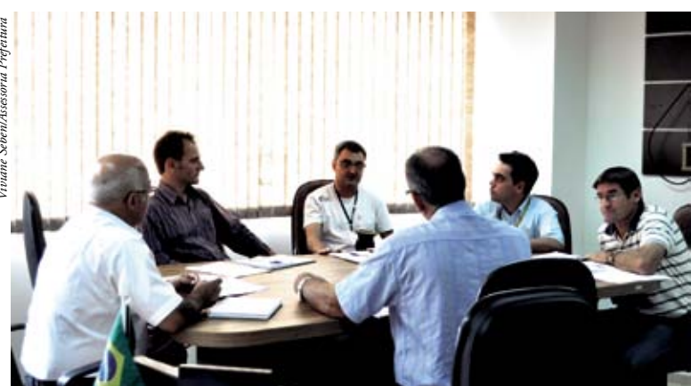
Lideranças devem se reunir amanhã (29) para definir demais ações

A equipe deve se reunir amanhã (29) para definir as ações que visam estabelecer metas e prazos, além da montagem do projeto que tem data de início, mas não tem prazo final já que os objetivos precisam ser alcançados com apoio de todos os colaboradores.