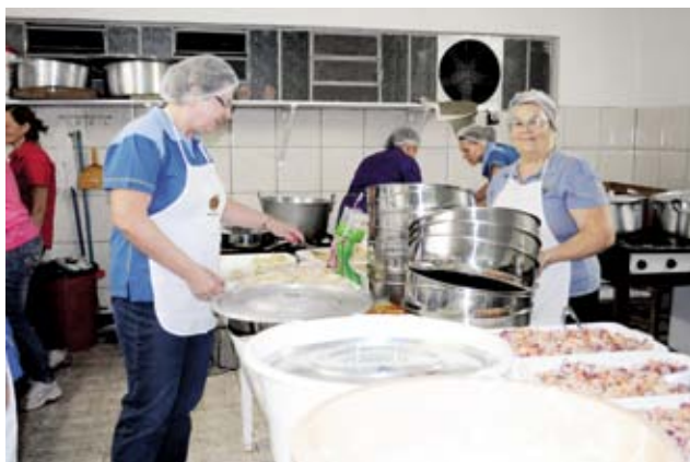
Integrantes do Lions ajudaram na produção dos alimentos na cozinha

as participaram do evento. “O jantar superou as expectativas. Foi um dos melhores dos últimos anos. E, a gente agradece a comunidade, que sempre participa dos eventos do Lions. As pessoas sabem que o clube sempre trabalha em benefício da população. Foi um sucesso porque a comunidade quis assim”, ressalta a presidente.