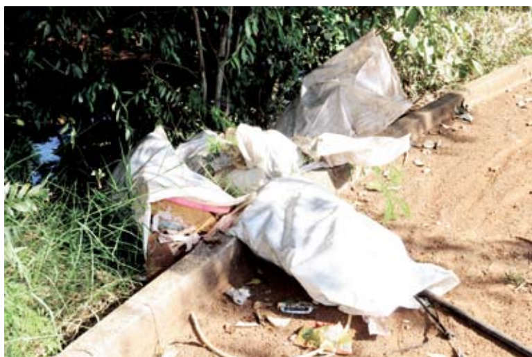
Grande quantidade de lixo foi encontrada em um pequeno trecho