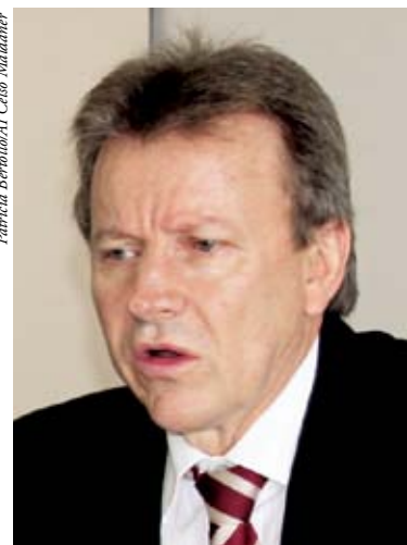
Deputado federal Celso Maldaner (PMDB/SC)

Maldaner é autor de uma das propostas que tramitam na Câmara para delegar ao Congresso as análises das demarcações. Para ele, as propostas visam acabar com a situação de insegurança jurídica que cerca o produtor rural. De acordo com o parlamentar, há hoje no país 74 propostas de