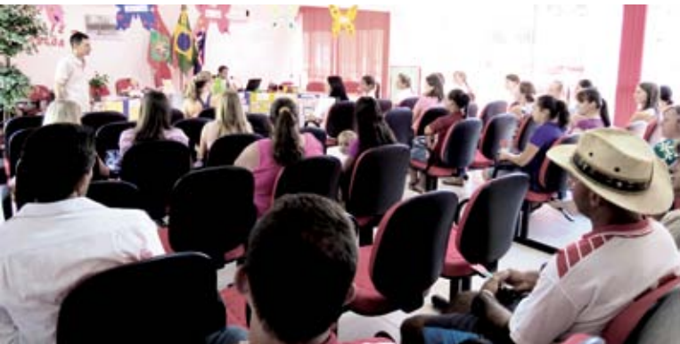
Pais e professores participaram da assembleia geral do educandário