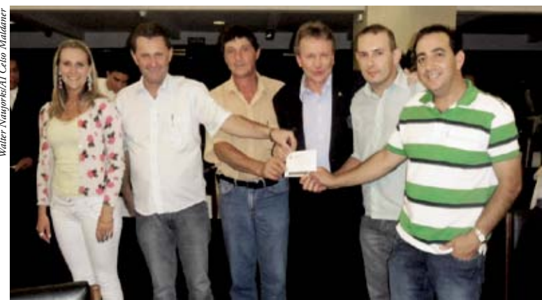
Informação foi recebida pelas lideranças de Bom Jesus do Oeste

Para ter acesso aos recursos, o município já está tomando as providências necessárias para garantir o empenho dos recursos e viabilizar a obra. A construção terá a