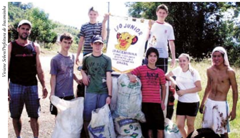
Em Iraceminha, jovens contribuíram com a limpeza

Em Tigrinhos, a Administração Municipal com as redes Municipal e Estadual de Ensino realizaram a